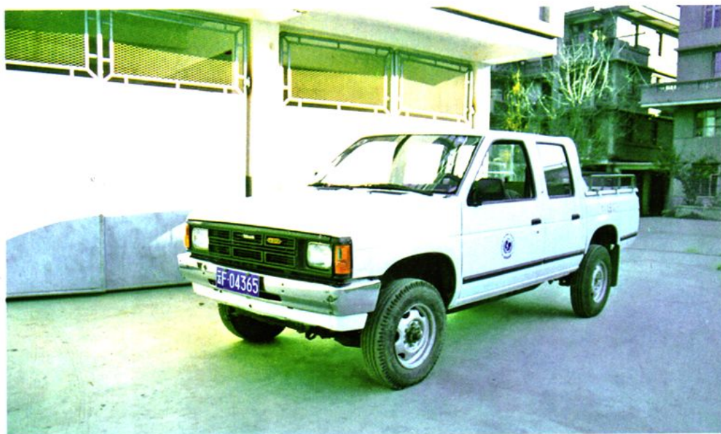
联合国儿童基金会，人口基金会无偿援助新平县的日产尼桑皮卡客货两用车。