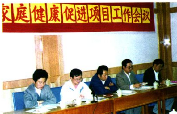
1997年3月19日县人大、县政府领导参加社区及家庭健康促进项目工作会议。