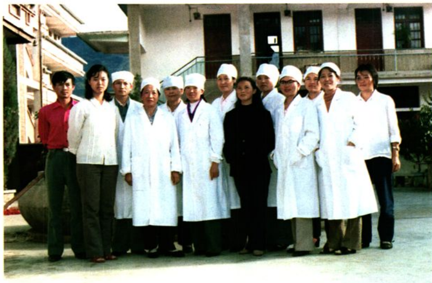
1989年新平县 妇幼站职工合影。