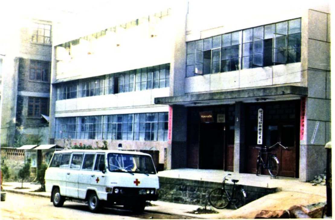
图为1981年建成的县妇幼站门诊住院综合楼。