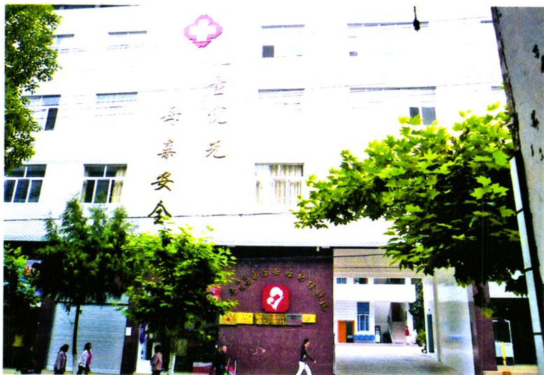
图为县妇幼保健院2006年新建成的门诊住院综合楼。