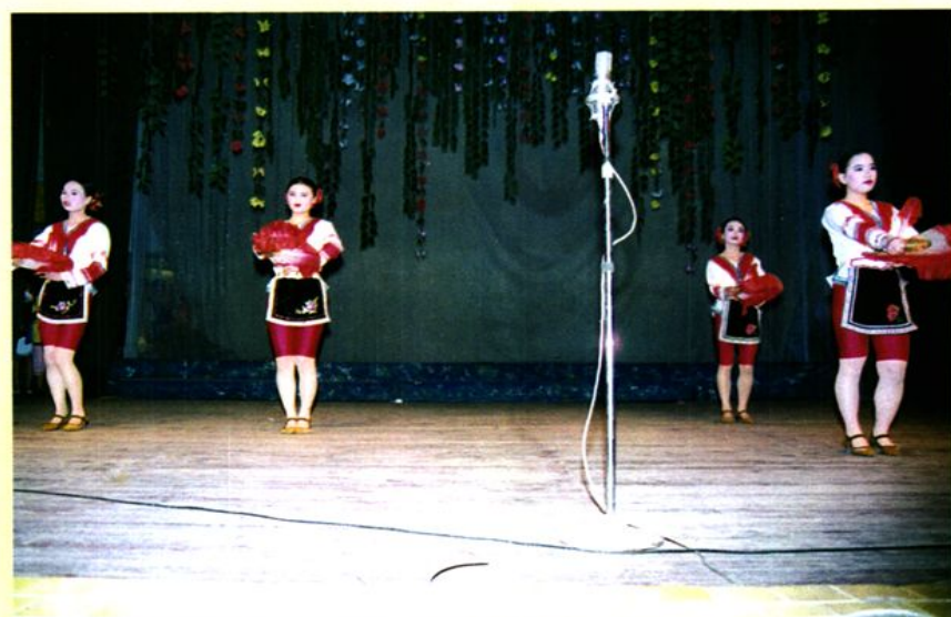
新平县妇幼 保健院职工开展 丰富多彩的业余 文艺活动。