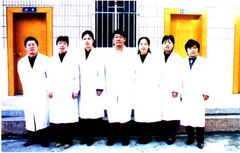
2005年新平县 妇幼保健院院科领 导成员合影。