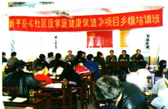
县人大、县政协、地区妇幼保健所领导在社区及家庭健康促进项目培训班作动员报告。

1998年11月 新平县召开省、市、县领导参加的“生殖健康/计划生育”项目工作会议。图左起市计划生育委员会主任白仲华、县委书记范亚辉、省计划生育委员会副主任冯立学。