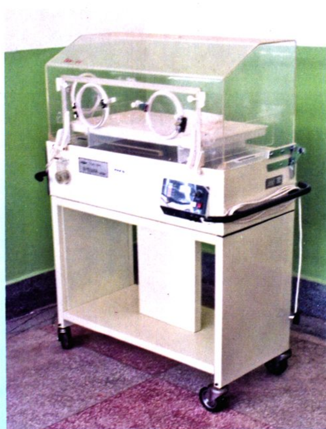
国家项目办公室配发项目县的医疗保健器械设备。