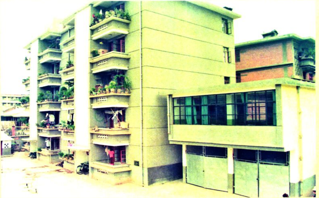
图为1991年建成的县妇幼站职工宿舍楼。