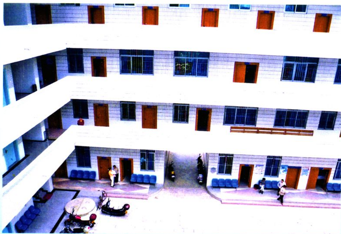
图为1998年建成的县妇幼保健院门诊住院综合楼。