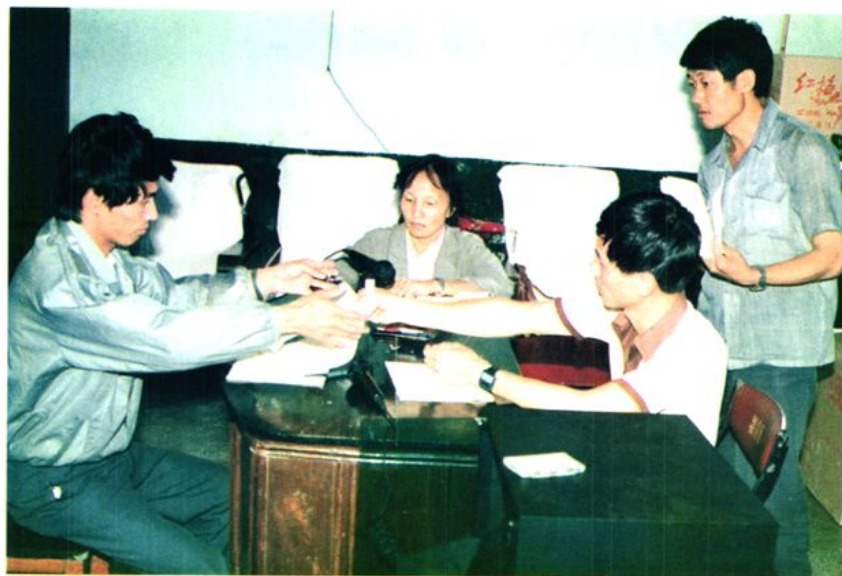
1991年4月12日 召开妇幼卫生项目例会。 各乡（镇）政府领导与 县人民政府签订妇幼卫生 项目工作责任承诺书。