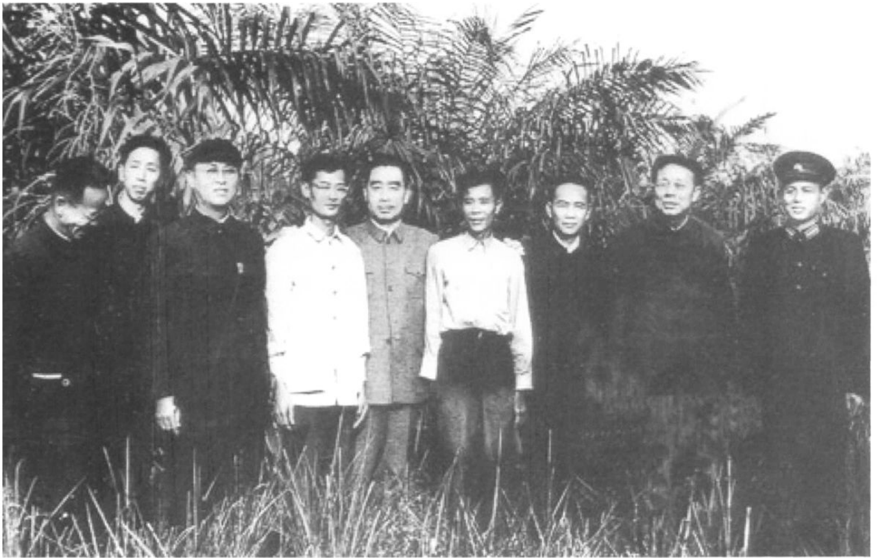
1960年3月,国务院总理周恩来(中)视察南滨农场,与场长林特秀(右四)等农场干部技术人员与在油棕园合影留念。