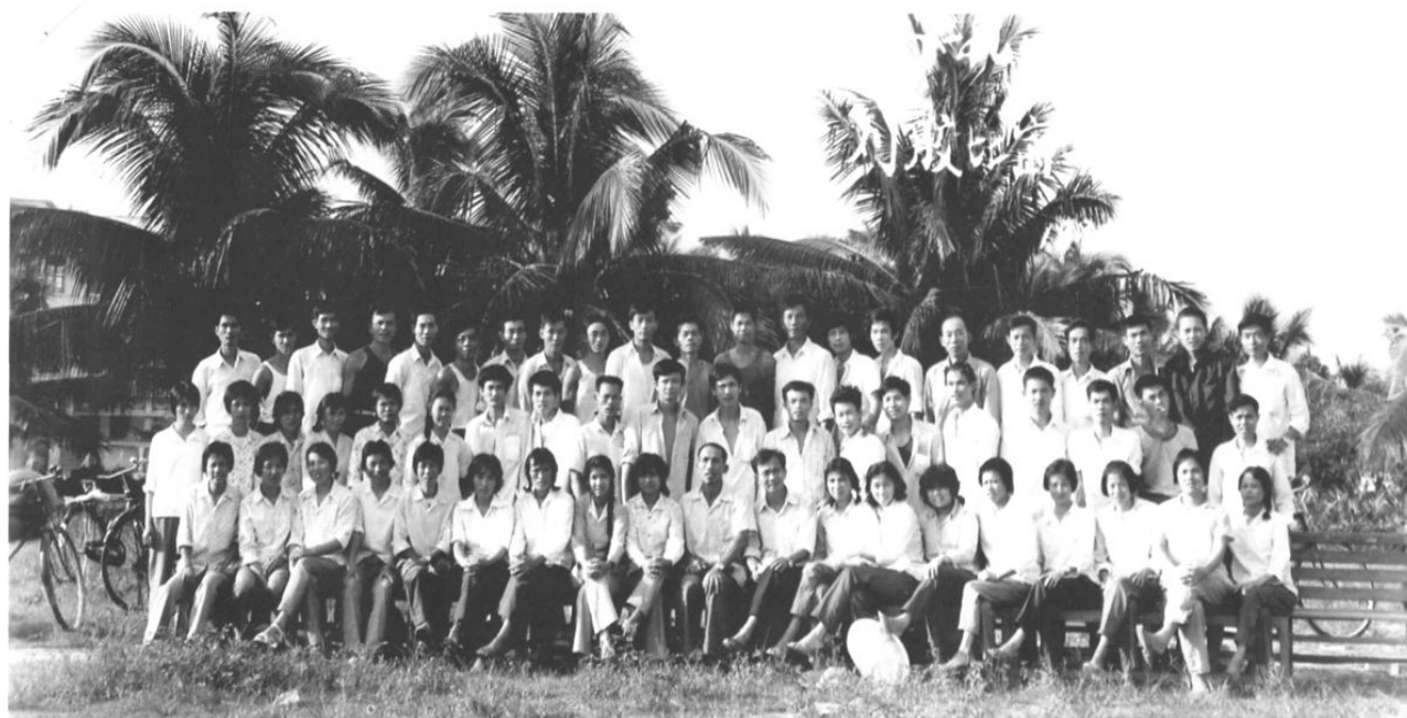
1983年度割胶比赛选手合影(1983年3月20日)