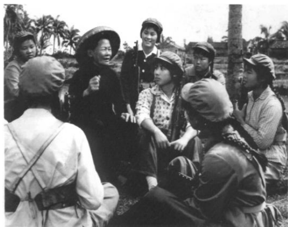
七十年代,十三团女战士听海南革命根据地老战士讲革命故事。