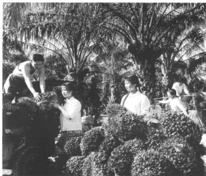
1978年,南滨农场知青收获油棕果