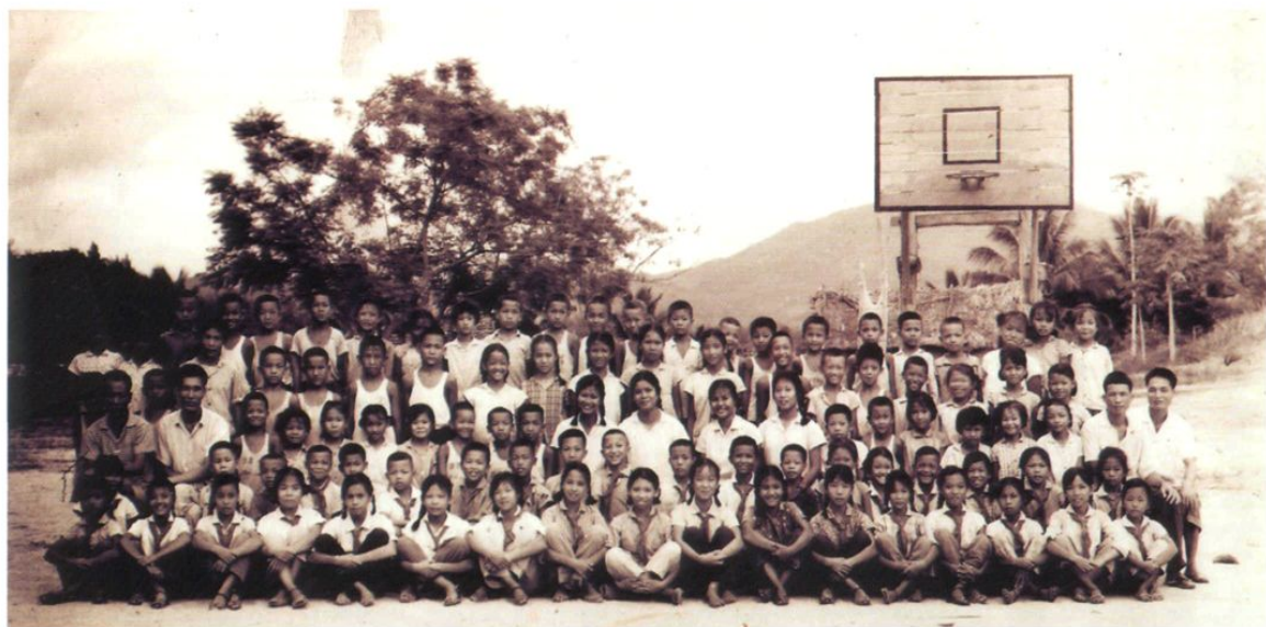
1973年6月30日，兵团三师十三团十连小学全体师生合影