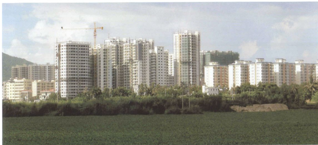
南滨农场小城镇一角(2011年)