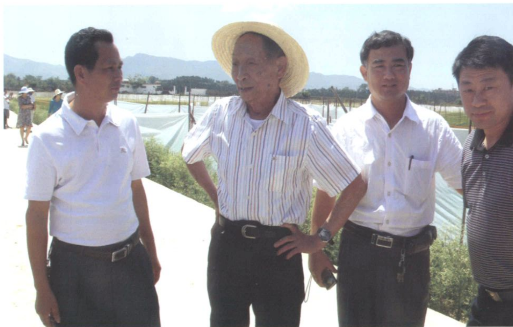
2011年4月，被誉为“杂交水稻之父”的中国水稻专家、中国工程院院士袁隆平（右三）在南滨种子基地调研和指导。