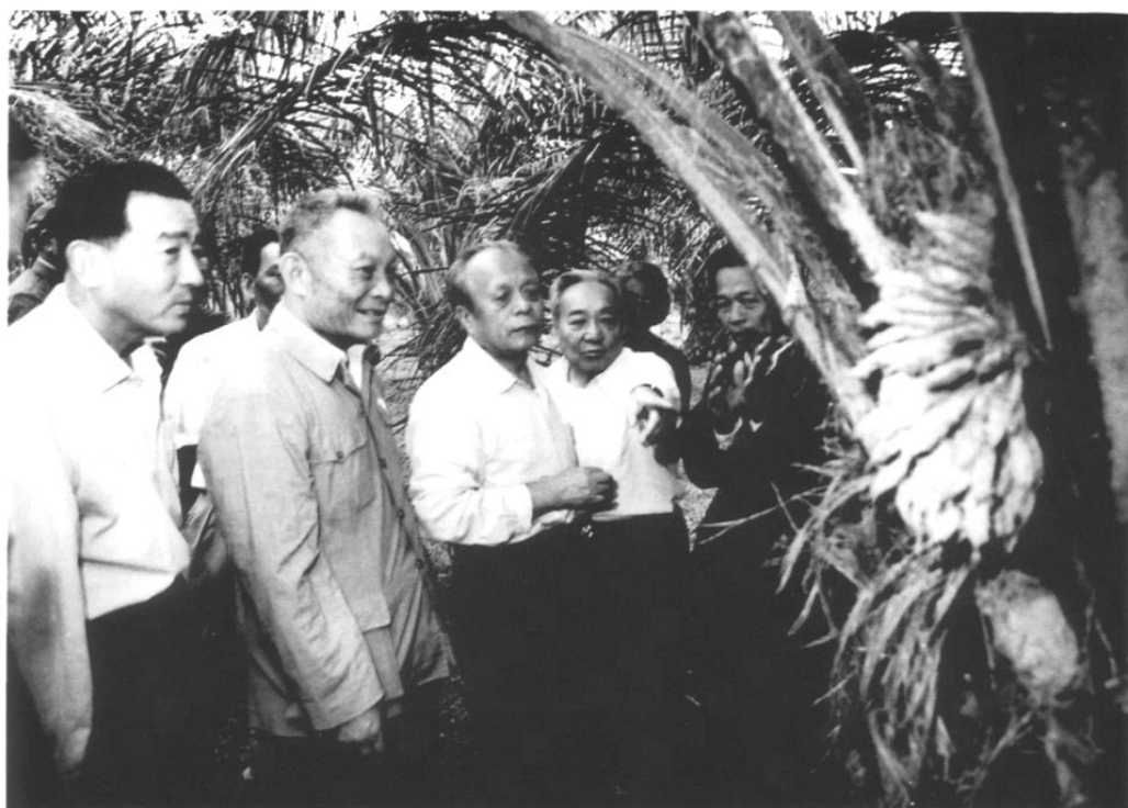
1983年1月19日,中共广东省委书记任仲夷(左三)、省长刘田夫(左四)在中共海南区委书记罗天(左二)的陪同下视察南滨农场油棕生产情况。