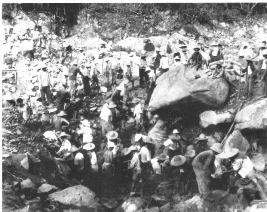
1976年,南滨农场建设南雅水电站工地