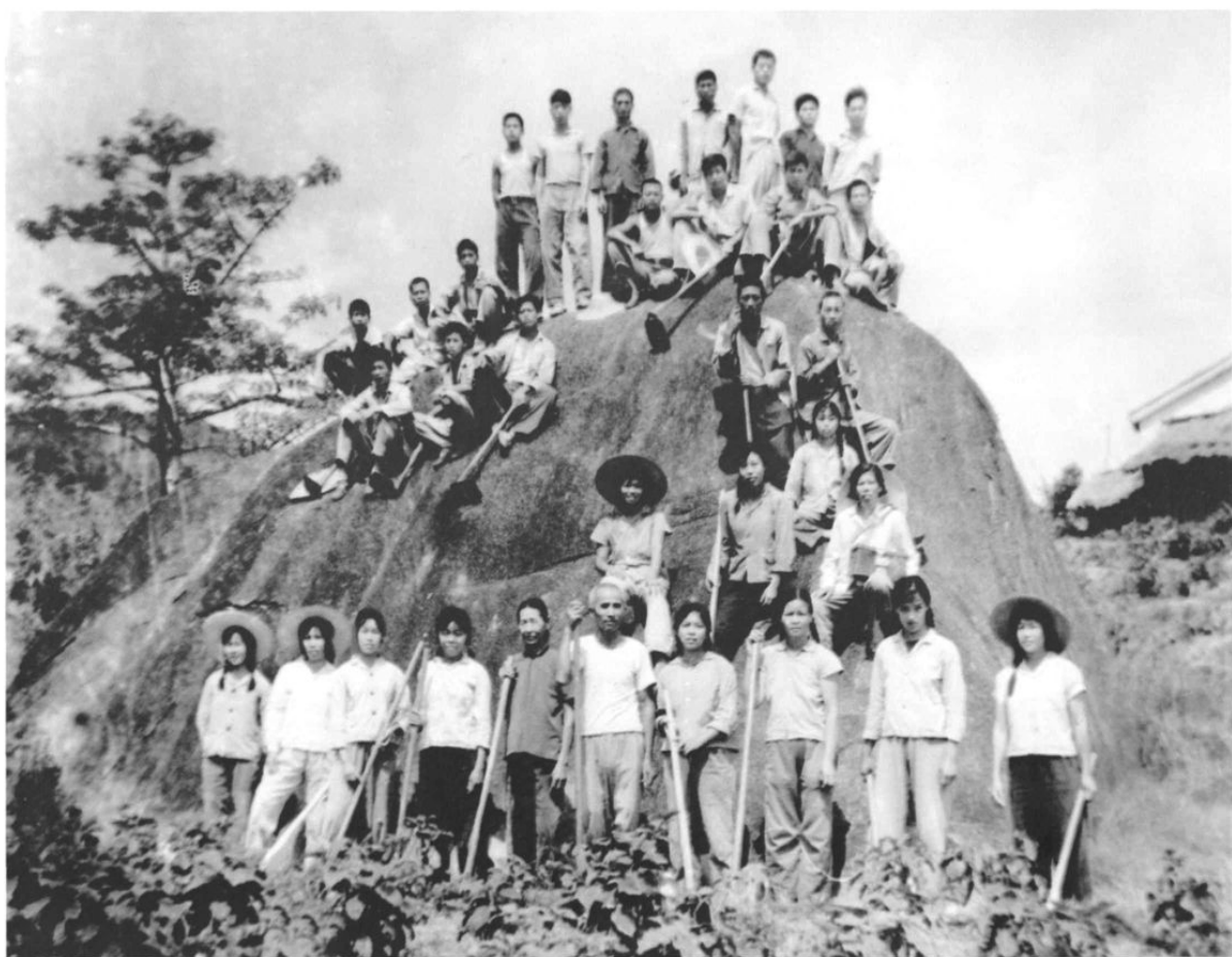
七十年代,南滨农场小熟岭(即南风队)的知青和老职工