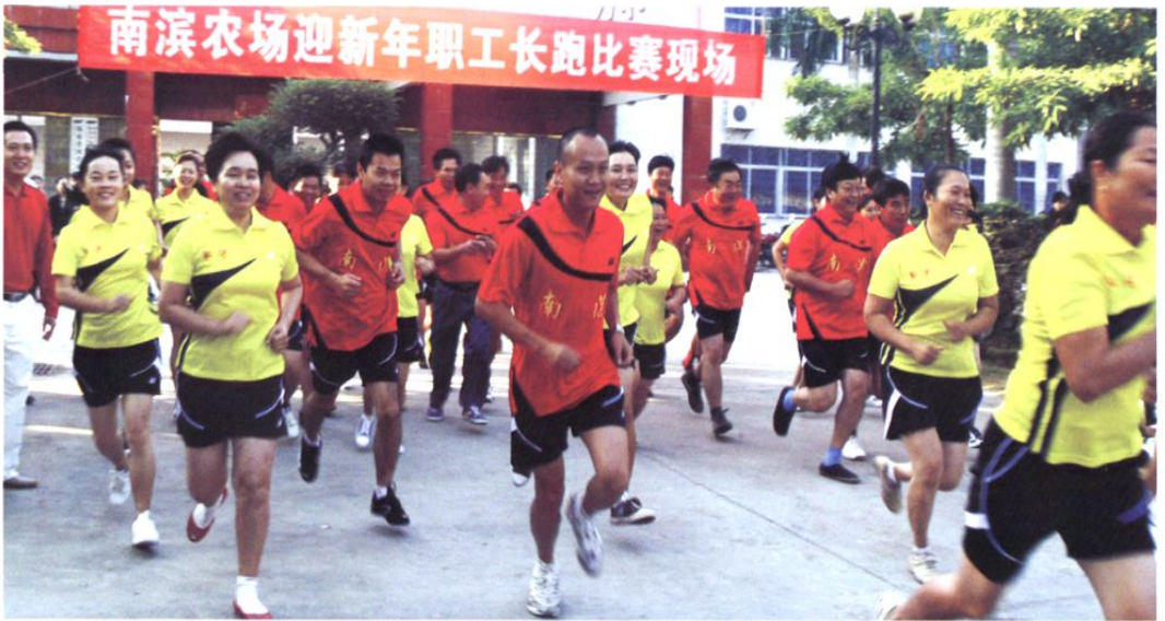
2011年1月，南滨农场迎新年职工长跑比赛