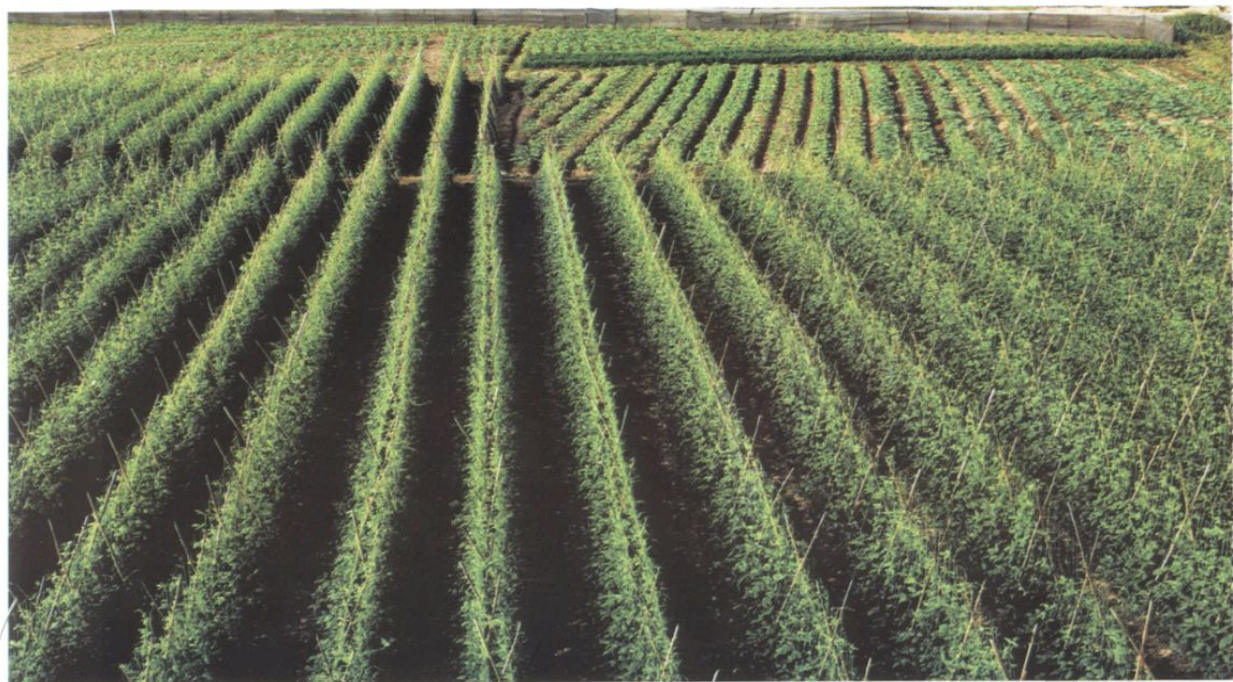
南滨农场瓜菜基地