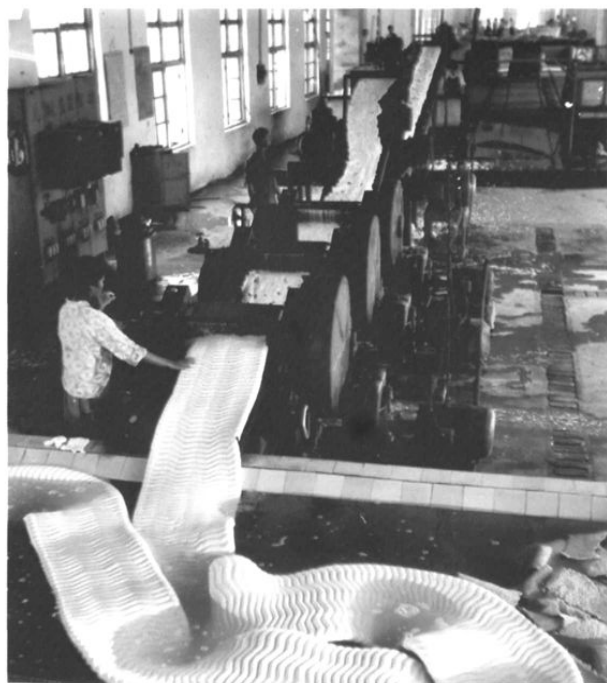
南滨农场橡胶加工厂乳胶生产线(70年代末)