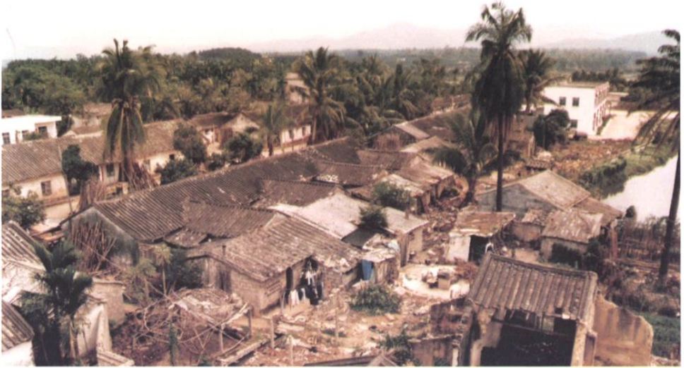
1998年南滨农场胜利队旧貌