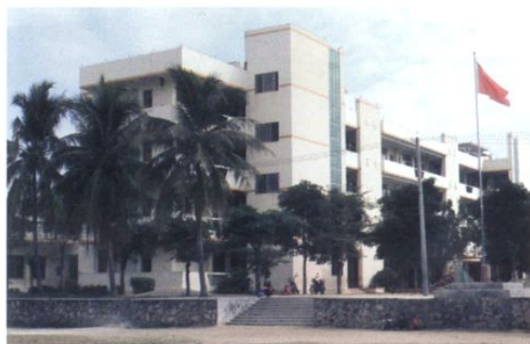
南滨农场中心小学一角