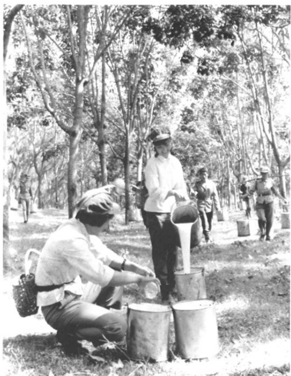
十三团九连战士收胶归来(70年代)