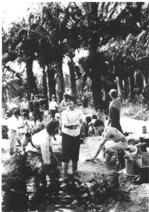
1973年,十三团战士收胶归来。