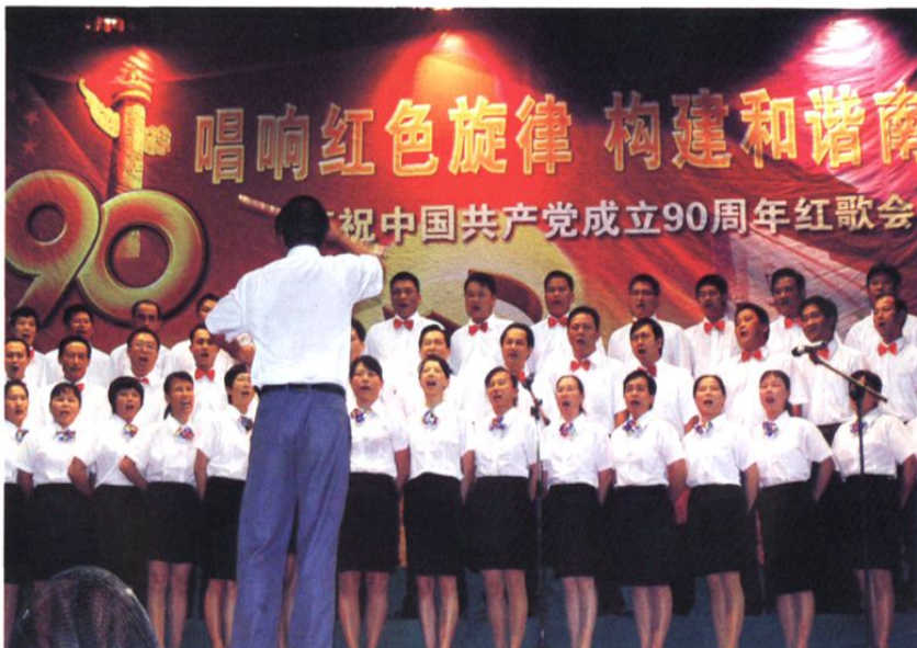
2011年7月1日，南滨农场庆祝建党90周年红歌会