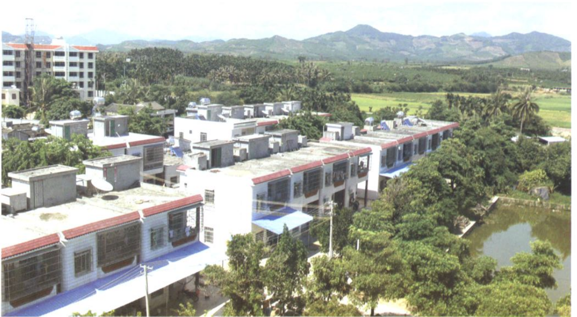
2011年南滨农场胜利队职工住宅