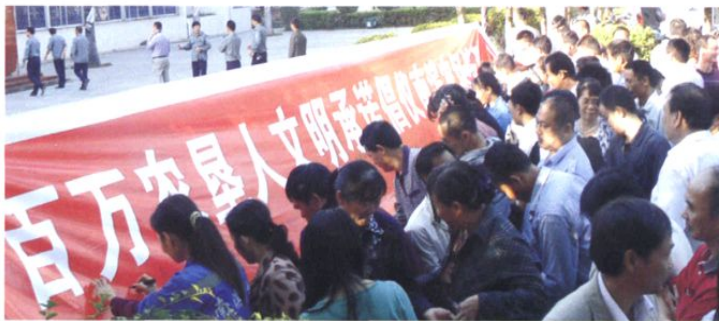
2012年1月，南滨农场“文明大行动”万人签名活动现场