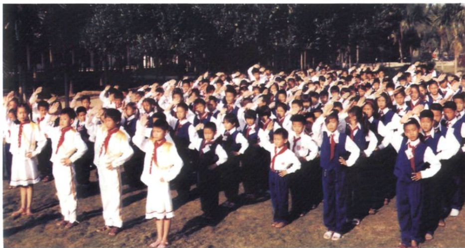
2001年，南滨农场中心小学举行升旗仪式