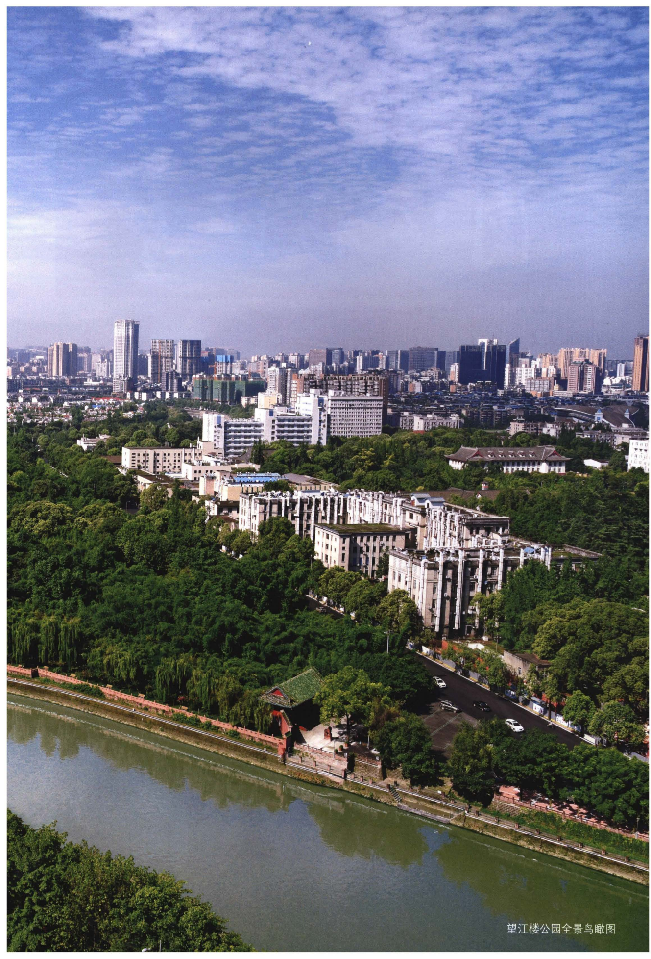
望江楼公园全景鸟瞰图