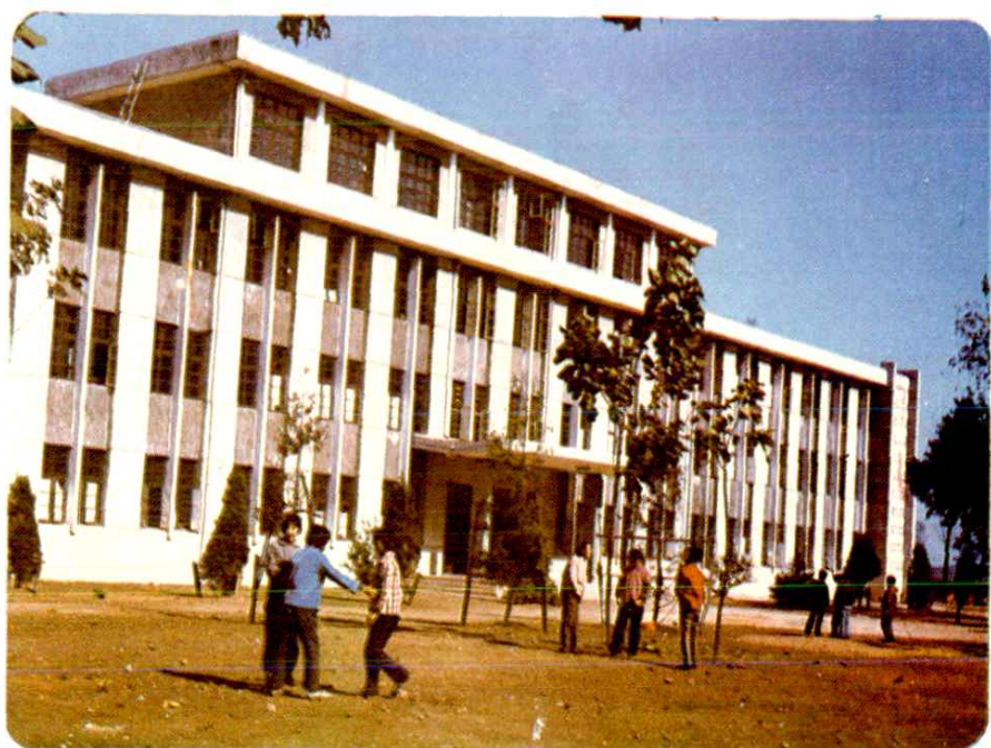
贵池中学建校历史有七十多年，图为教学区一角。