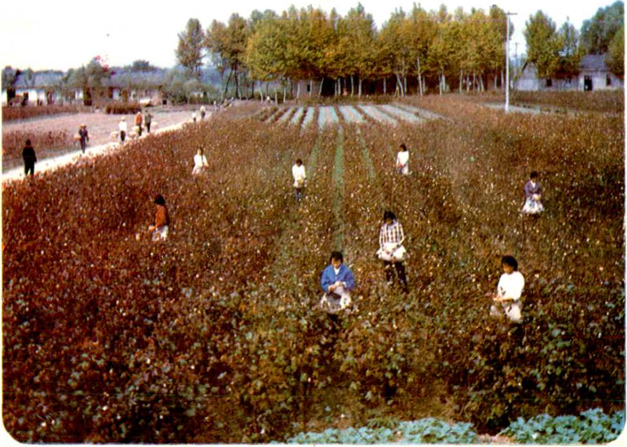
乌沙区是全县重点产棉区，图为幸福村棉田一角。