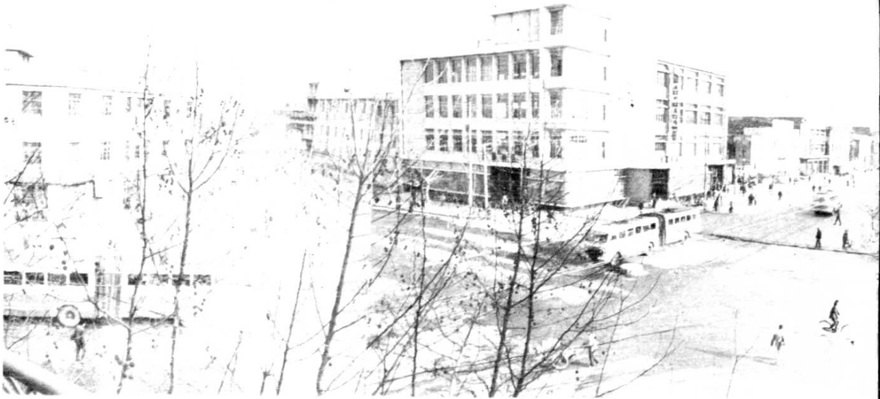
图为秋浦路长江路交叉中心一角