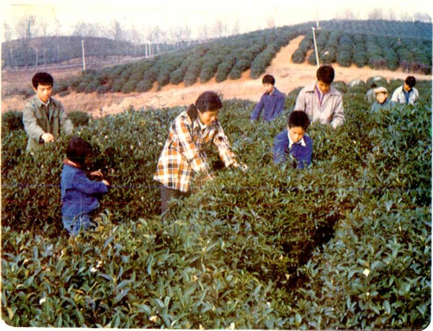
茶叶是本县重要出口商品，新辟的茶园遍布丘陵、山岗。