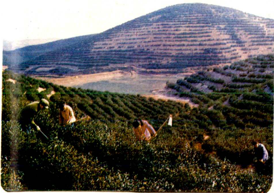
牛头山茶场一片葱绿茫茫