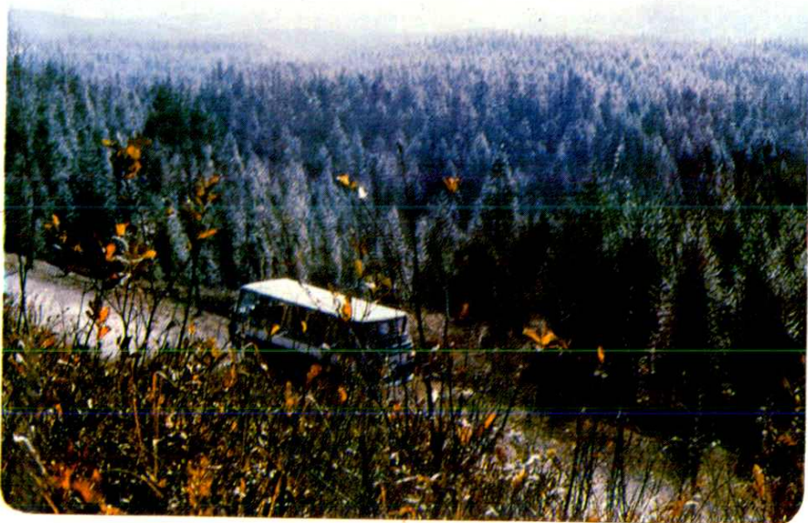
本县山场面积广阔，林业资源丰富，近年来林业发展很快，这是牌楼乡杉木林基地一瞥。