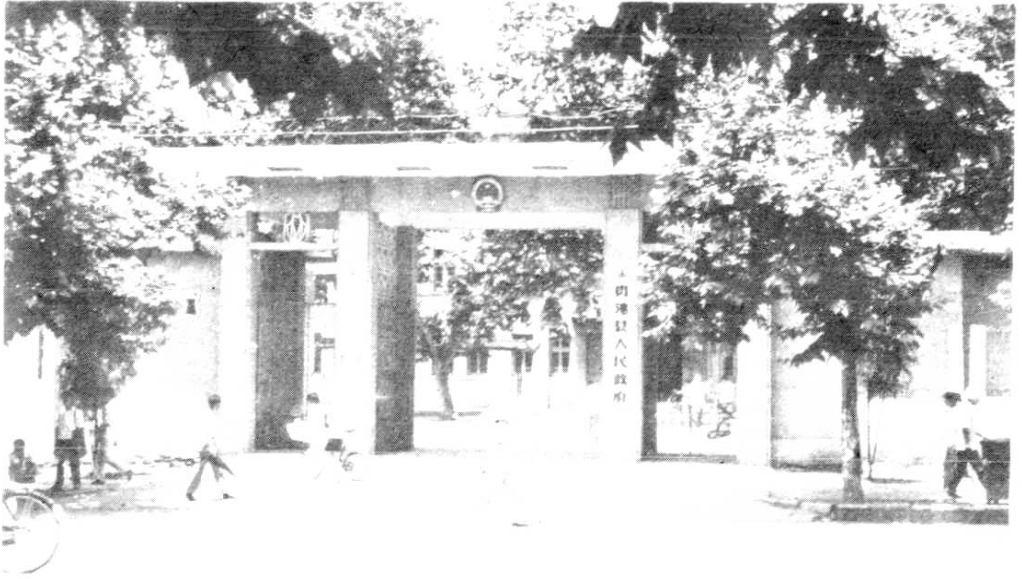
图为贵池县人民政府机关位于池城长江路南端