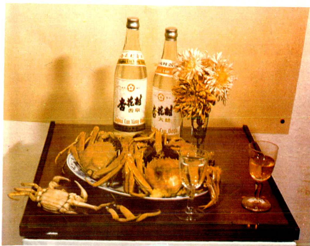
菊花放、蟹黄、酒泉香。