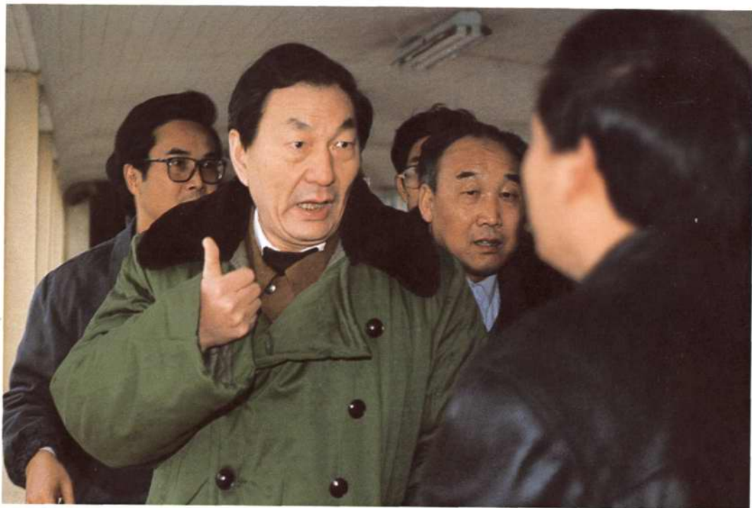
◇1993年1月23日,中共中央政治局常委、国务院副总理朱镕基(左一)视察北仑发电厂工程