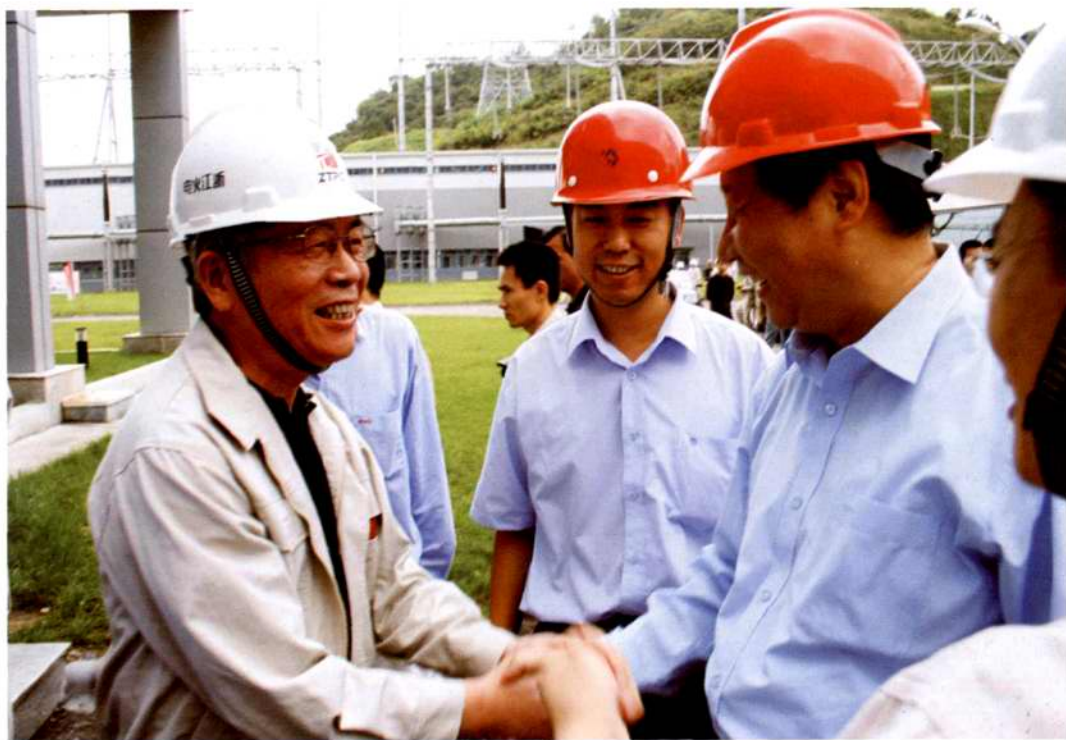
◇中共浙江省委书记习近平(右)视察建设中的国华宁海电厂,并与公司党委书记沈妙言(左)亲切握手