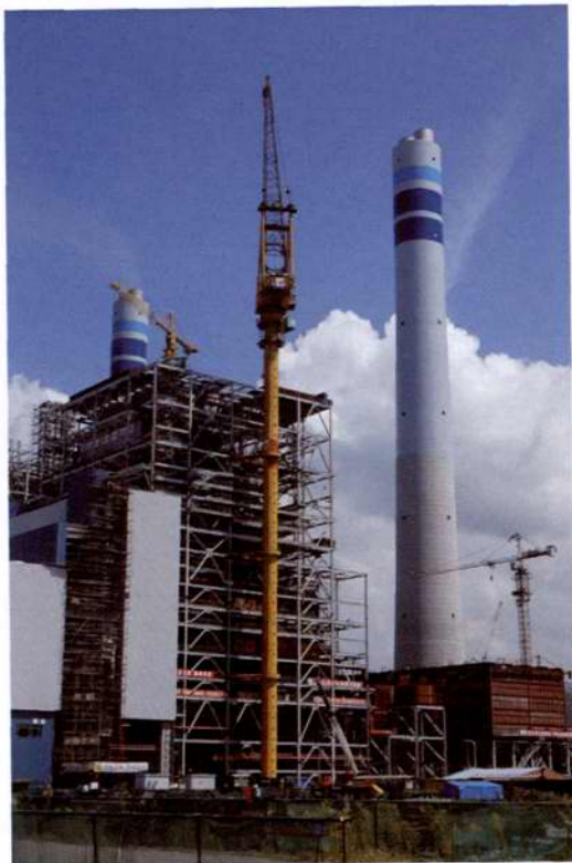
◇2005年8月,兰溪电厂锅炉施工