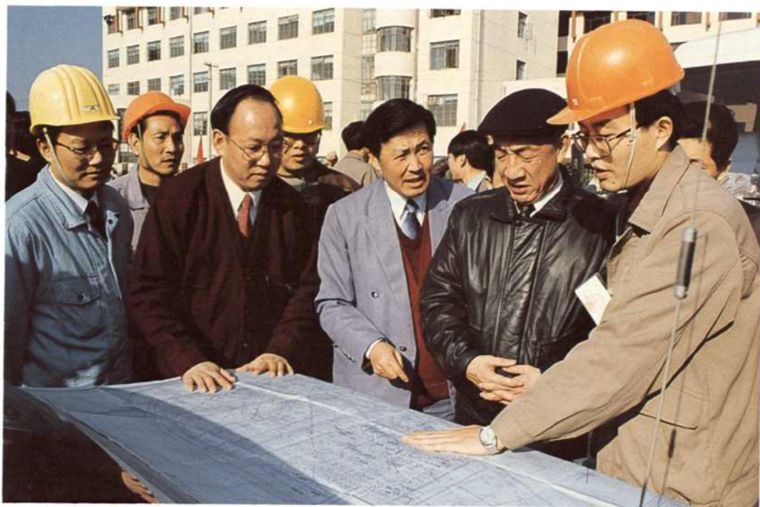
◇1994年12月4日,国务院副总理邹家华(右二)视察嘉兴发电厂工程,公司领导黄桂林(后排左一)、周舒丹(后排左二)等陪同