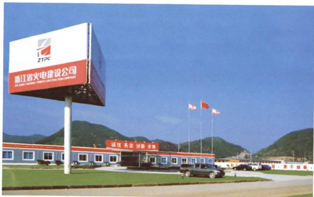
◇2005年, 宁海发电厂一期项目部办公现场