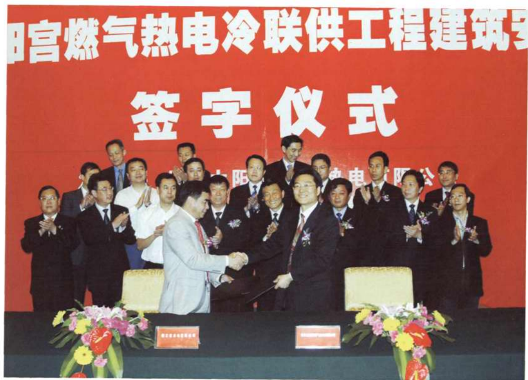
◇公司成功中标 2008 北京奥运会配套工程北京太阳宫燃机电厂工程安装