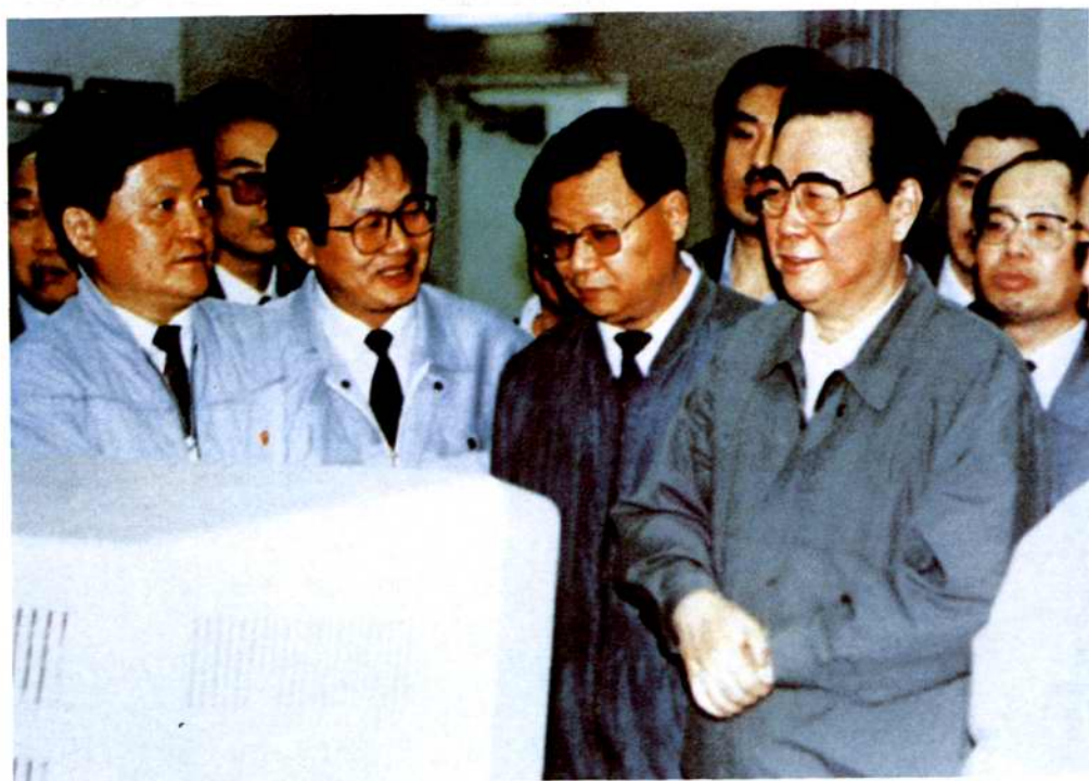
◇1992年5月1日,中共中央政治局常委、国务院总理李鹏(右一)视察北仑发电厂一期工程建筑工地,并为工程建设者题词:“建设浙江现代化火力发电基地”