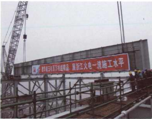
◇壮观的大板梁吊装场面