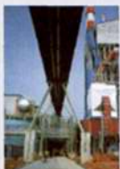
印度尼西亚 RGM 自备电厂 Private Station of RGM, Indonesia