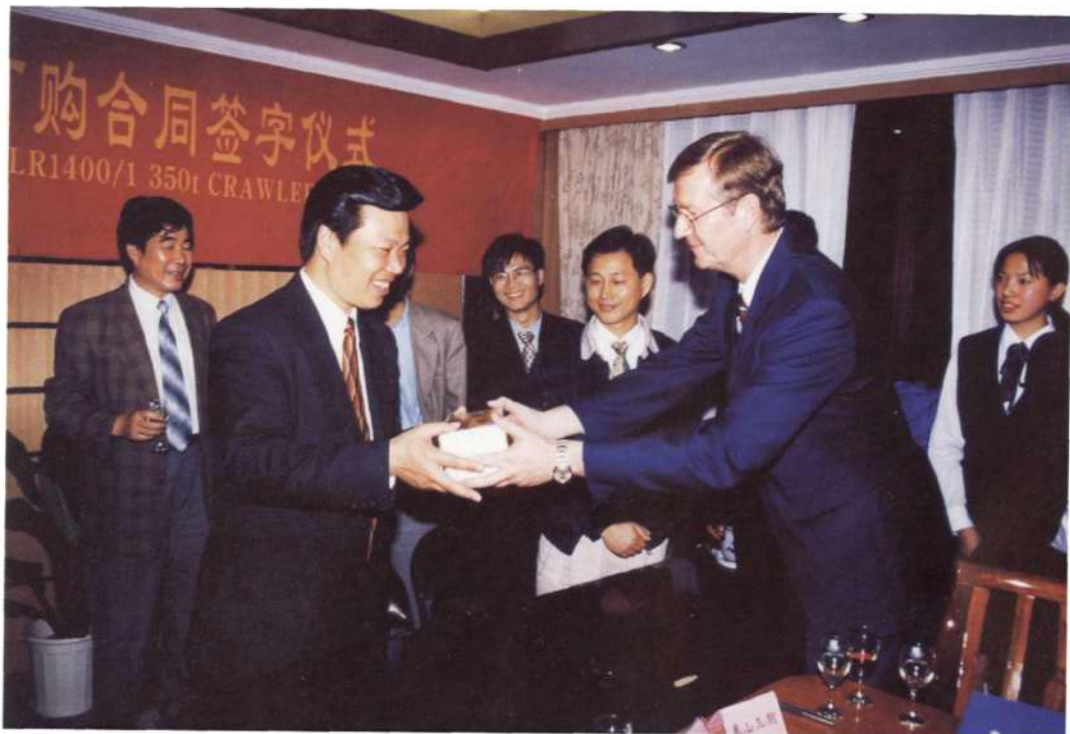
◇积极开拓国际市场,寻求国际合作