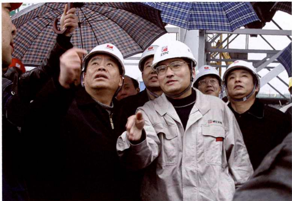
◇2004年6月22日,中共浙江省委副书记、省长吕祖善(前排左)视察嘉兴发电厂二期工程,公司副经理赵刚(前排右)向省长介绍工程建设情况