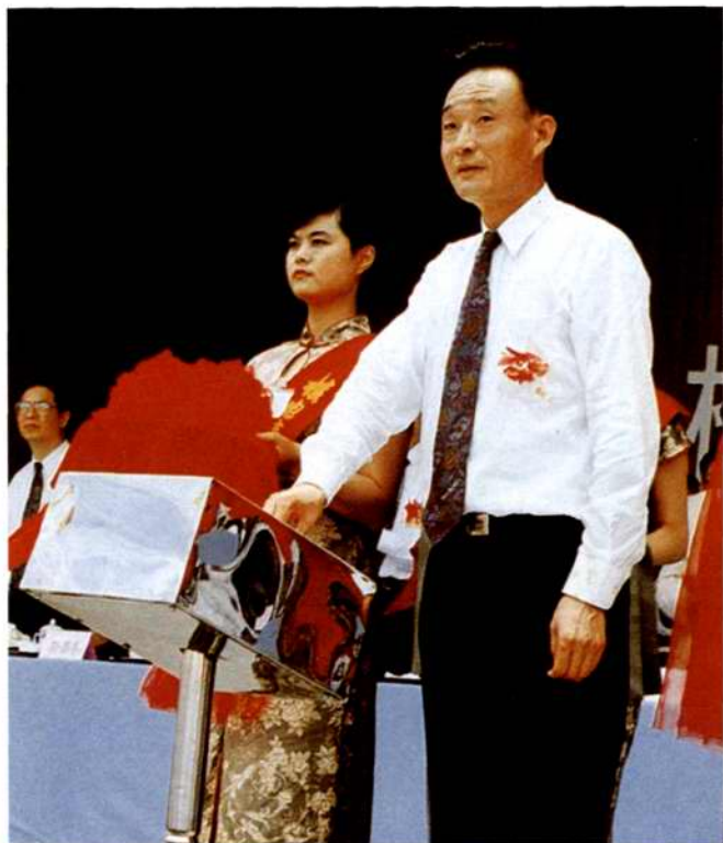
◇1996年6月2日,在秦山核电厂二期工地,中共中央政治局委员、国务院副总理吴邦国按动电钮浇筑第一罐混凝土,工程正式开工