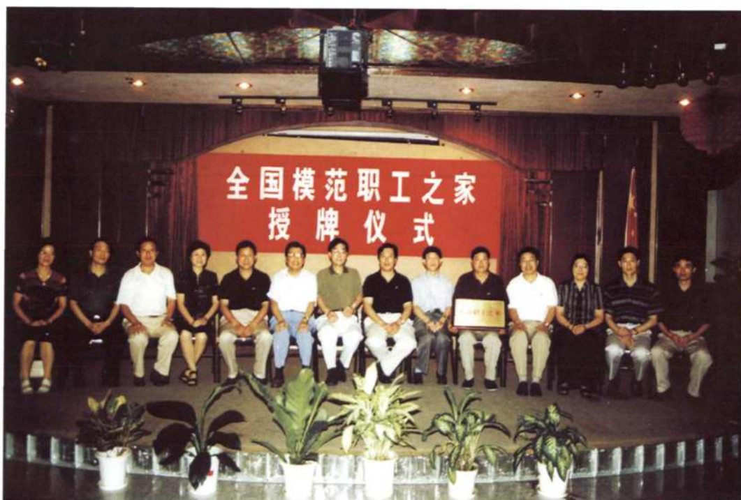
◇2001年10月,公司荣获“全国模范职工之家”称号