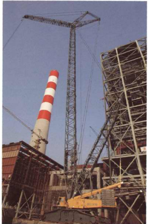
◇矗立在施工现场的 750 吨履带式吊机