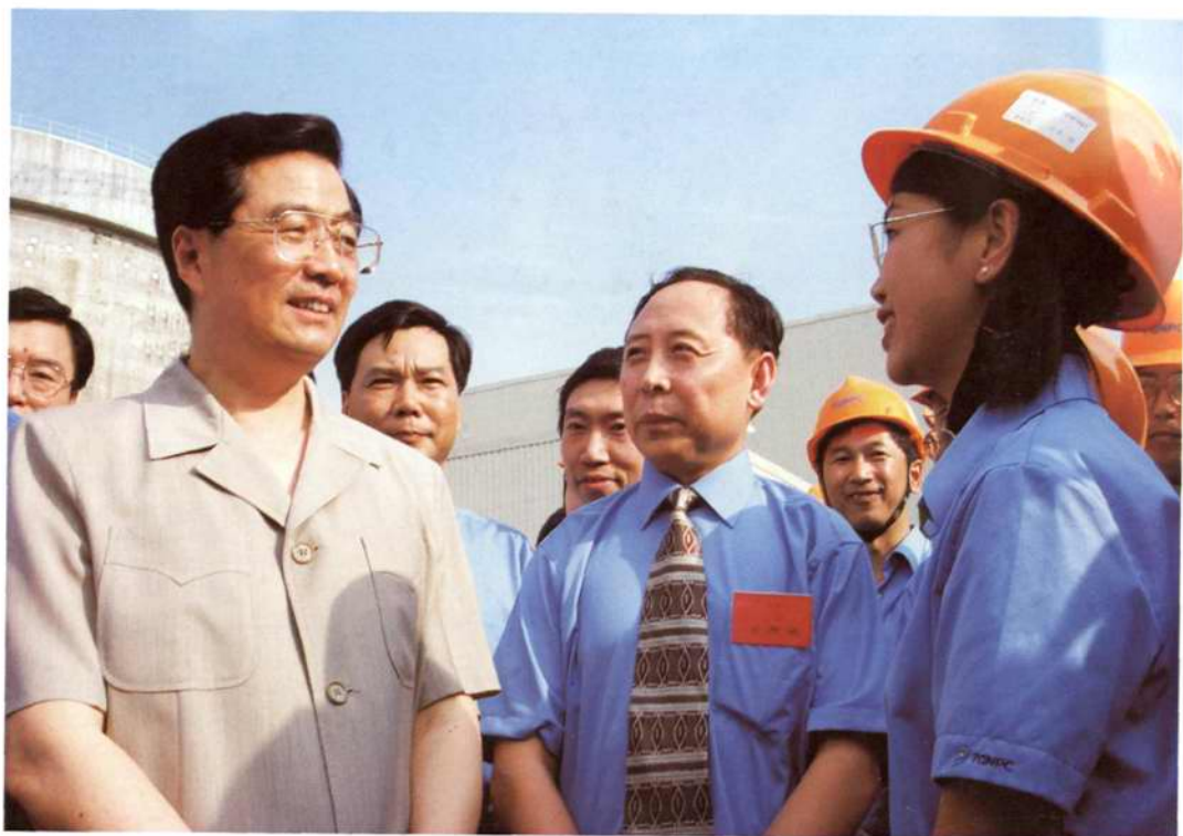
◇2002年6月23日,中共中央政治局常委、国家副主席胡锦涛视察秦山核电站三期工程,并慰问工程建设者