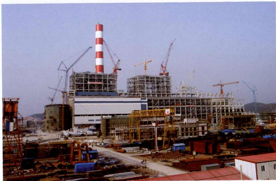
◇2005年12月,建设中的中国首台百万千瓦机组——华能玉环电厂工程