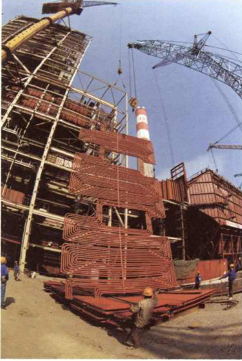
◇北仑发电厂二期工程锅炉设备吊装