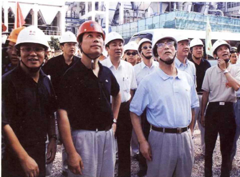
◇2001年7月25~26日,浙江省省长柴松岳(右二)在省电力公司总经理陈积民的陪同下,到长兴发电厂二期建设工地慰问奋战在高温烈日下的浙江火电职工(左二为公司经理钟耀坤)