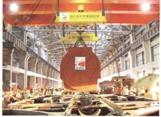
◇汽轮发电机组定子吊装