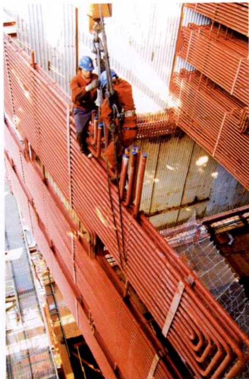
◇2005年4月,国华宁海电厂锅炉设备吊装