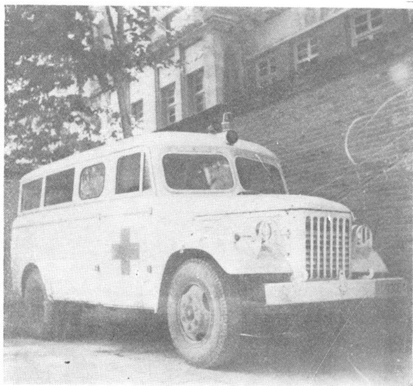
阜阳县卫生防疫站救护车