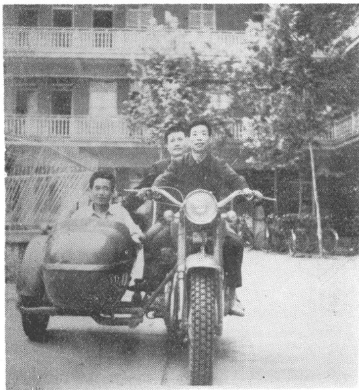
防疫人员驾驶摩托车下乡调查疫情