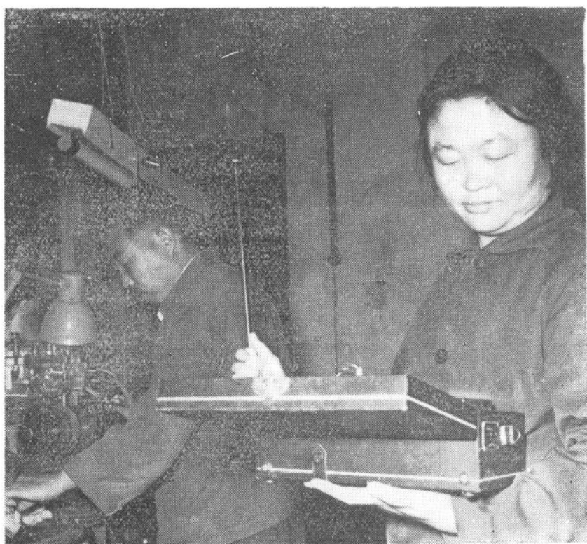
搞劳动卫生的同志在工厂进行气象条件测定