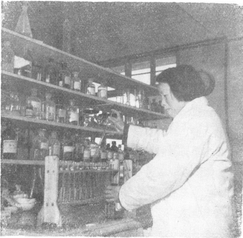
检验室的同志在工作