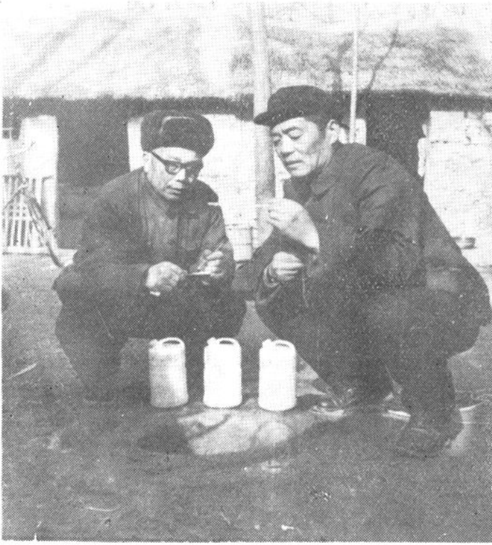
卫生科的同志在采水样进行水质卫生监测