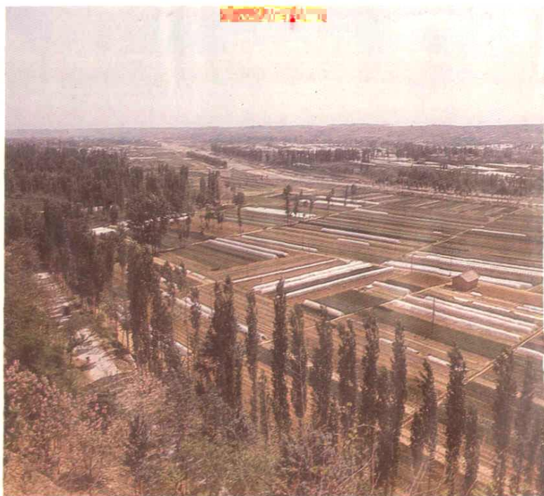
锦 阳 川