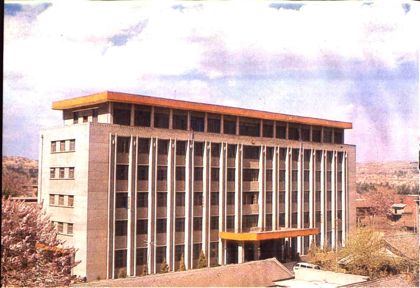
耀县 人民政府办公楼