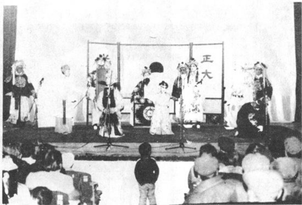
▲图为区业余京剧团演出新编历史剧《吞蝗诛“蝗”》剧照。