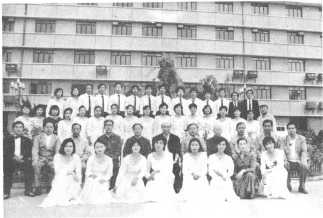
▲图为大型组歌《杨连弟》演出后，区领导与演职员合影留念。