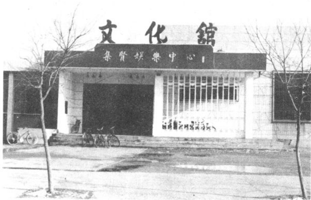
▲图为文化馆集贤分馆。