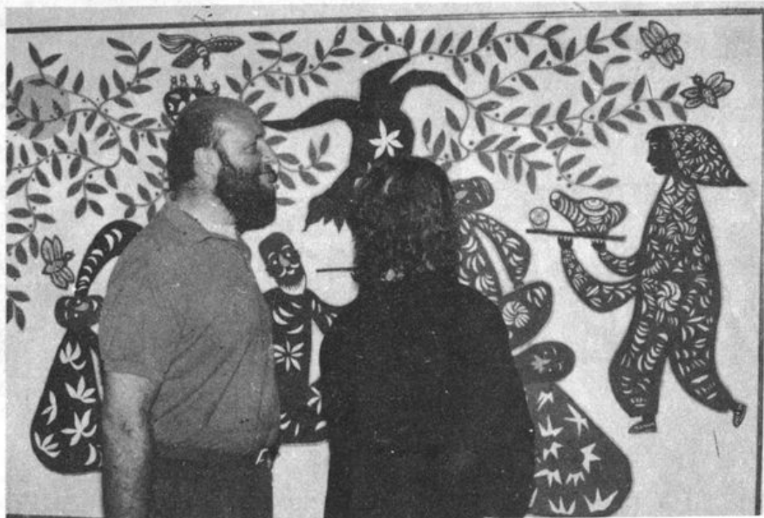
▲图为外宾参观“北郊区农民画”。