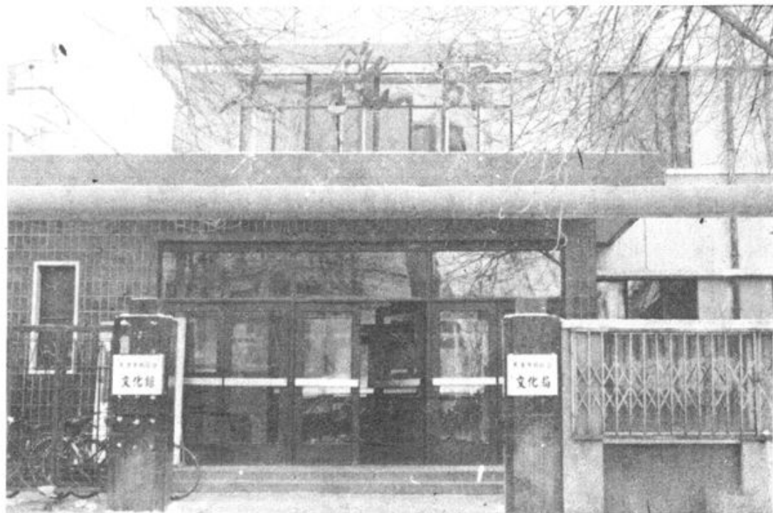
▲图为区文化局、文化馆办公楼。