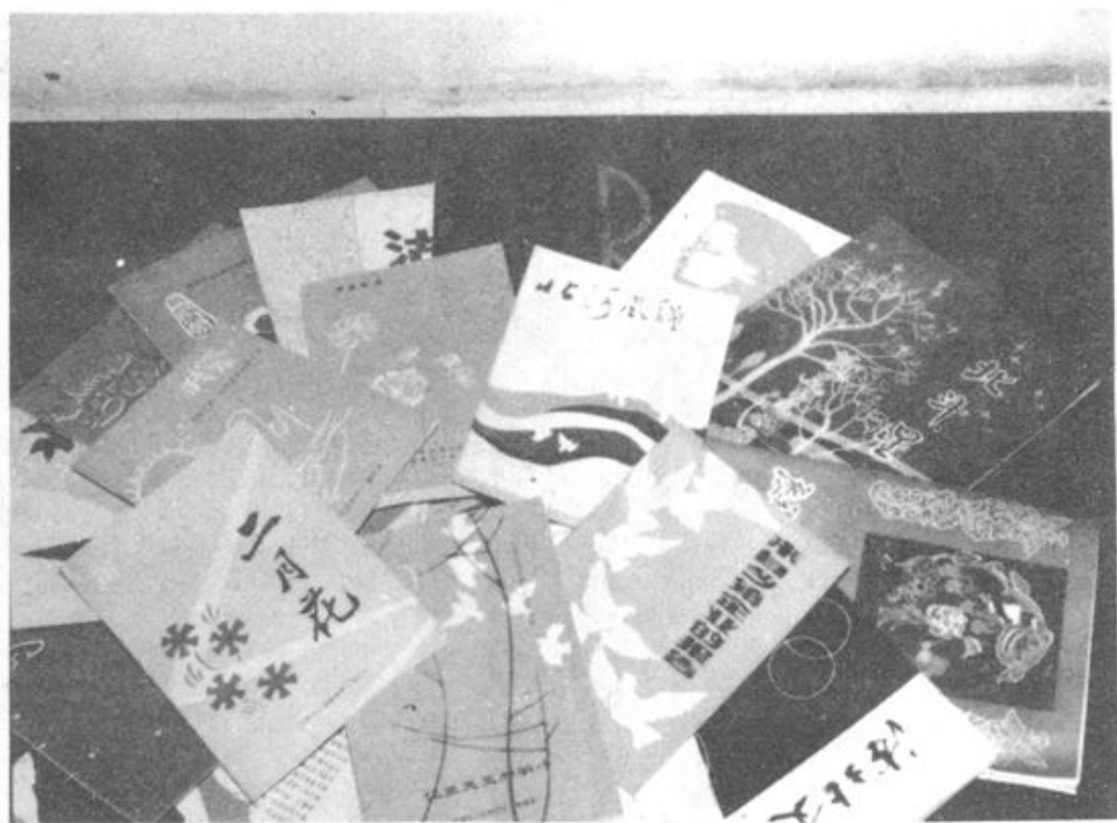
▲图为文化馆、文学社、文联编印的部分刊物和书籍。