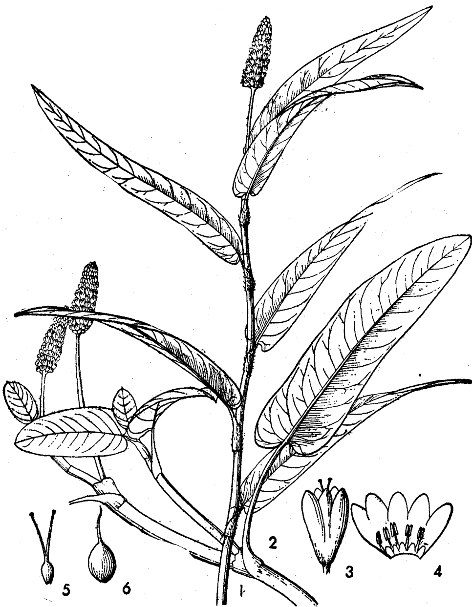
图5 两栖蓼 Polygonum amphibium L.