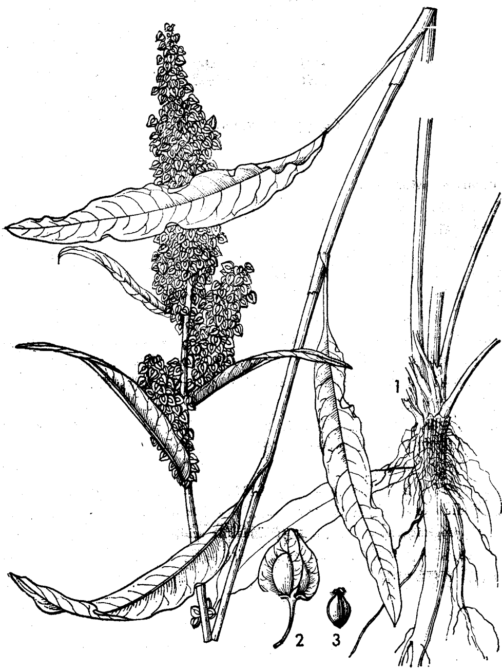
图3 皱叶酸模 Rumex crispus L.