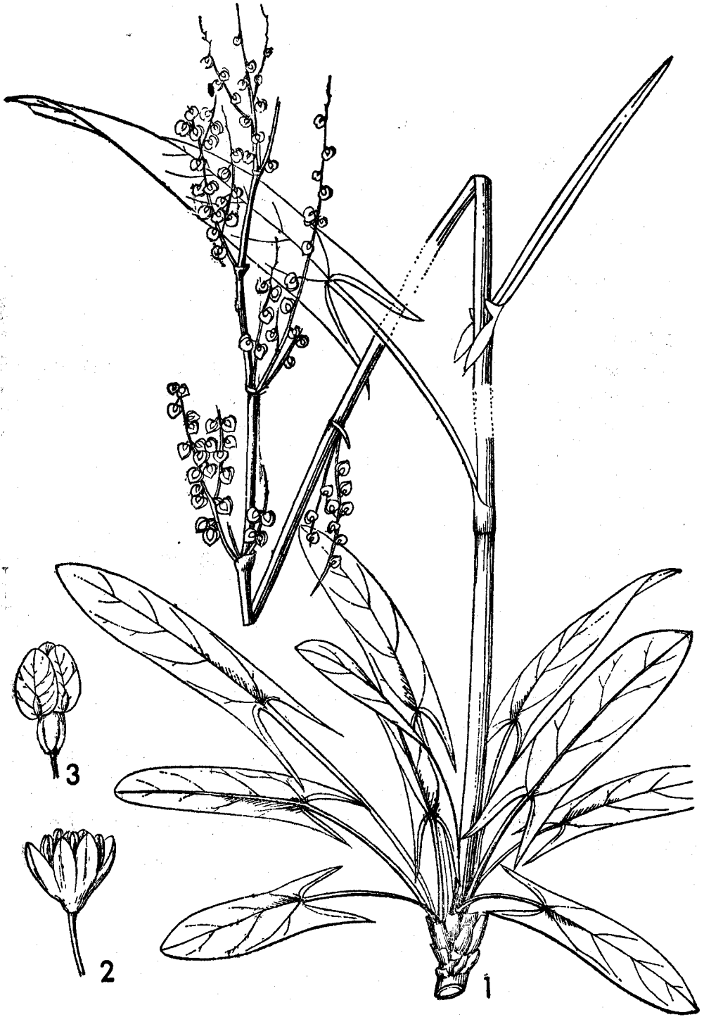
图2 酸模 Rumex acetosa L.