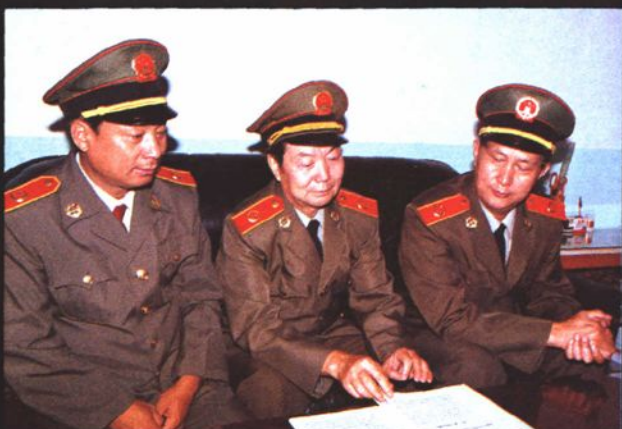
1982年至1997年院 领导班子