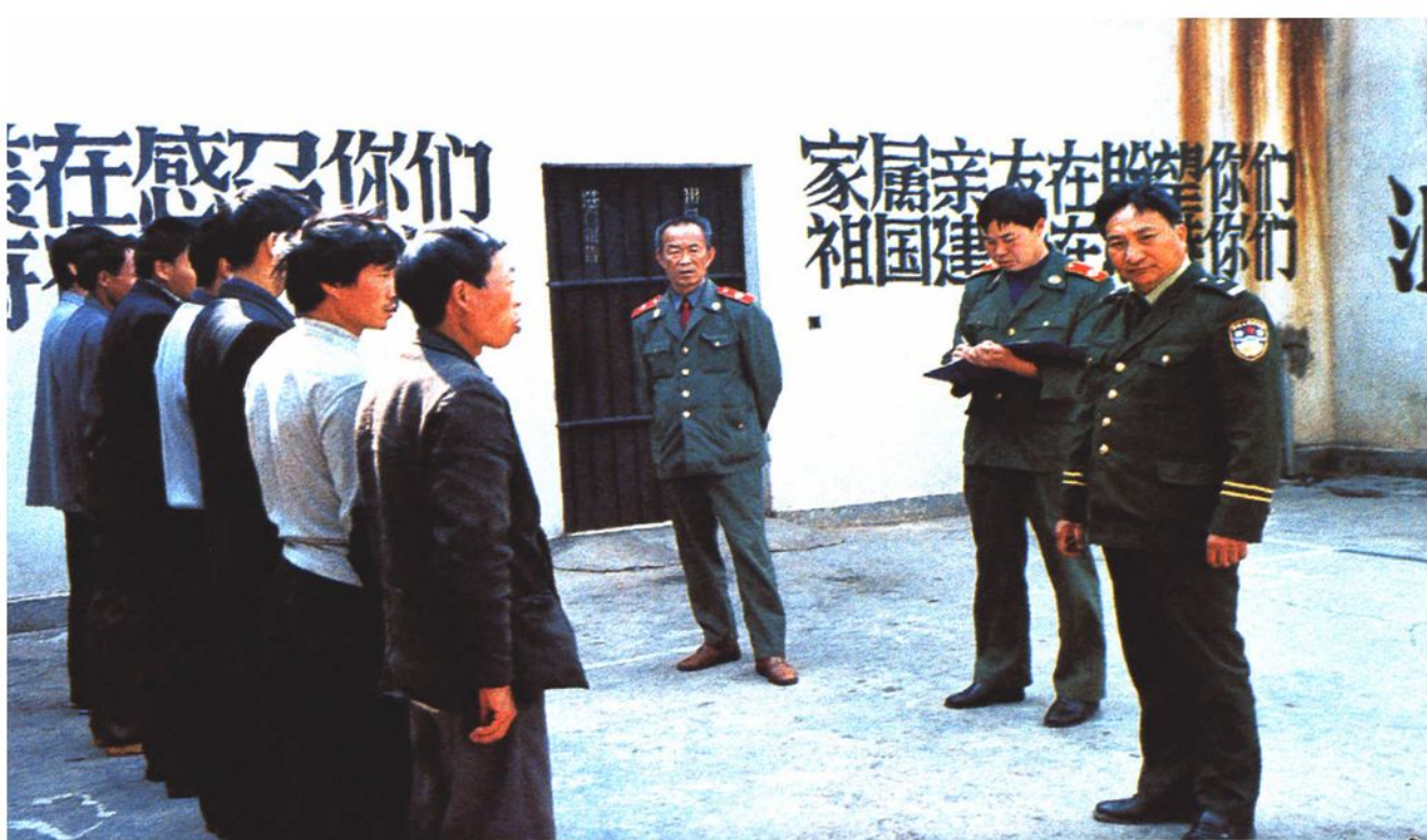
监所检察部门干警对看守所管理进行检察