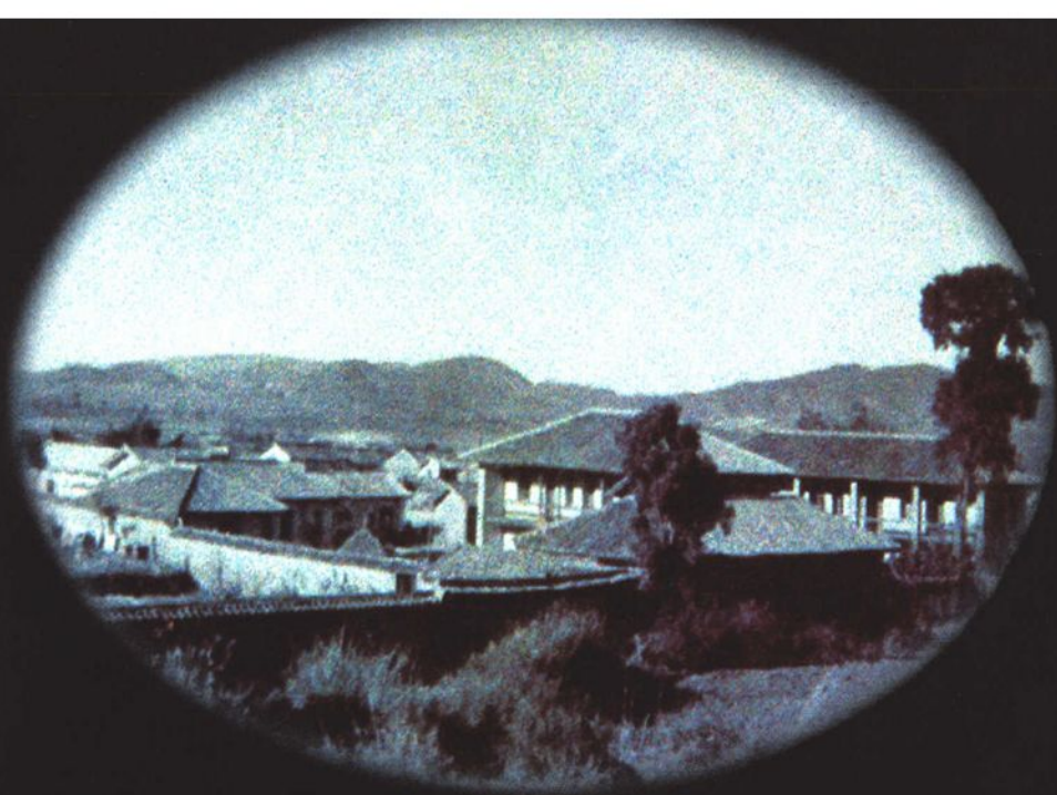
50年代楚雄州检察院全貌