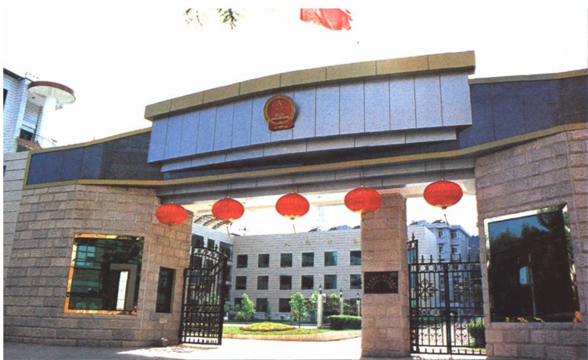
现今庄严雄伟的楚雄州检察院大门