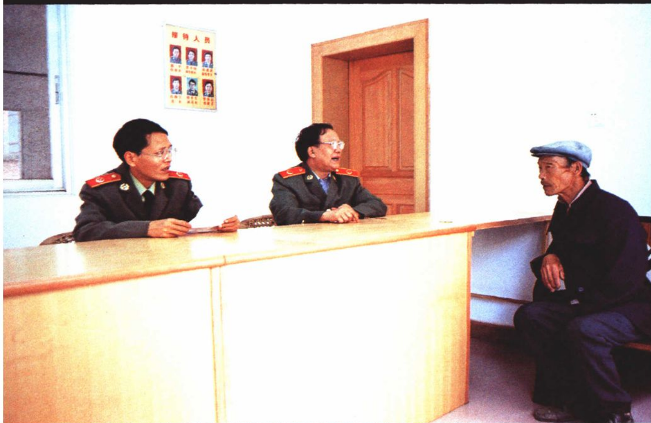
控告申诉部门干警接待群众来访