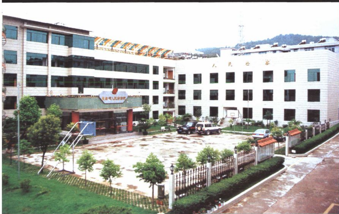
现今楚雄州检察院办公楼概貌