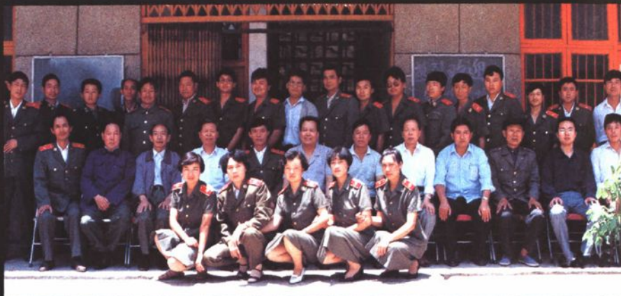
最高人民检察院副检察长陈明枢（二排左六）视察南华县检察院