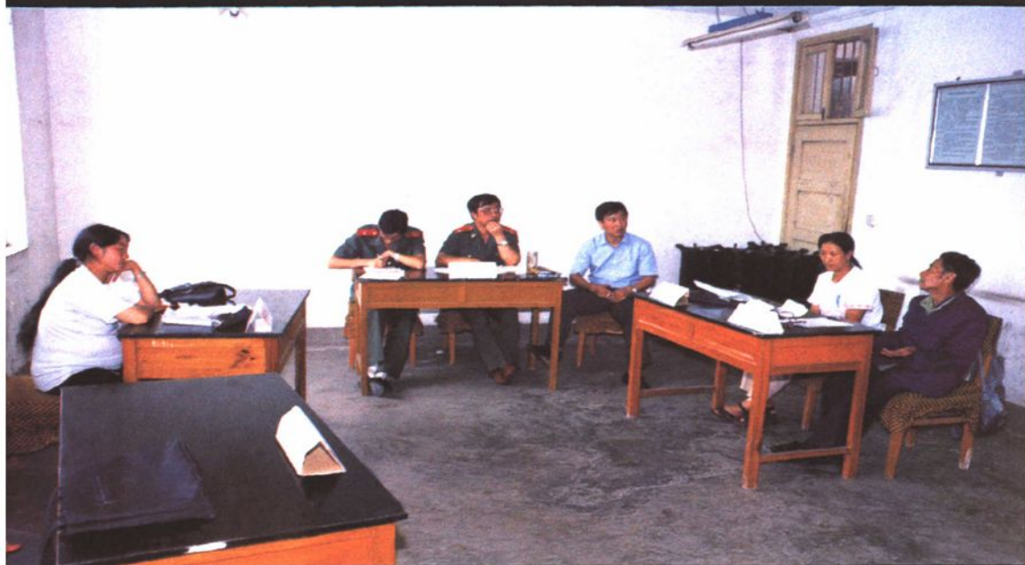
民事行政检察部门对民事申诉案件进行公开审查