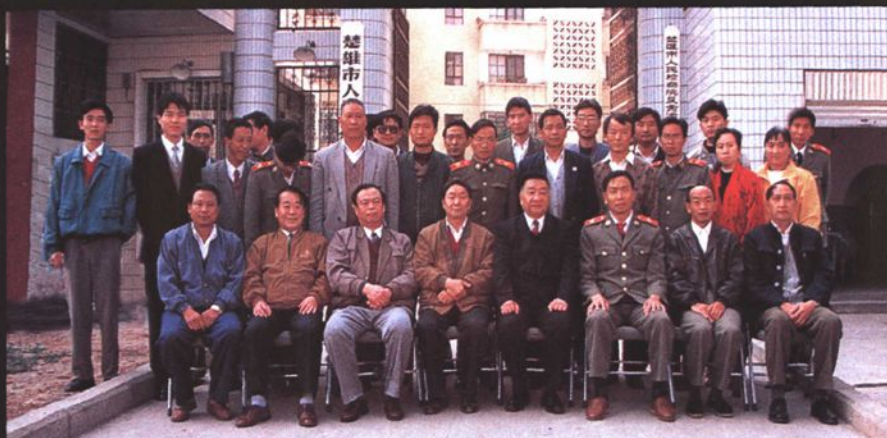
最高人民检察院副检察长王文元（前排右四）视察楚雄市检察院