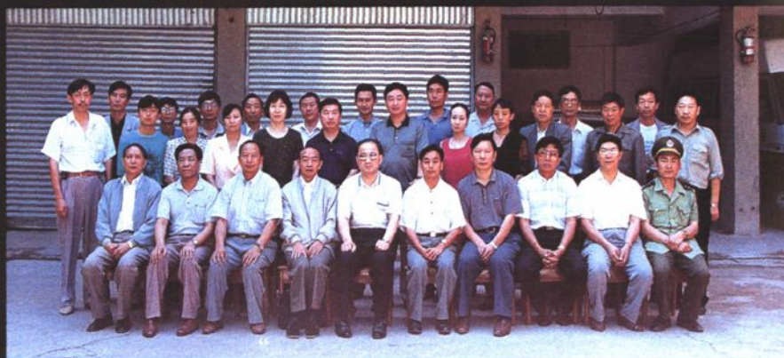
最高人民检察院副检察长张穹（前排左五）视察楚雄州检察院