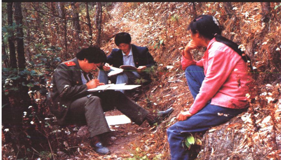
审查批捕部门干警对案件进行补充侦查