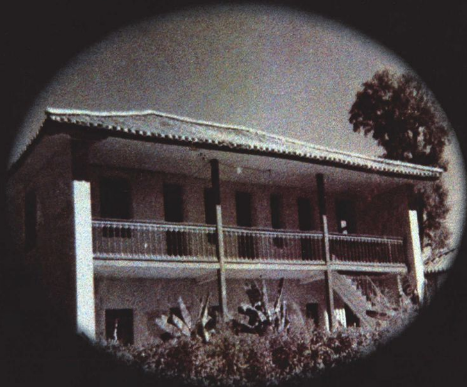
50年代楚雄州检察院办公楼