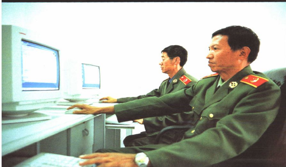
检察技术人员进行计算机网络调试