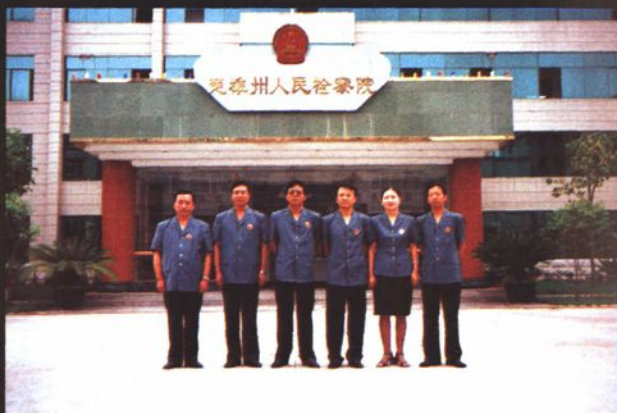
1997年至2002年院 领导班子