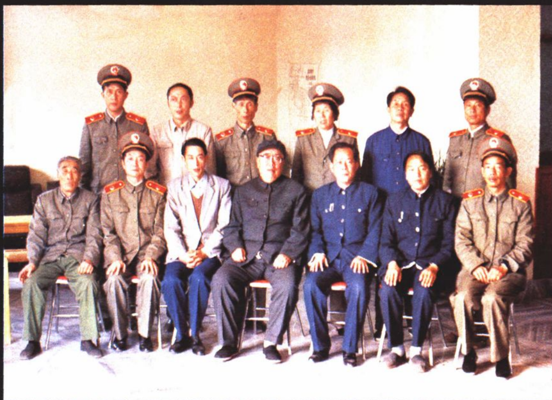
最高人民法院杨易辰检察长（前排中）视察州检察院