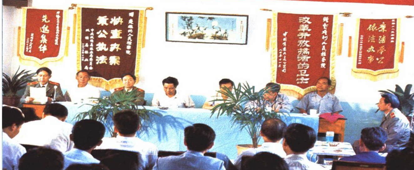
楚雄州检察院反贪污贿赂工作局成立