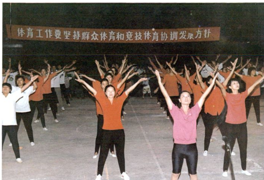
积极开展全民健身运动、怒江州人民医院 100 名职工参加州政府主办的六库地区广播体操比赛获组织奖。