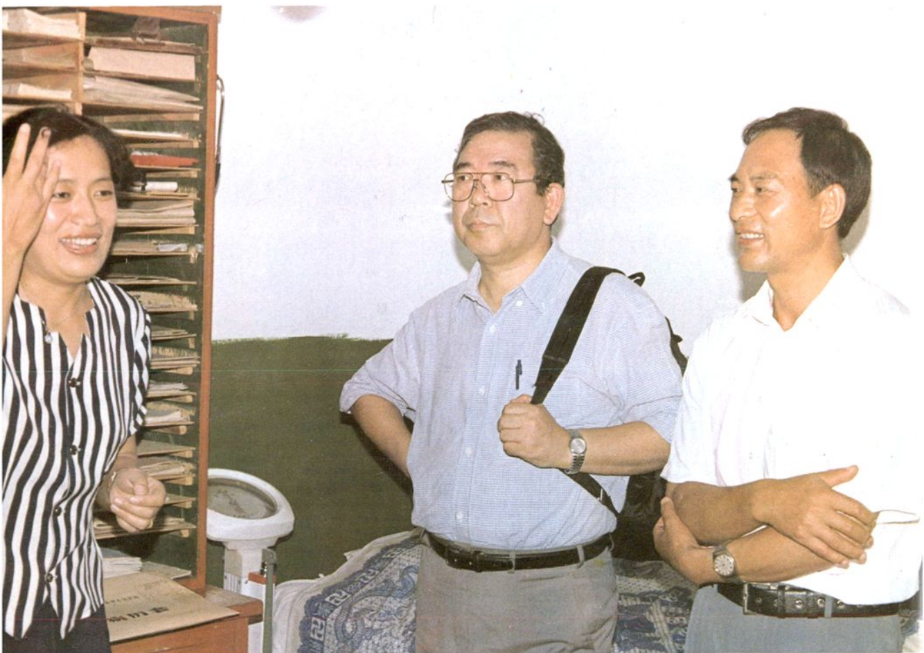
1996年8月18日，日本国际协力事业团·中国控制脊髓灰质炎项目·JICA专家首席顾问千叶靖男（医学博士）来怒江人民医院考察脊髓灰质炎防治情况。（中为千叶靖男博士）