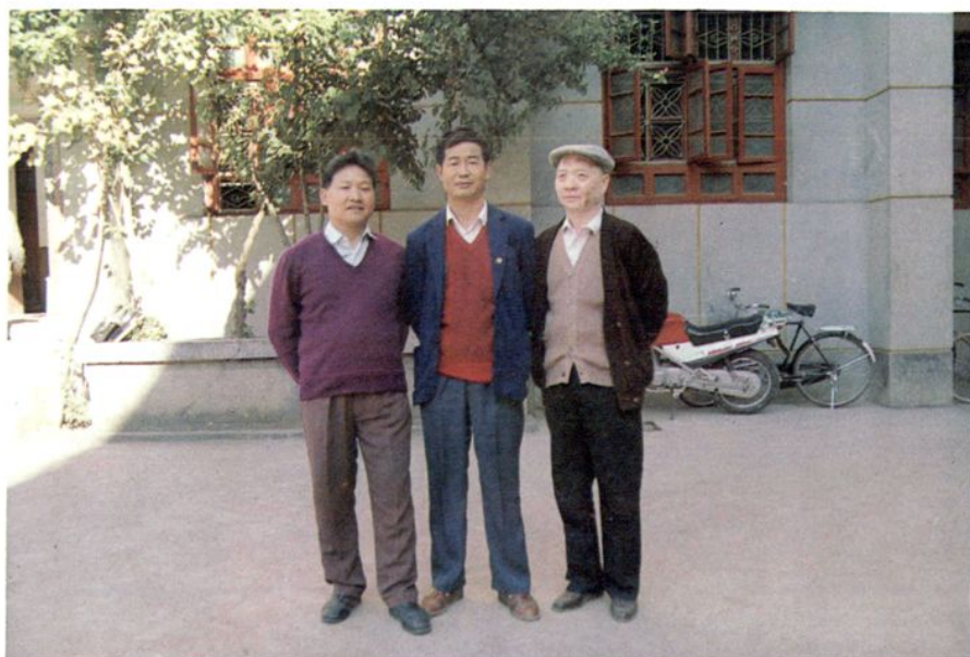
《院志》主编与院领导合影