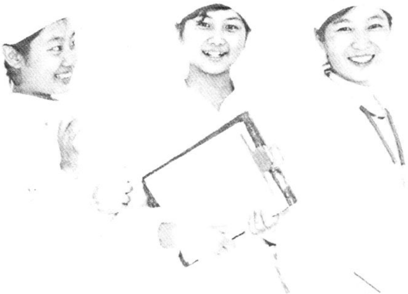
新一代天使——八十年代初参加工作的年青护士。