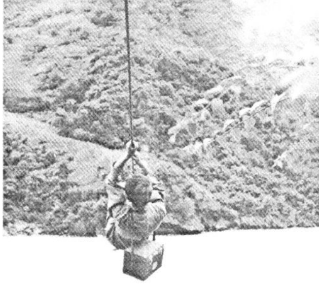
五·六十年代、及至七十年代,怒江州人民医院医务人员经常爬山过溜,送医送药上门,为边疆各族人民防病治病。(1979年)