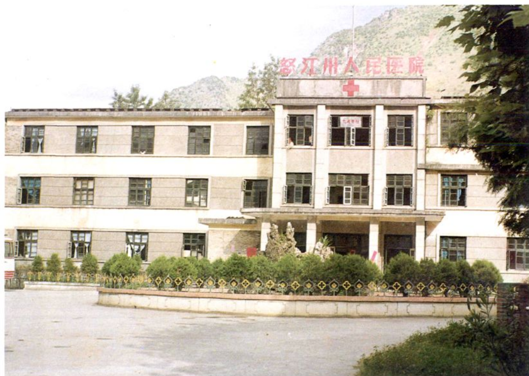
怒江州人民医院门诊大楼 (1993年)