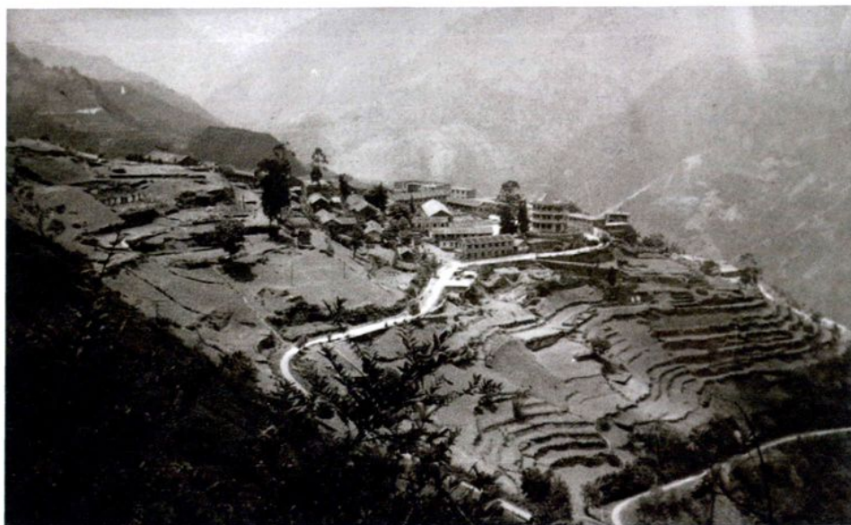
怒江州人民医院诞生地—原碧江县知子罗镇 (1984年)