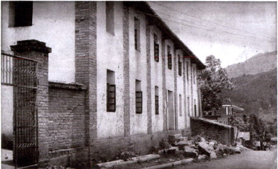
怒江县人民医院旧址—泸水县六库土司衙门