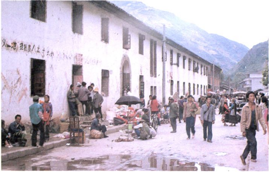
怒江州人民医院旧址—原碧江县匹河