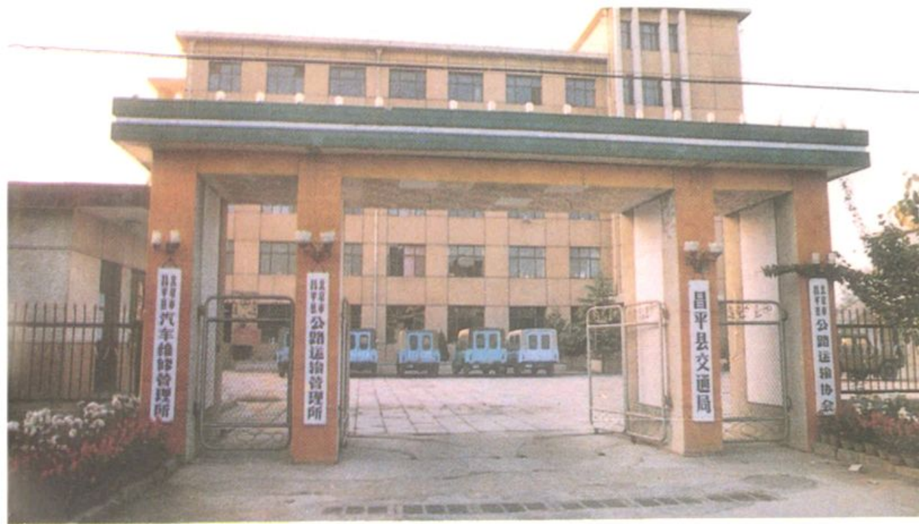
昌平县交通运输管理机构