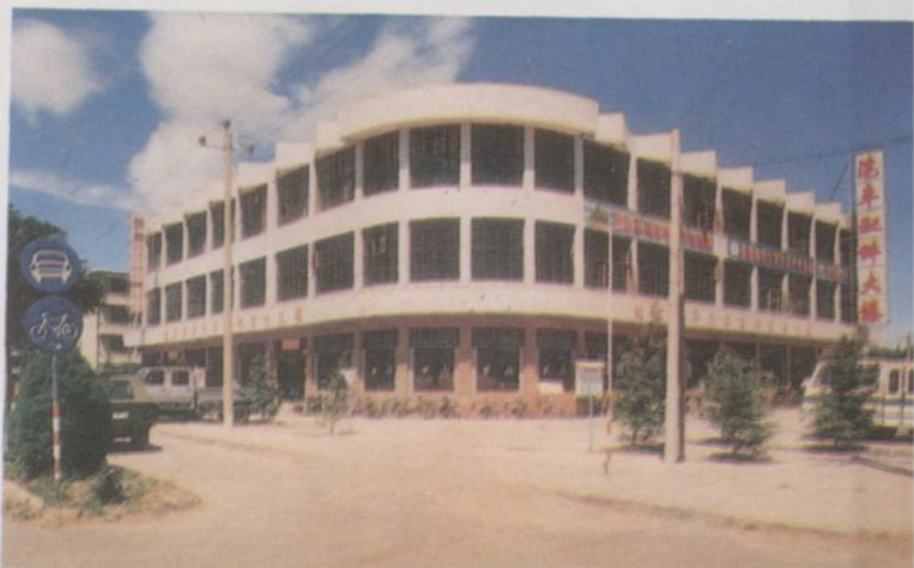
昌平东关汽车配件大楼