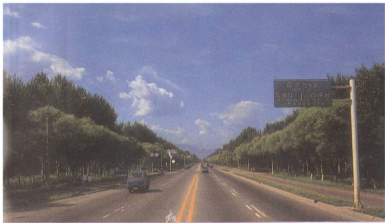
国道京张公路昌平段