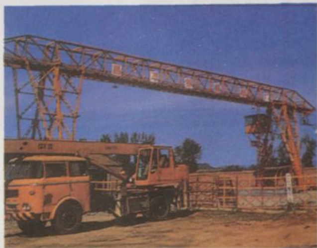
昌平南邵钢模板厂的 门式起重机和汽车起重机