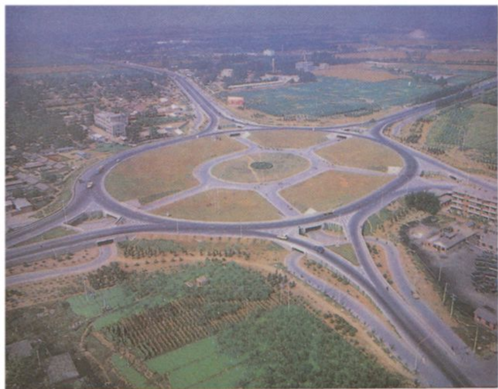
昌平西关 双层立交环岛