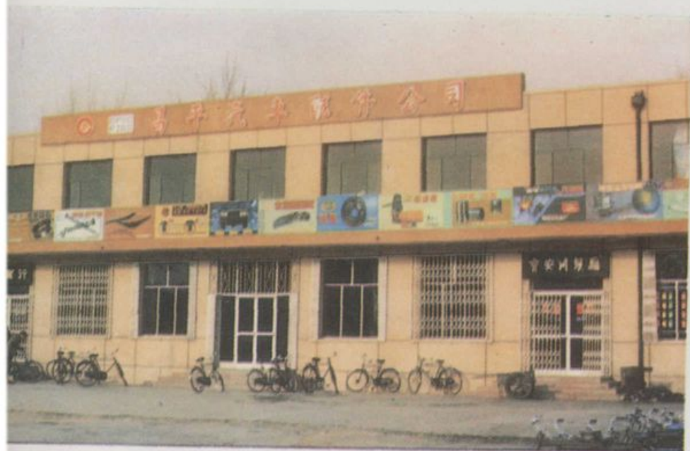
昌平汽车配件公司营业楼