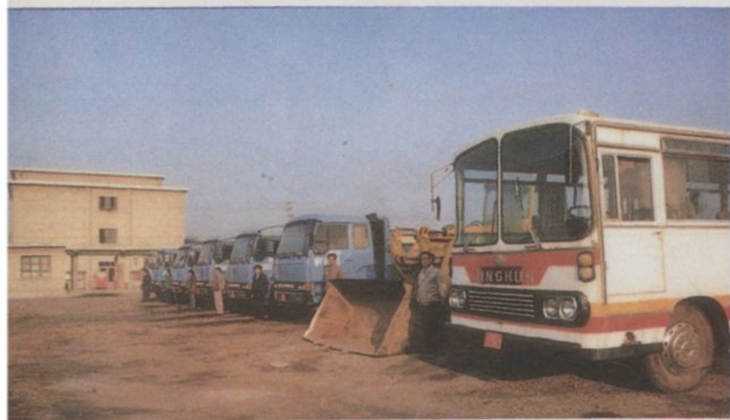
昌平县运输 公司营运车辆整 装待发