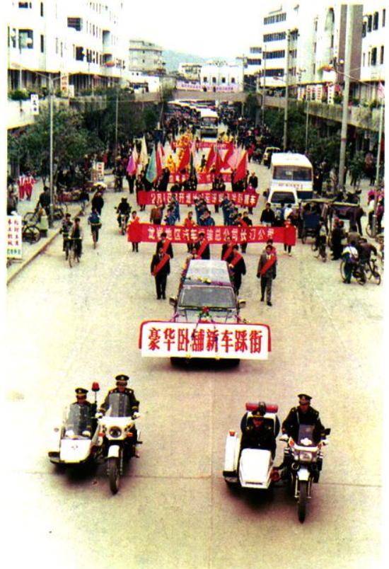
△长汀首批豪华卧铺车投入深圳、福州等地营运。