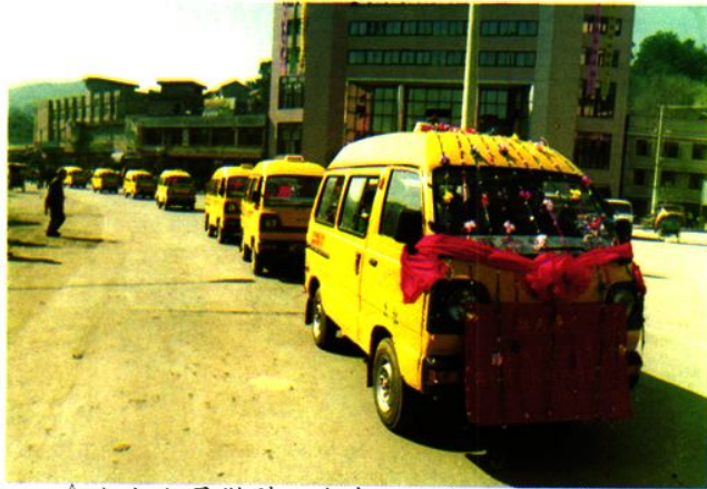
△公交公司微型小汽车1996年2月5日投入出租营运。