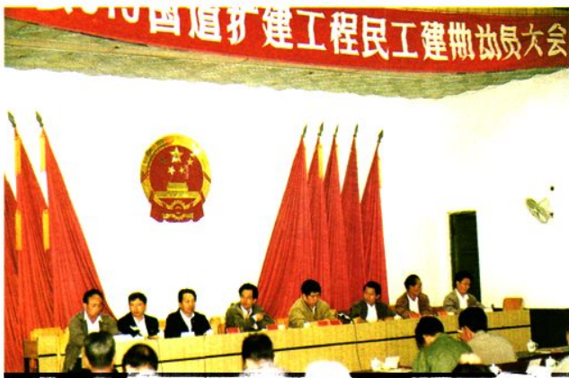
△国道319线长汀地段扩建工程民工建勤动员大会（1992年11月13日在汀州剧院召开）。