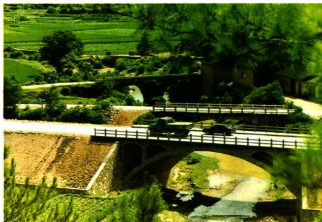
△“四代同堂”的画眉桥为清代、民国时期、建国初期和九十年代历代改建的桥。