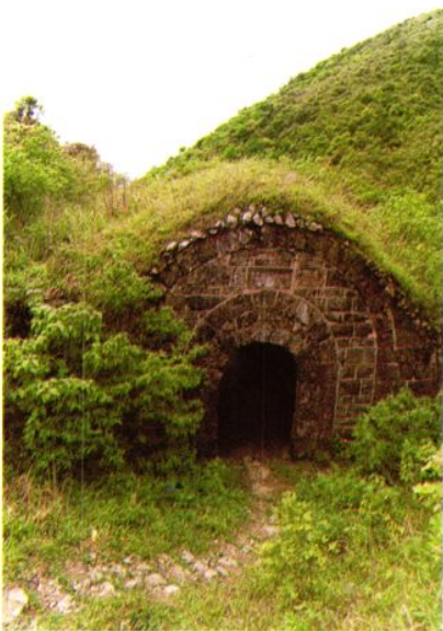
◁ 明代驿道（位于长汀与江西石城县交界处的江福亭）。