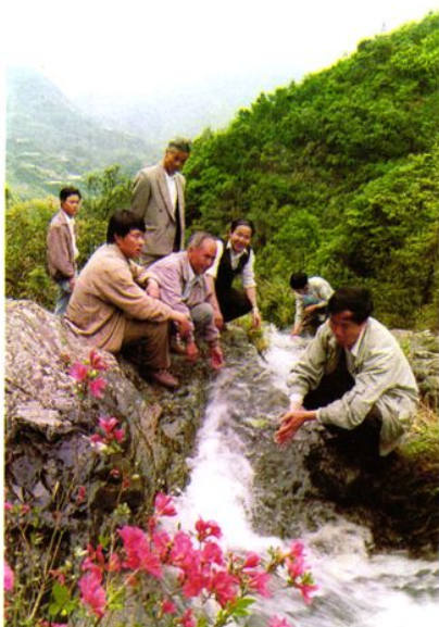
◁ 汀江源头——鸡公岭三溪水（距离赖家山汀江源头约100公里左右）。