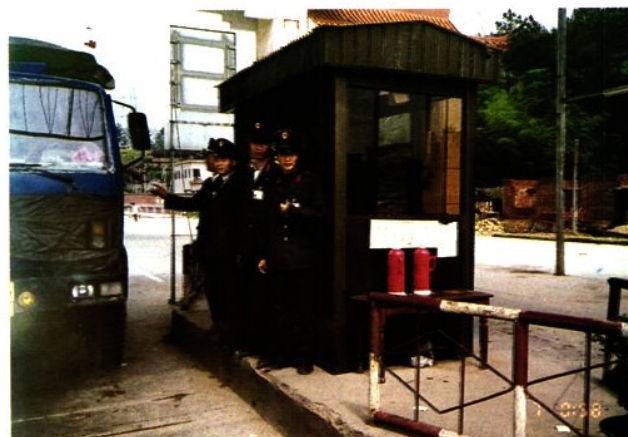
△国道319线长汀县城区西卡道路通行费征收管理站。