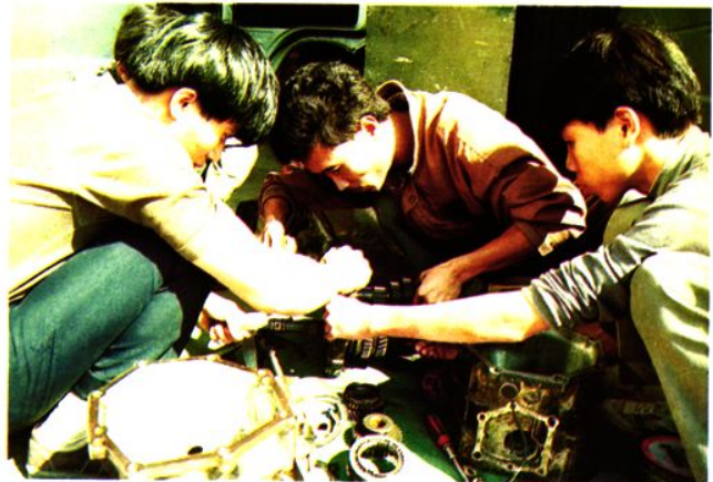
△汽车维修培训实际操作。