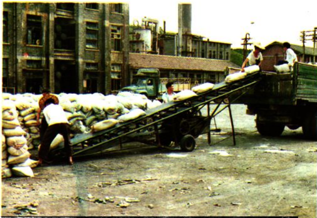
△搬运工人装肥支农。