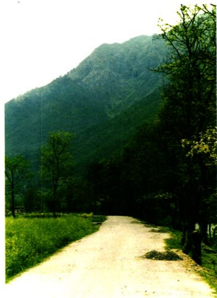
△被全区评为「文明路」的新庵公路。