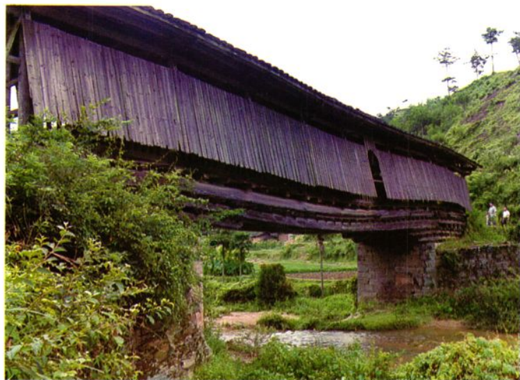
△屋桥——策武乡当坑村永隆桥。