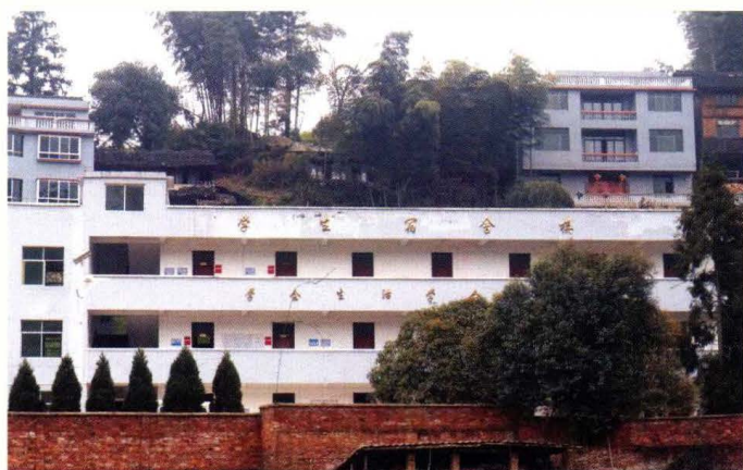
秀洞小学 学生公寓