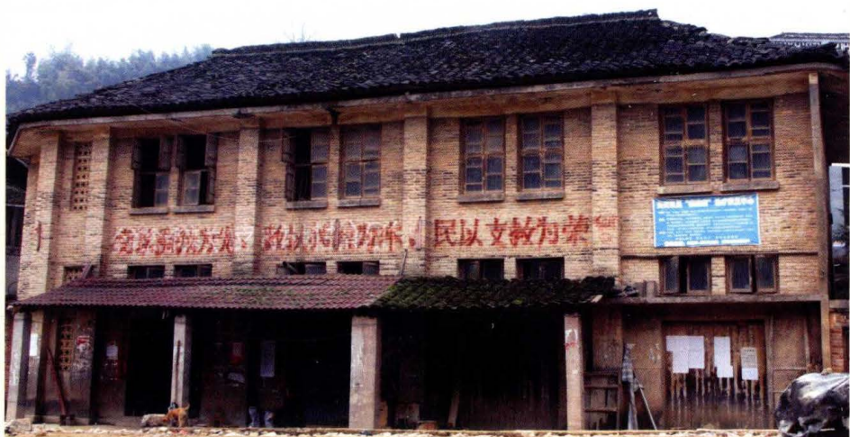
原供销社用房