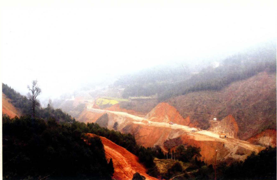
正在改道建设的秀洞坡公路