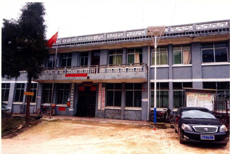
秀洞村民委办公楼