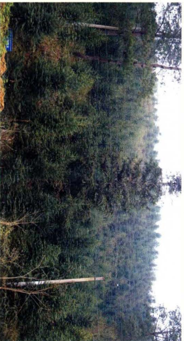
村边幼杉林