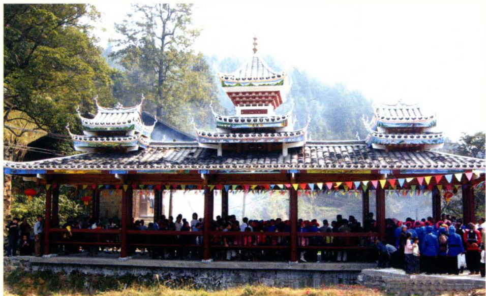
秀洞风雨桥