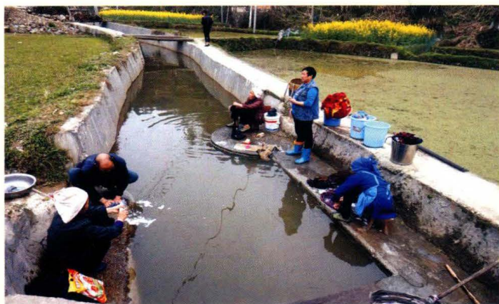
村间溪道