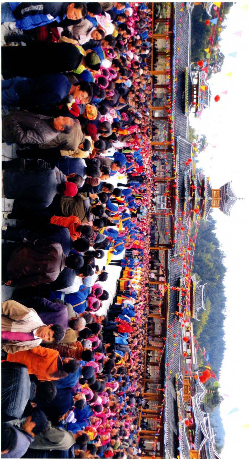
文化广场落成庆典