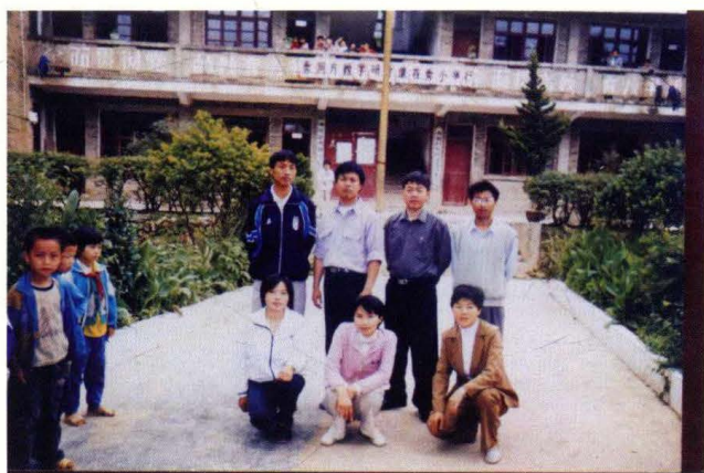
秀洞小学 全体教师