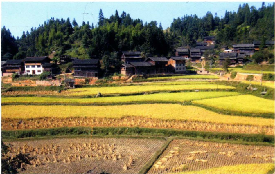
秀洞村密洞坎