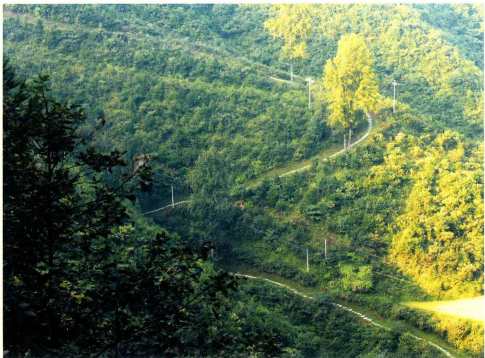
乾隆坡古驿道