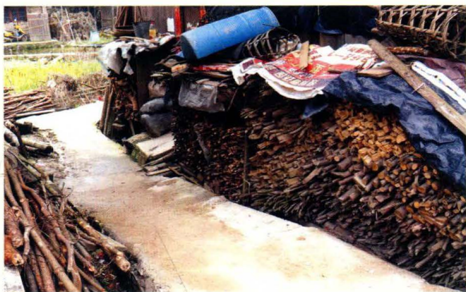
村民储柴