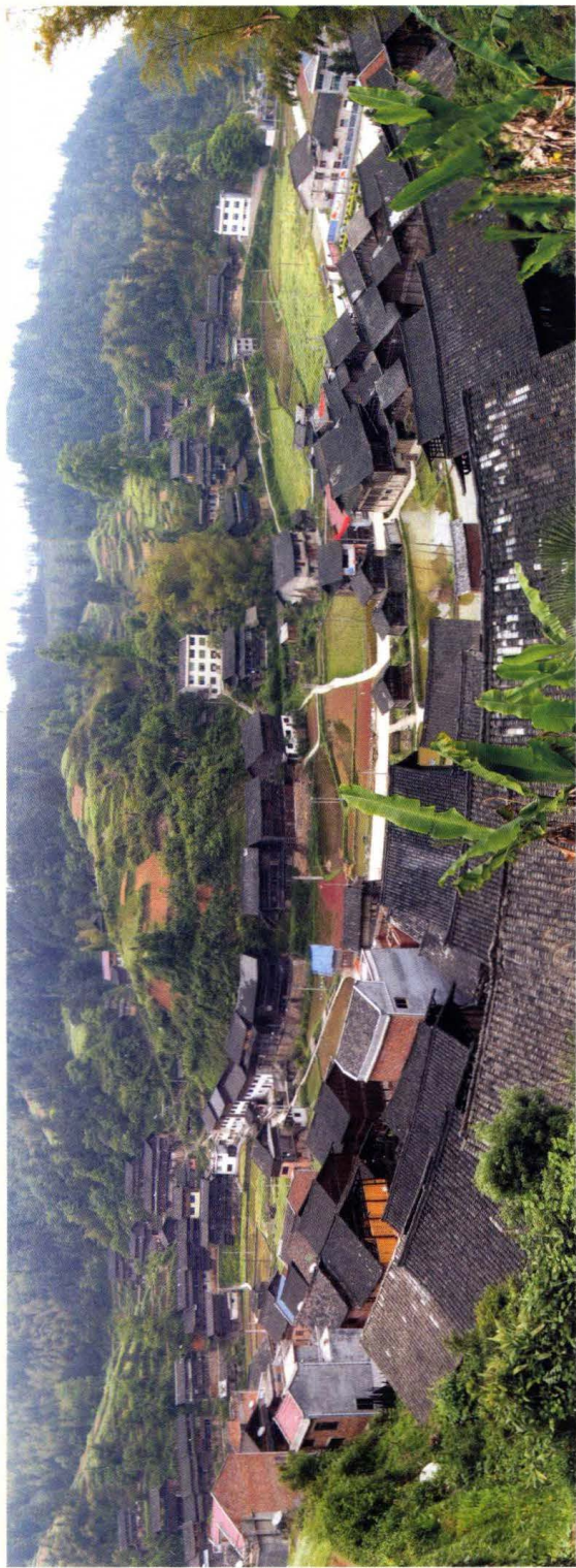
秀洞村全景图