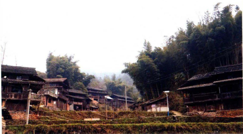
吴家冲口