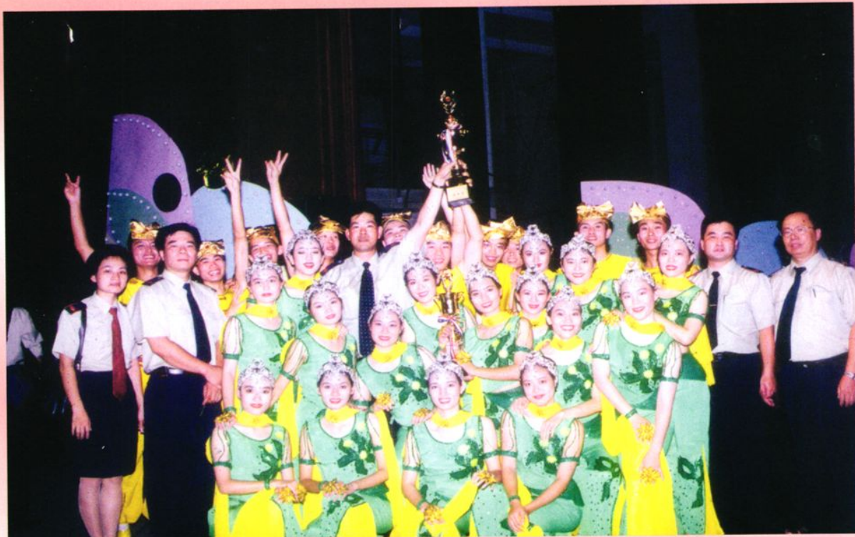
▲ 1999年9月27日，台山市国家税务局在参加江门市国家税务局举办的“税徽闪耀颂中华”文艺晚会中取得了特等奖的好成绩。