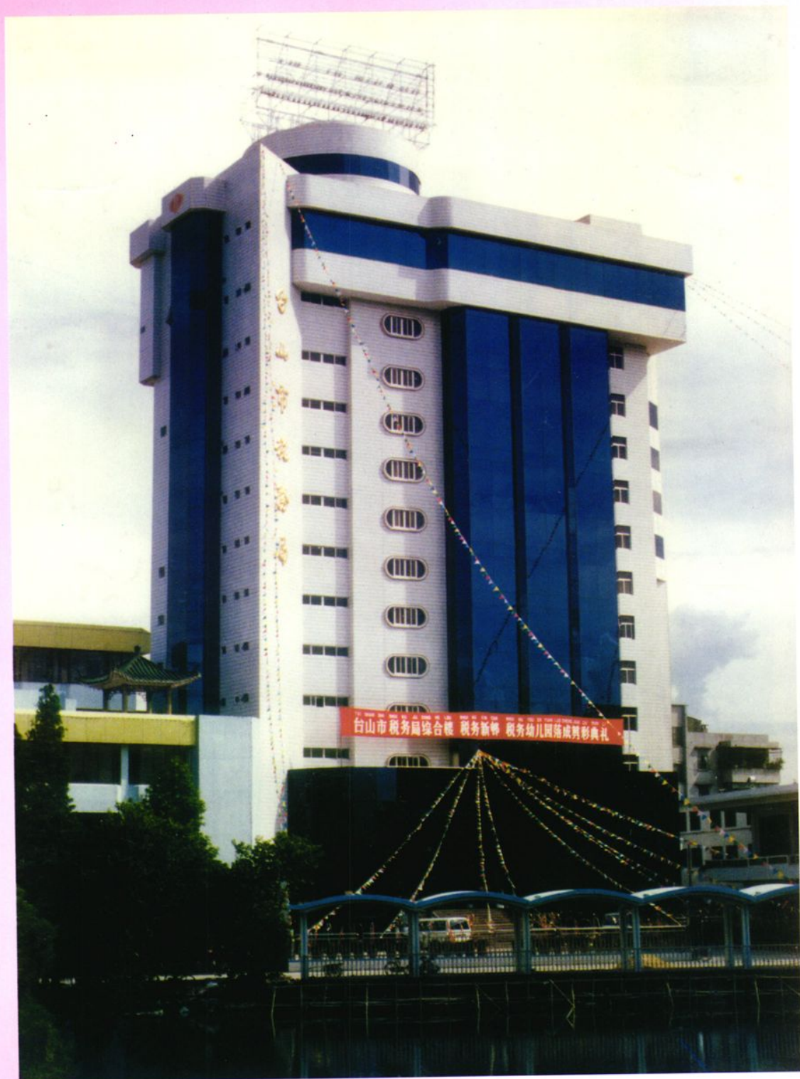
▲ 台山市税务局综合楼外景(1992年)