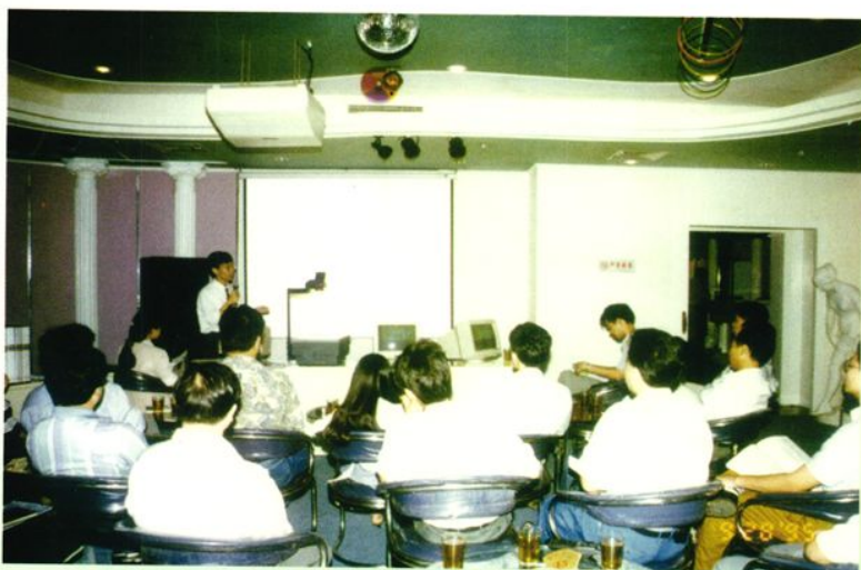
◀ 专家在市国税局 进行税收知识讲座