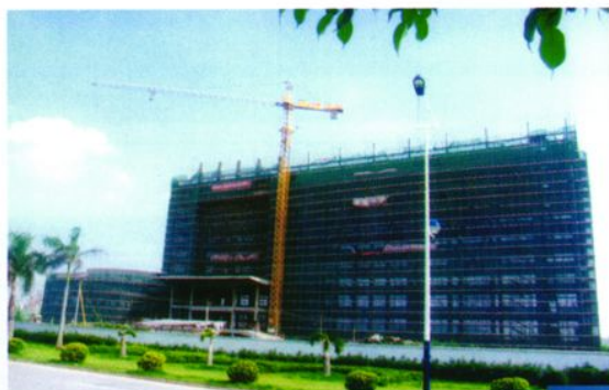
◀ 正在兴建中的台山市 国家税务局办公综合楼