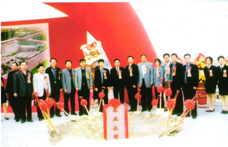
◀ 2002年12月18日 台山市国家税务局办 公综合楼奠基典礼