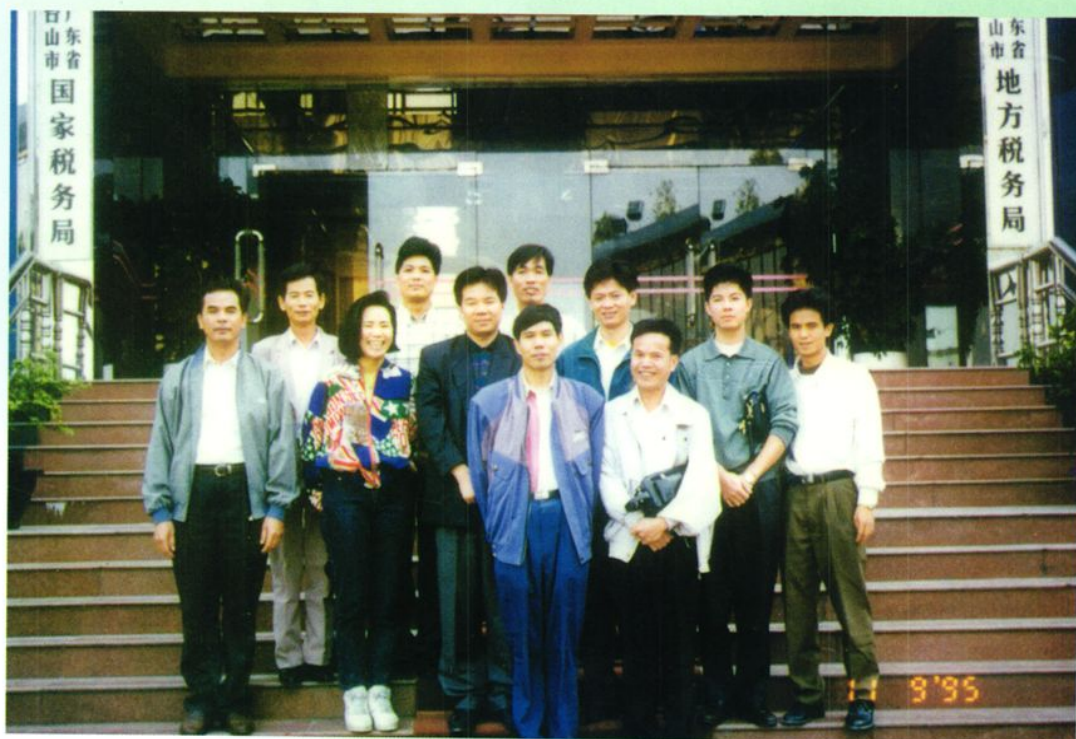
▲ 广东省国税系统部分市县首届后勤工作会议代表合影留念（1995年11月）