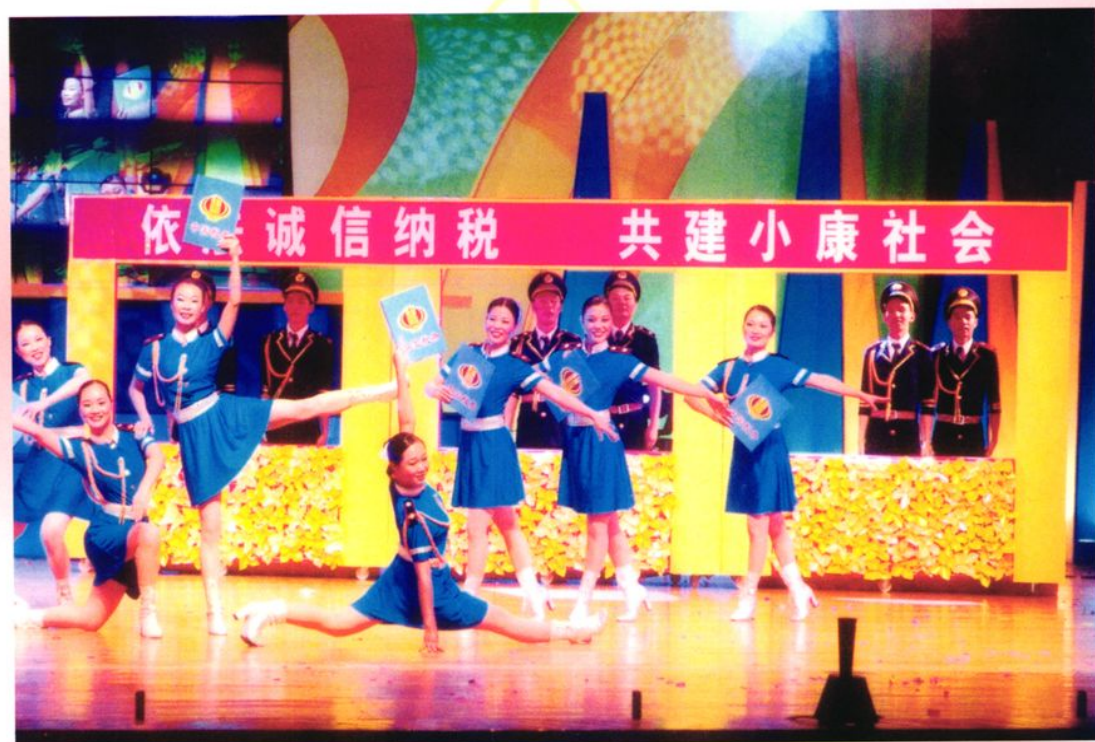
▲ 参加江门市国税系统第四届“税徽闪耀颂中华”文艺汇演比赛荣获一等奖（2004年）