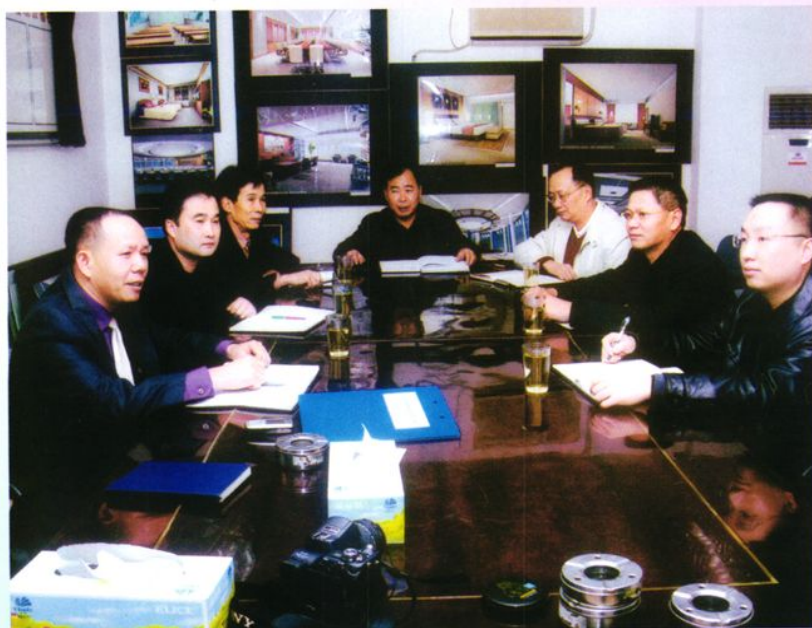
◀ 台山市国家税务局召开党组会议 (2005年12月)