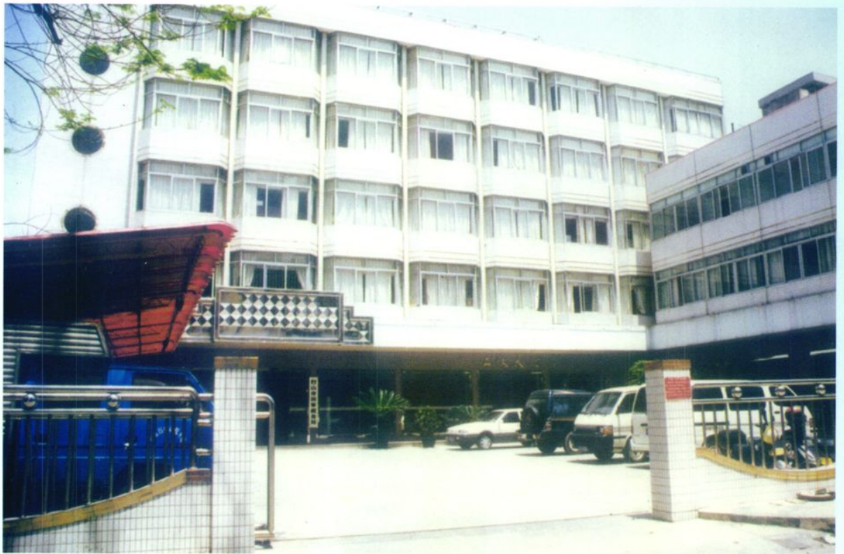
▲ 台山市国家税务局现办公楼(2005年12月)