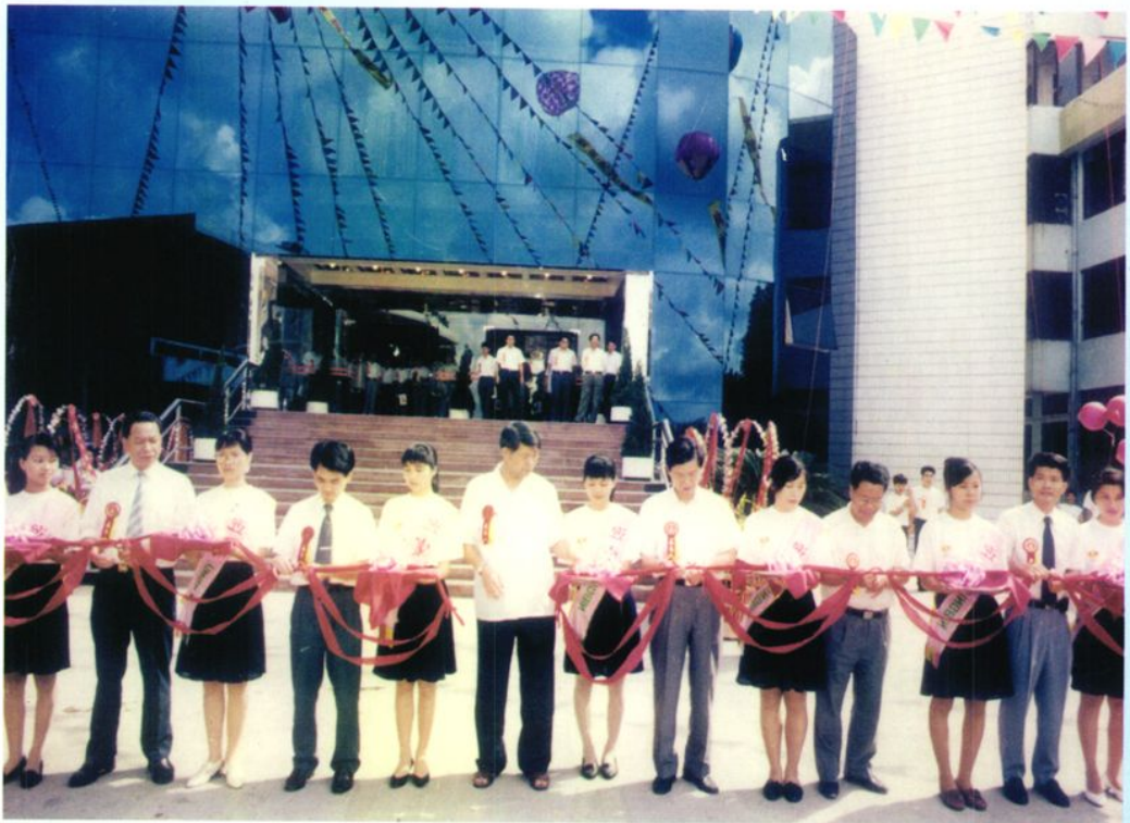
▲ 台山市税务局综合楼、税务新邨、税务幼儿园三项工程落成剪彩典礼会场。