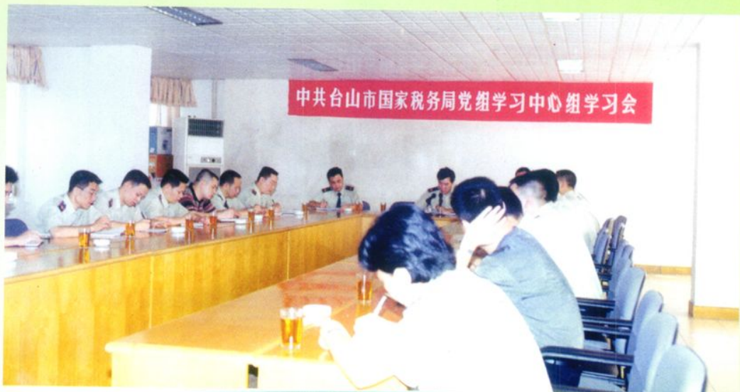
▲ 2003年台山市国税局党组召开中心组学习会