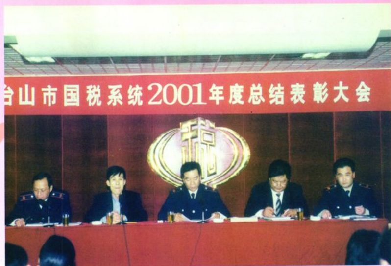
▶ 台山市国税系统2001年度总结表彰大会。