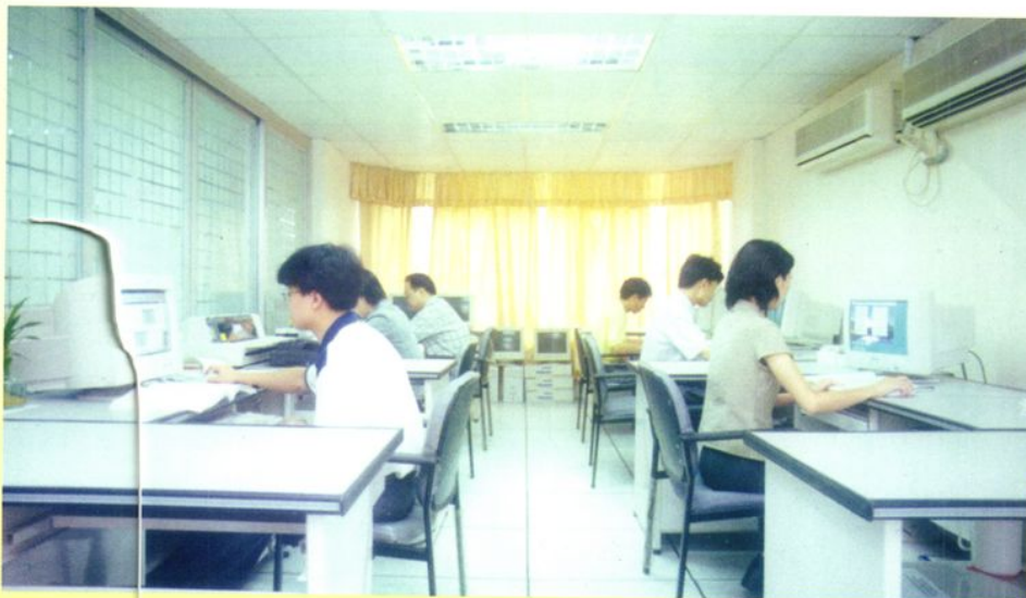
台山市国税局举 办计算机操作培训班