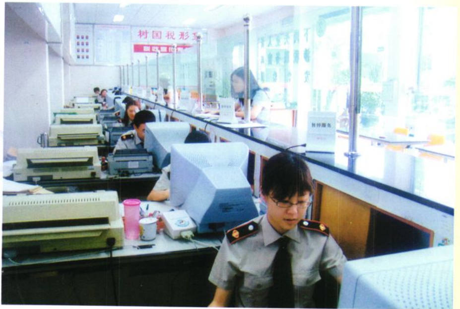
台山市国家税务 局办税服务厅一角