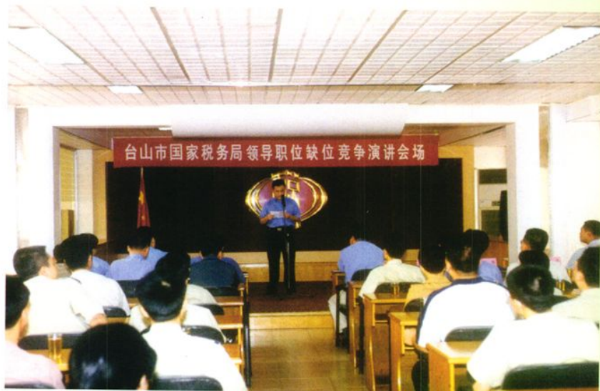
▶ 2002年台山市 国家税务局领导职 位缺位竞争上岗演 讲会现场