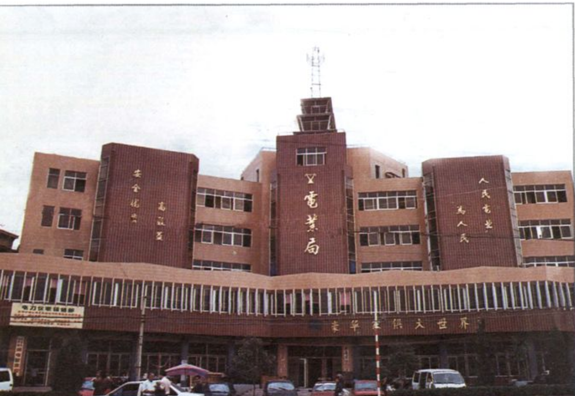
▽ 沈丘县电业局办公楼