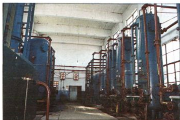
△ 沈丘县电厂化水车间