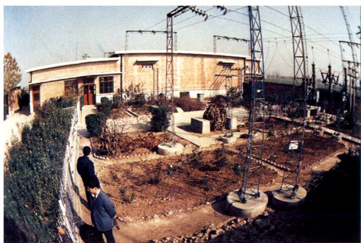
△ 西华 35 K V 王金庄变电站