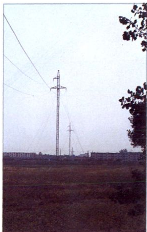
△ 35 K V 输电线路