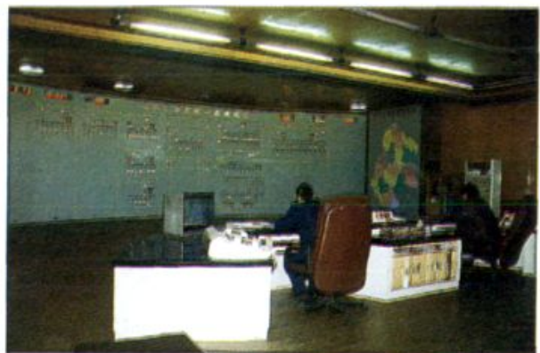
△ 项城市电业局调度大厅