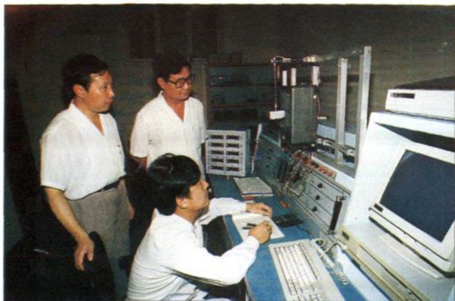
◁ 地区电业局校表室