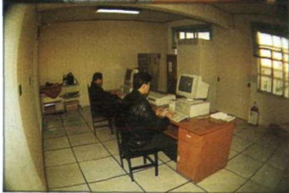
◁ 地区电业局远动室