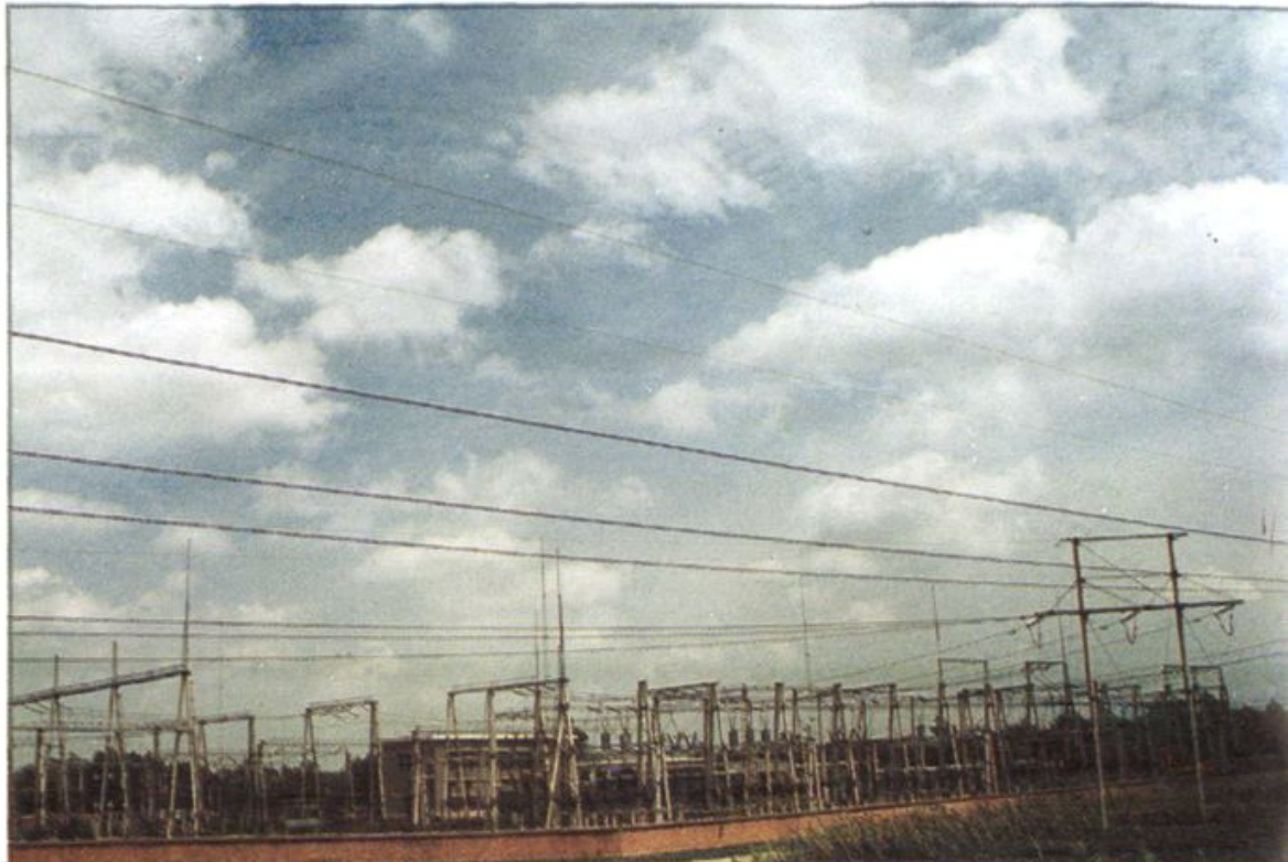
△ 淮阳 220 KV 变电站