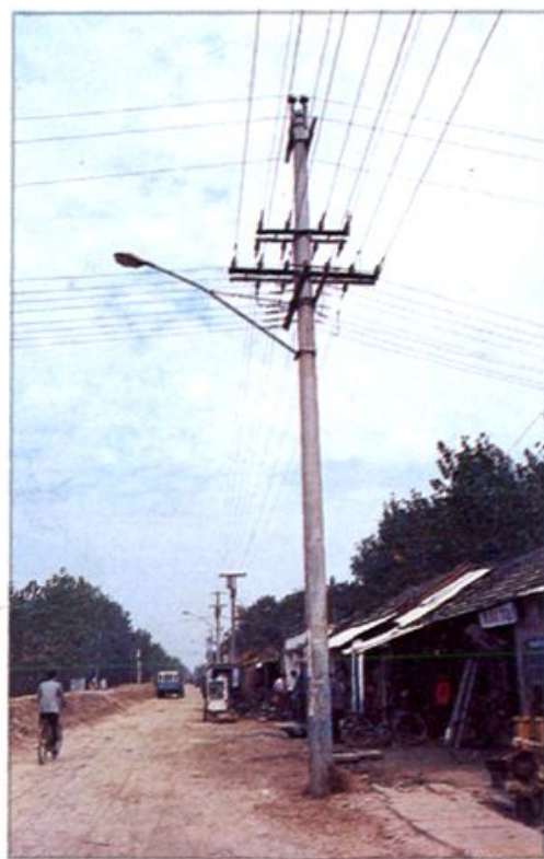
△ 沈丘县莲池低压线路