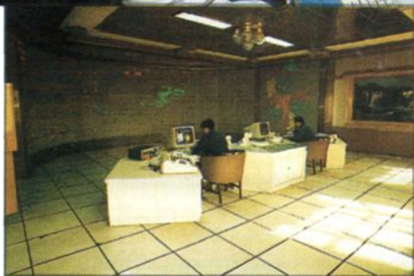
◁ 地区电力调度中心