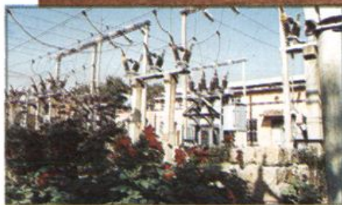
△ 鹿邑县北关变电站