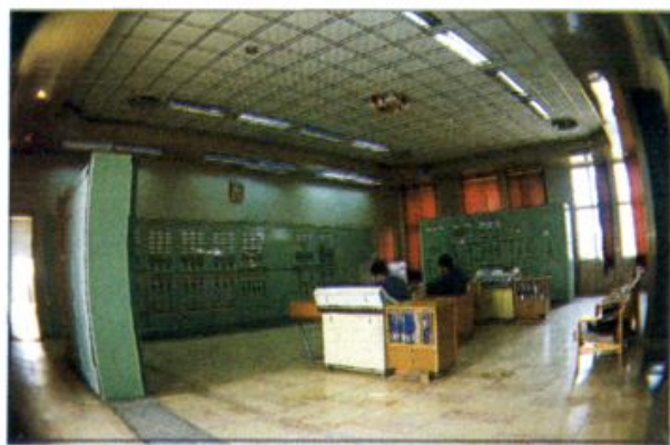
△ 淮阳 220KV 变电站控制室