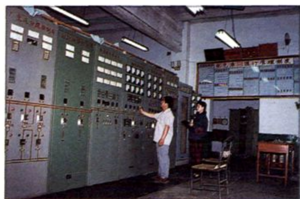
△ 太康县电厂调度室