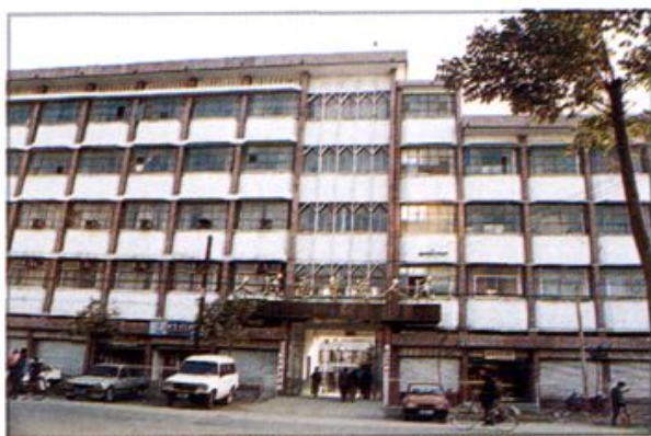
△ 郸城县电业局办公楼