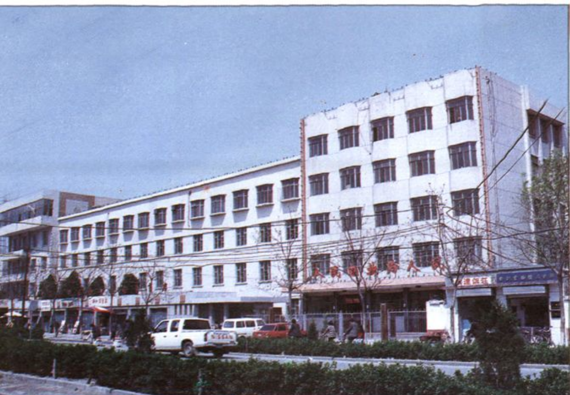
△ 地区电业局办公楼