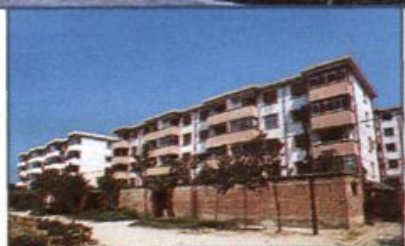
△ 地区电业局家属楼