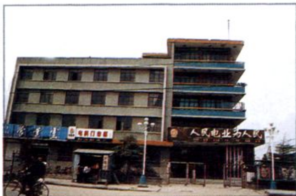
△ 商水县电业局办公楼