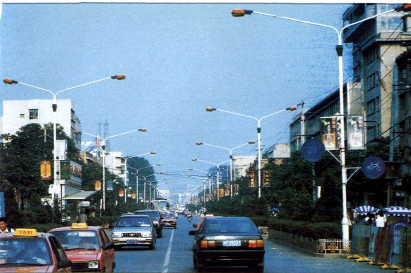
△ 周口市七一路市政用电