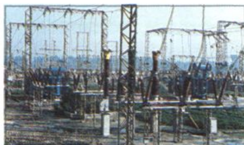
△ 扶沟县 110 KV 变电站