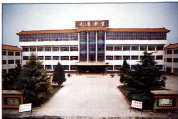
△ 太康县电业局办公楼