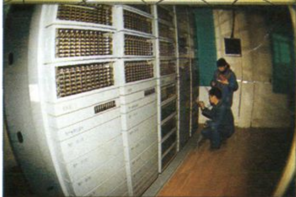
◁ 地区电业局程控交换机