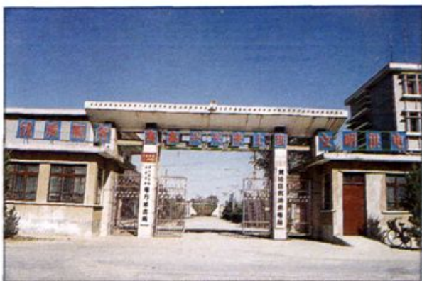
△ 黄泛区农场供电局