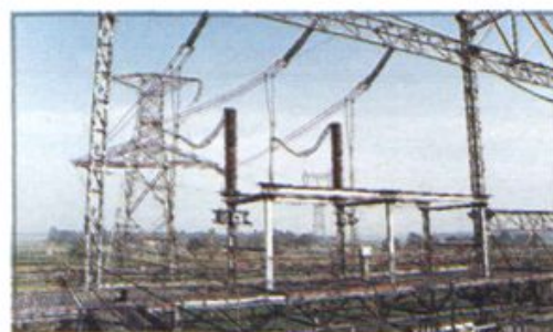
△ 220 KV 输电线路漯河出线处