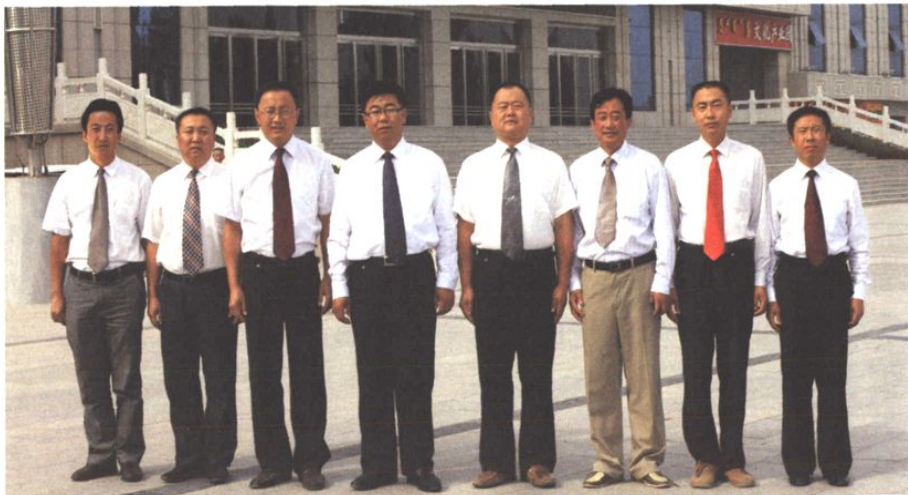
编纂委员会成员合影