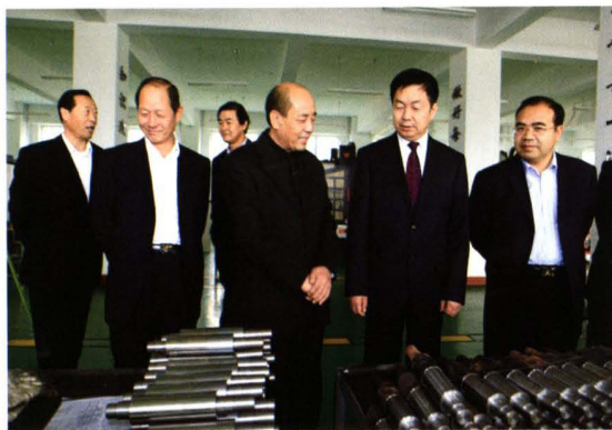
2011年10月,自治区党委常委统战部部长马三刚(中)莅临学院指导工作