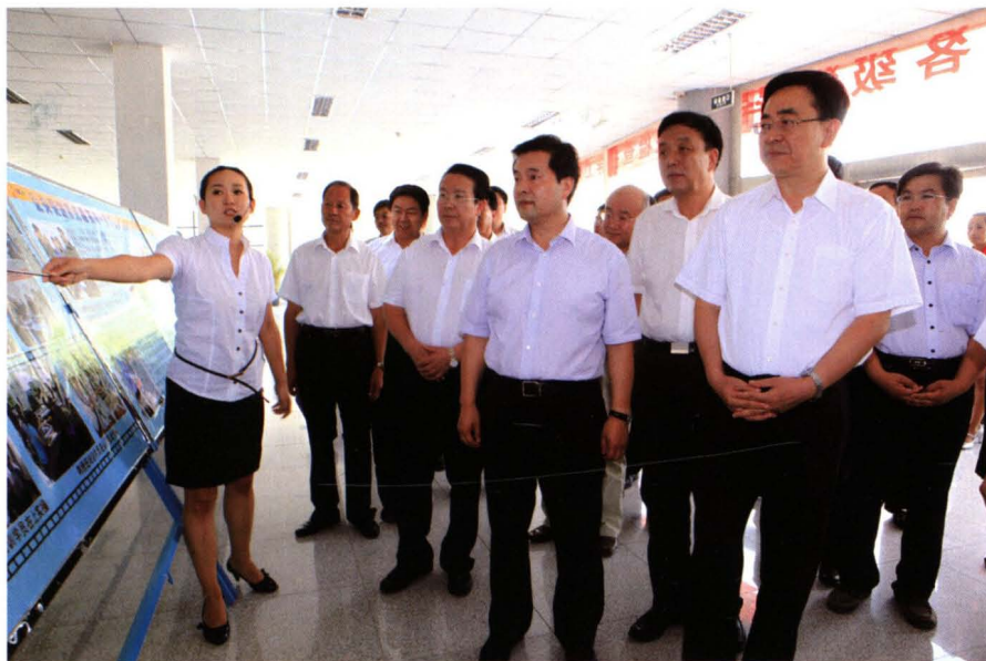
2011年8月,自治区党委书记张毅(右一)、自治区主席王正伟(右三)在吴忠市市委书记白雪山(右二)、吴忠市市长吴玉才(右四)的陪同下莅临学院指导工作