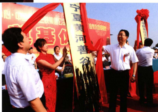
2011年8月，自治区党委书记张毅(右一)、自治区主席王正伟(左一)出席宁夏黄河善谷奠基仪式，并为残疾人培训中心和培训基地揭牌