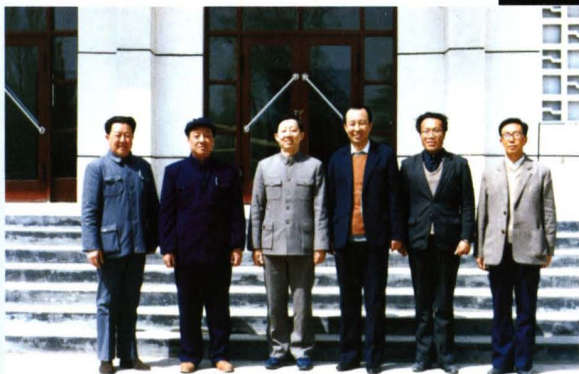
1990年4月，国家教委副主任邹时炎(中)在自治区教育厅厅长王凤峨(左二)、银南行署副专员张万葆(左四)陪同下视察学校