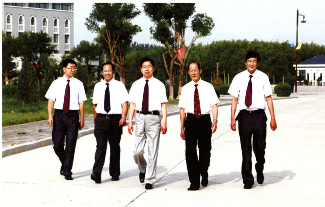
团结奋进的宁夏民族职业技术学院领导班子