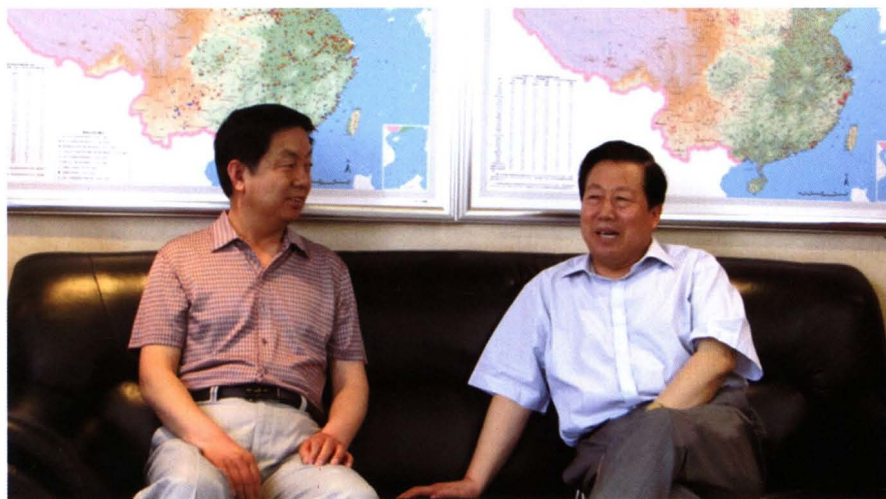
2012年5月,国家环保部部长周生贤(右)与学院党委书记温泽(左)亲切交谈,关心母校发展