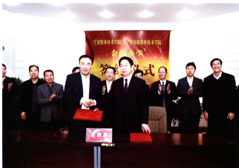
2011 年 12 月,学院与 宁夏职业技术 学院合作办学 签约仪式