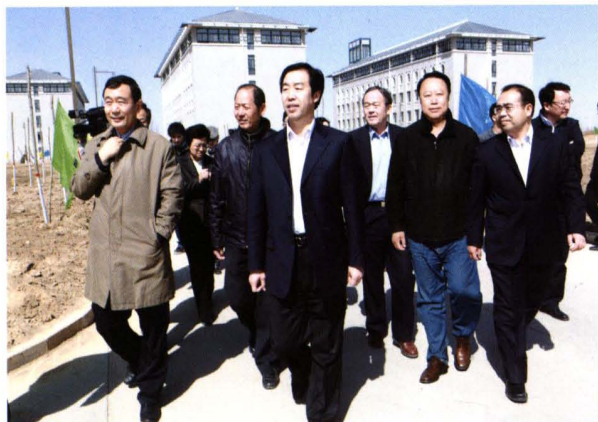
2010年4月,自治区党委书记于革胜(中)在教育厅厅长郭虎(左一)的陪同下视察学院工作