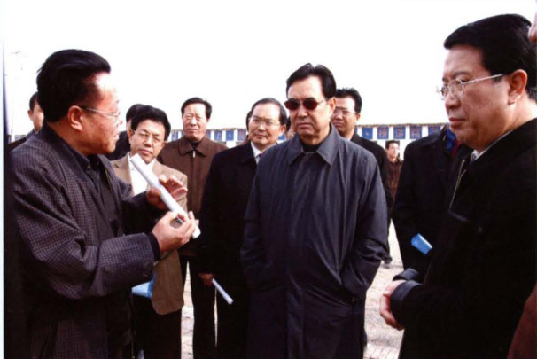
2005年11月，自治区主席马启智(中)视察学院