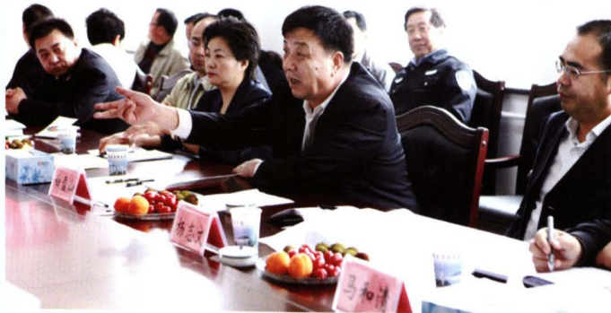
2010年5月,吴忠市市委书记白雪山(右二)视察学院