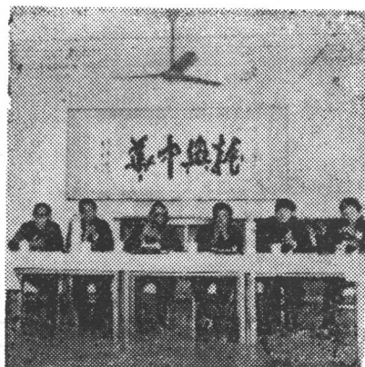
泰山志编纂工作会议会场