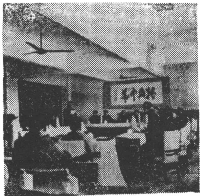
各级与会领导同志