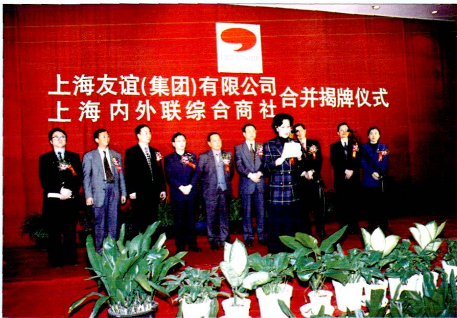
1997年11月20日，国内贸易部部长陈邦柱（左五）参加上海友谊（集团）有限公司、上海内外联综合商社合并揭牌仪式