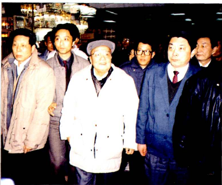
1990年1月5日，国家主席杨尚昆（左三）视察上海华联商厦