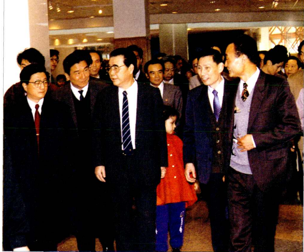
1993年4月17日，国务院总理李鹏（前排左三）视察上海东方商厦