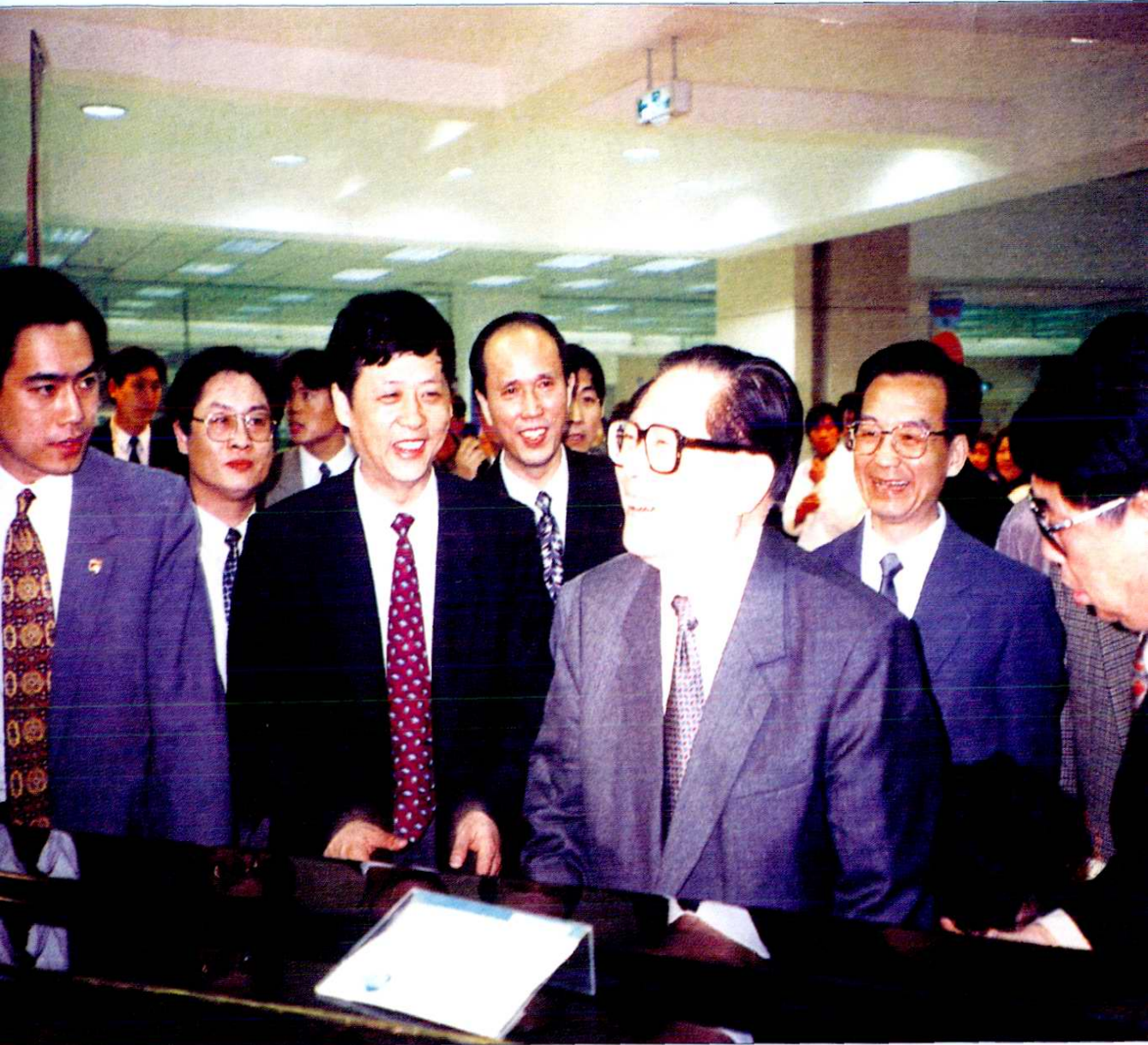
1996年4月27日，中共中央总书记、国家主席江泽民（右三）视察上海第一八佰伴有限公司新世纪商厦