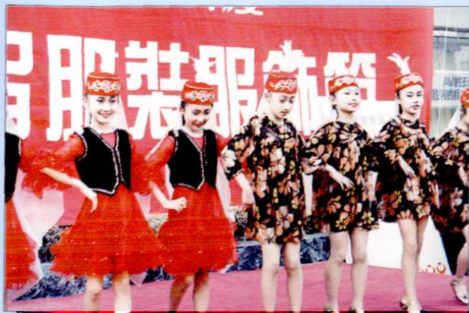
国际商厦服饰节广场促销活动