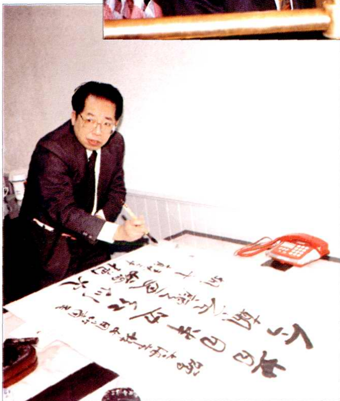
1992年10月，商业部部长胡平为上海妇女用品商店题词