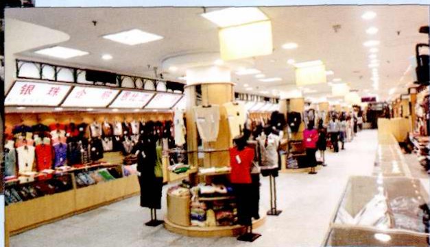
时装公司羊毛衫商场