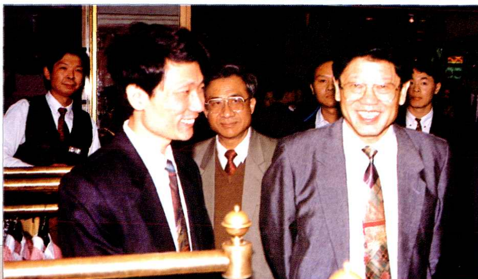
1994年11月12日，国务委员李铁映(右一)视察上海东方商厦