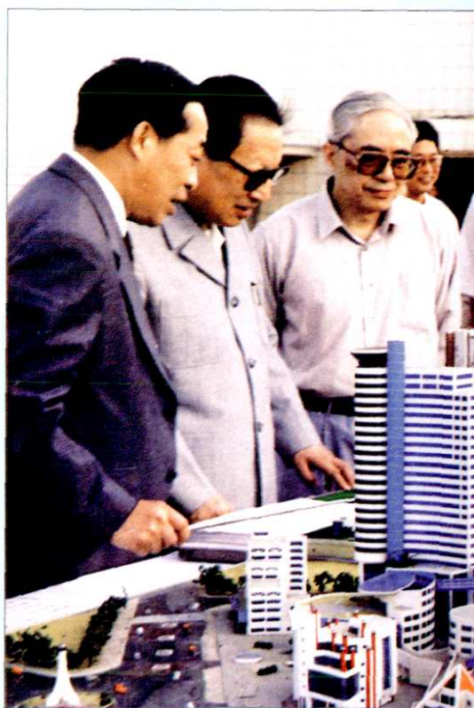
1993年9月24日，全国人大常委会委员长乔石（左二）听取徐汇区国际商城发展规划的汇报