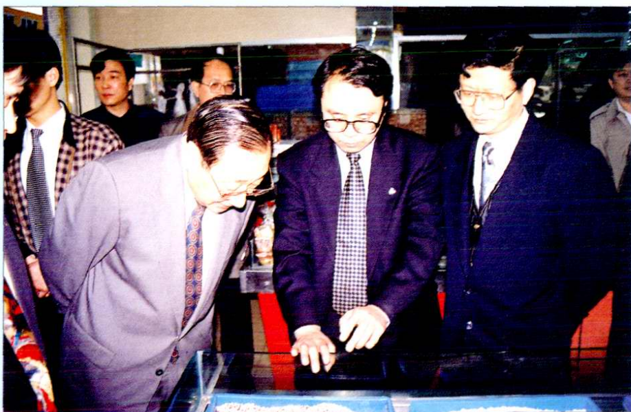
1997年4月，国务院副总理李岚清（右三）视察上海联华超市