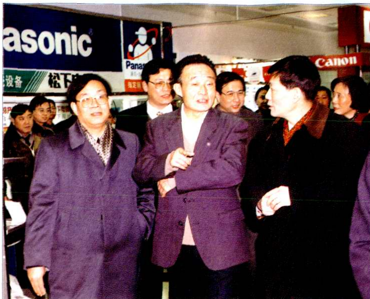
1998年2月28日，国务院副总理吴邦国（前排中）视察上海市第一百货商店东楼