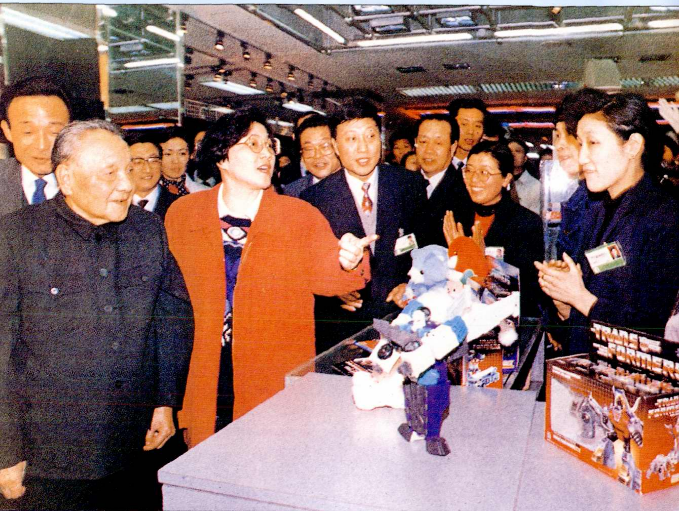
1992年2月18日，邓小平同志（前排左一）视察上海市第一百货商店