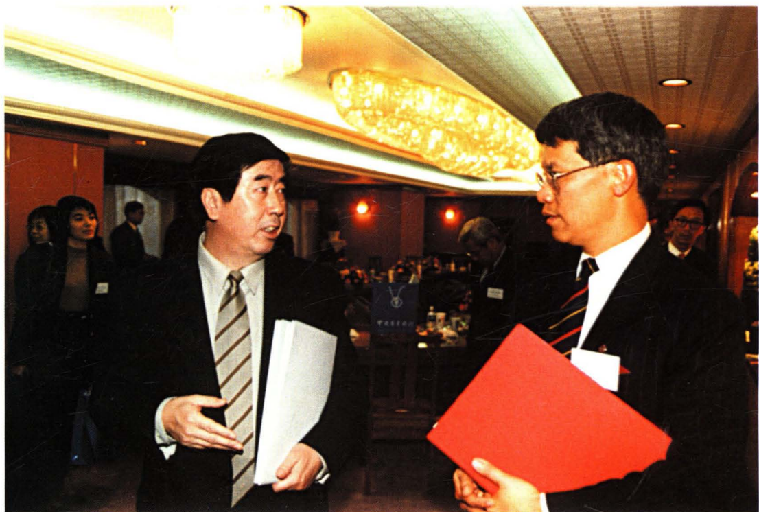
1994年12月，史纪良行长会见香港金融管理局总裁任志刚先生。