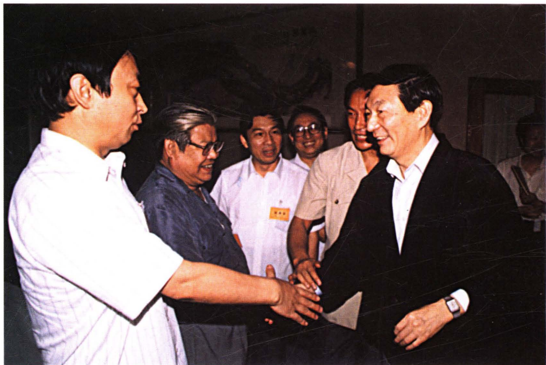
1993年8月，国务院副总理兼中国人民银行行长朱镕基，接见全国农村金融旺季工作会议代表。