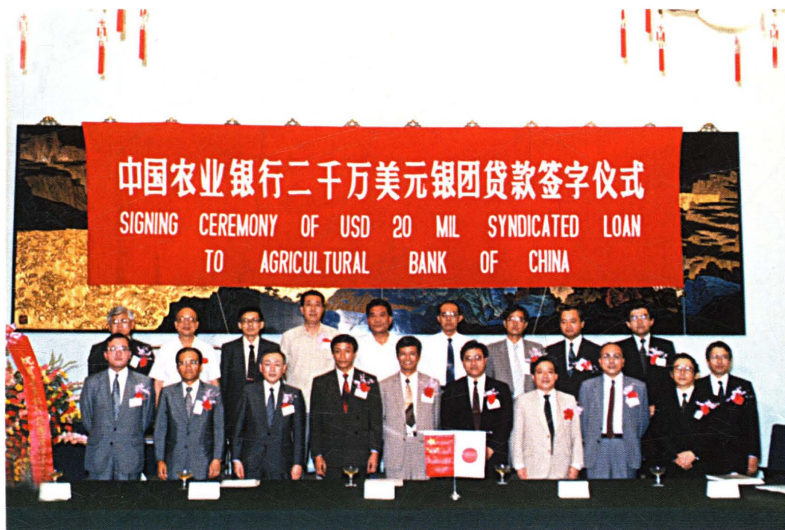
1992年9月，中国农业银行二千万美元银团贷款签字仪式在京举行。