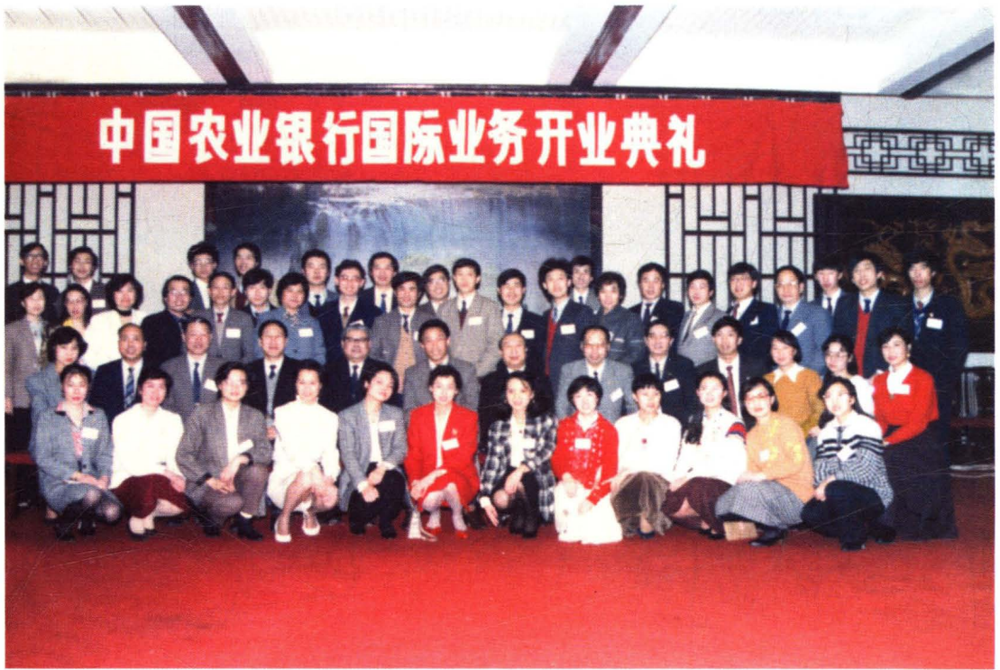
1989年1月27日，总行国际业务部开业典礼。