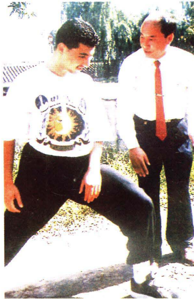
传授实践手把手 汗水浇灌武院春