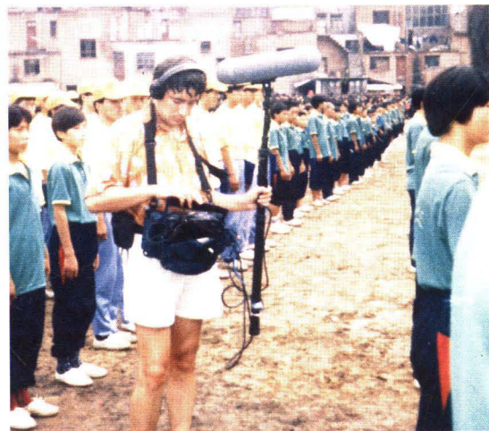
1995年9月，德国电视台来校采访秋运会