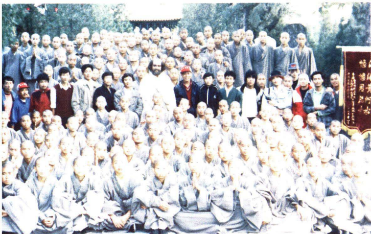
1993年，本校协助香港唯一中央新影少林达摩剧组拍摄《达摩祖师》功，剧组赠旗并与学员合影