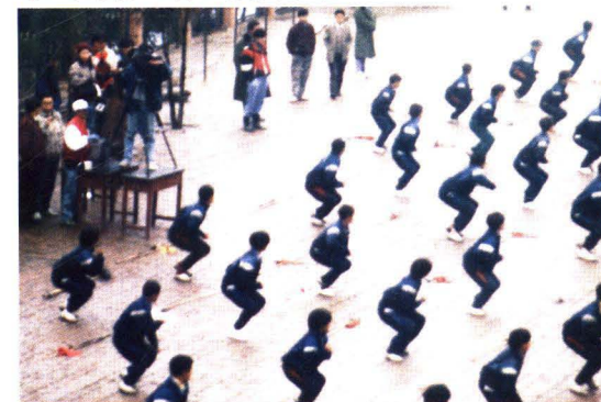
1997年2月，日本浦合市友好观光采访团来校拍摄