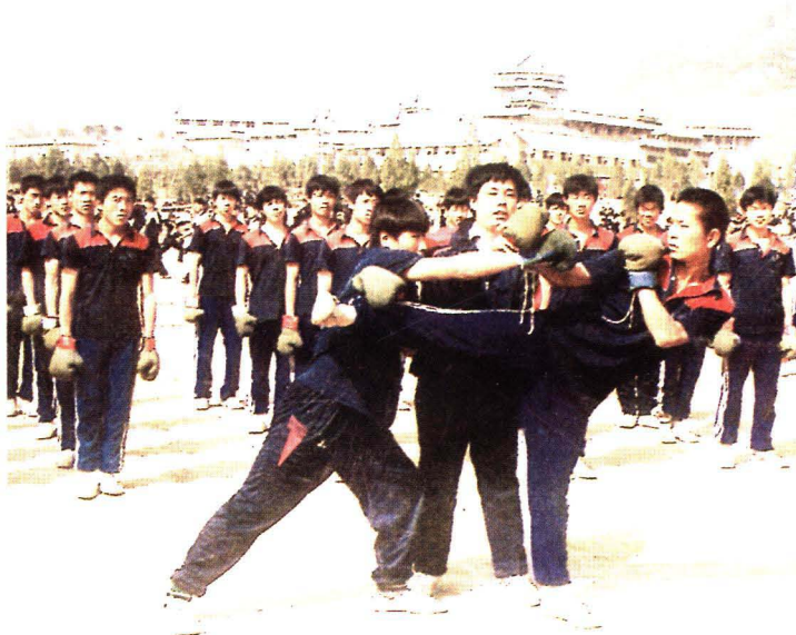
讲解少林功夫真谛 推动武术走向世界