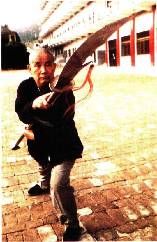
雄风不减当年 精演春秋大刀