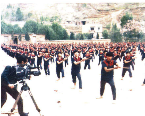
1995年4月，新加坡华文时事节目组来校拍摄