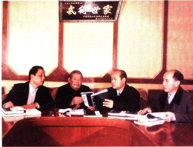
父子四杰 振兴武学