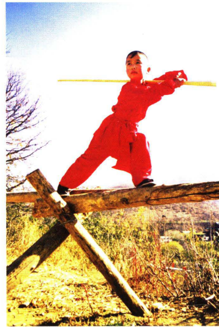
九世演武六代寺内 武树根深枝繁叶茂