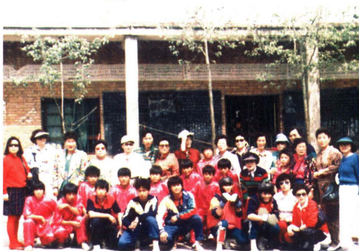
1996年8月，新加坡旅游团观看武术表演后与学员合影