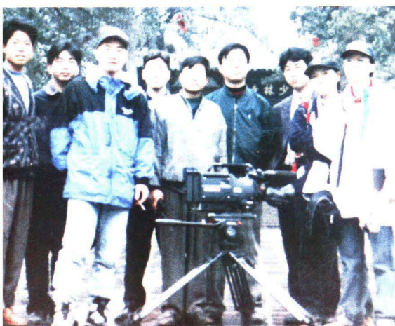
1996年1月，韩国影像世界拍摄组来校拍摄镜头