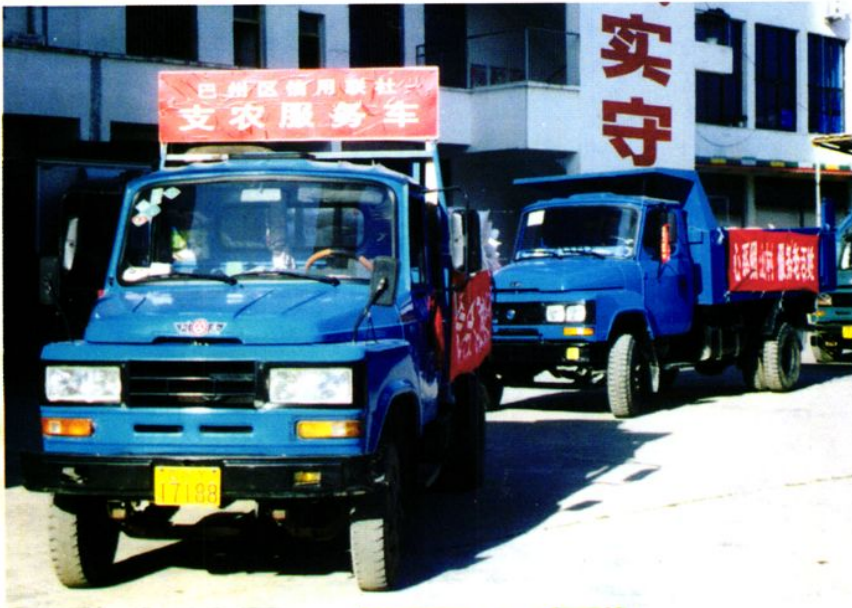
联社开展经常性的资金、物质、信息“三下乡”活动，为农民捐助急需的农用物资。