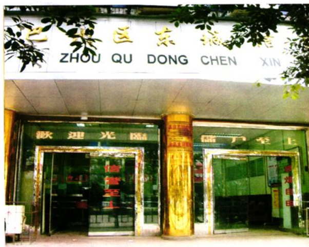
东城农村信用社营业室外景。