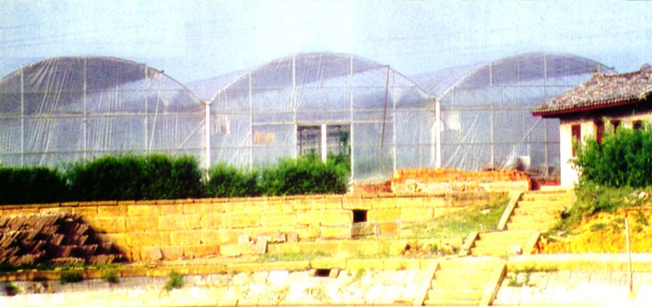
联社扶持农户种植大棚蔬菜。