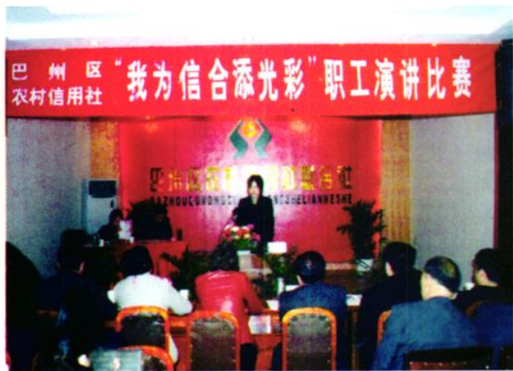
联社组织信用社职工开展“我为信合添光彩”为主题的演讲比赛。