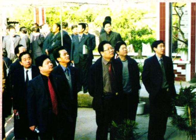
巴州区人民政府召开创建“信用村(镇)”工作总结会议,组织全区各工委、办事处及区级各部门负责人、信用社主任、信贷员参观首批评为信用村的甘泉乡园艺村。