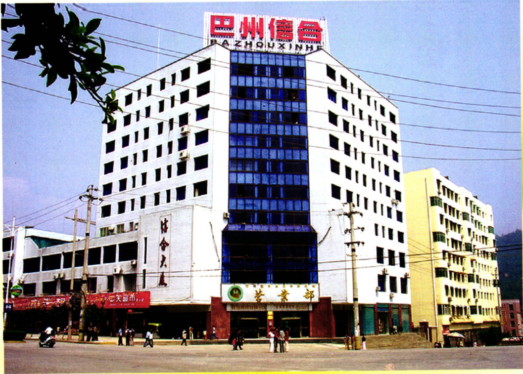
巴州区农村信用社联合社办公大楼