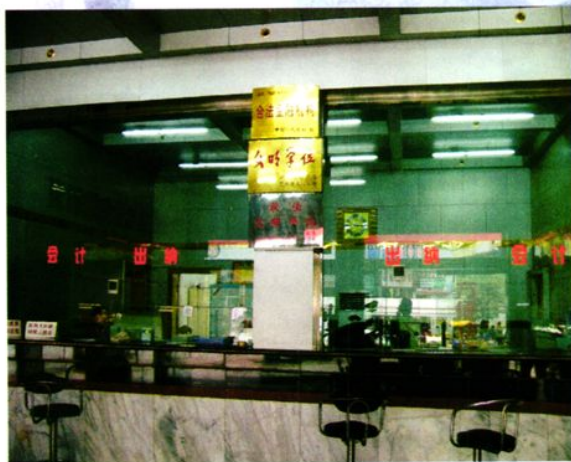
西城农村信用社营业大厅。