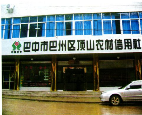
顶山农村信用社综合楼。