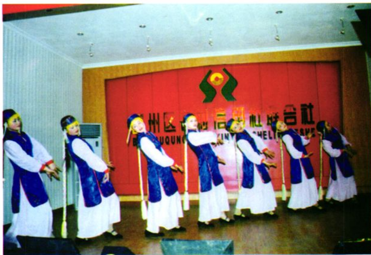
联社组织职工开展经常性的业余文艺演出活动。