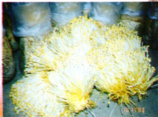
城守农村信用社支持城郊农民栽培食用菌—金针菇。