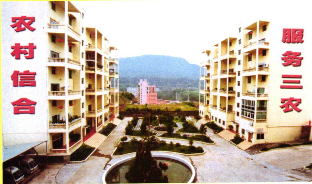
联社机关职工住宿、生活区