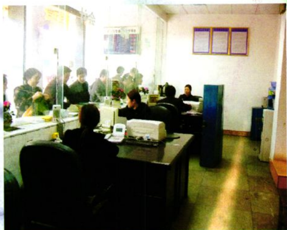
恩阳农村信用社营业室。