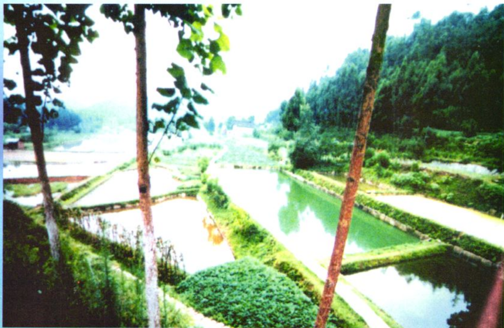
恩阳农村信用社支持建成的鱼苗繁殖基地。