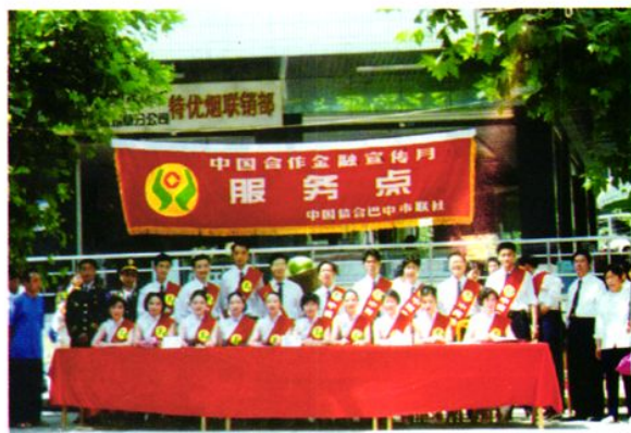
联社组织流动服务宣传队，深入城乡开展金融宣传服务。