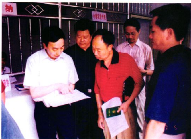
省政府副秘书长杨刚才(左一)在市委书记杨安民(左二)、市委副书记、市长熊光林(右二)及巴州区联社理事长谢书臣(右一)的陪同下,在巴州区农村信用社调研小额农贷的开展情况。