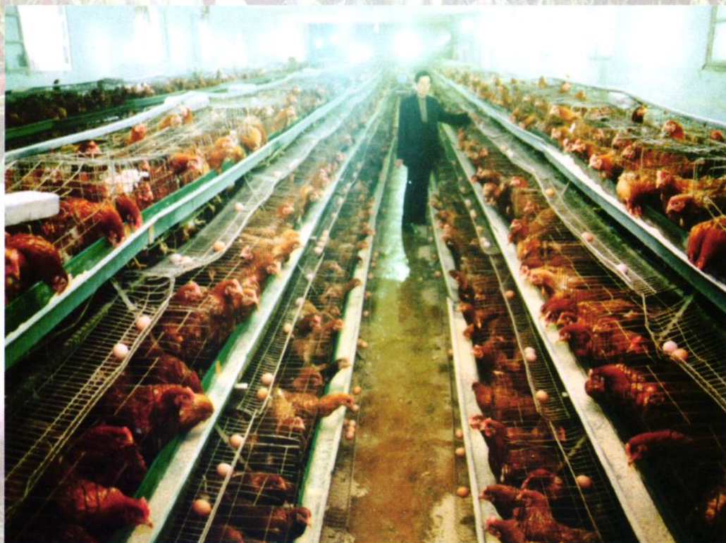
清江农村信用社支持的兴旺养殖场，日均产蛋200市斤。