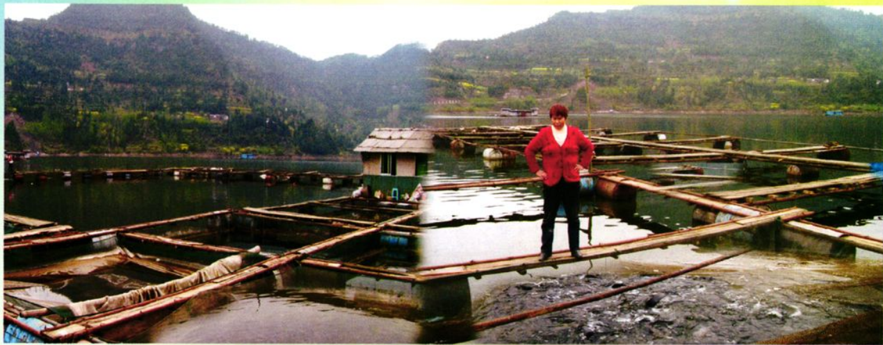
化成农村信用社支持农民承包化成水库，在水库散养鱼的同时，利用水面进行网箱养鱼，成为当地一枝独秀的水上人家。