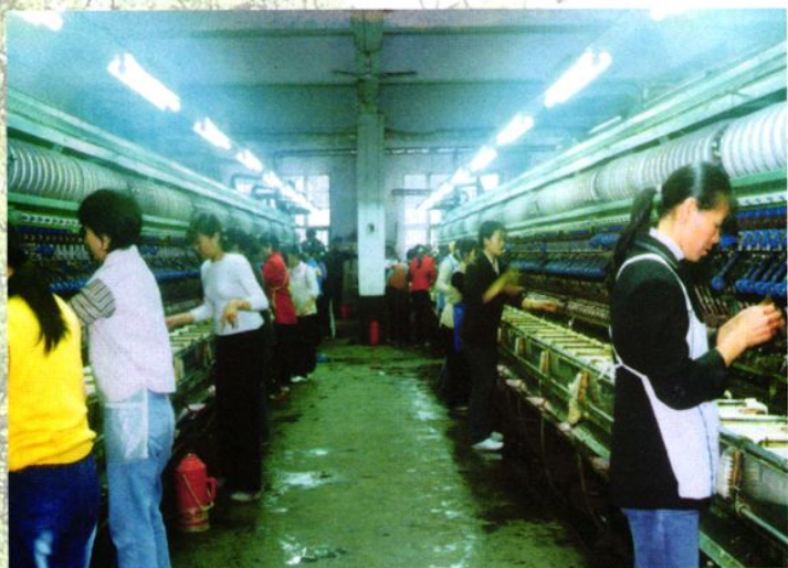
渔溪农村信用社支持乡镇企业发展。图为三河丝绵厂生产车间。