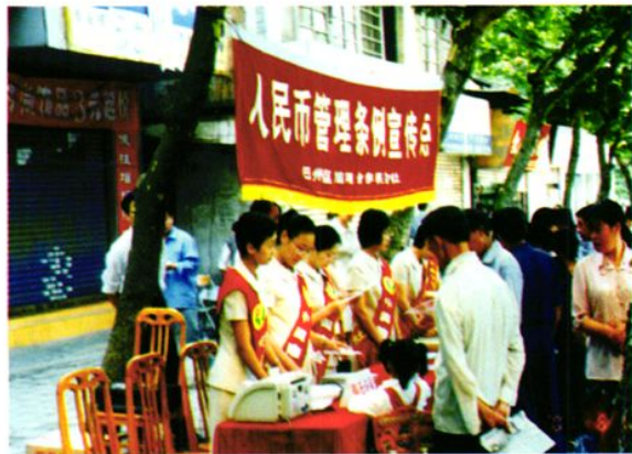
联社组织机关人员在农村宣传《人民币管理条例》。