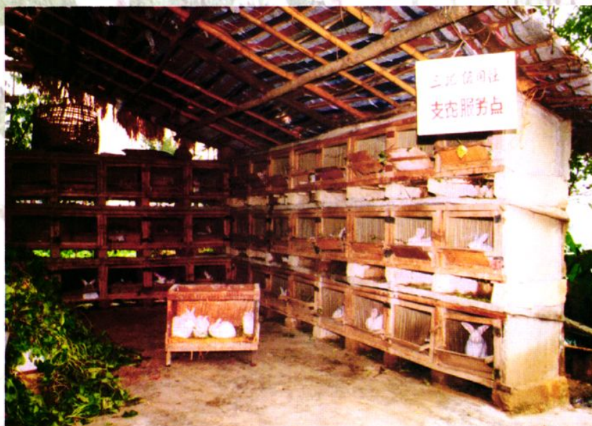
三汇农村信用社支持农民发展长毛兔养殖。