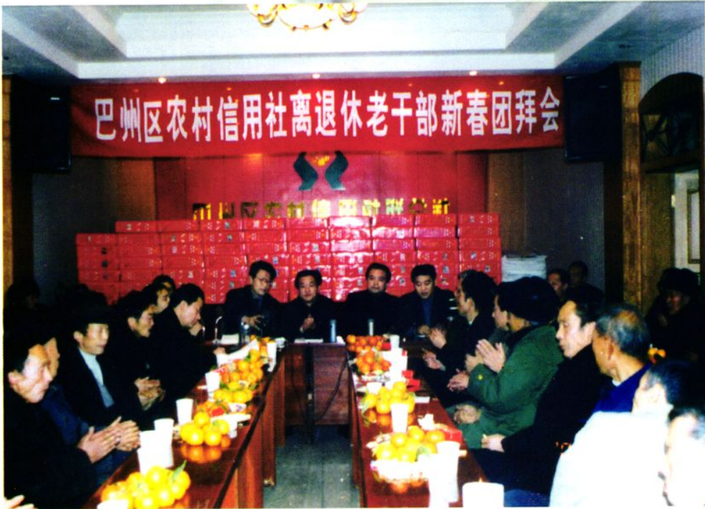
联社召开一年一度的离退休老同志新春团拜会。