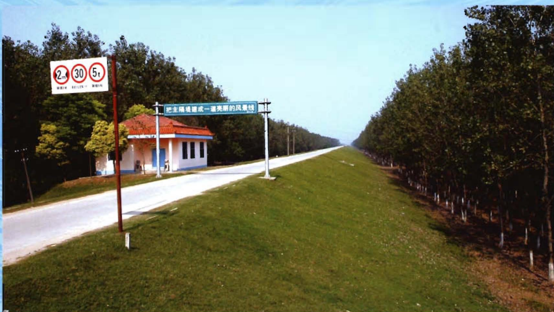
洪湖分蓄洪工程主隔堤