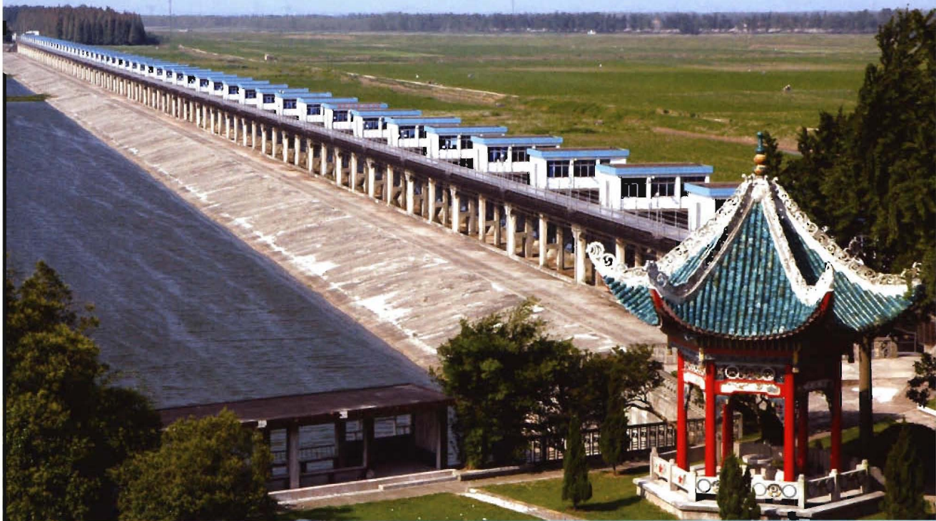
荆江分蓄洪工程北闸