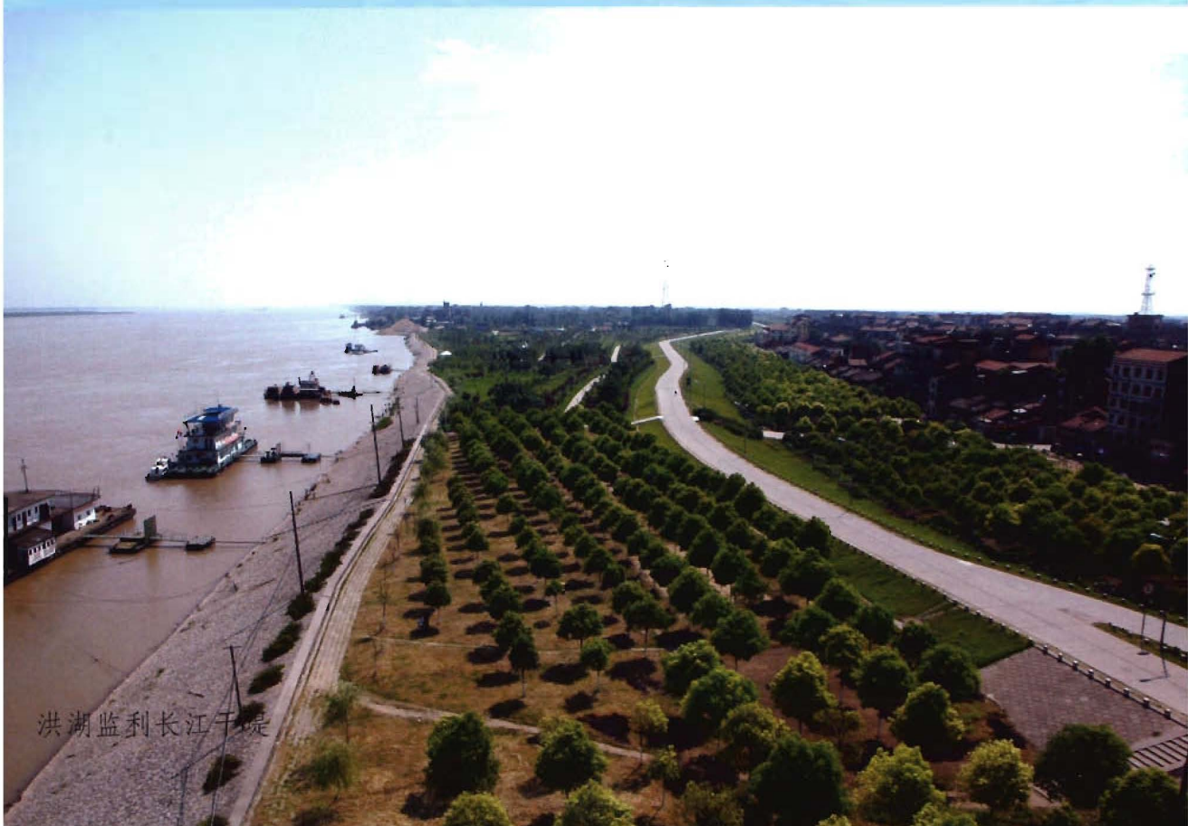
洪湖监利长江干堤