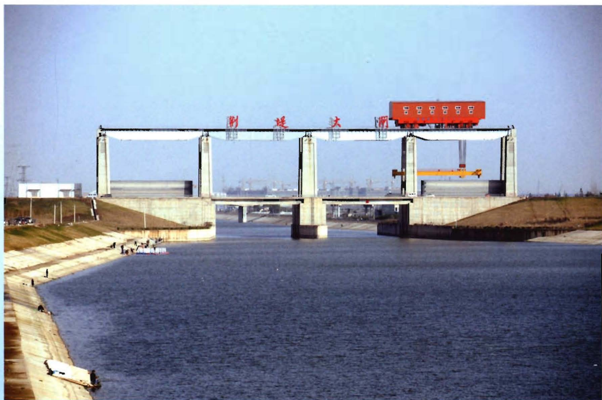
引江济汉工程防洪闸