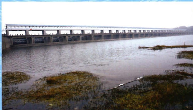
汉江杜家台分洪闸