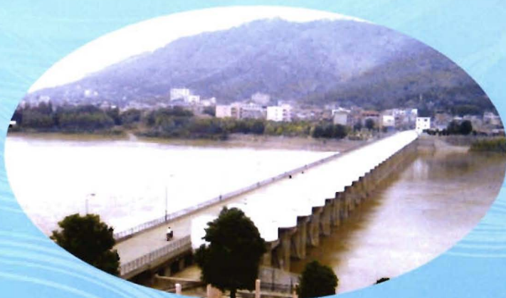
荆江分蓄洪工程南闸