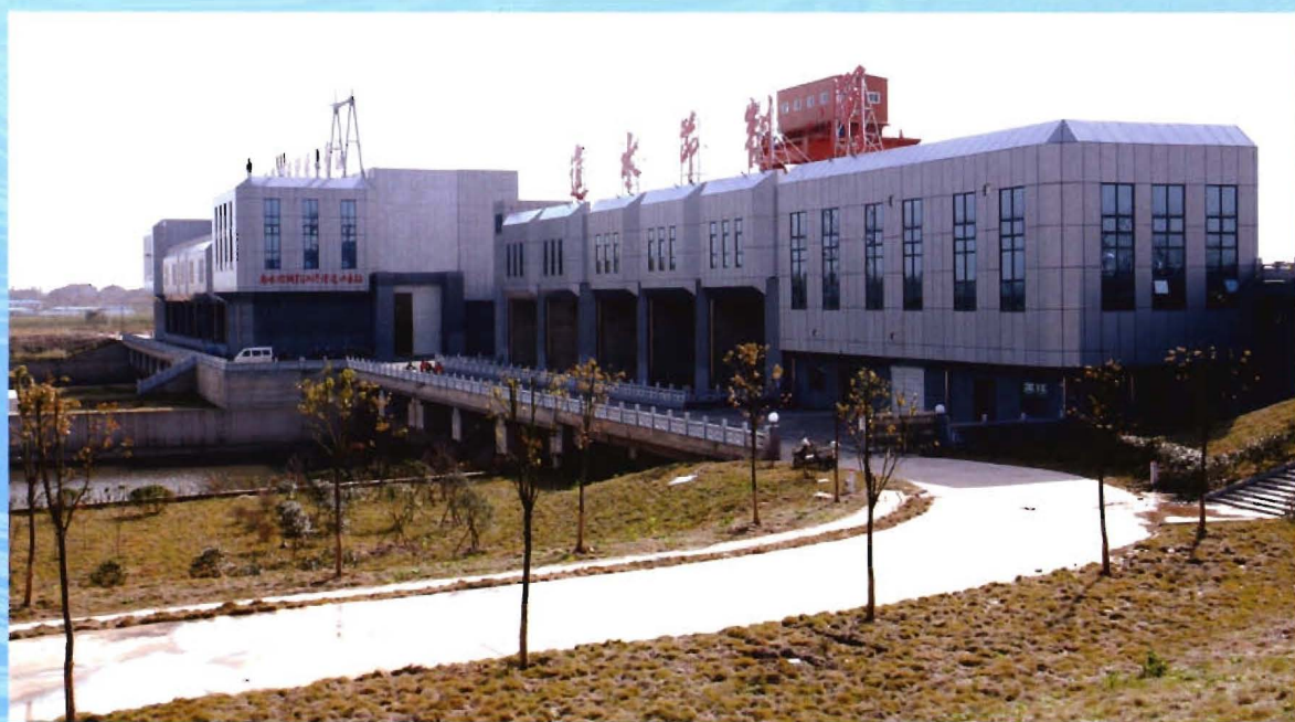
引江济汉工程节制闸、泵站