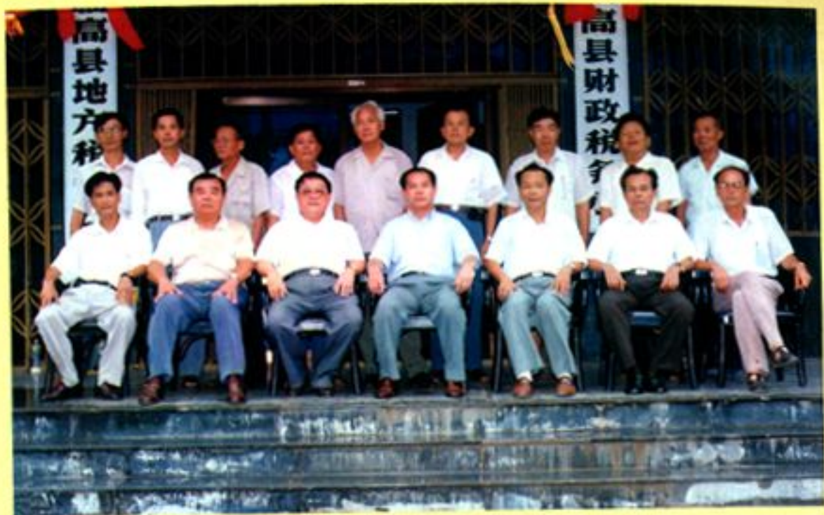
评审志稿人员合影