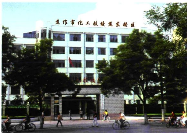
焦作市化工技校焦东校区校门