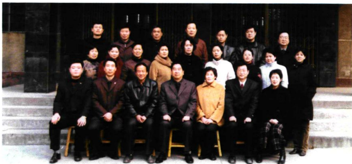
《焦作市化工技工学校志》评审会议合影（2004年2月11日）