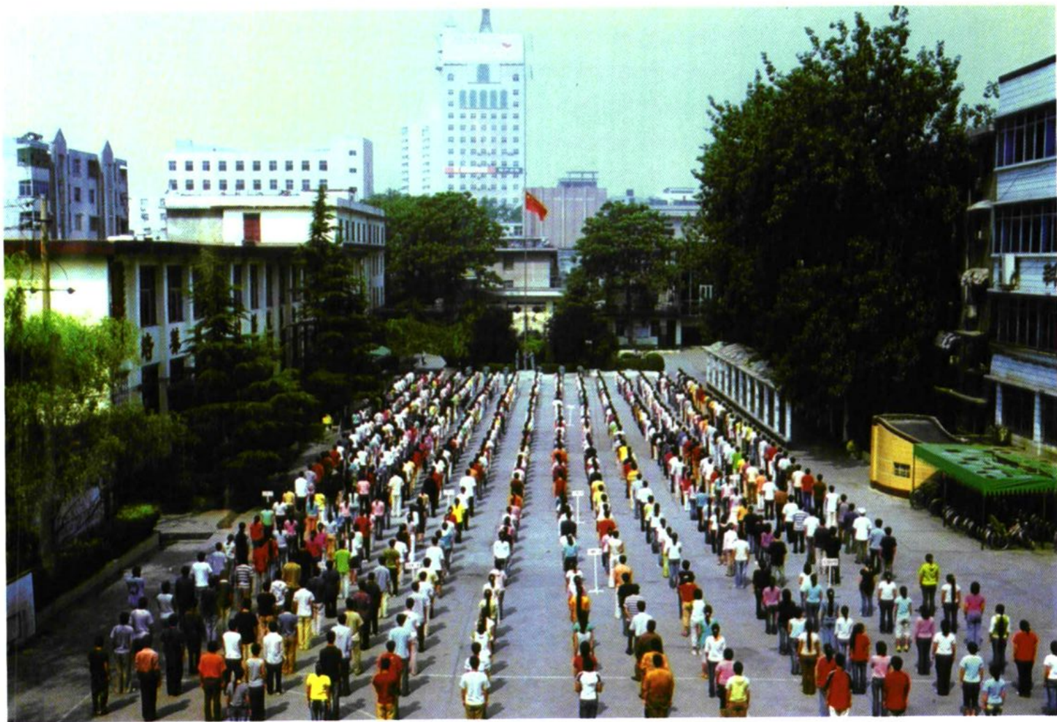
焦作市化工技校主校区