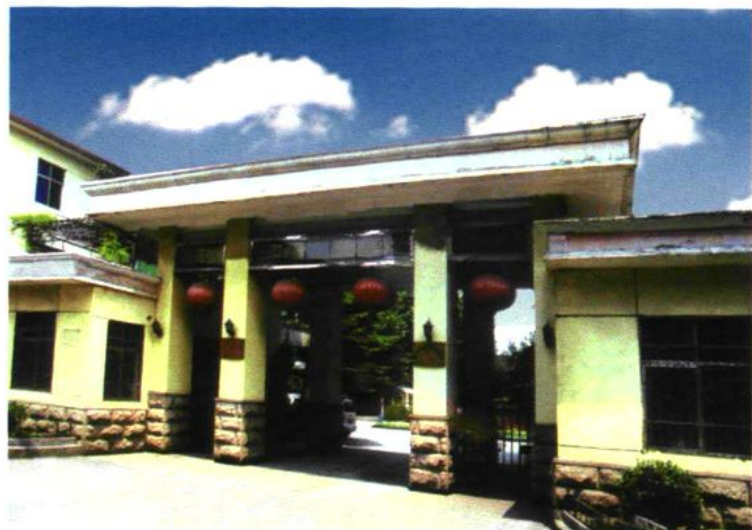
焦作市化工技校主校区校门