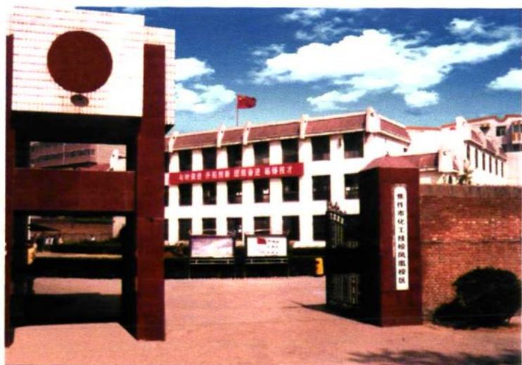
焦作市化工技校凤凰校区校门