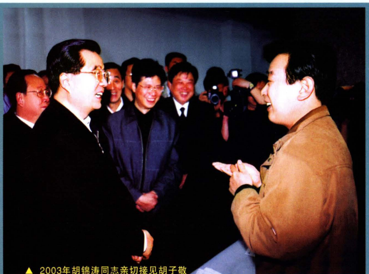
▲ 2003年胡锦涛同志亲切接见胡子敬