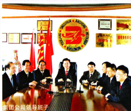
集团公司领导班子