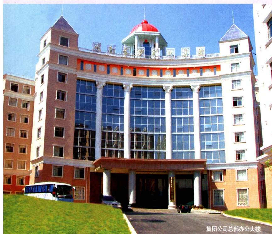
集团公司总部办公大楼