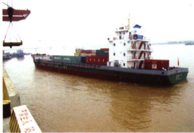
▲ 2005年5月22日，长沙港接纳有史以来最大的江海轮。

湖南长沙新港有限责任公司创建于2004年5月，位于长沙市开福区新港镇，是一家依托长沙新港，经营港口水运现代物流的国有独资公司，拥有固定资产6亿元。公司经营范围包括水上客货运输，航运业务代理、港口装卸、货物中转、船舶服务及配件加工，船舶拖带，公路运输及配载服务，船舶生产原材料，砂石购销，港务相关信息咨询服务等。