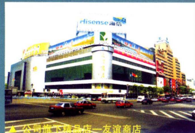
▲ 公司旗下精品店—友谊商店