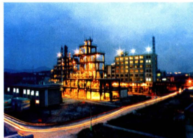
▲ 株化集团翔宇公司生产装置夜景