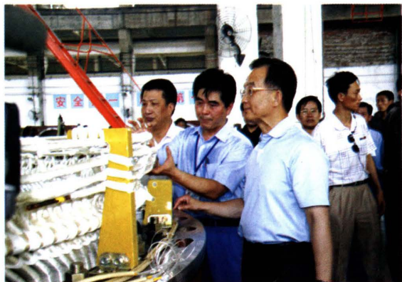
▲ 周建雄与温家宝总理合影