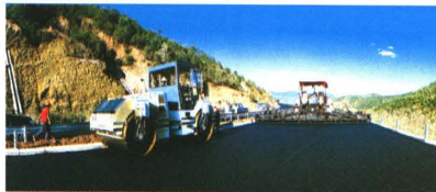
▲ 沥青摊铺机、双钢轮-1