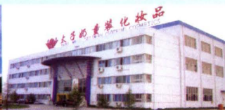
▲ 太子童装化妆品基地