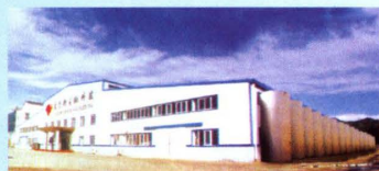
▲ 太子奶北京生产基地