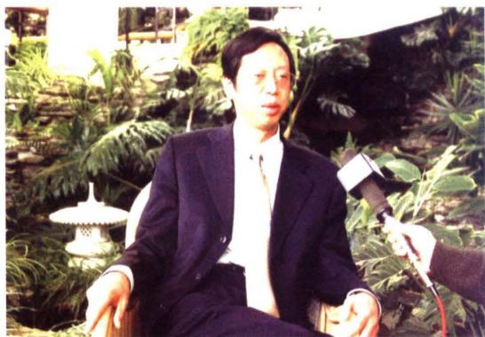
公司董事长：李建新

李建新，男，汉族，1953年10月出生，中共党员，硕士研究生，高级工程师（正高），现任长丰（集团）有限责任公司（原中国人民解放军第七三一九工厂）董事长、党委书记，中国企业联合会、中国企业家协会副会长，十届全国人大代表。1984年，李建新经民主选举担任中国人民解放军第七三一九工厂厂长，1996年企业改制后任长丰集团董事长。他积极推进“以专制胜”的竞争战略，把长丰集团打造成为了全国最大的轻型越野车生产企业之一。先后荣获“全国劳动模范”、“全国五一劳动奖章”、“全国百强企业家”、“湖南省劳动模范”、“2003年度全国优秀创业企业家”等荣誉称号；2005年被评为“湖南省有特殊贡献专家”，享受国务院特殊津贴。