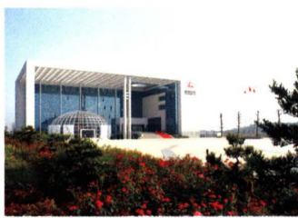
▲ 长丰集团星沙生产基地办公大楼