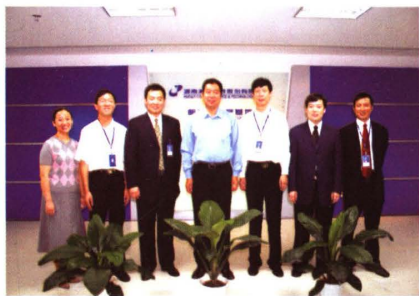
▲ 公司领导班子成员

湖南湘邮科技股份有限公司是在上海证券交易所挂牌上市的股份制高科技企业，股票代码是：600476。公司主要从事计算机软件开发、系统集成、通信设备研制、建筑规划设计、计算机产品代理等业务。 公司作为“中国邮政第一股”是全国邮政系统重点科研和技术支撑单位，被国家邮政局认定为“国家邮政局高新技术研究所”、“国家邮政局科技发展中心”，并率先在全国邮政系统设立“博士后工作站”，负责全国邮政的科技研究和技术支撑工作。公司2000年被科技部认定为“国家火炬计划软件产业基地长沙软件园骨干企业”；2001年获湖南省科学技术厅颁发的“高新技术企业认定证书”，获湖南省信息产业厅颁发的“软件企业认定证书”和“系统集成一级资格证书”，CCIC质量认证中心颁发的ISO9001—2000版质量体系认证证书；2002年，获信息产业部颁发的“系统集成二级资格证书”和建设部认定的“国家通信设计甲级资质”；2003年被认定为“国家规划布局内重点软件企业”，获“第一届中国技术市场金桥奖”；2004年公司获“中国企业管理创新成果奖”，被评为“长沙国家高新区纳税过1000万元企业”；2005年被认定为“AAA①诚信企业”。 近年来，公司率先在国内从事计算机通信网络的研究和开发，取得了令人瞩目的成绩。先后有11个项目获部、省科技成果奖，14个规划设计项目获部、省优秀设计奖，还有两个项目进入了国家863计划。一些项目在技术上达到了国内先进水平。目前公司共有自主知识产权产品49个，其中软件产品27个，硬件产品14个，研发产品8个，有3个是国家级重点新产品推广项目。技术和市场领域遍及邮政、通信、金融、大型企业及社区服务等。