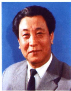
原湘潭电机厂厂长、党委书记：范多福

范多福，男，1937年生，中共党员，大专文化，高级经济师，历任湘潭电机厂厂长、党委书记，湘潭市市长、市委书记，湖南省政协副主席。范多福同志1957年由学校分配到湘潭电机厂工作，1980年9月至1990年5月一直担任厂级领导干部。他在湘潭电机厂任职期间，求真、务实、开拓、创新，在企业管理中始终坚持深化内部改革，强化管理，依靠技术进步，使企业物质文明和精神文明得到齐发展，企业工作总产值由1.3亿元跃升到2.4亿元，企业先后荣获“全国先进基层党组织”、“中国机械工业先进企协单位”、湖南省“先进党组织”、“湖南省质量管理先进企业”、“湖南省设备管理先进单位”等荣誉称号。