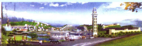
▲ 太子奶临湘休闲度假山庄

湖南太子奶集团是我国最大的发酵型乳酸菌奶饮料科、工、贸集团，始创建于1996年，现有资产30亿元，员工10000多人。在全国30多个省市、260多个大中城市、3000多个县建立了完善的经销网络，设立了100个营销大区；拥有100个销售分公司、3000多个一级经销商、10万多个二级批发商、400多万个终端零售商。太子奶集团连续五年在中国发酵奶行业中产量、销量、市场占有率领先。2004年，中国食品科学技术学会公布了中国乳酸菌饮料行业的最新排名，湖南太子奶集团在全国乳酸菌饮料行业中以76.2%的市场占有率高居同行业榜首，保持产量、销量、市场占有率三个行业第一；2005年6月，被中国食品科学技术学会评定为中国发酵奶行业产量、销量、市场占有率第一。