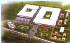
▲ 太子奶湖北黄冈生产基地