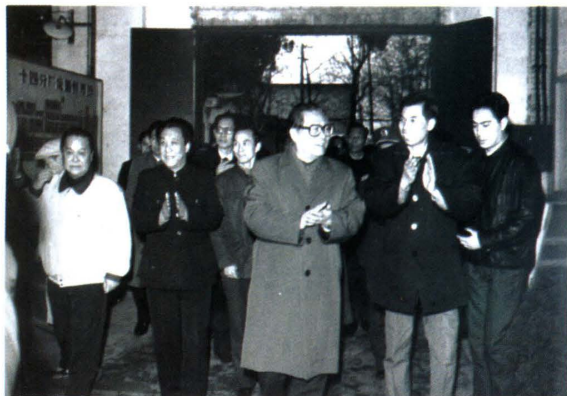
▲ 范多富与江泽民同志合影