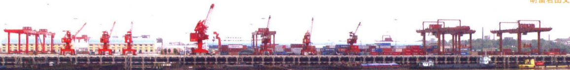
长沙新港：一期和二期工程框架结构码头615米的前沿景观