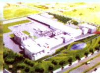
▲ 太子奶江苏昆山生产基地