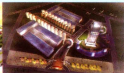
▲ 太子奶湖南株洲雨雨工业园生产基地