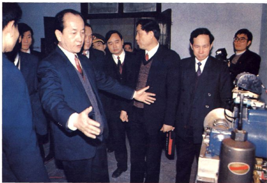
■ 民航总局陈光毅局长视察学院科研成果