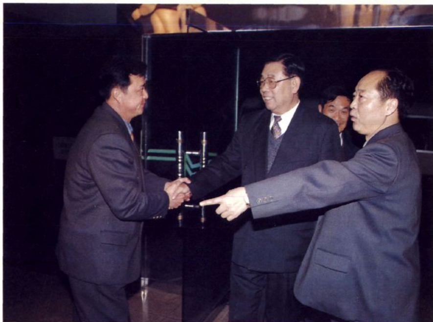
■ 民航总局刘剑锋局长到学院检查工作