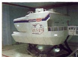
■模拟机训练中心(四川广汉)