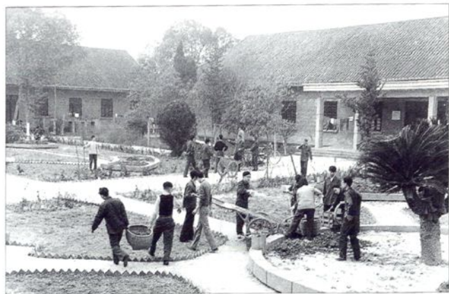
■自己动手劳动建校