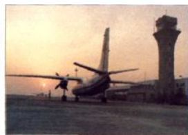
■洛阳分院(河南洛阳)