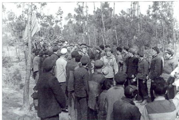
■一九七〇年学校组织千里野营拉练