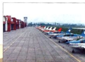
■绵阳分院(四川绵阳)