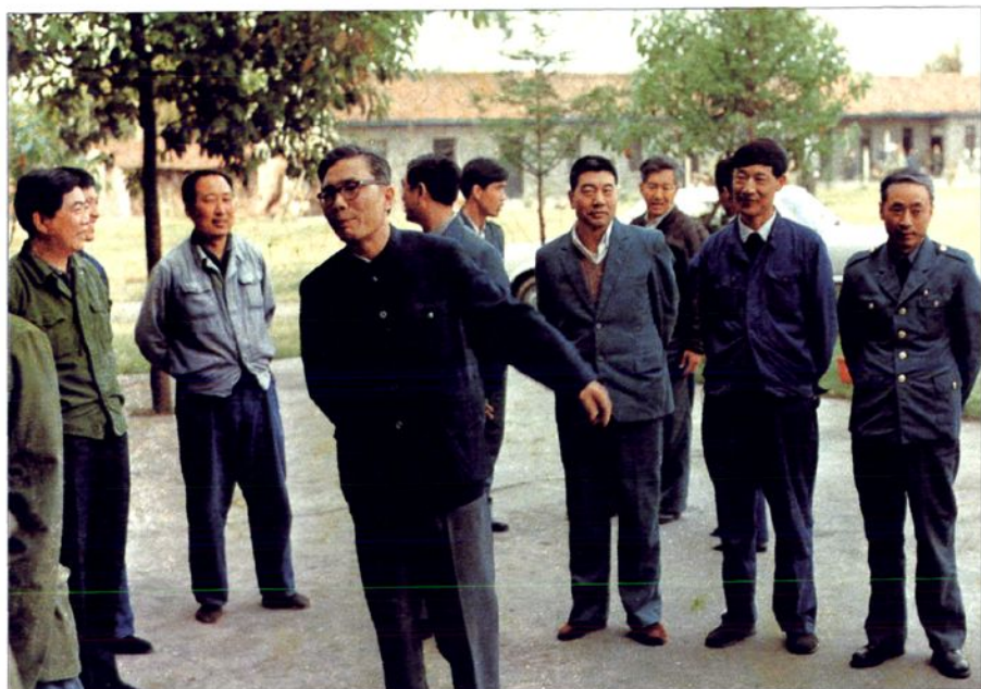
■民航局胡逸洲局长到学院检查工作期间与干部交谈