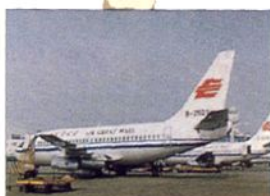
■长城航空公司(浙江宁波)