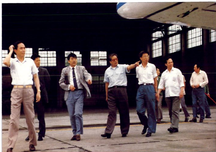
■民航局蒋祝平局长到广汉机场检查工作