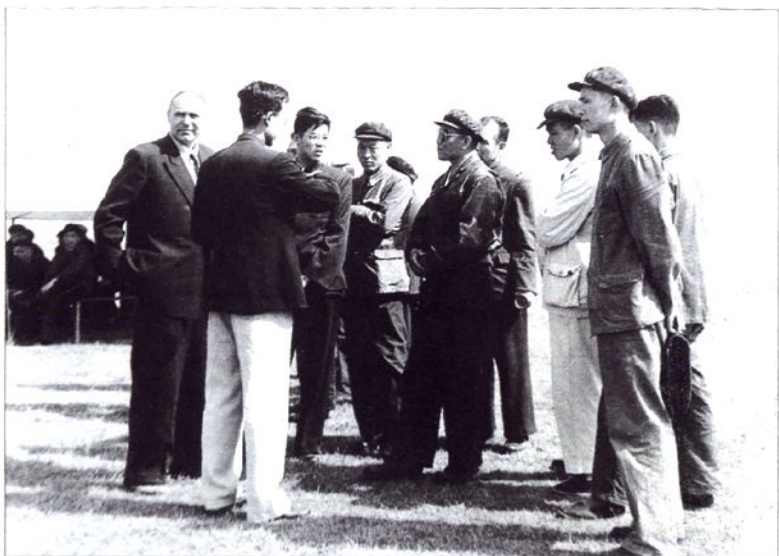
■民航局机关领导、苏联专家和学校领导进行建校选址考察