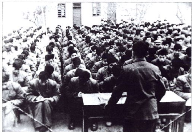
■建校初期空勤学员上政治课