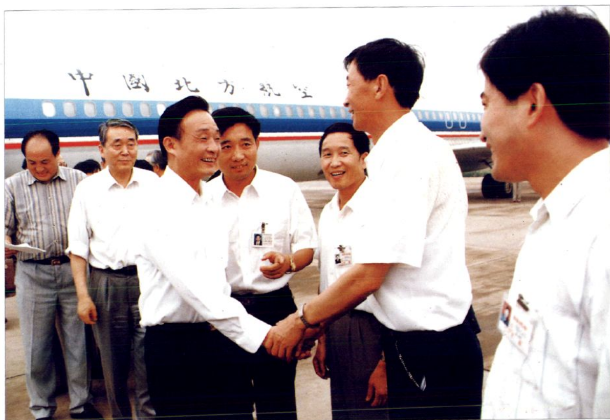
■ 吴邦国同志在洛阳机场亲切接见学院和洛阳分院负责同志