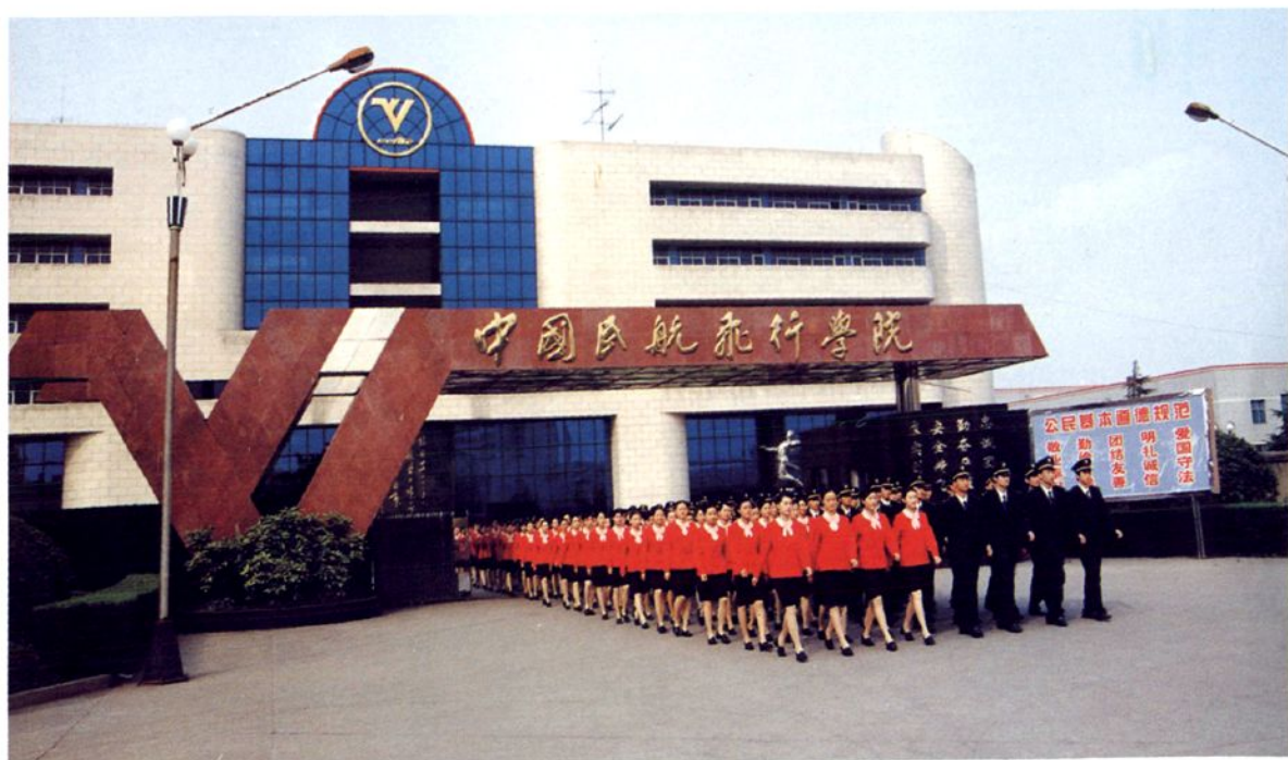
■ 走出校门的新一代大学生