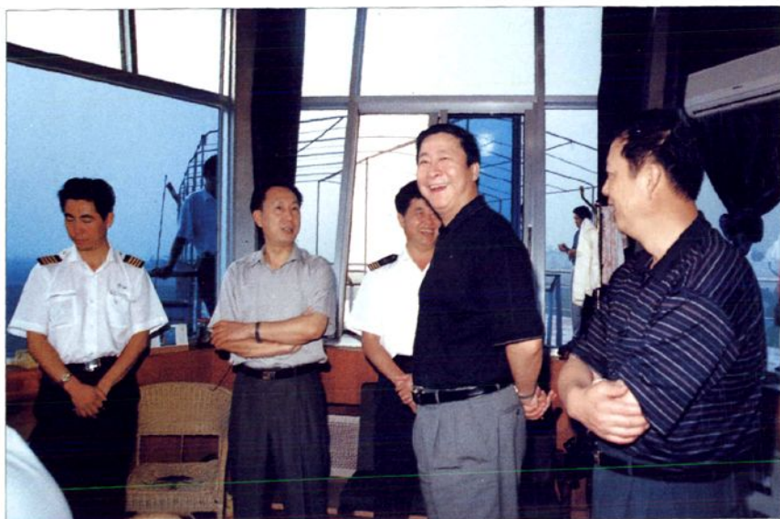
■ 民航总局杨元元局长到学院训练现场与干部教师交谈