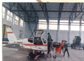
■飞机修理厂(四川广汉)