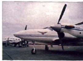
■广汉分院(四川广汉)