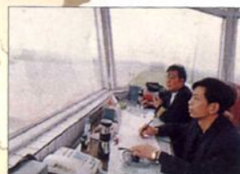
■遂宁航站(四川遂宁)