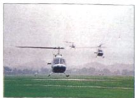
■新津分院(四川新津)