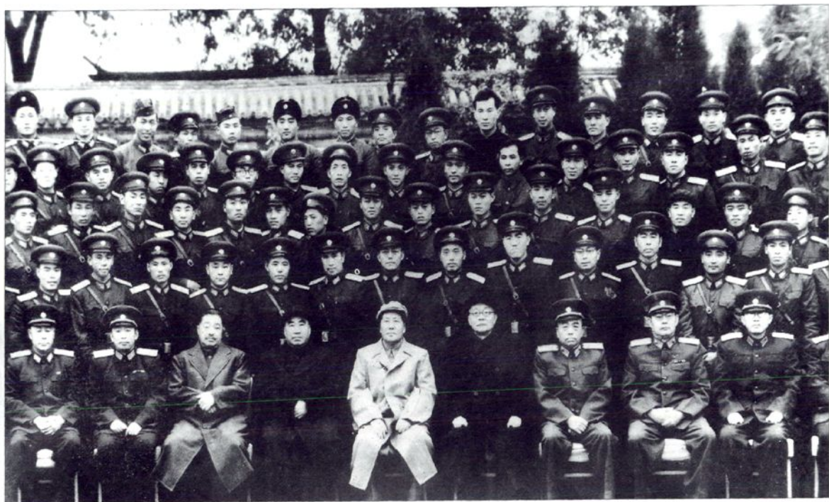
■学校领导参加1960年军委扩大会议，受到毛主席等中央领导亲切接见