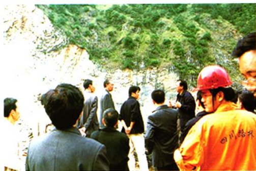
2002年9月24日石棉县十二届人大常委会组织市县人大代表视察交通建设