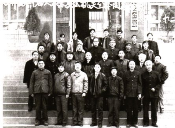
石棉县第十届人大常委会机关全体同志合影