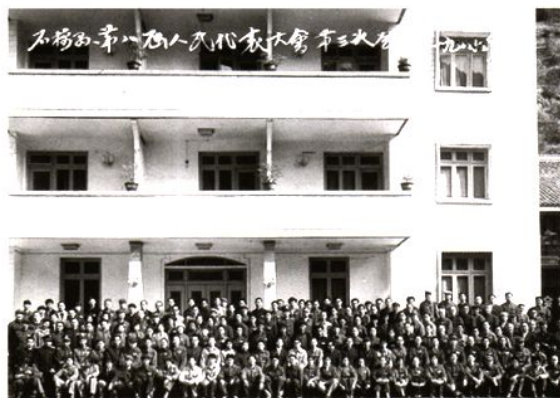
石棉县第八届人民代表大会第三次会议全体代表合影