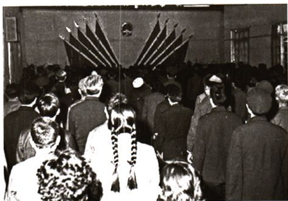
石棉县第八届人民代表大会第一次会议会场