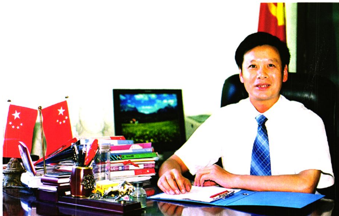
中共石棉县委书记、人大常委会主任 戴华强