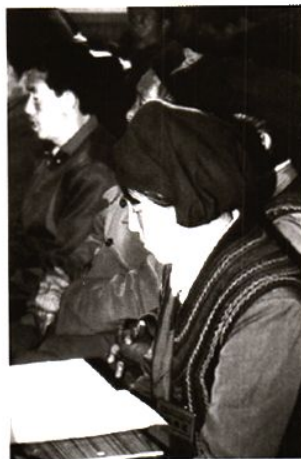
彝族代表在九届人大一次会上