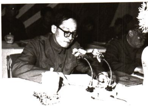
县人民政府代理县长李超凡在石棉县八届人大一次会议上作政府工作报告