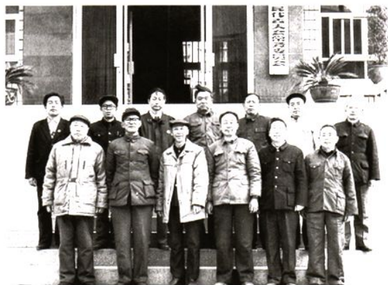
石棉县第九届人大常委会组成人员等合影