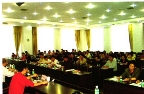
石棉县换届选举工作动员会