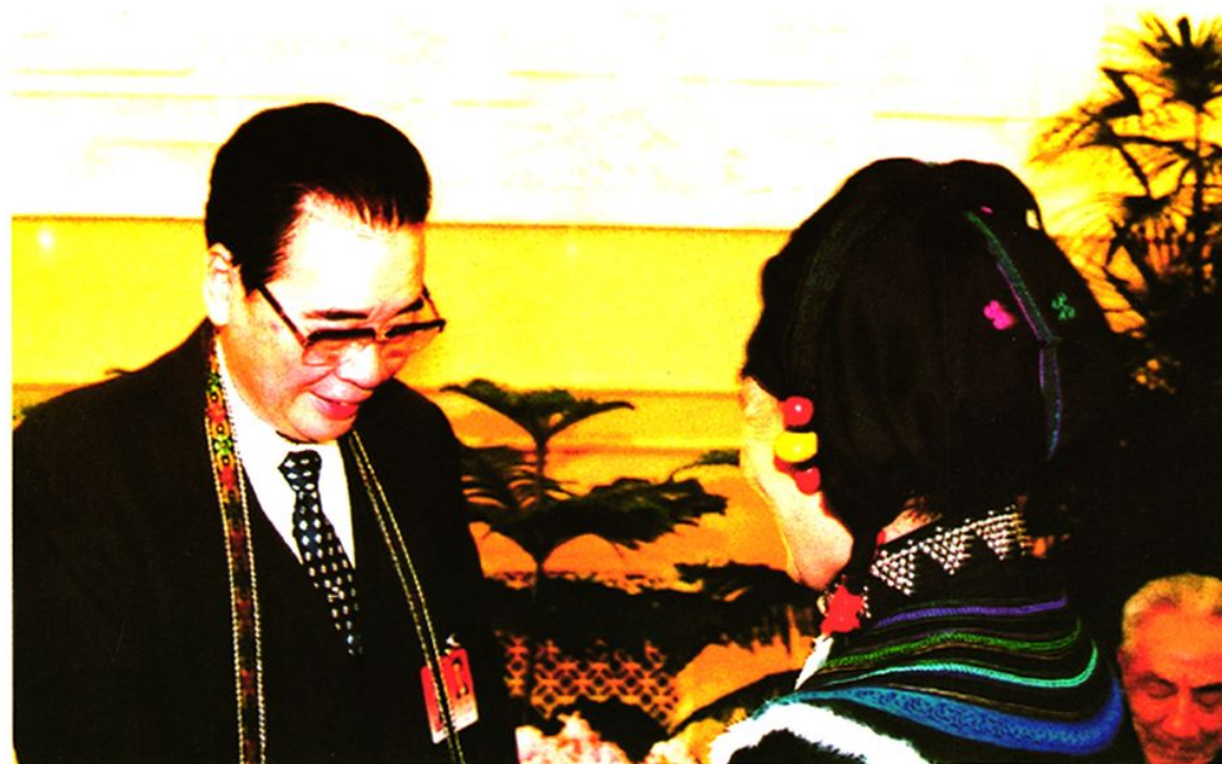
李鹏委员长接见石棉县第九届全国人大代表马桂珍