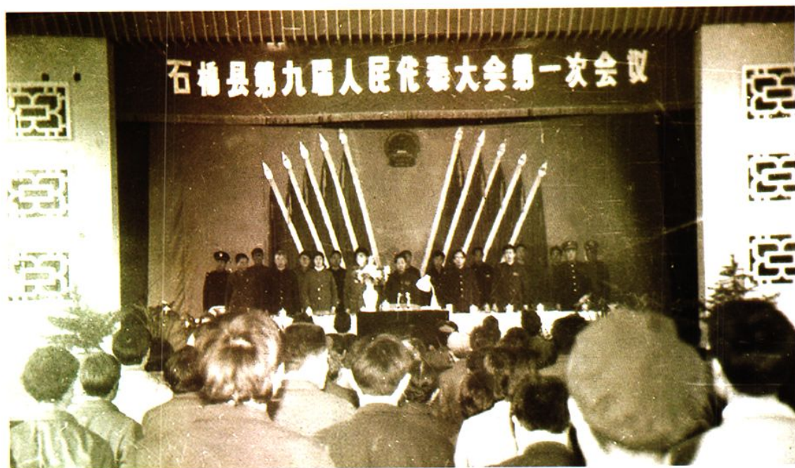
石棉县第九届人民代表大会第一次会议