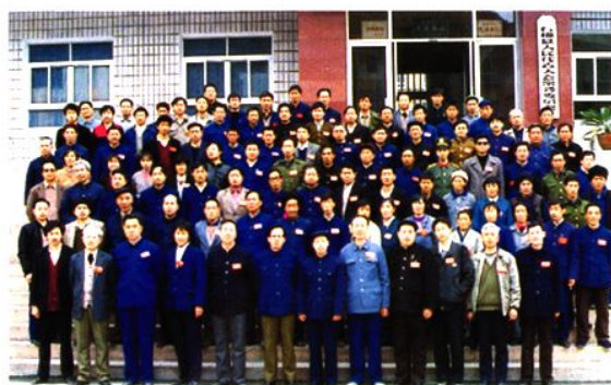
石棉县第十届人民代表大会第一次会议全体代表合影