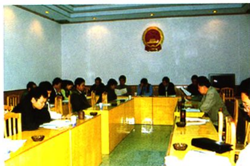
2002年9月26日石棉县十二届人大常委会第四十三次常委会审议公路交通建设