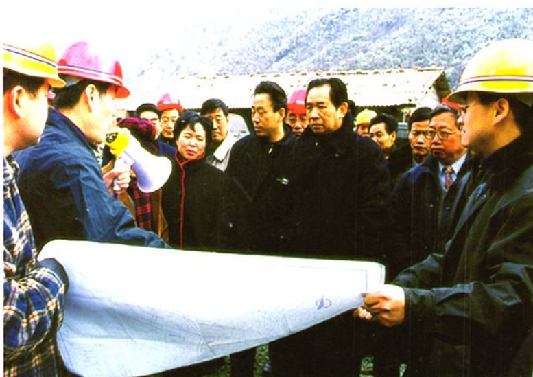
省人大常委会主任谢世杰在石棉冶勒电站视察