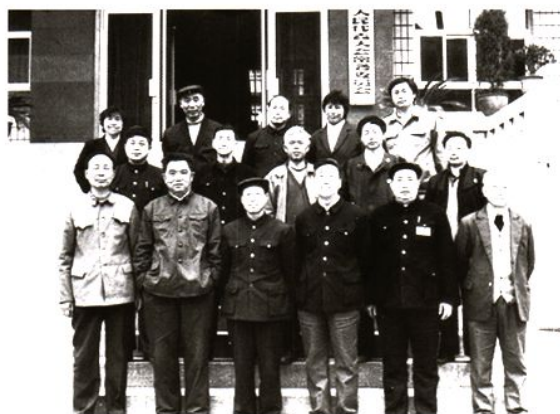
石棉县第十届人大常委会组成人员等合影