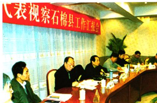
省人大代表视察石棉县工作汇报会