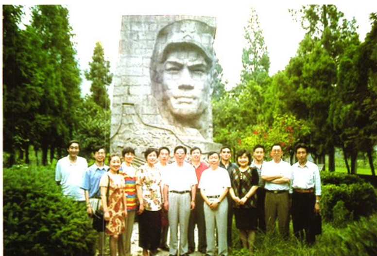
第九届省人大副主任刘永顺在石棉检查《监狱法》并到安顺场视察