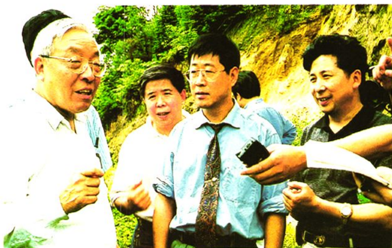
全国人大常委会委员杨振怀及市、县领导在石棉县天然林保护区视察