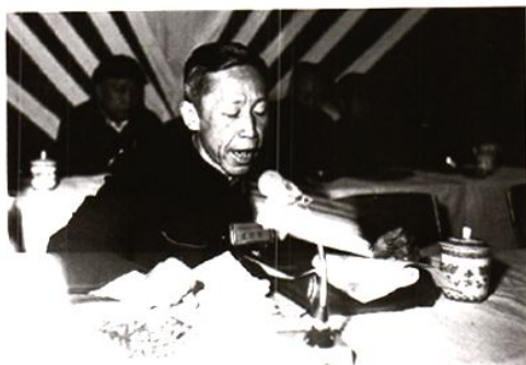
人大常委会主任邓茂全在八届人大一次会议上作人大常委会工作报告