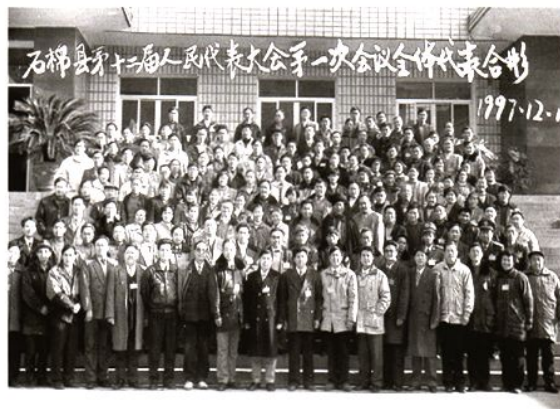
石棉县第十二届人民代表大会第一次会议全体代表合影