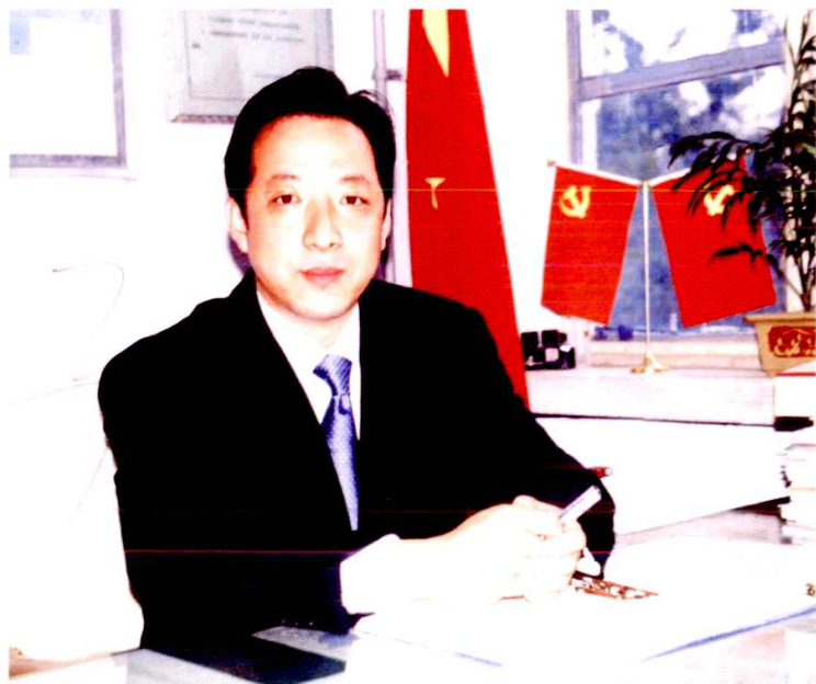
山亭区人民政府区长 政协山亭区委员会主席 董沂峰