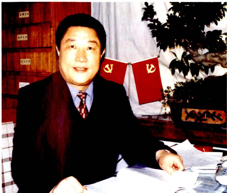
中共山亭区委书记 山亭区人大常委会主任 秦元祥