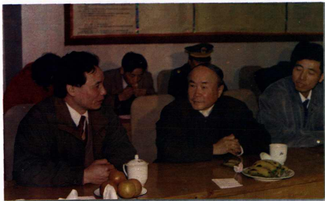
●省委书记李泽民在德清雷甸水产村