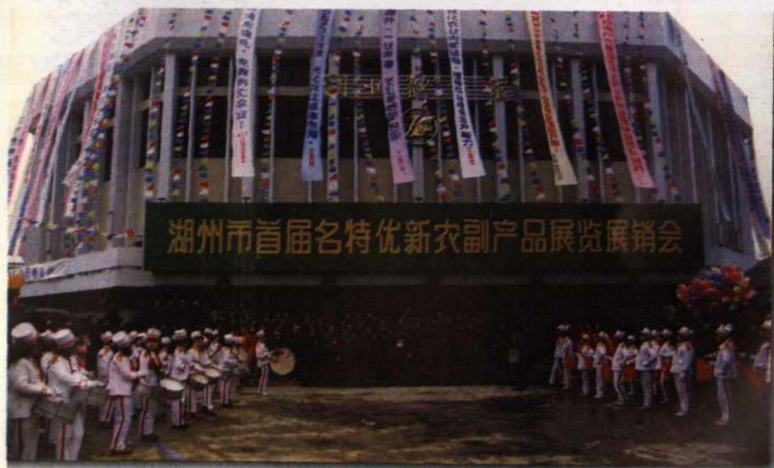
● 市农委主办首届名特优新农副产品展销会