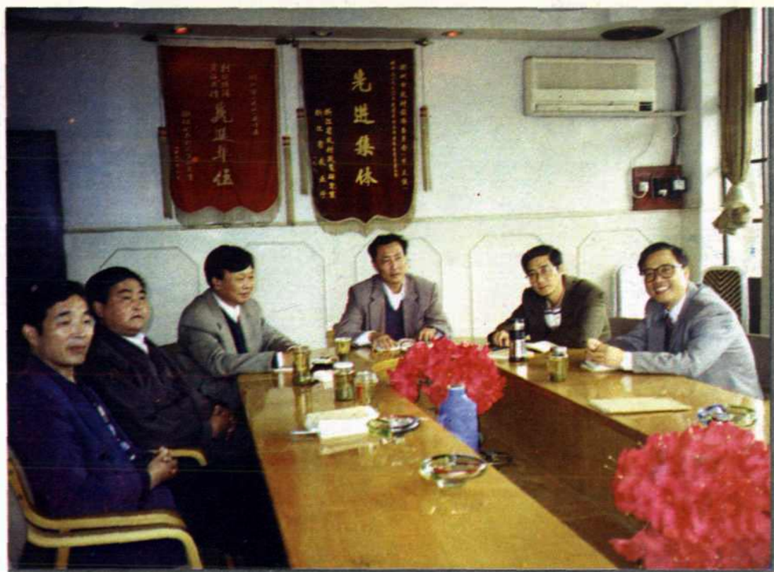
● 市农经委领导研究农村政策问题