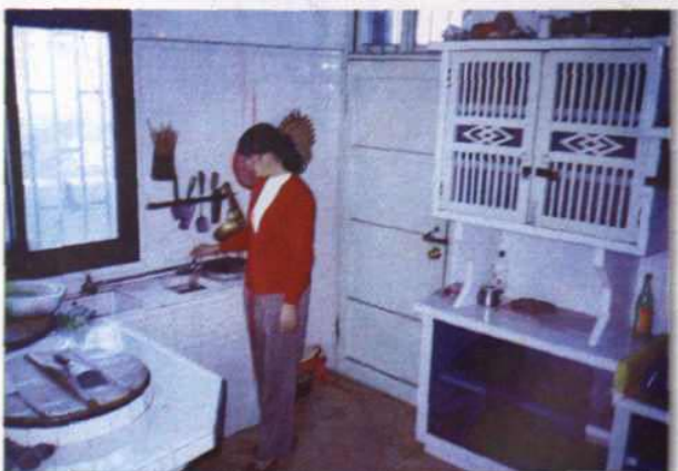
● 全市已有 87% 的农户用上自来水