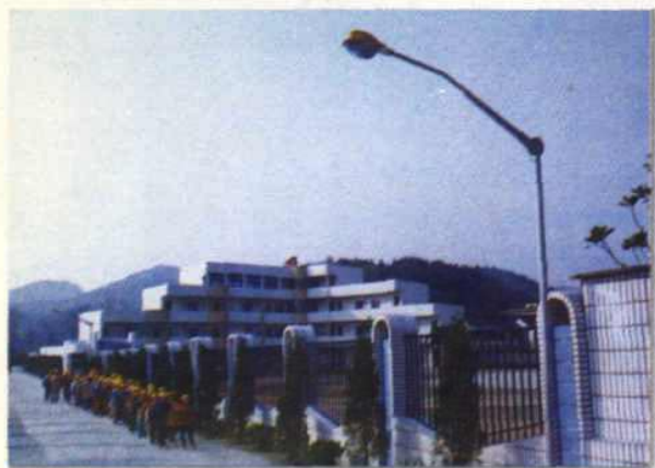
● 全村已有 83% 的村小建造了新校舍