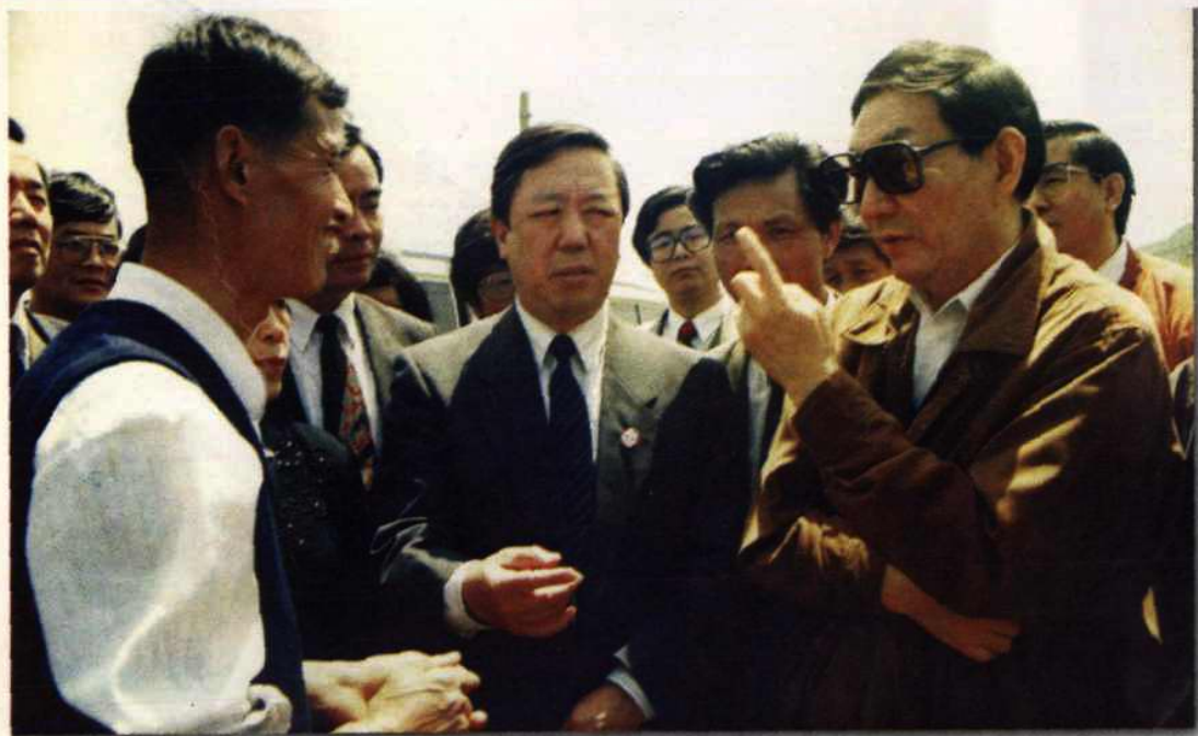
● 朱镕基副总理看望道场乡种粮大户凌连根