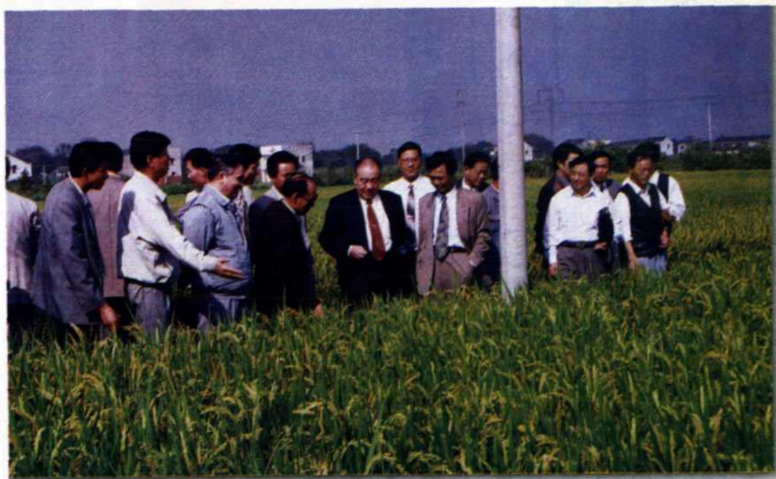
●全国人大常委会副委员长布赫在田头