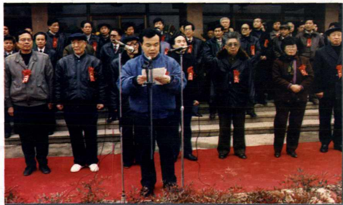
● 湖州市副市长姚关仁致开幕词