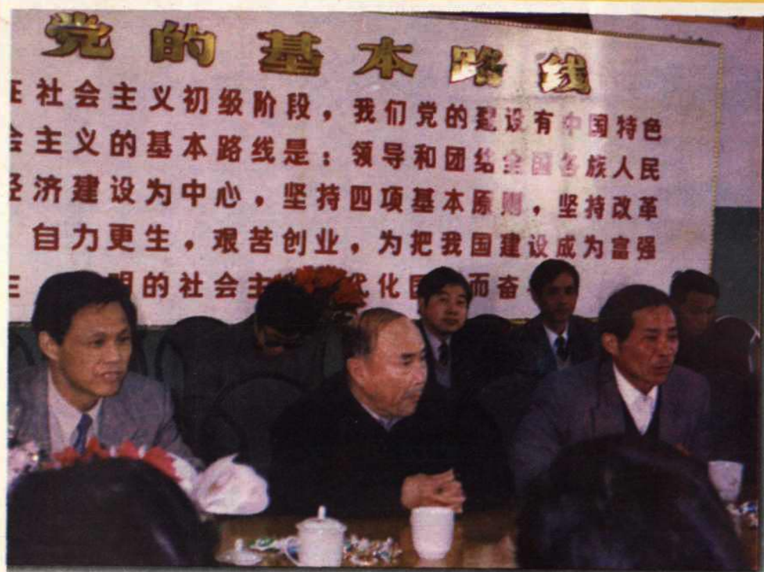
● 省委书记李泽民在长兴父子岭村研究工作