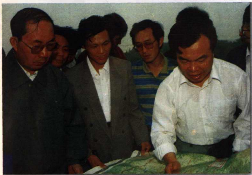
● 国务委员陈俊生听取市委、市府领导汇报工作