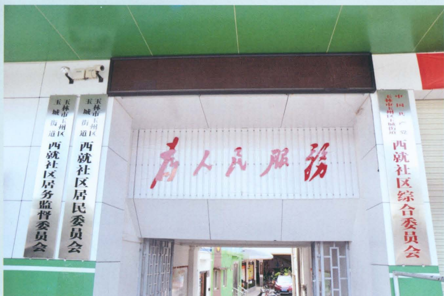
西就社区办公大楼门口