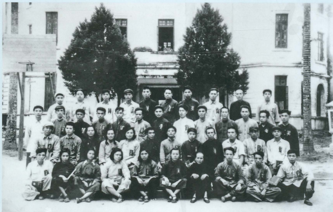
1954年5月4日鬱林县第一区西就镇首届人民代表留影