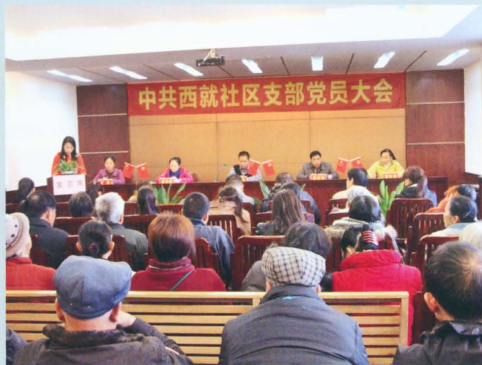
中共西就社区支部党员大会