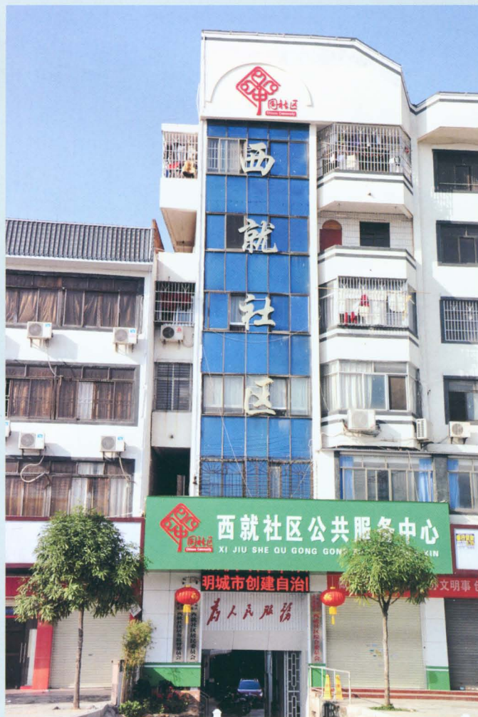
西就社区办公大楼