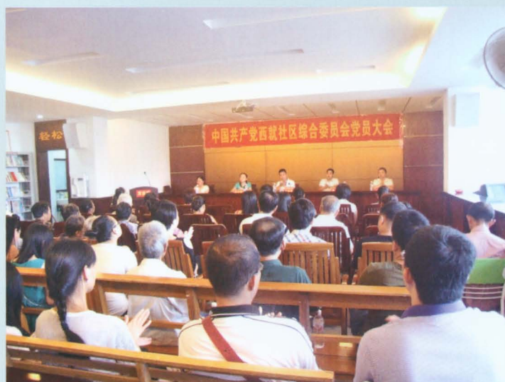
中共西就社区综合委员会党员大会