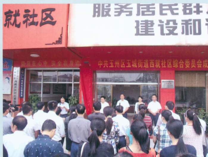
中共玉林市玉州区玉城街道 西就社区综合委员会成立大会