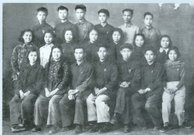
1957年元旦玉林县西就镇第二团支部全体团员合影留念