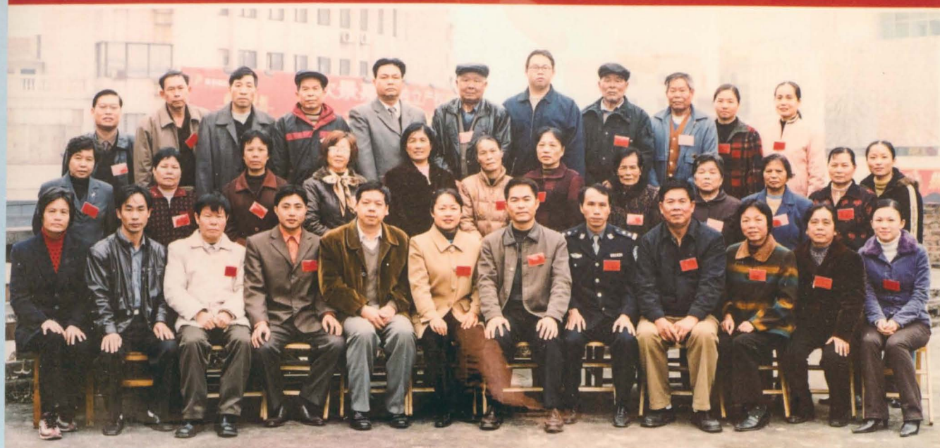
2005年1月19日玉林市玉州区玉城街道西就社区第一届居民代表大会留影