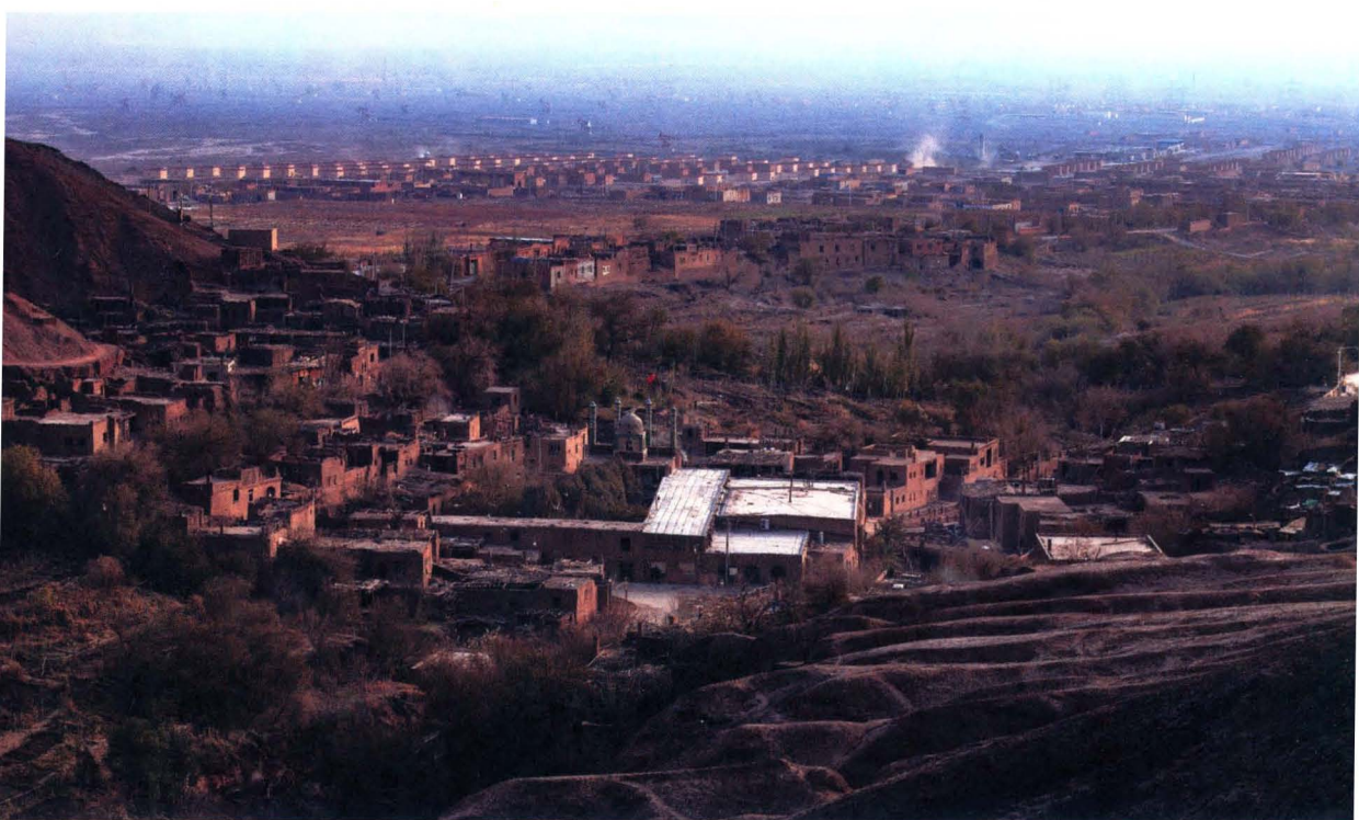
初春时的“新旧”密语