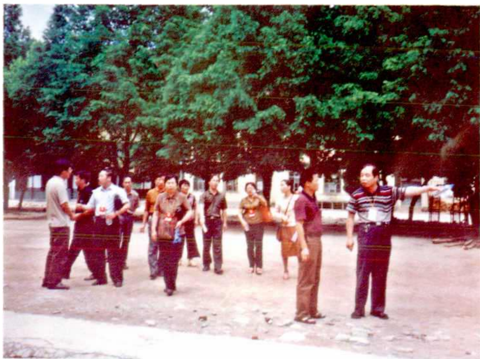
▲政协委员视察教育工作