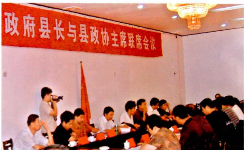
▲2004年政协主席与县长联席会