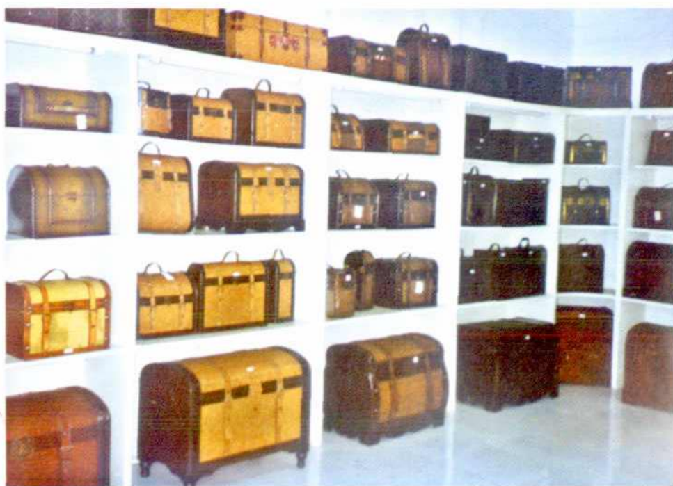
▲光泽圣明工艺厂仿古箱包陈列室一角