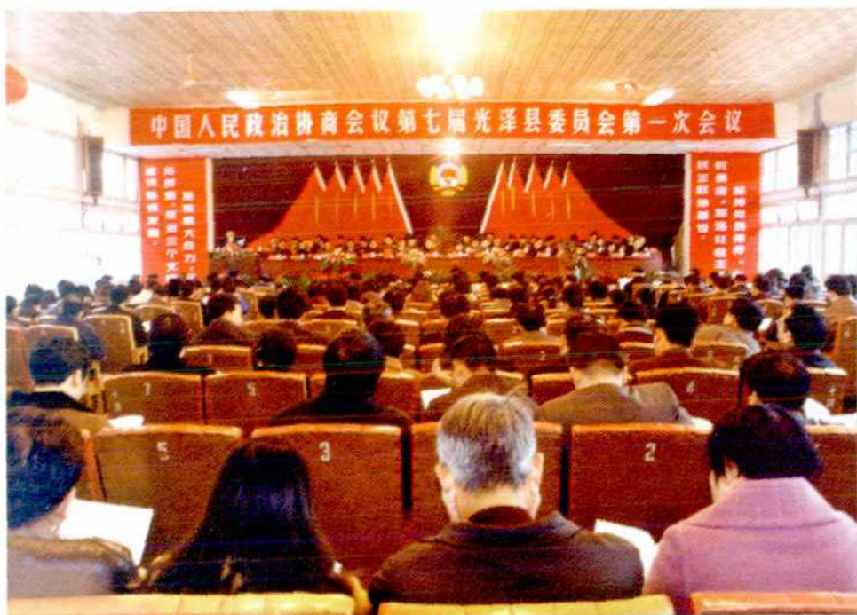
▲政协第七届光泽县委员会第一次会议大会会场