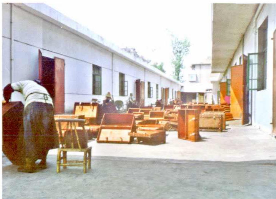
▲工人正在为仿古箱包工艺品上色