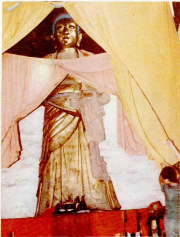
图为开江县金山寺藏经楼殿上清乾隆年间塑造的高六米的「释迦牟尼」大佛立像。