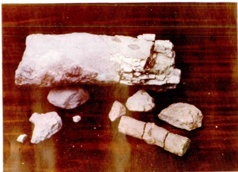
图为开江县宝塔坝乡文家梁北斗垭二级台地出土的“恐龙化石”部分骨骼。