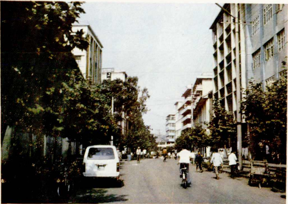
开江县城厢镇淙城街一角