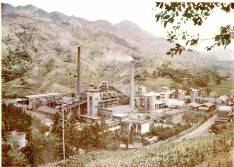
开江县回龙乡峨城山下的火电厂，装机容量 2 \times 2000 千瓦，除本县用电外，还支援达县地区工业用电。