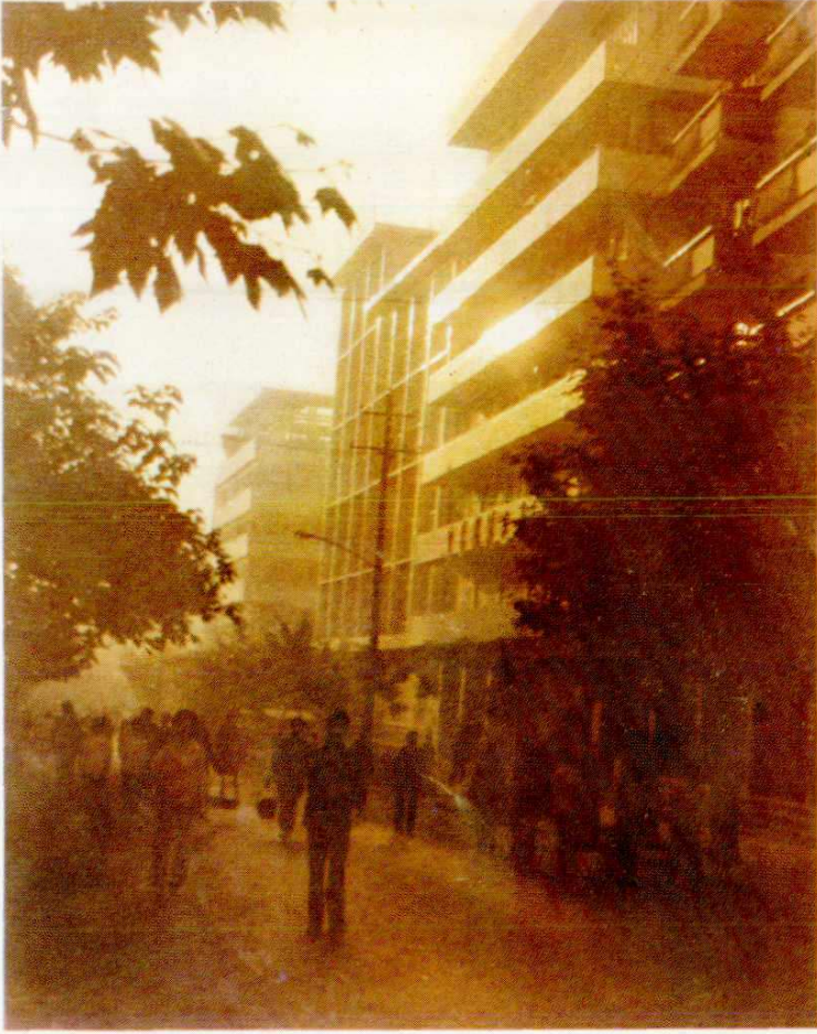
晨曦中的开江县贸易中心