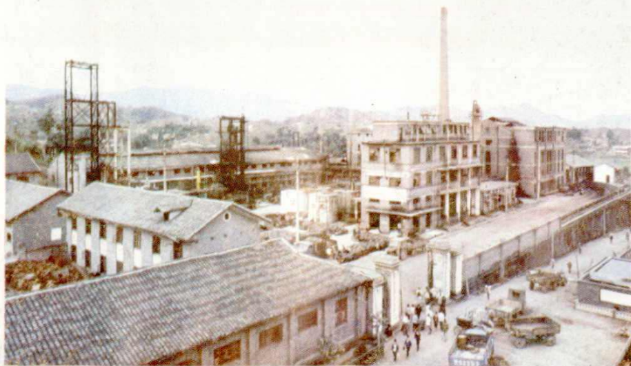
一九七五年建设的“开江县化工厂”（原氮肥厂），除年产碳铵 3 万多吨外，还生产碳黑等化工产品。