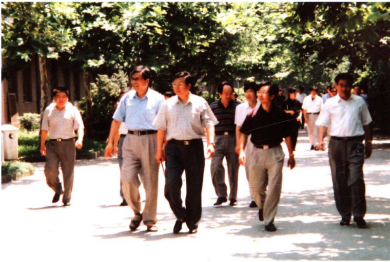
1999年7月，中共浙江省委书记张德江(左三，现任中共中央政治局委员、国务院副总理)来校视察