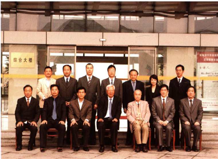
2008年11月，全国政协原副主席、中国致公党原主席罗豪才(左四)来校视察