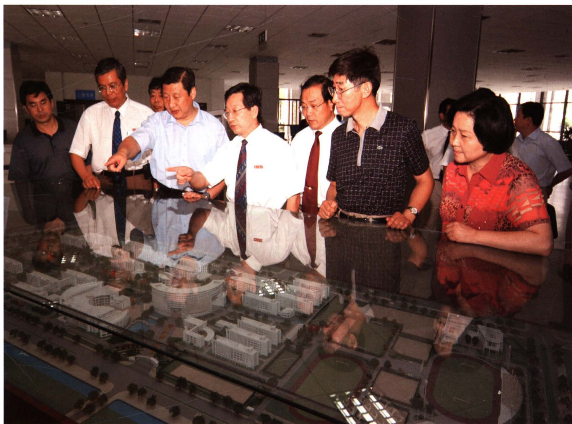
2004年9月，中共浙江省委书记习近平(右五，现任中共中央政治局常委、国家副主席)、省委副书记梁平波(右二)、副省长盛昌黎(右一)来校视察