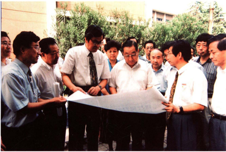
1998年9月，中共中央政治局常委、国务院副总理李岚清(左五)，教育部部长陈至立(左四)、中共浙江省委书记李泽民(左六)来校视察