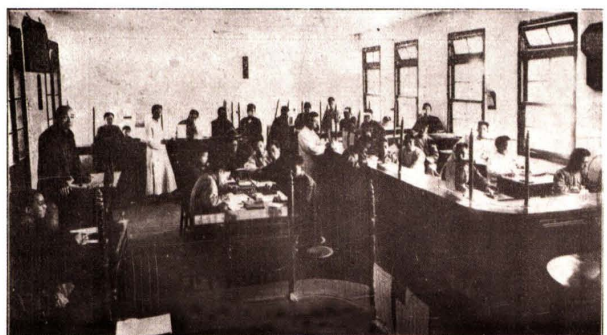
1916年，浙江省立甲种商业学校设立银行实习室（图为实习场景）