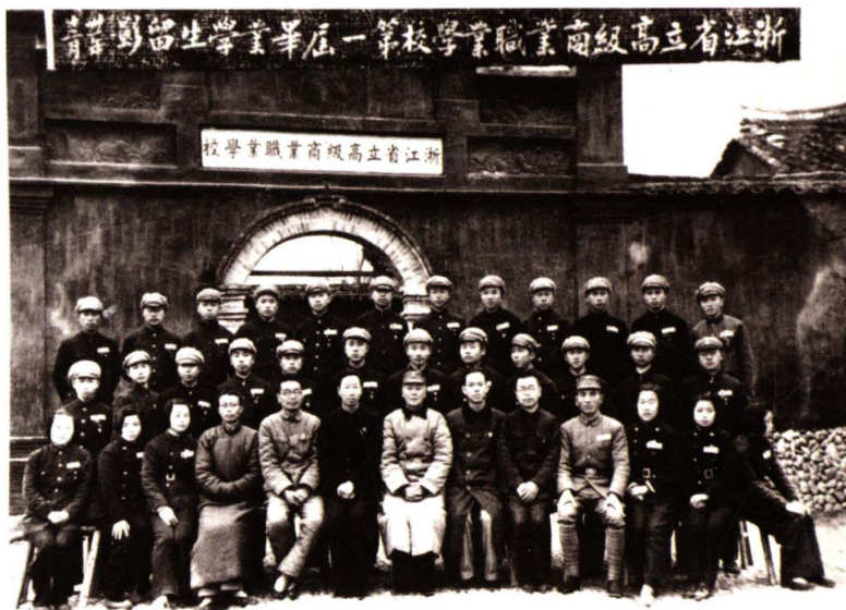
1942年12月，浙江省立高級商業職業學校第一屆畢業生合影