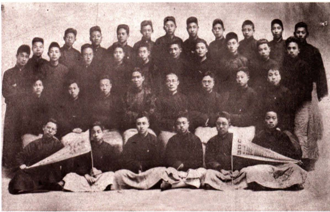
1925年，浙江省立商业学校参加苏沪考察团成员合影