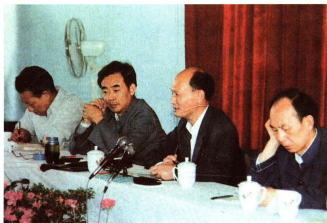
1986年6月，国家教委副主任朱开轩（右二）、浙江省副省长李德葆（左二）来校视察