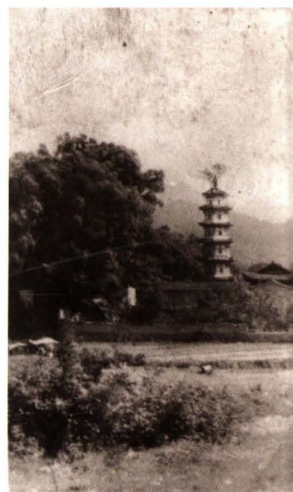
20世纪40年代浙江省立高级商业职业学校丽水碧湖校址