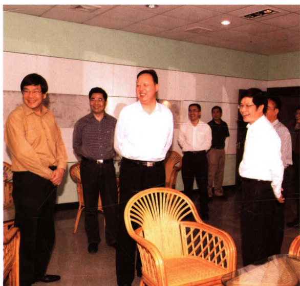
2010年5月，中共浙江省委常委、宣传部部长茅临生（左三）来校视察