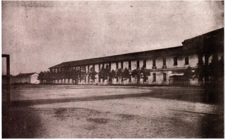
20世纪20年代，浙江省立甲种商业学校位于平安桥堍校址的校舍