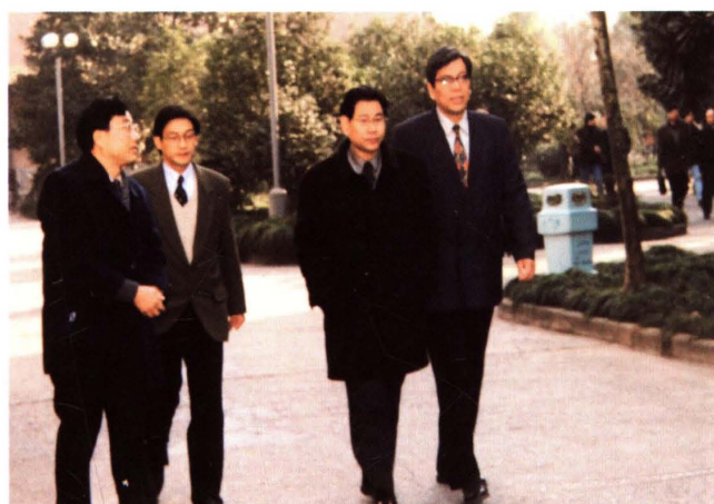
1999年1月，浙江省副省长鲁松庭（右二）来校视察