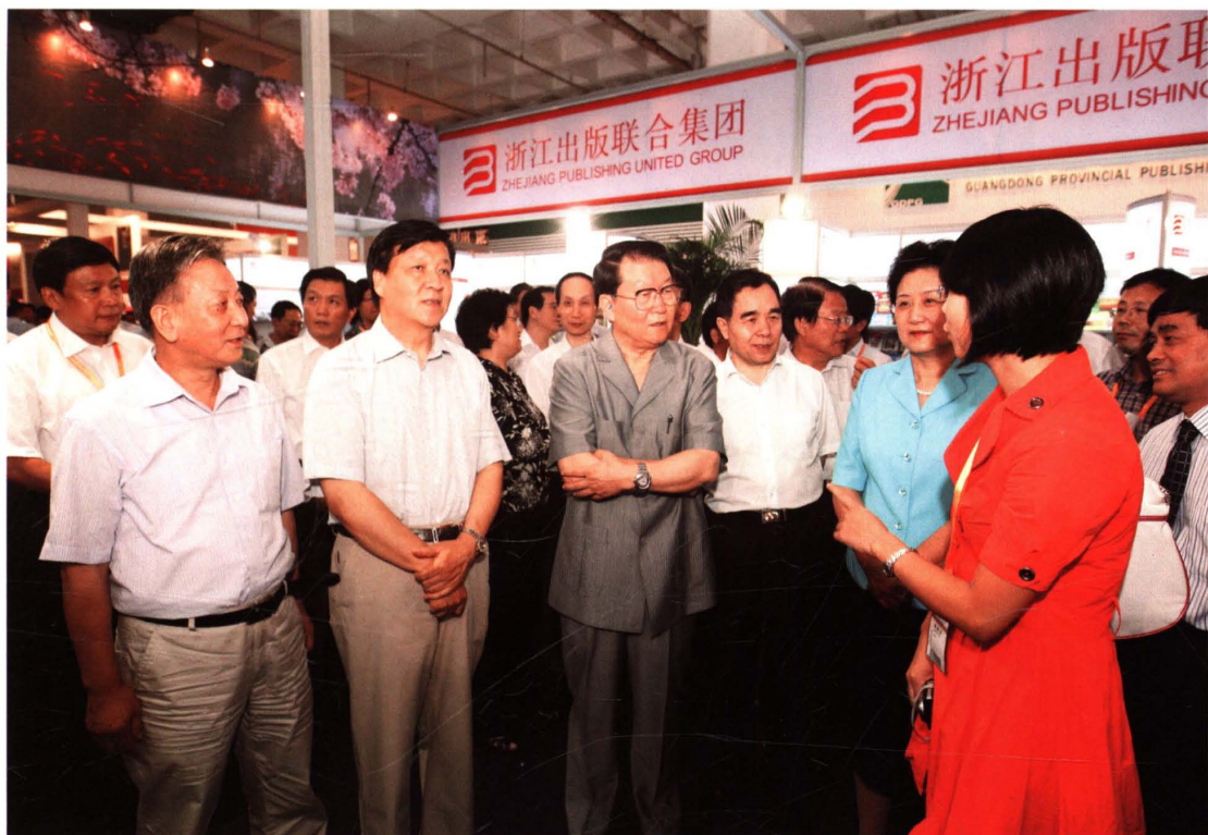
2009年9月，中共中央政治局常委李长春(左三)、中宣部部长刘云山(左二)、国务委员刘延东(左五)视察第16届北京国际图书博览会时，听取浙江工商大学出版社情况汇报