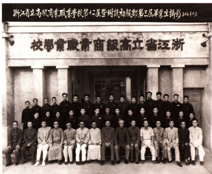
1948年6月，浙江省立高級商業職業學校第十二屆暨附設初級部第三屆畢業生合影