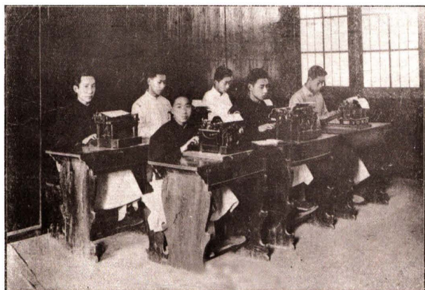
1915年，浙江省立甲种商业学校设立打字练习室（图为学生练习场景）