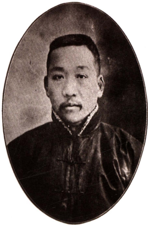
郑在常，字岱生，1911年3月创办杭州中等商业学堂