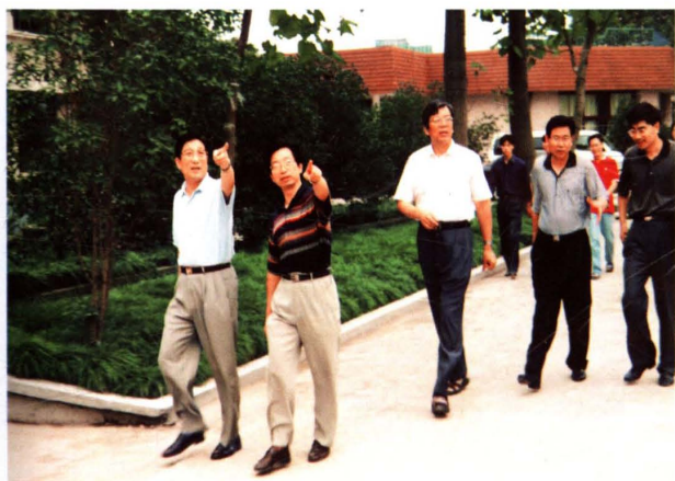
1999年9月，中共浙江省委副书记、省长柴松岳（左一）来校视察