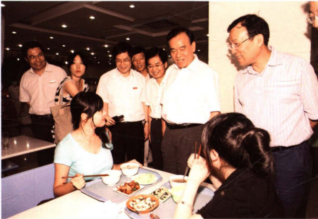
2009年9月，中共浙江省委副书记、省长吕祖善(右二)来校视察