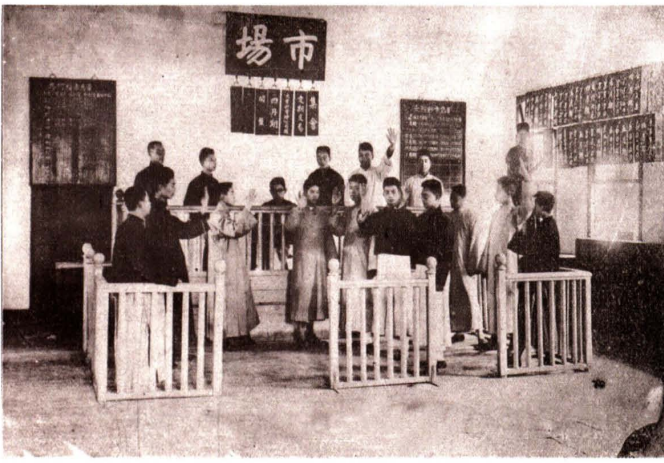
1920年，浙江省立甲种商业学校设立的交易所实习室（图为实习场景）