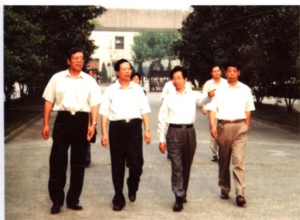
2000年9月，省委副书记、纪委书记李金明（左二）来校视察