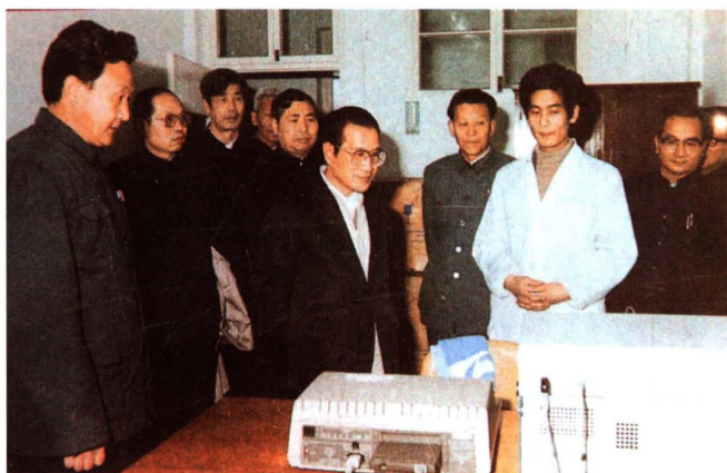
1986年3月，商业部部长刘毅（右四）来校视察