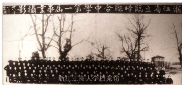
1939年1月，浙江省立临时联合中学第一届毕业生合影