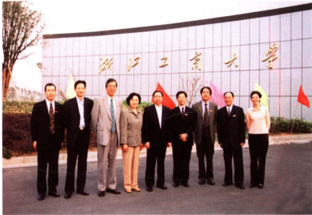
2004年11月，教育部副部长袁贵仁(右五，现任教育部部长)来校视察