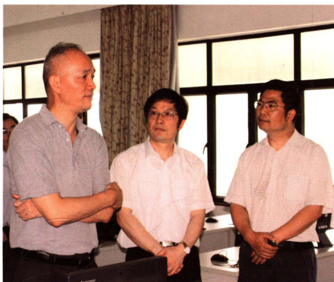
2010年7月，中共浙江省委常委、组织部部长蔡奇（左一）来校视察