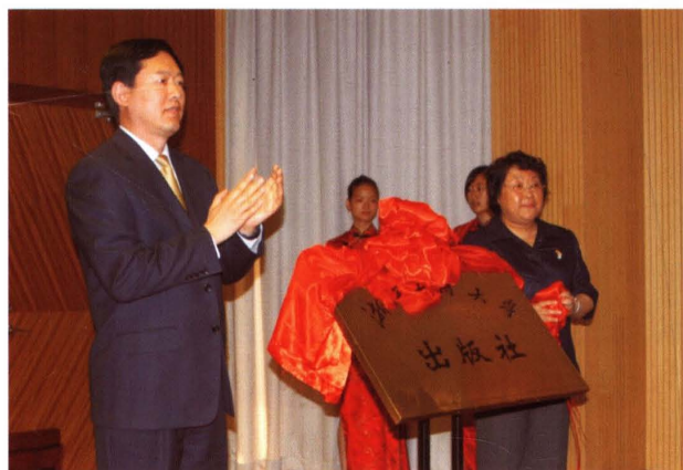
2008年5月，浙江省政协副主席徐辉（左一）和新闻出版总署巡视员刘双阳（右一）为浙江工商大学出版社成立揭牌