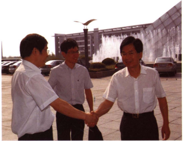
2009年9月，浙江省副省长郑继伟（右一）来校视察