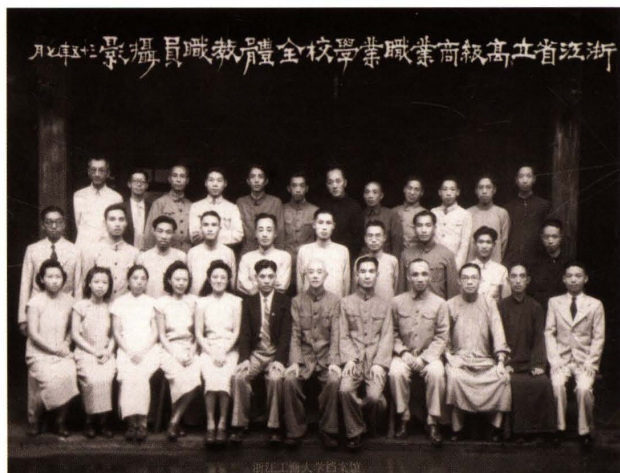
1946年7月，浙江省立高級商業職業學校全體教職員合影