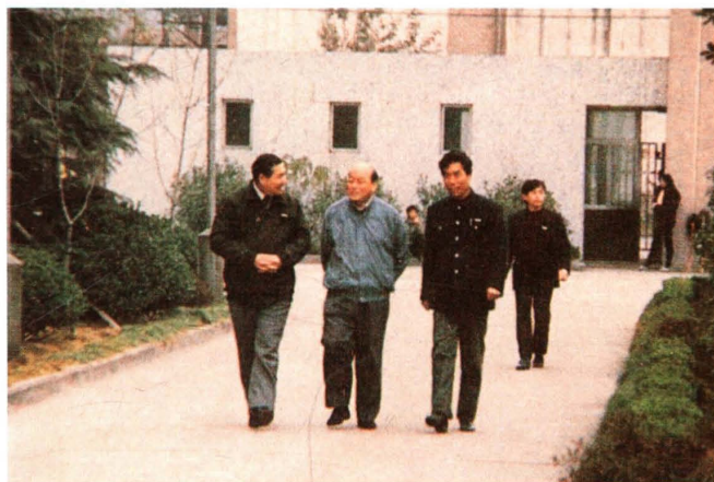
1989年4月，中共浙江省委书记、省长沈祖伦（左二）来校视察