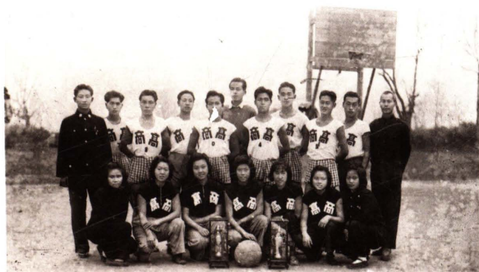
1945年，浙江省立高级商业职业学校参加“和平杯”篮球比赛男女生组荣获冠军合影