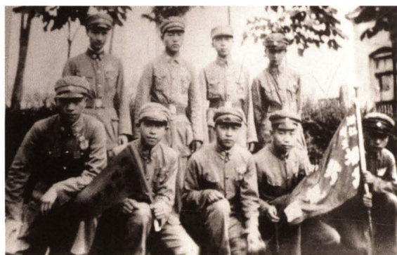
1937年，浙江省立杭州高级中学商科毕业生赴南京等地参观前在校门口留影