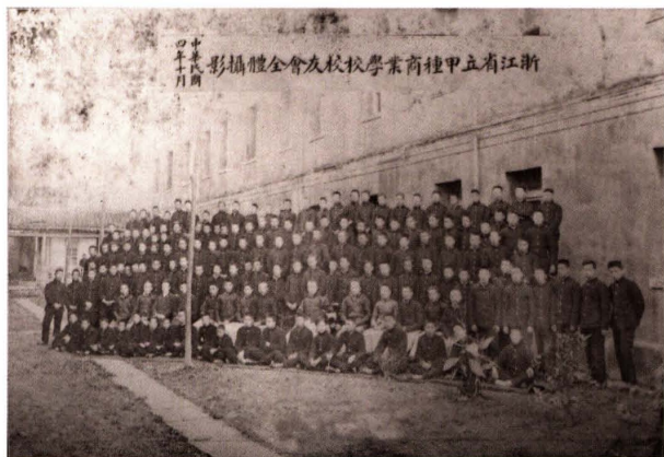
1915年10月，浙江省立甲种商业学校校友会全体合影