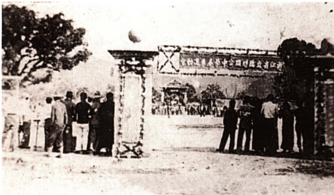
1942年4月10日，举行浙江省立临时联合中学春季运动会