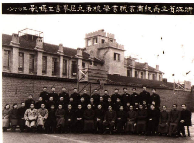
1947年1月，浙江省立高級商業職業學校第九屆畢業生合影