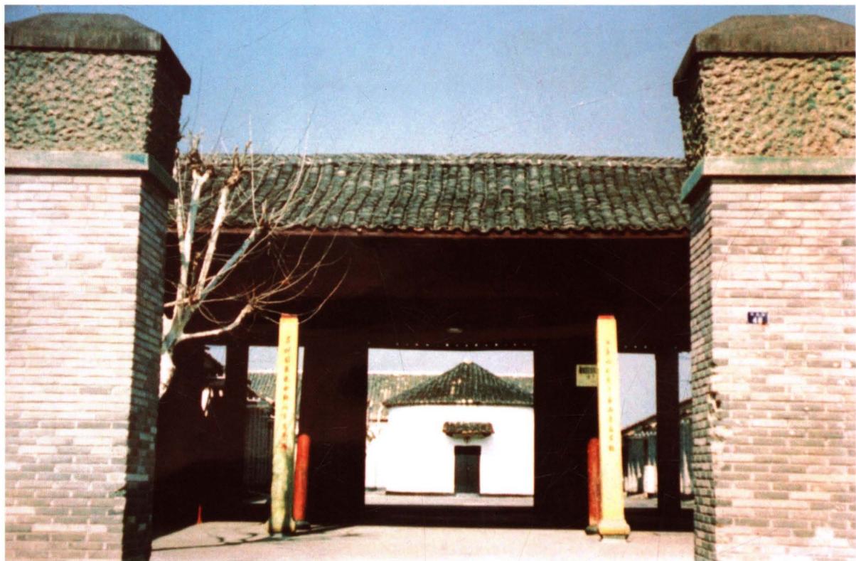
20世纪30年代，浙江省立临时联合中学碧湖校址