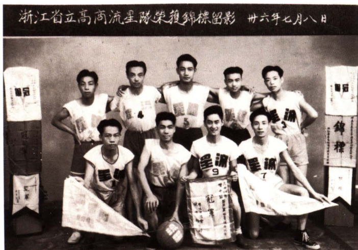
1947年7月，浙江省立高级商业职业学校流星队荣获篮球锦标赛冠军留影