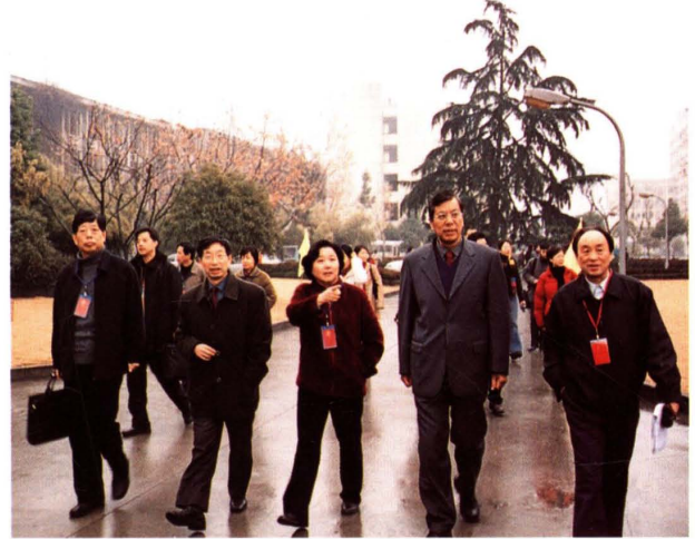
2004年1月，浙江省副省长盛昌黎（右三，现任浙江省政协副主席）来校视察