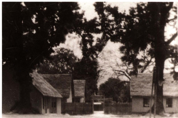
20世纪30年代，浙江省立临时联合中学教室外景（碧湖龙子庙外）