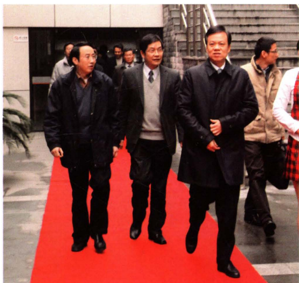
2010年12月，中共浙江省委常委、常务副省长陈敏尔（右一）来校做形势报告，省委教育工委书记、省教育厅厅长刘希平（左一）陪同