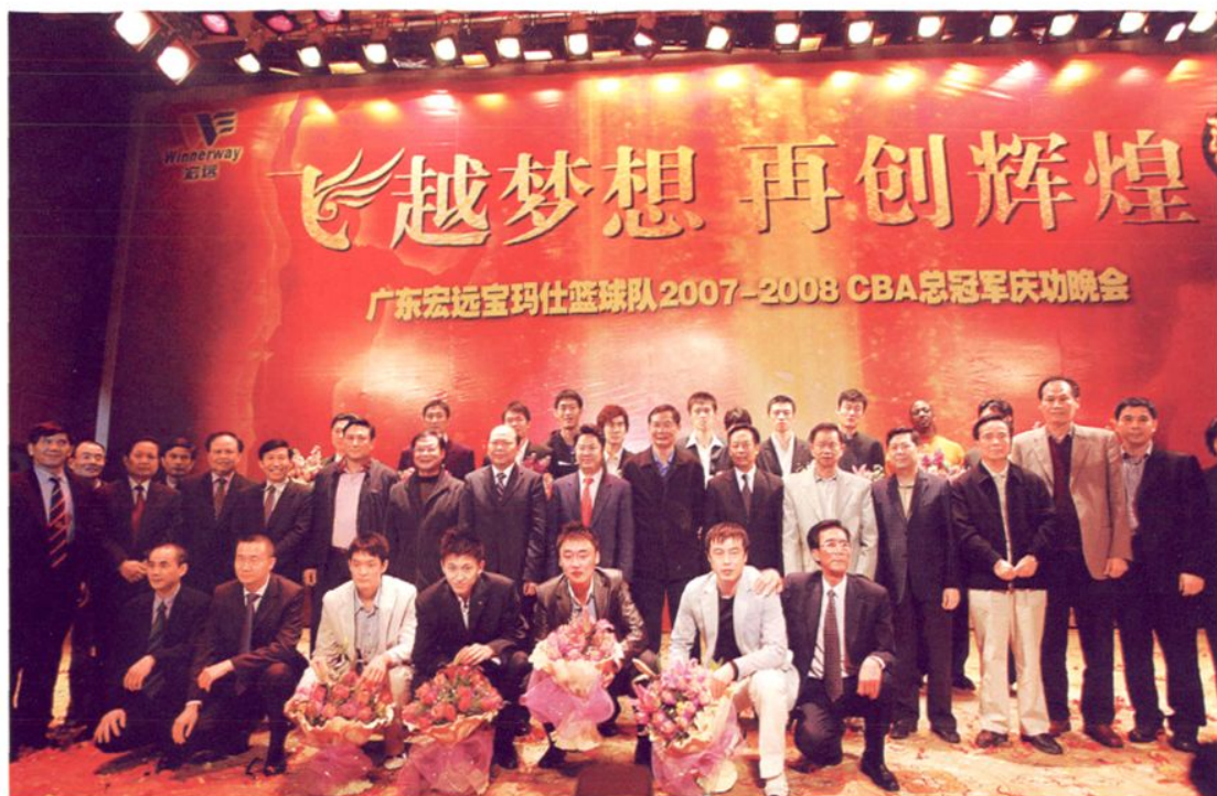
2007—2008赛季CBA总决赛宏远男篮第四次夺得总冠军