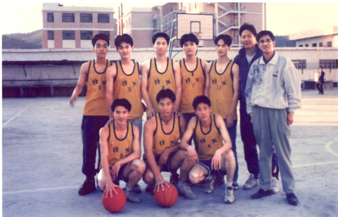
1994年，樟木头中学男子篮球队在樟木头第一毛织厂进行篮球比赛