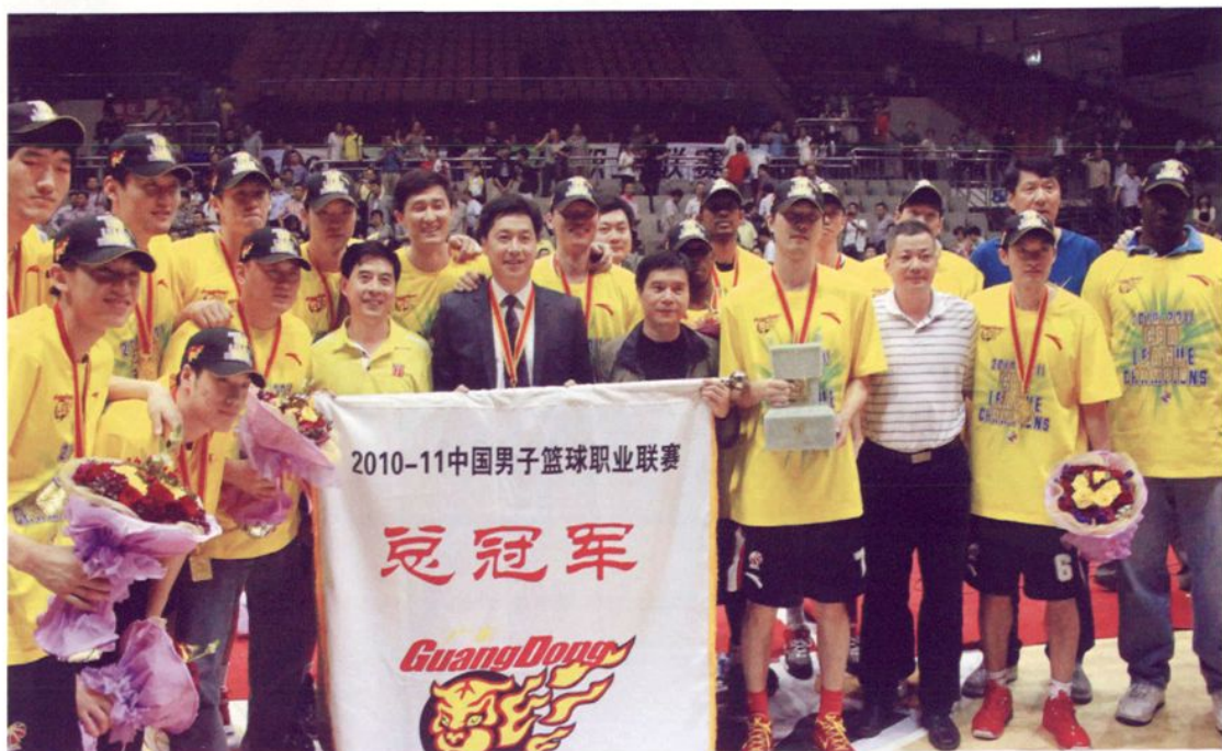
2010—2011赛季CBA总决赛宏远男篮第七次夺得总冠军