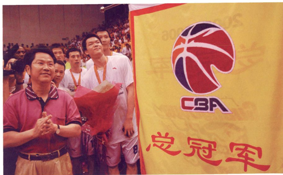
东莞市委书记刘志庚（左一）为广东东莞银行篮球队获得CBA总冠军颁旗