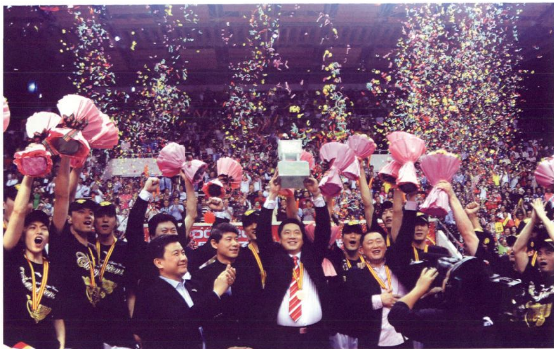
2009—2010赛季CBA总决赛宏远男篮第六次夺得总冠军