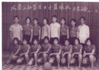
1971年5月，凤岗公社学 生女子篮球队合影