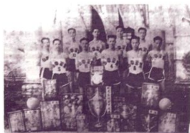
1944年，常平桥梓篮球队 获得东莞县冠军