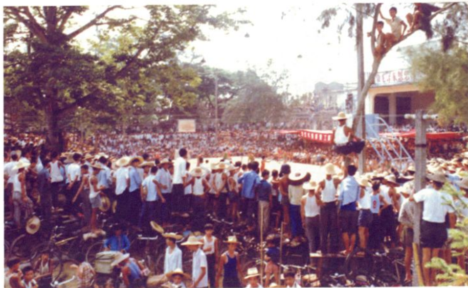
20世纪70年代末，常平公社乡村篮球比赛