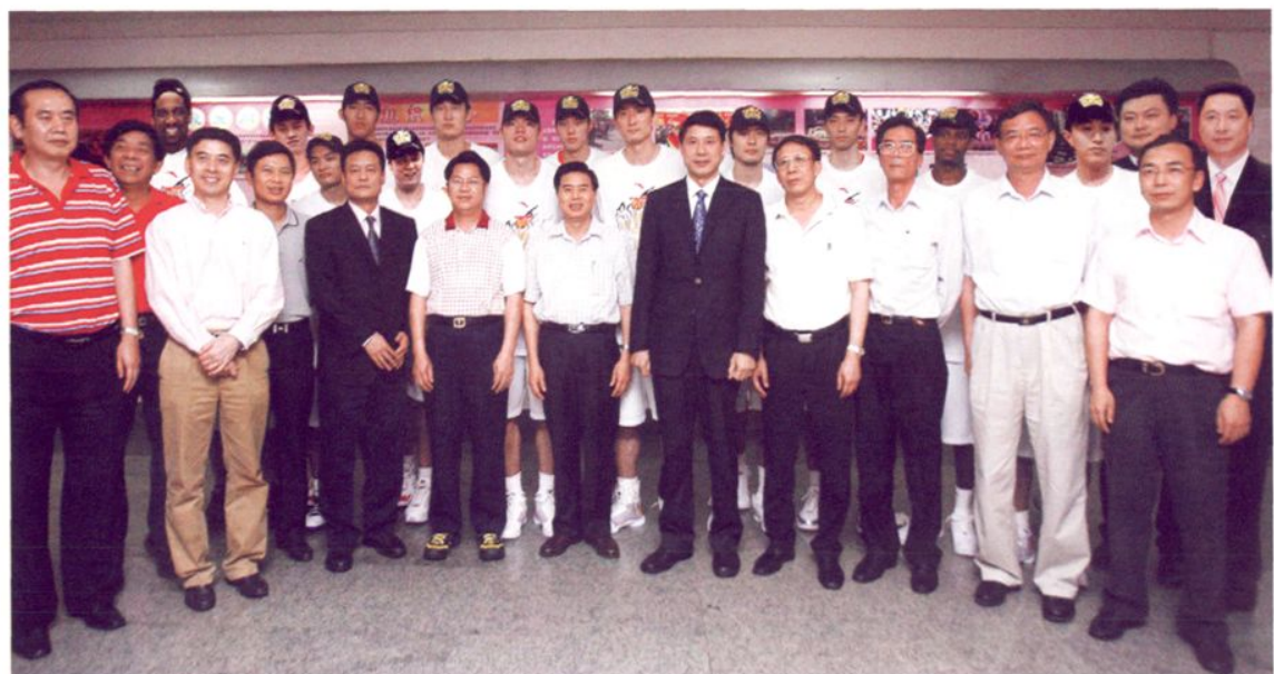
2009年5月3日，广东省省长黄华华（前排左五）、副省长林木声（前排右四）与广东宏远篮球队合影