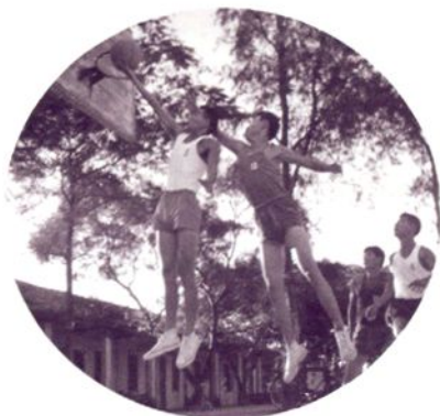
20世纪70年代大朗公社 的群众篮球活动