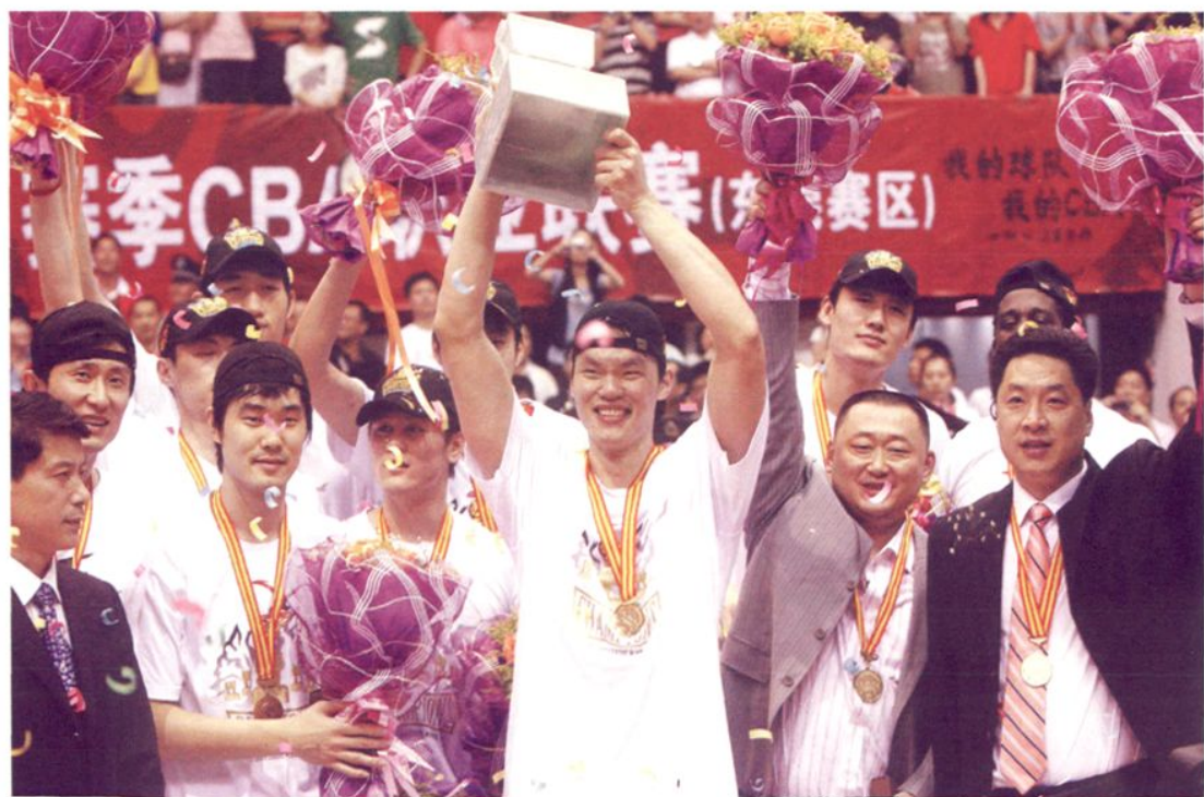
2008—2009赛季CBA总决赛宏远男篮第五次夺得总冠军