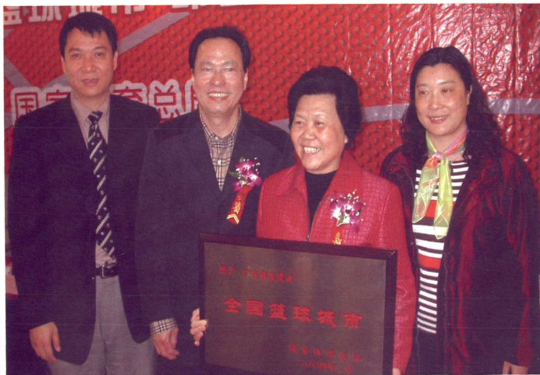
2004年，“全国篮球城市”命名新闻发布会在北京举行，国家体育总局副局长张发强（左二）将“全国篮球城市”牌匾授予东莞市