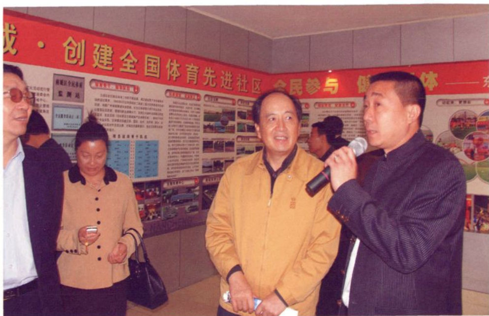
2006年，国家体育总局副局长肖天（右二）到东莞市南城区视察