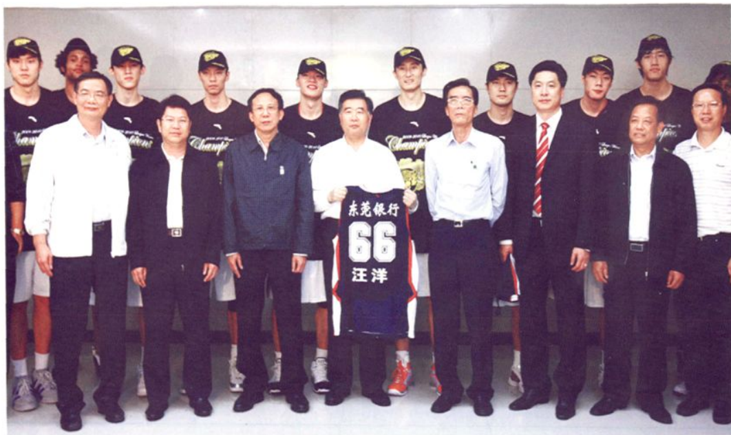
2010年4月25日，中共中央政治局委员、广东省委书记汪洋（前排左四）莅莞观看CBA总决赛并慰问获得总冠军的广东东莞银行篮球队将士