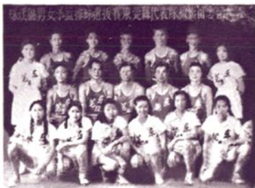
珠江区男、女子篮排球 选拔赛东莞县代表队合影