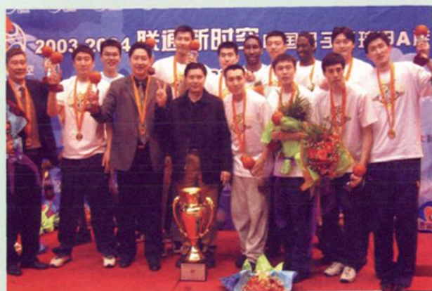
2003—2004赛季CBA总决赛宏远男篮夺得首个总冠军