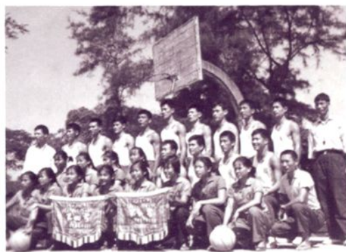
1977年，大朗 公社农民代表队 参加东莞县农民 篮球赛合影