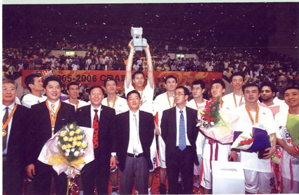
2005—2006赛季CBA总决赛宏远男篮第三次夺得总冠军