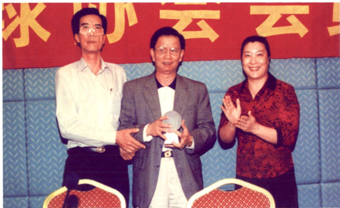
2003年11月，东莞市委副书记袁李松（中）出任市篮球协会名誉主席