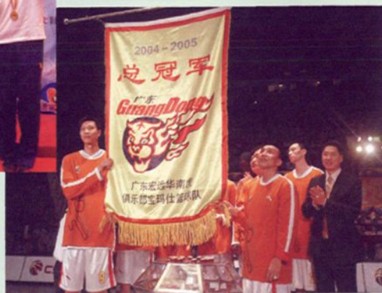
2004—2005赛季CBA总决赛宏远男篮第二次夺得总冠军