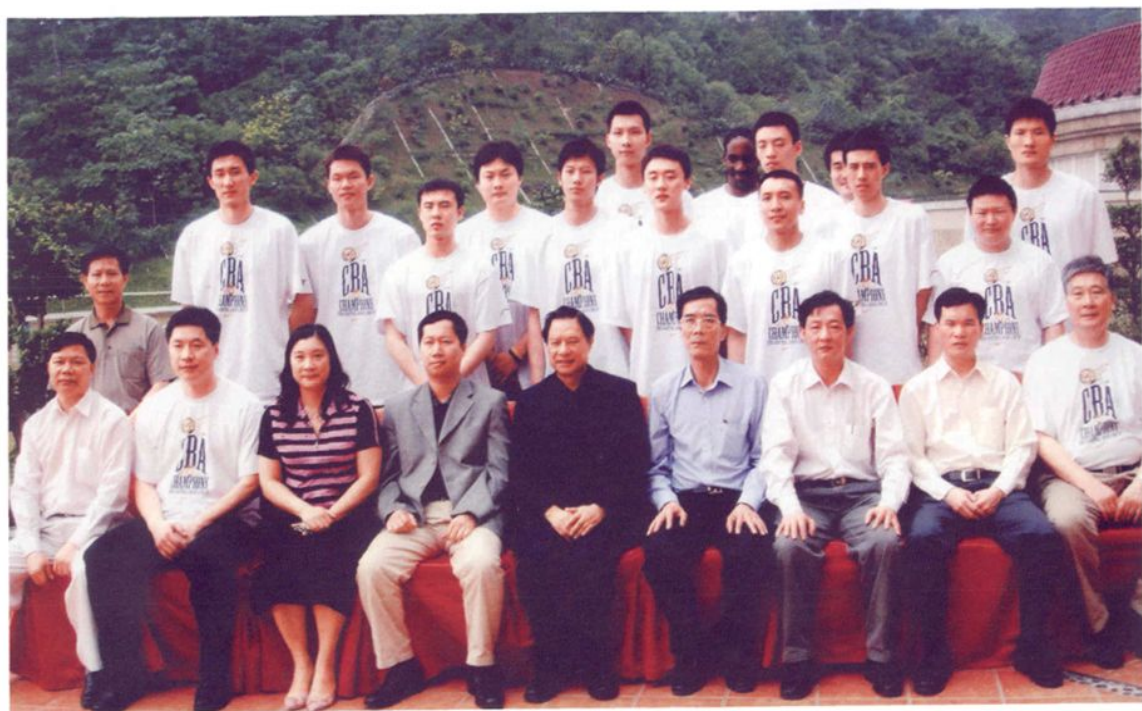
广东省副省长许德立（中）与广东宏远篮球队合影