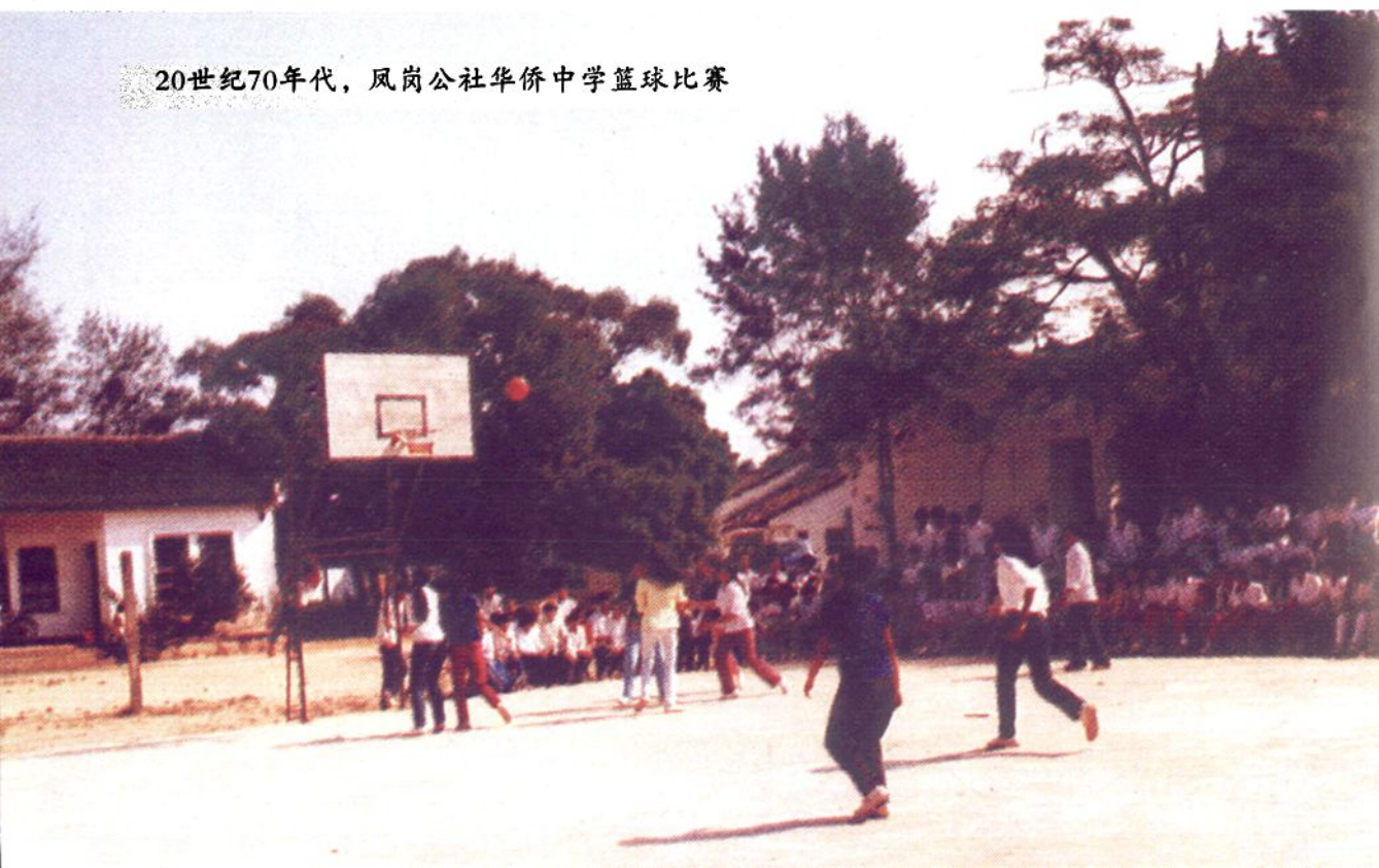
20世纪70年代，凤岗公社华侨中学篮球比赛