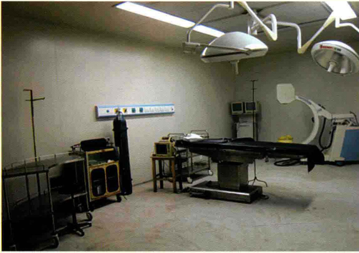
中医院层流净化手术室