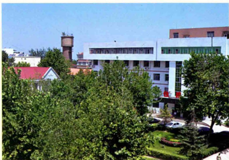
高邑县医院住院部