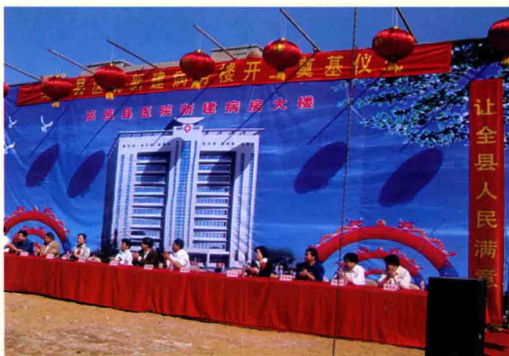
2009年9月21日上午县四大班子领导、市卫生局领导出席高邑县医院新病房楼奠基仪式