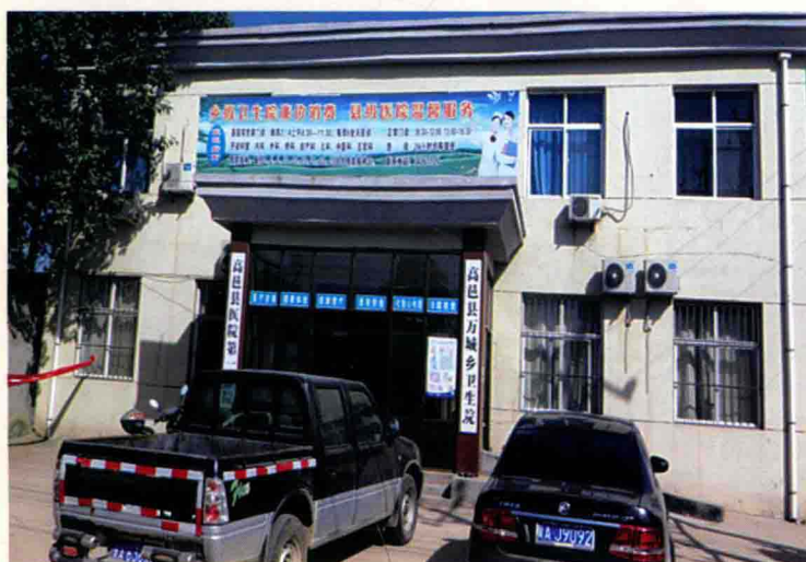
高邑县万城乡卫生院门诊楼