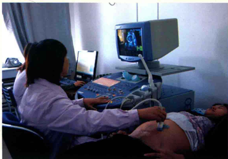
高邑县妇幼保健院四维B超