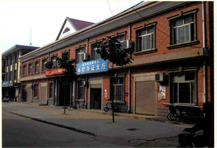
高邑县疾控中心办公楼