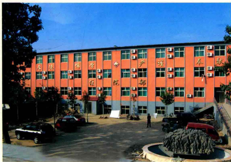
高邑县中医院住院部