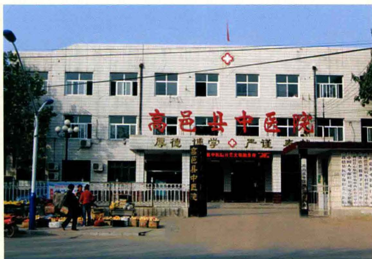
高邑县中医院门诊楼