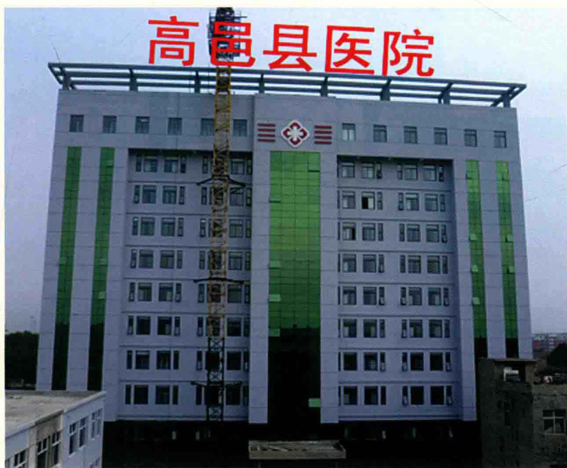
高邑县医院在建12层病房楼