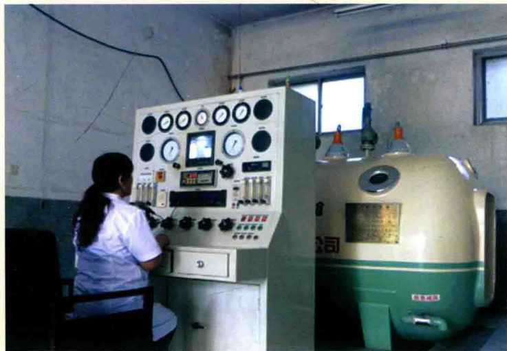
高邑县医院高压氧舱室