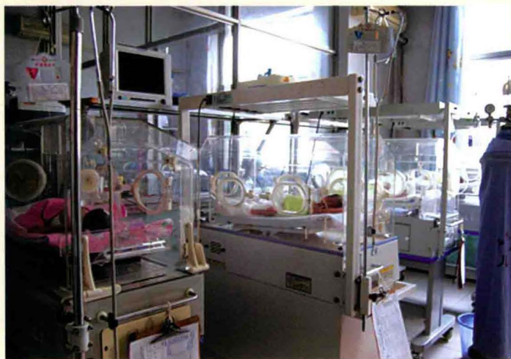
高邑县医院新生儿科