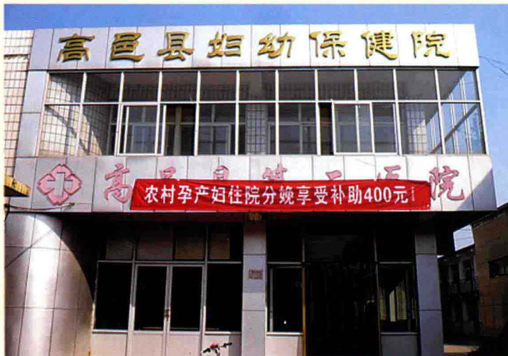
高邑县妇幼保健院办公楼