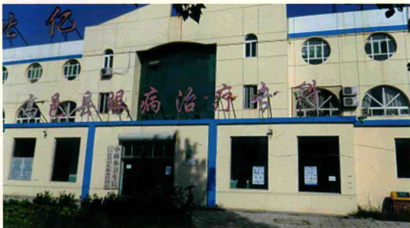
高邑县中韩乡卫生院