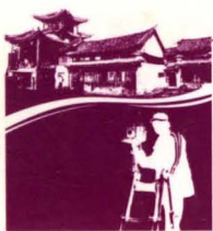
Image and Video Culture of Chinese Bai Villages