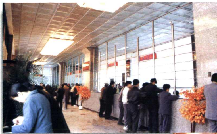
▲地区局邮政营业大厅