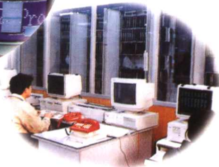
▲地区局传输中心机房