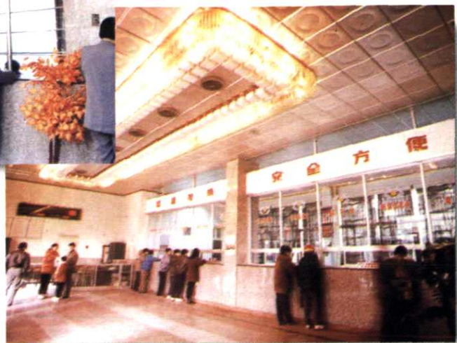
▲地区局电信营业大厅