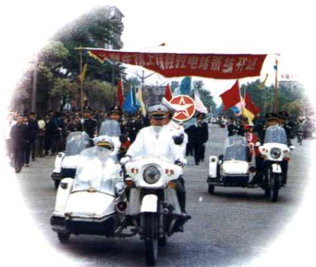
▼1990年4月21日，地区局职工在上饶市街道庆祝上饶程控电话开通。