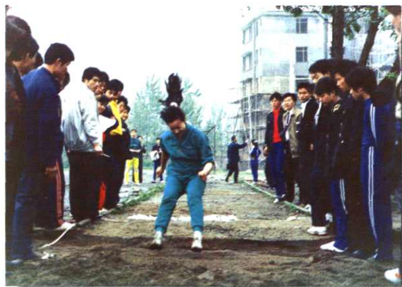
▲职工在首届田径运动会上，进取拼搏，力争取得好成绩。