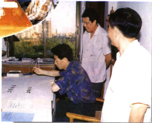
▼1996年11月19日，邮电部副部长杨贤足（右三）视察地区局。