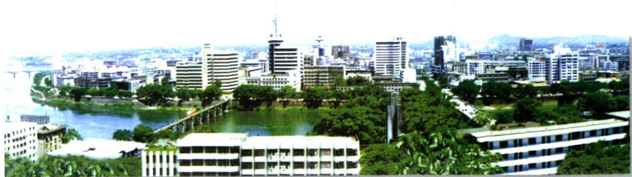
上饶地区邮电局屹立在上饶市信江河畔