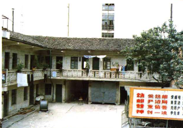
◀地区局原局房一角