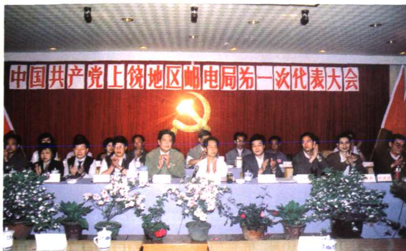
▲1993年4月28~29日,召开中共上饶地区邮电局第一次代表大会,图为大会主席台。