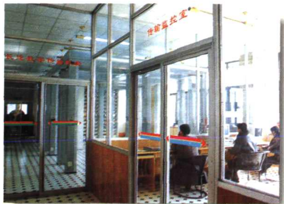
▲地区局传输监控室