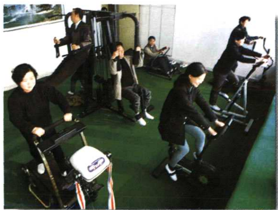
▲地区局职工健身房