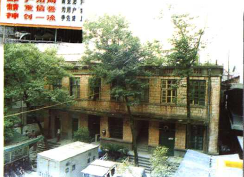
▲地区局原局房“小红楼”