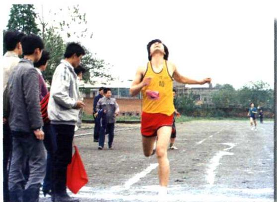
▲1991年4月在首届全区邮电职工田径运动会上，职工在用力一搏。