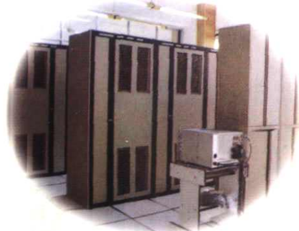
▲地区局“大哥大”机房