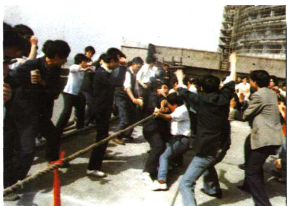
▲地区局职工积极参加全民健身活动，举行拔河比赛。