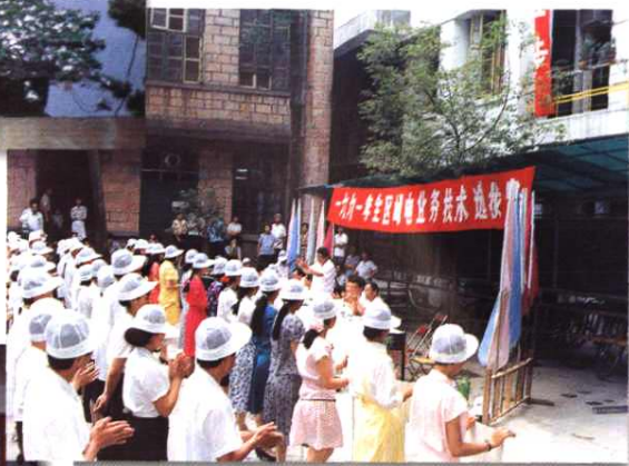
▼1991年6月,地区局举行全区邮电业务技术选拔赛,有136名选手参赛,图为选手在开幕式上。