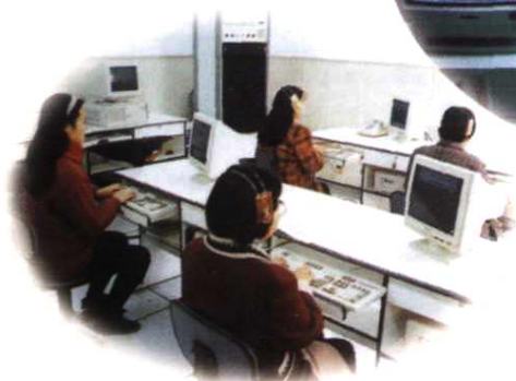
▲地区局114自动查询台