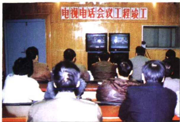
▲1995年12月15日,地区局电视电话会议工程开通。