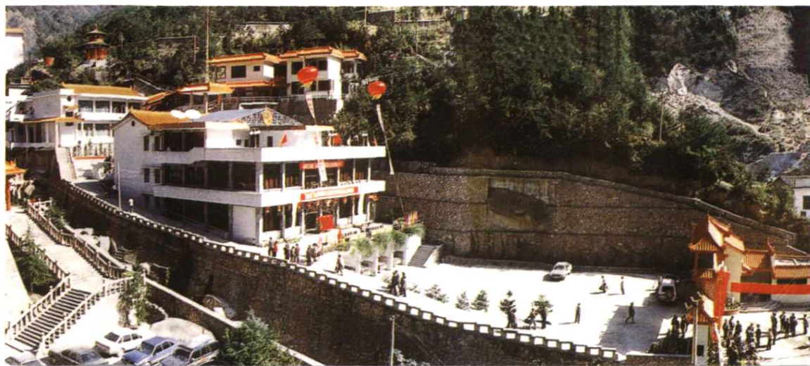
（南星宾馆） ▲上饶地区三清山邮电培训中心