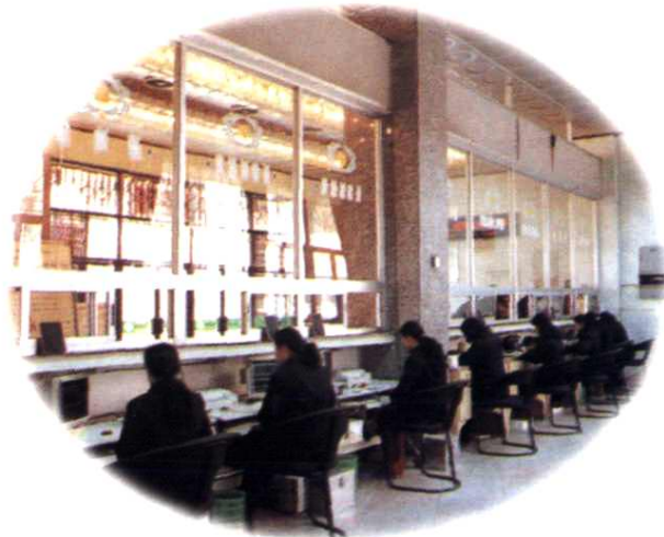
▲地区局电信营业一角