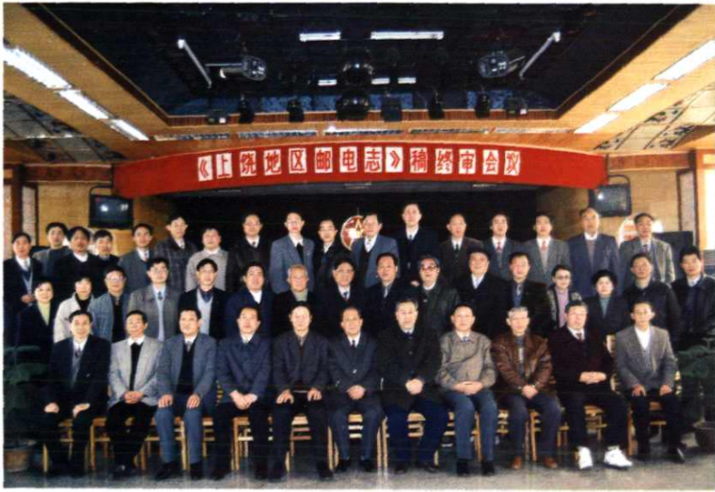
▲参加《上饶地区邮电志》终审会议的全体人员合照