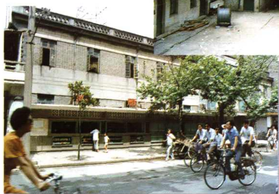
▲地区局原局房西楼