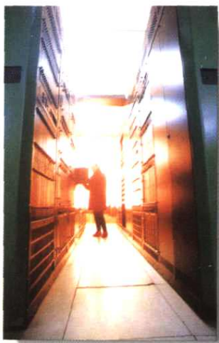
▲地区局数字程控机房