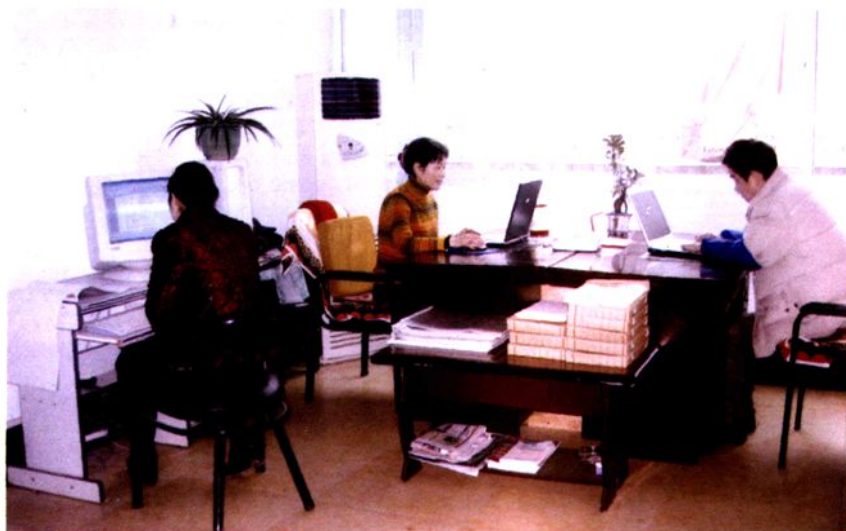
◀ 工作人员实现办公现代化。