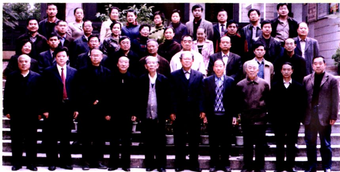
▲ 2006年11月10日，参加《毕节地区志·审计志》审稿会全体人员合影。