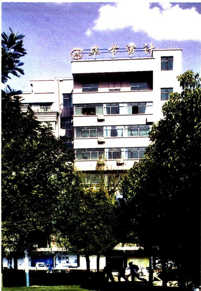
毕节地区审计局办公楼 ▶