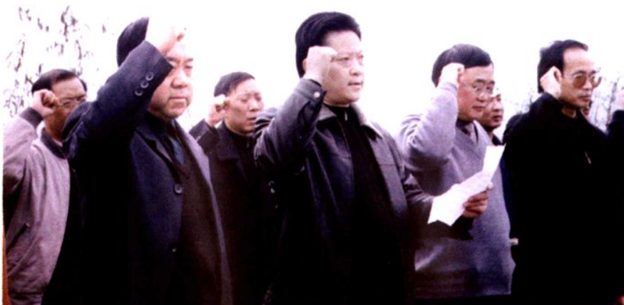
地区审计局共产党员重温入党誓词。▶