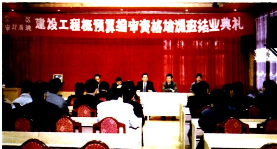
◀ 毕节地区审计系统进行建设工程概预算编审资格培训。