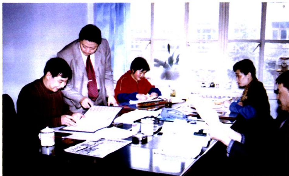
◀ 地区审计局领导深入审计现场指导工作。