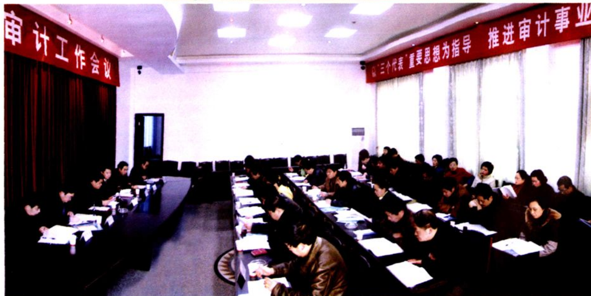
▲ 召开全地区审计工作会议。