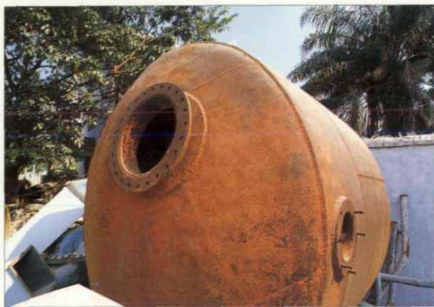
1962年深圳水厂(东湖水厂前身)建成投产时使用的压力过滤罐