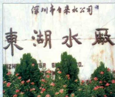
1985年12月29日,国务委员谷牧视察东湖水厂并题写厂名