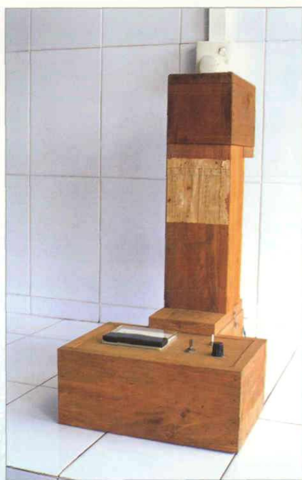
80年代初从广州订做的油度仪