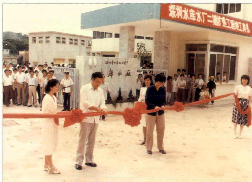
1984年,东湖水厂12万吨/日生产线(又称第二水厂)竣工典礼