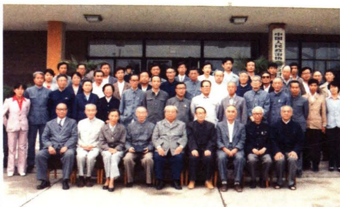
费孝通来甘肃调研时与盟员合影