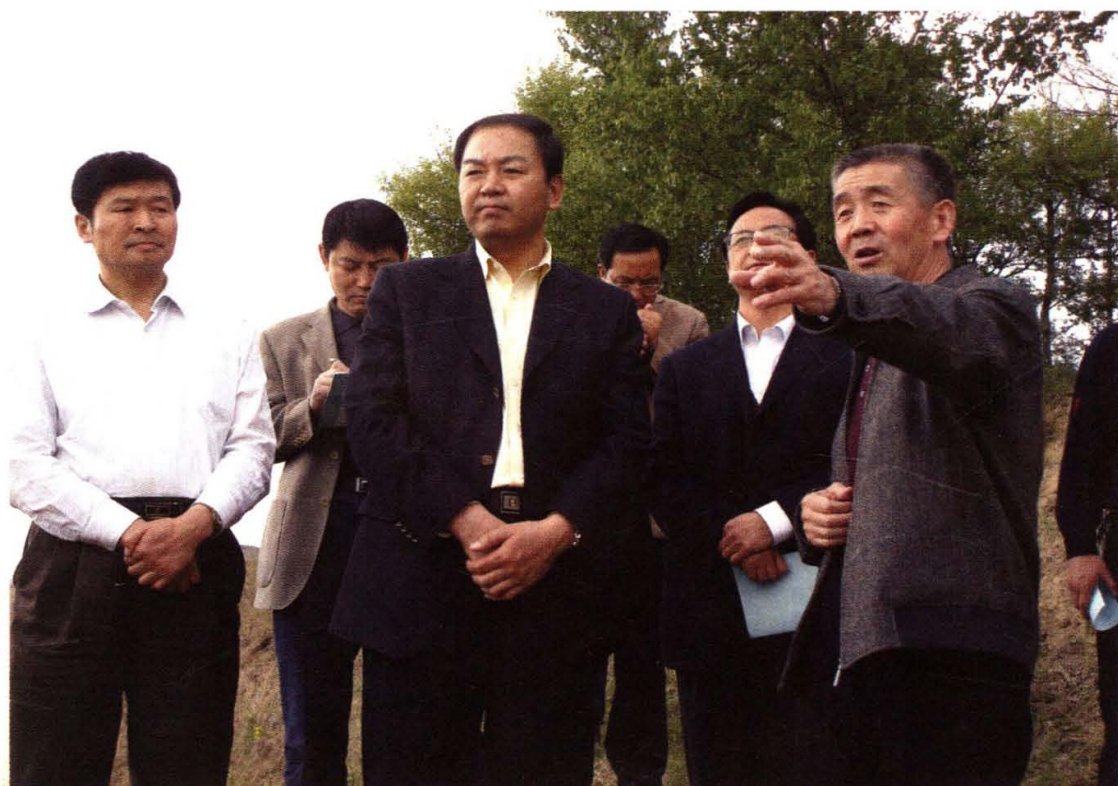
2009年5月，张世珍赴定西调研渭河头生态保护与建设问题