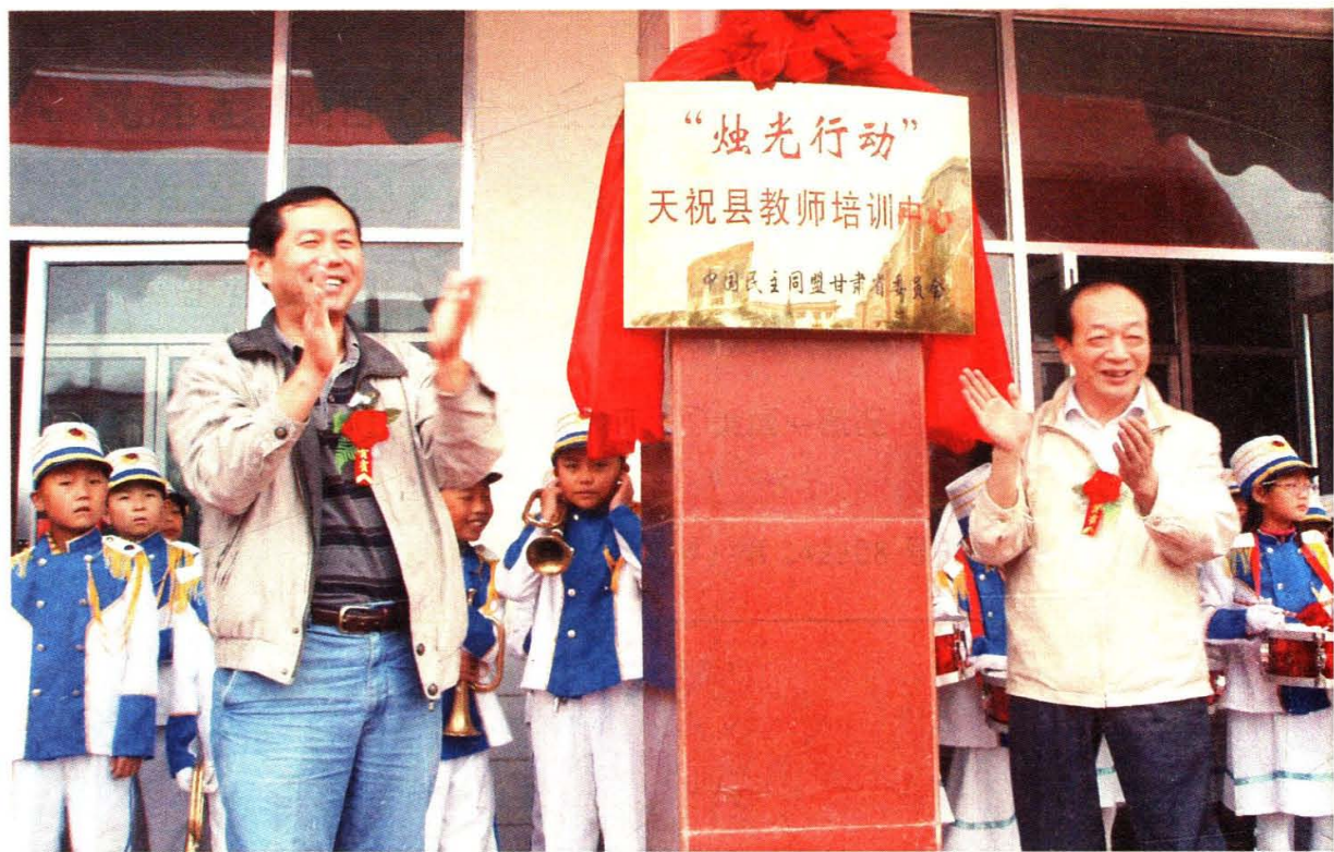
2011年，“烛光行动”天祝县教师培训中心挂牌