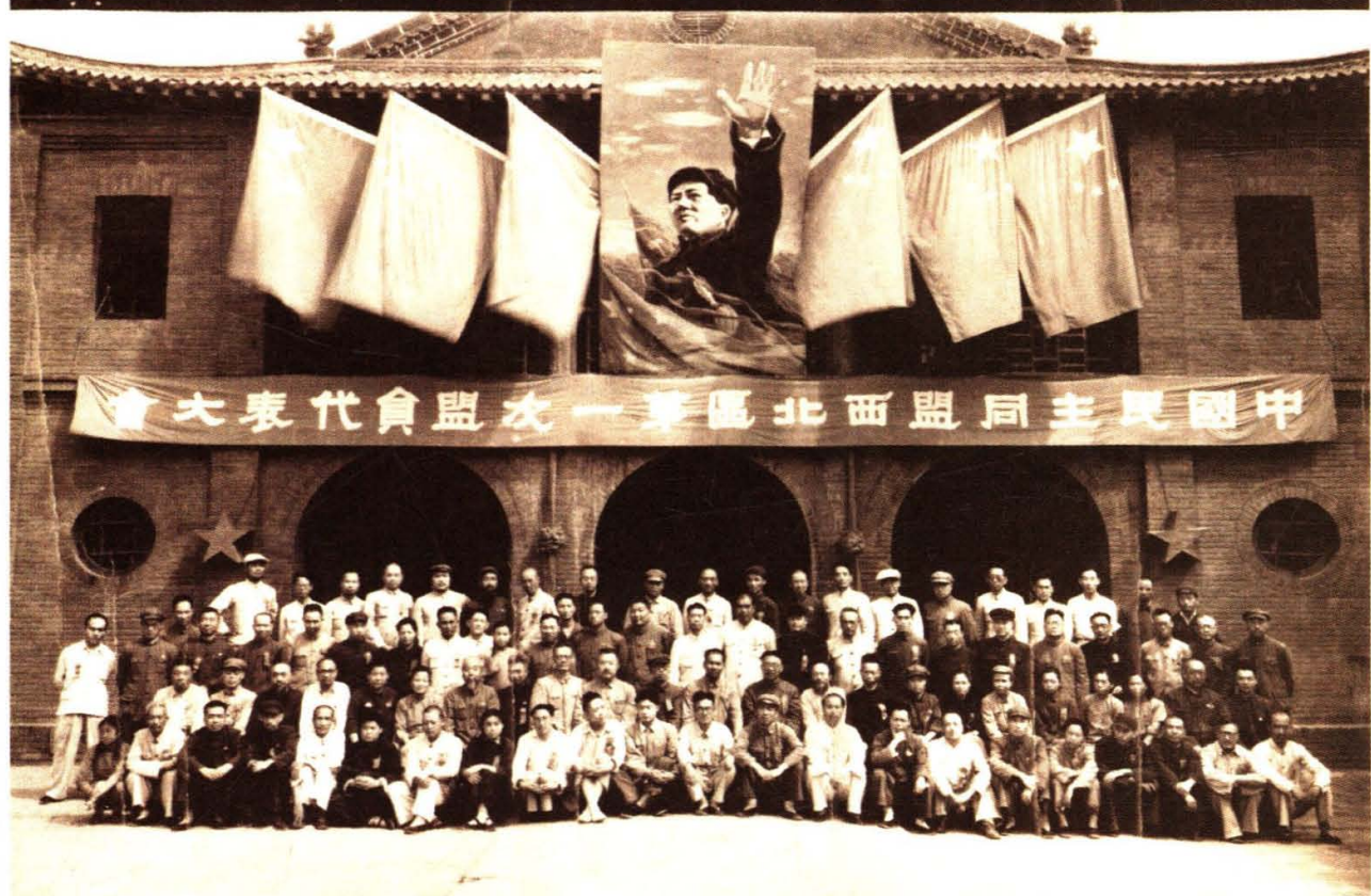
1950年8月24日，民盟西北總支部第一次代表大會全體代表合影