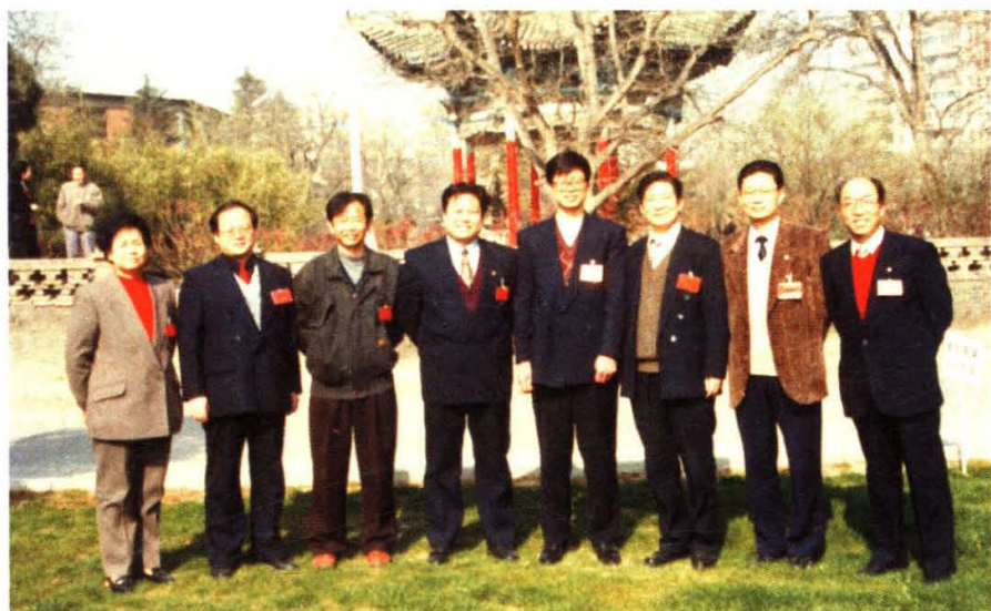
民盟西北师范大学委员会召开自身建设研讨会