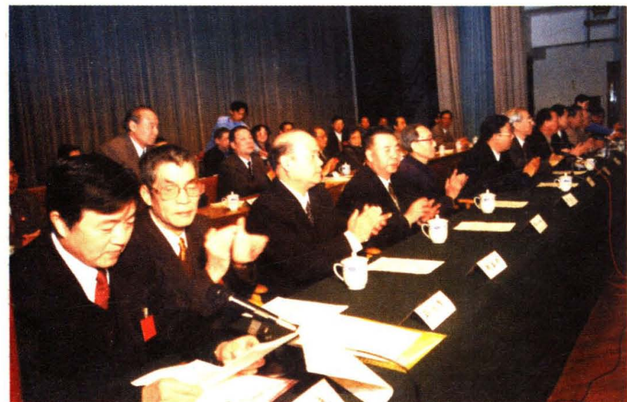
民盟甘肃省第十次代表大会李重庵(左一)当选副主委