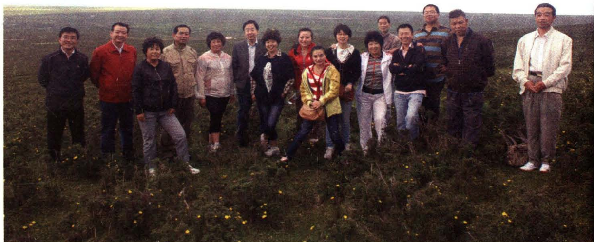
2012年6月，民盟甘肃省委机关赴山丹军马场调研