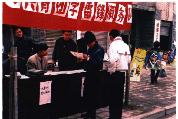
共青团学雷锋服务队在为群众义务服务