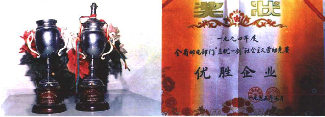
省局颁发的“经济效益贡献杯”与奖状