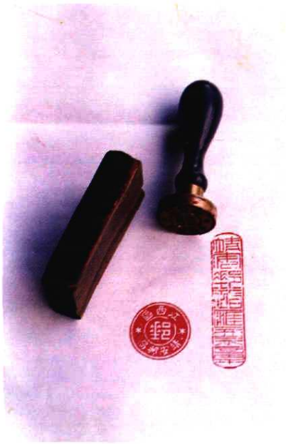
中华邮政时期“江西区靖安邮局” 戳与“邮政汇票章”