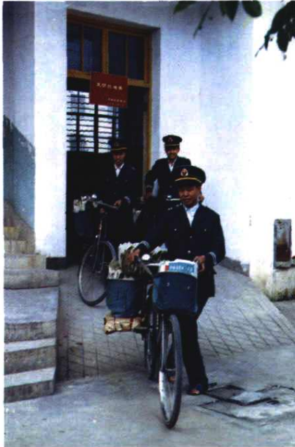
县局投递班被省局命名为“文明投递班”， 图为投递人员出班