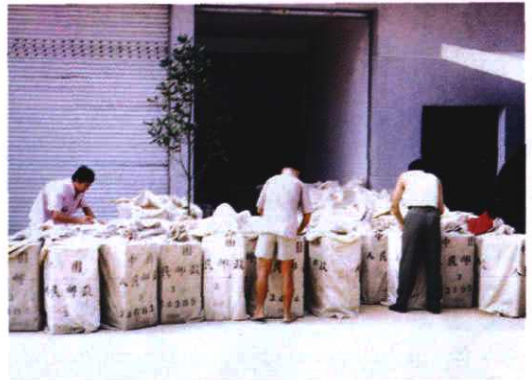
邮政人员上门收寄商包