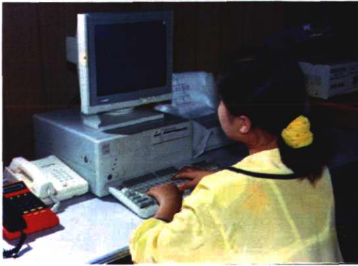
无线寻呼数汉显兼容