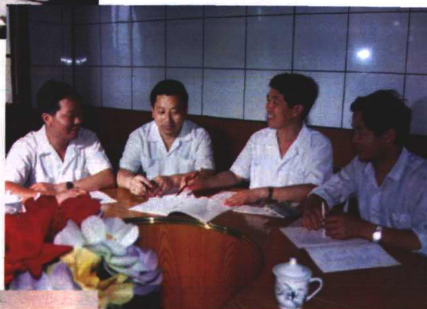
县邮电局领导班子 ▷