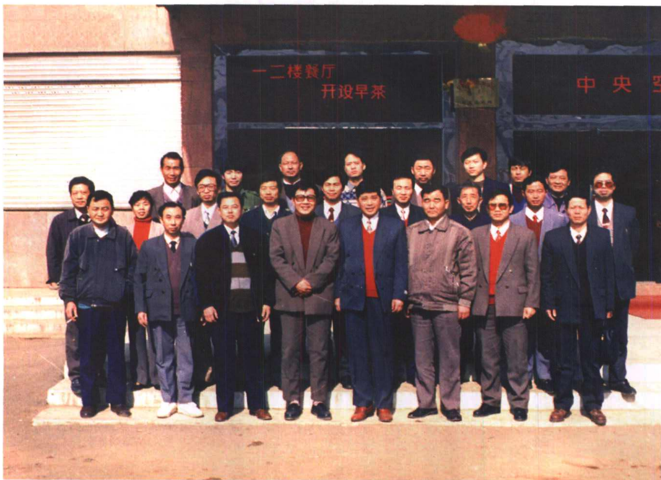
编撰人员与《靖安县邮电志》评审人员合影