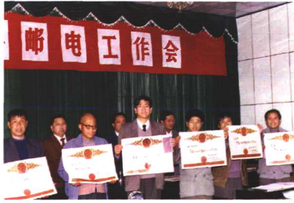
全县邮电工作会议上表彰先进