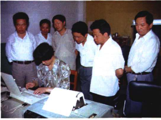
县六套班子成员视察电报房