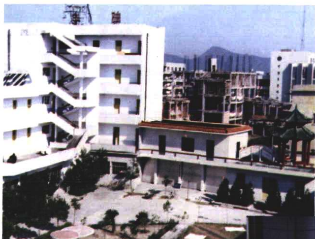
◁ 县局被评为宜春地区园林绿化达标单位,图为园林化的办公环境。