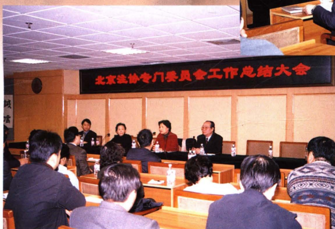
▲ 2002年12月14日,北京注协召开专门委员会工作总结大会