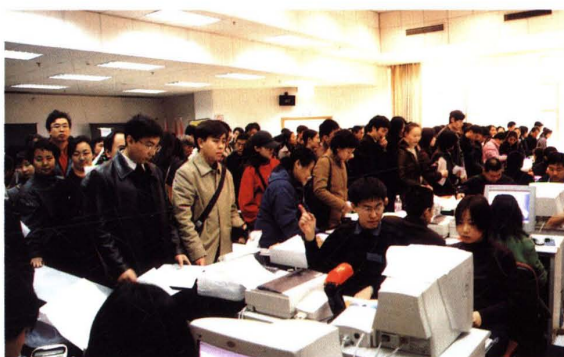
▲ 注册会计师全国统一考试北京考区考生报名踊跃,截至2003年4月初,报考人数超过5万人