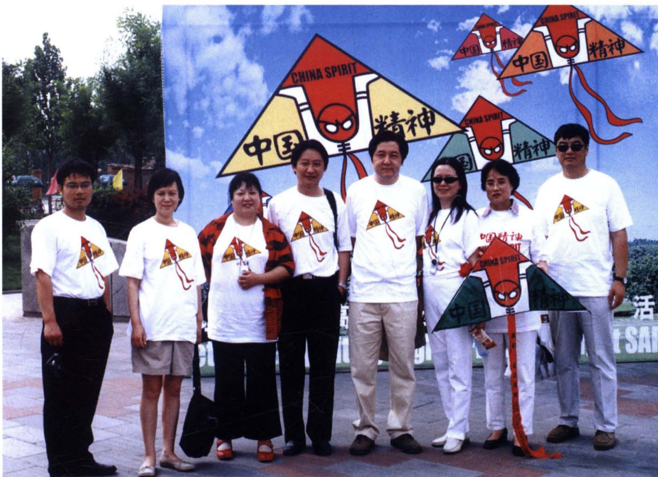
▲ 2003年5月,安永华明等五家会计师事务所积极参与发起和捐助“让中国精神高高飘扬—放风筝 抗非典”活动