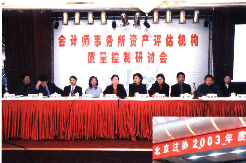
▲ 2003年11月22-23日,北京注协举办“会计师事务所、资产评估机构质量控制研讨会”,业内100多人参加了会议。