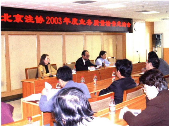
▲ 2003年10月29日,北京注协组织召开“2003年度业务检查工作总结通报会”