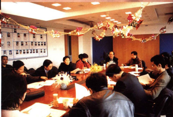
▲ 2003年3月7日,后续教育专家委员会召开会议