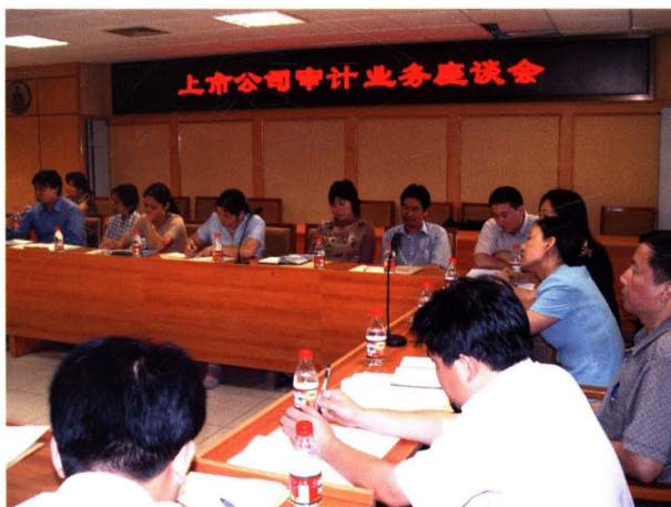
▲ 2003年8月28日,北京注协召开“上市公司审计业务座谈会”。对上市公司审计业务中新审计报告准则执行等问题进行研讨