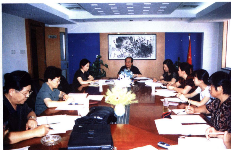
◀ 2003年7月1日,北京注册会计师协会召开财务会计基础工作规范委员会,重新修定行业《会计工作考核标准》;研究据此组织培训及考核工作