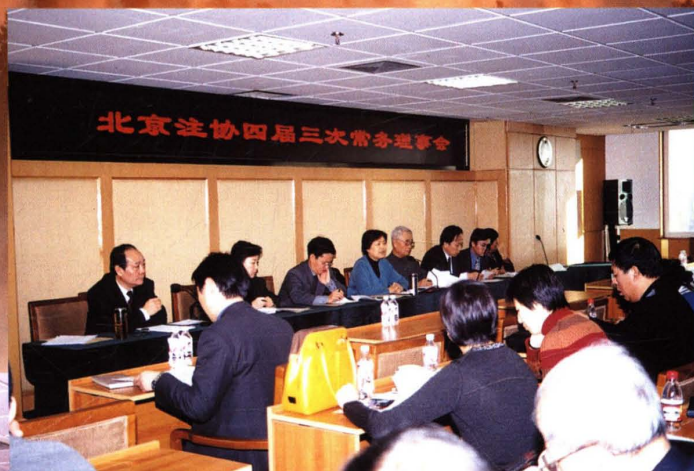
▲ 2003年1月28日,北京注协召开四届三次常务理事会议,会上审议并原则通过调整理事、常务理事等提案