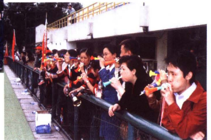
▼ 京都所啦啦队为比赛助威