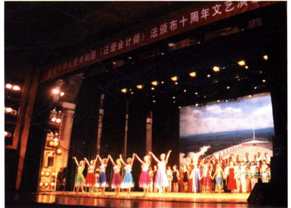
▲ 2003年10月18日,北京注协举办庆祝“《注册会计师法》颁布十周年”大型文艺演出