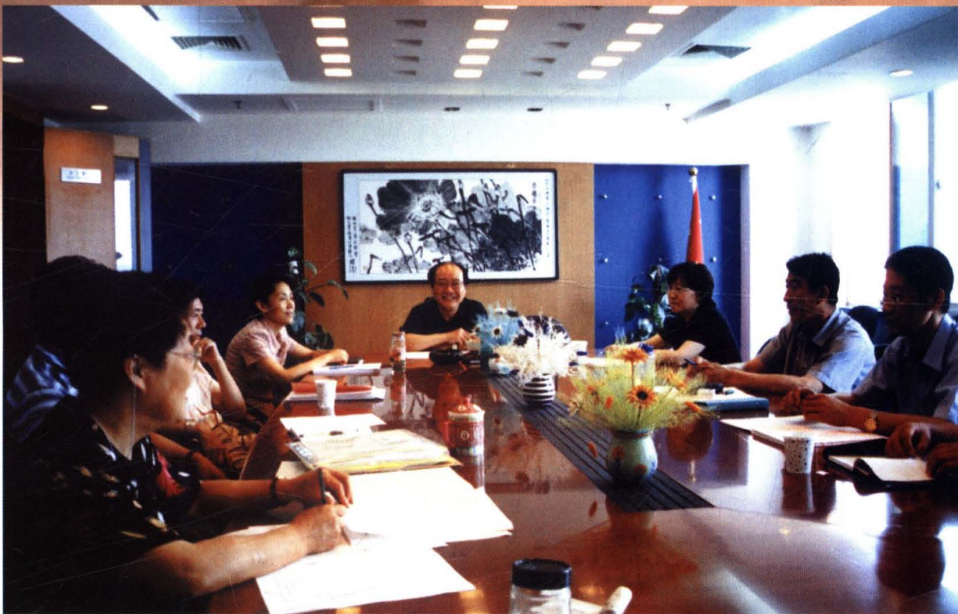
▲ 2003年6月25日,北京注册会计师协会党委召开第五次会议,首批发展4名预备党员