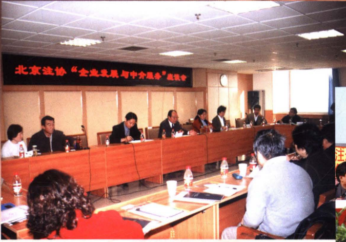
▲ 2003年10月23日,北京注协组织召开“企业发展与中介服务”座谈会