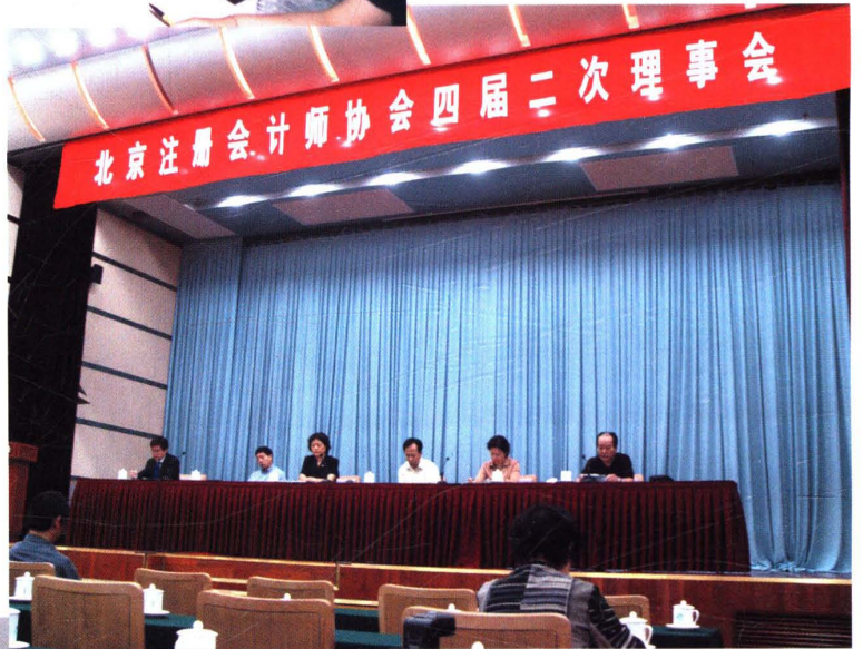
▲ 2003年9月10日,北京注协召开四届二次理事会