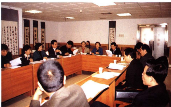
▲ 2003年3月25日,专业指导委员会召开会议