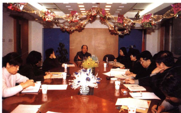
▲ 2003年3月11日,财务工作规范指导委员会召开会议