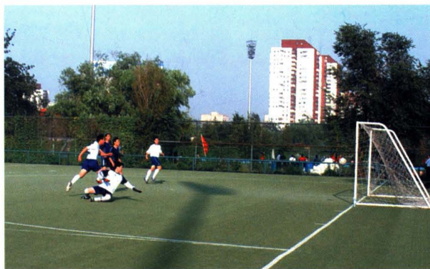
▲ 2003年9月6日,“诚信杯”足球赛小组赛正式开赛