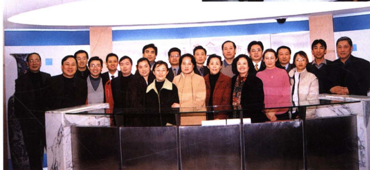
◀ 2002年12月14日,北京注协召开专门委员会工作总结大会。图为专业指导委员会委员合影