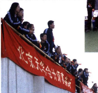
▼ 天华啦啦队为比赛助威