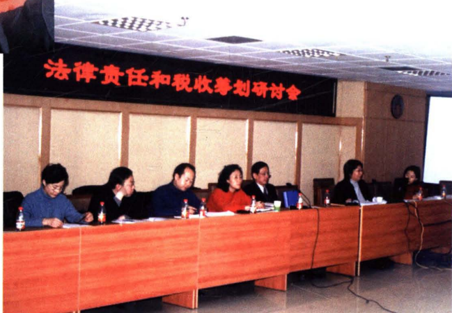
▲ 2003年12月12日,北京注协举办“法律责任和税收筹划研讨会”