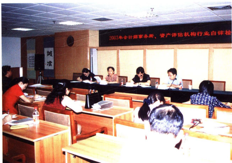
▶ 2003年7月10日,北京注册会计师协会召开“2003年度会计师事务所、资产评估机构行业自律检查工作动员会”