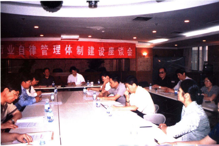
▲ 2003年7月23日,北京注协秘书处及部分执业机构负责人应邀参加中注协举办的行业自律管理体制建设座谈会