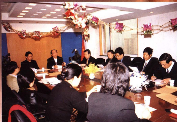
▲ 北京注协五个专门委员会分别召开会议,讨论委员会建设及加强行业自律管理等问题。图为2003年3月6日编辑委员会召开会议