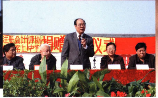
▲ 2003年10月23日,北京注协向房山区琉璃河窑上中学捐赠电脑