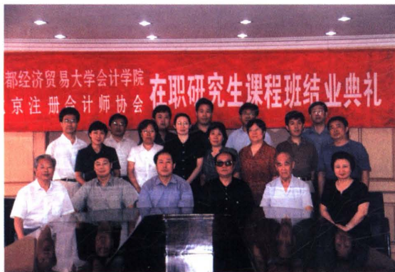
▲ 2003年7月15日,首都经贸大学、北京注协联合举办的第二期在职研究生班结业。图为首都经贸大学、北京注协领导与学员合影