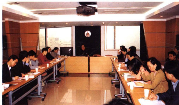
▲ 2003年4月2日,惩戒及权益保障委员会召开会议