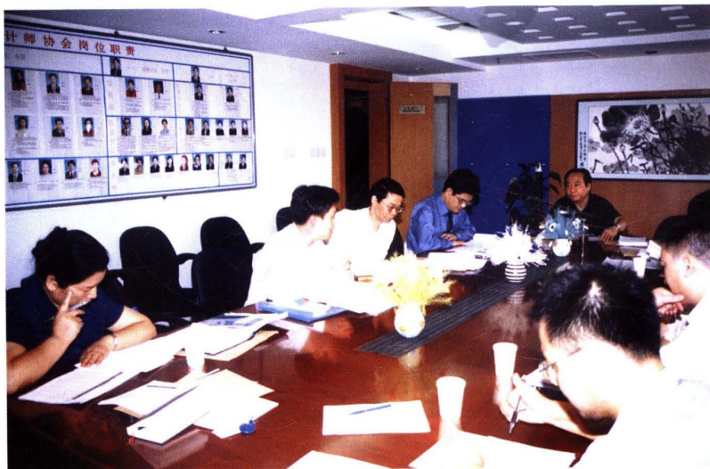
▲ 2003年6月17日,北京注册会计师协会召开编辑委员会评审组工作会议,讨论通过协会首批委托研究项目