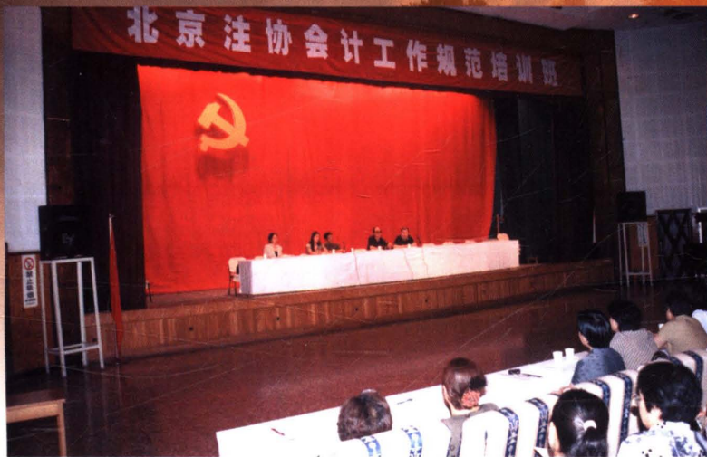
▲ 2003年7月16日,北京注协举办“会计师事务所,资产评估机构会计工作规范考核标准培训班”,会议邀请市财政局会计处,监督处有关领导出席