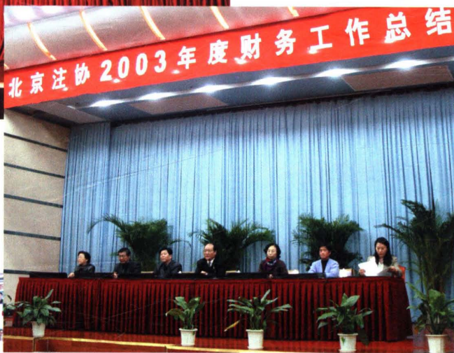
▲ 2004年1月14日,北京注协召开“2003年度财务工作总结会”