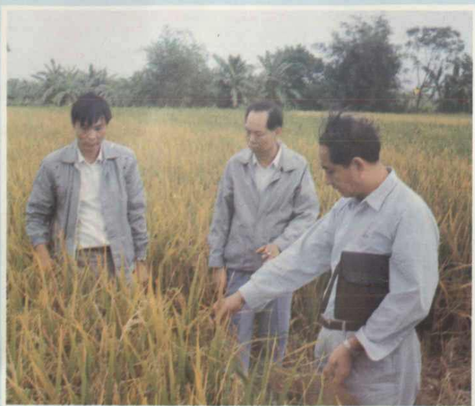
市粮食局领导参观道滘粮所种子田