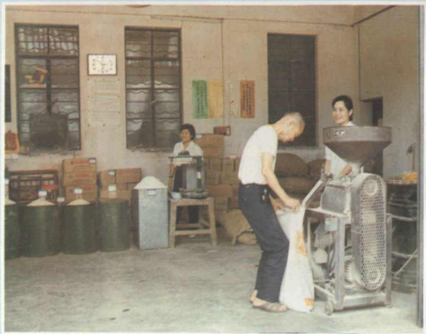
清溪粮所粮店为群众免费加工复碾米