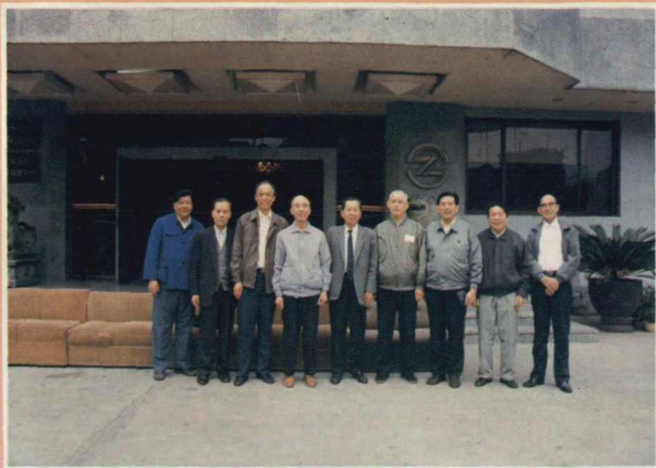
商业部和省、市领导视察我局后合影