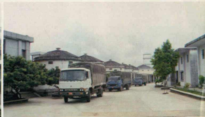
大岭山粮所汽车运粮忙