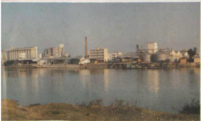
鯉魚洲上新興工業之花——東莞市糧油食品工業公司