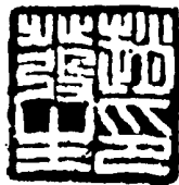
原商业部副部长赵发生题词