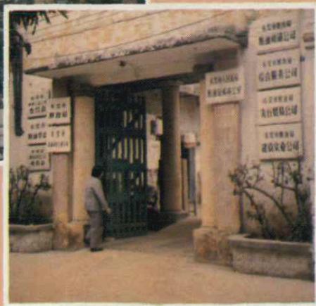
原东莞粮食局办公室门面 （1950—1987年在此办公）