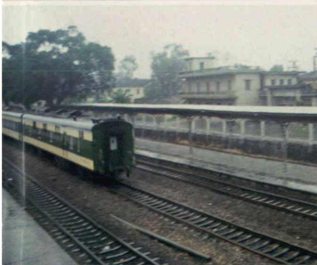
常平粮所和加工厂位于常平火车站旁，交通运输方便