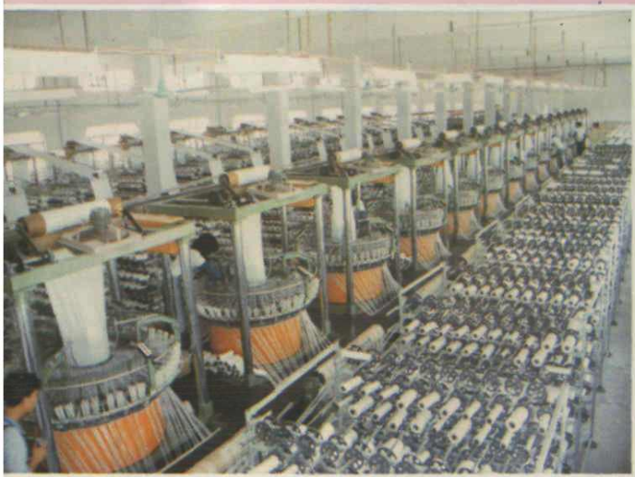
东莞泰馥纤维有限公司引进泰国、台湾纤维生产线投产