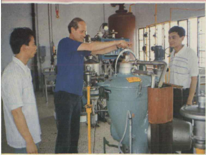
瑞典亚法拉伐公司专家为铭东油脂有限公司植物油厂投产试机