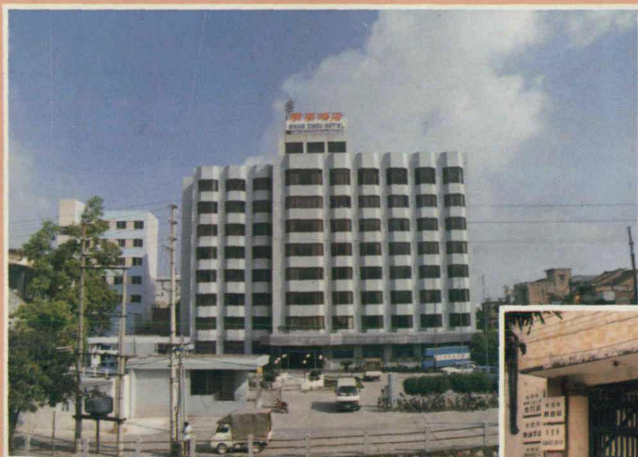
东莞市粮食局办公楼和珊洲酒店（1987年建）