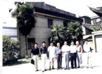
体育路小学办公地点