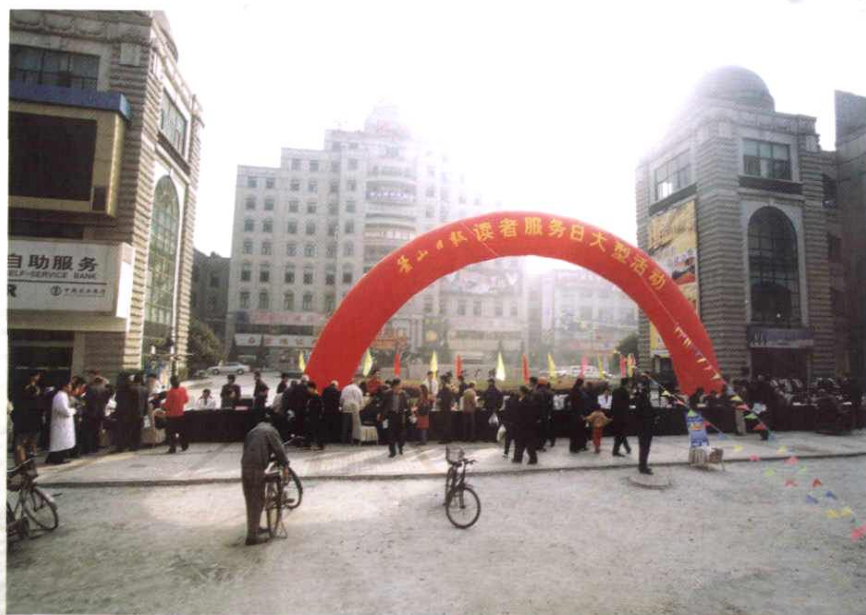
举行读者服务日 大型活动