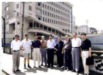
贸易大楼办公地点