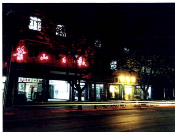
1991 年至 2001 年在人民路 144 号办公