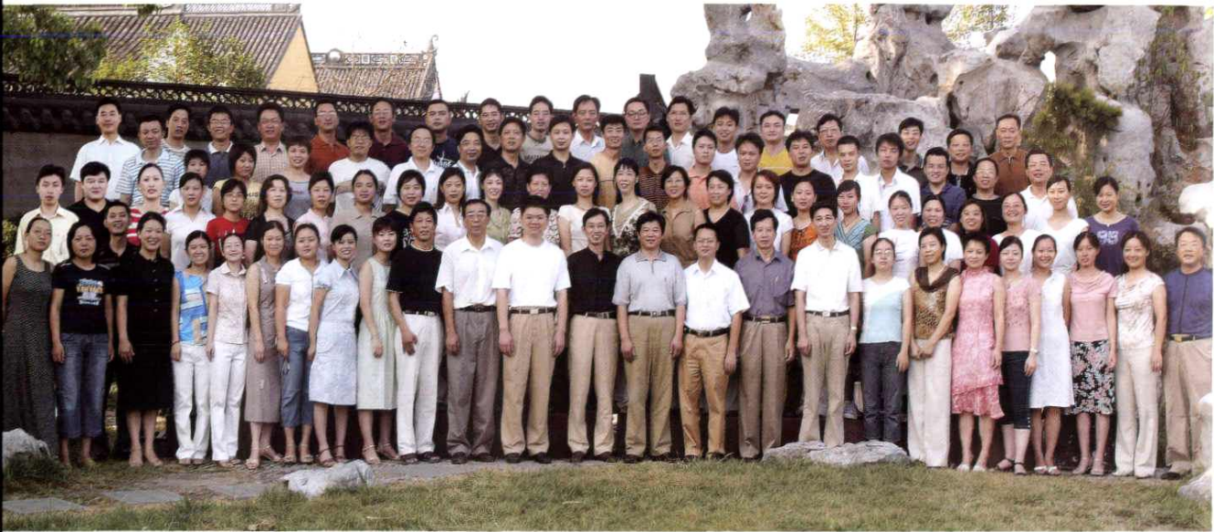
萧山日报全体员工合影