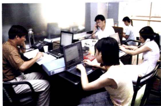
记者精心采写稿件