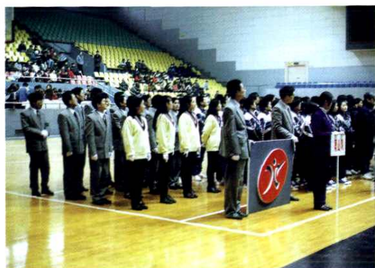
举行丰富多彩的体育活动