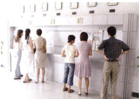
每天对报纸进行评议