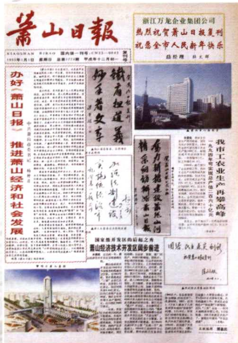
1995年1月1日《萧山日报》复刊号