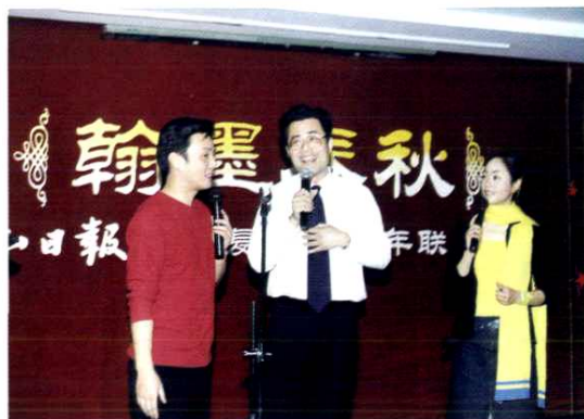
在复刊十周年联欢会上表演节目