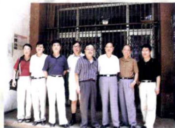
《萧山农科报》时的办公地点：体育路 13 号萧山科委二楼