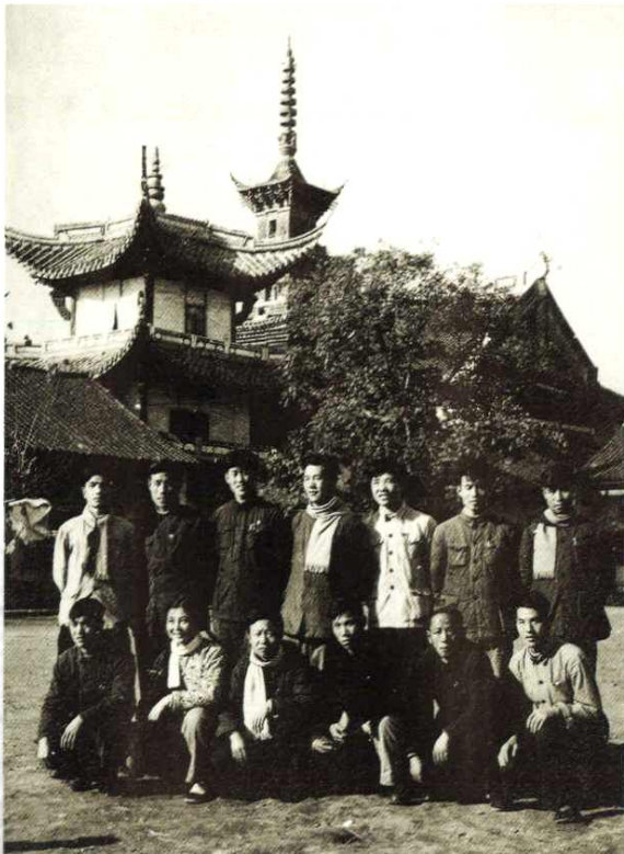
1960年创刊6周年全体同志合影