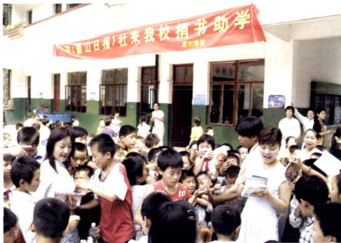
送书到民工子弟学校