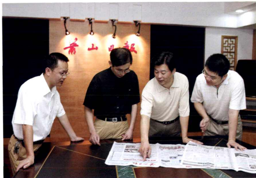
领导班子研究版面