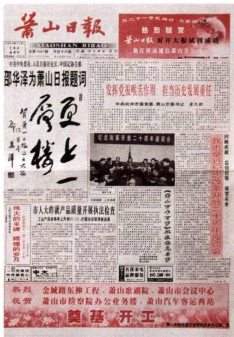
1998年12月18日对开大报试刊号