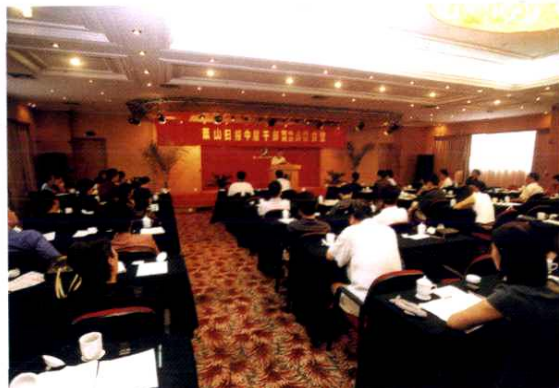
中层干部竞争上岗已成为选拔部门负责人 负责人的惯例