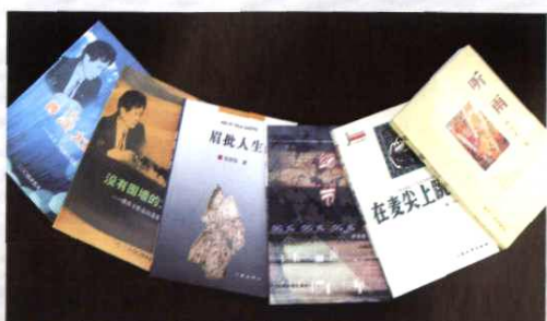
记者出版的作品集