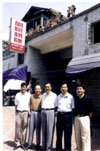
剧院招待所办公地点