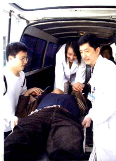
记者在“120”急救中心 体验生活