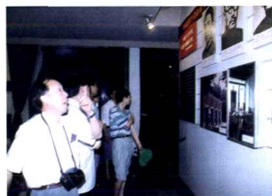
冒雨在上海中共一大会址参观