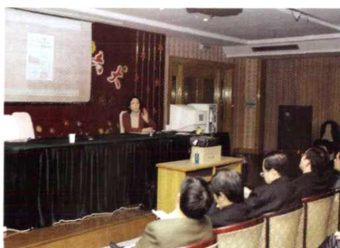
请美院教授开设版式讲座