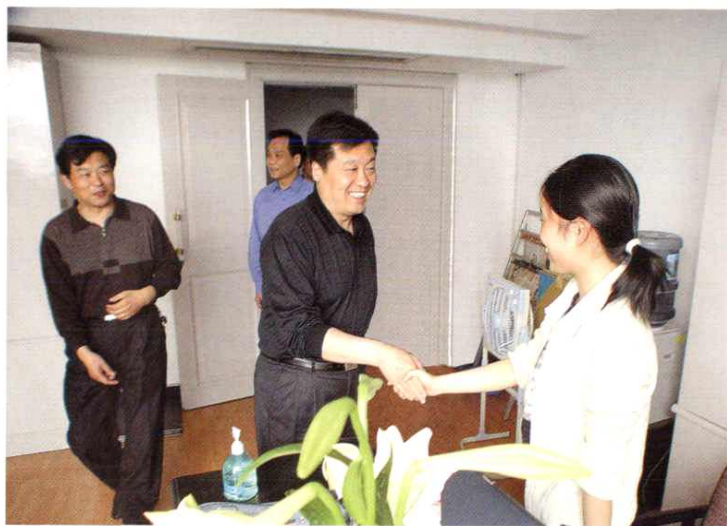
◀ 2003年，杭州市委副书记、萧山区委书记王建满在非典时间慰问报社采编人员