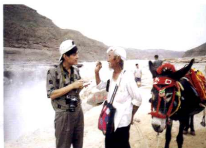
远赴革命根据地延安采访