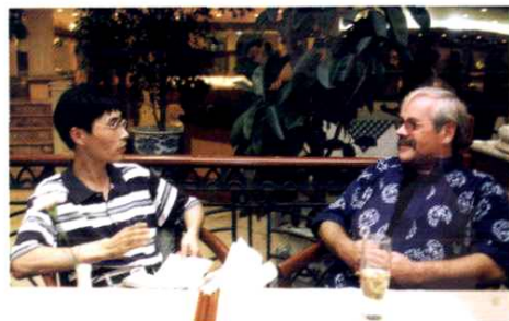
采访德国著名足球教练施拉普那