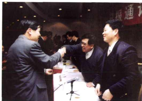
一年一度的通讯员工作会议