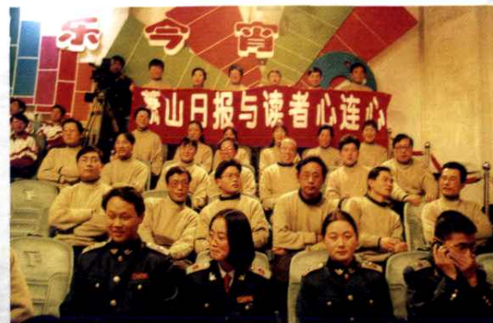
参加《欢乐今宵》电视节目摄制