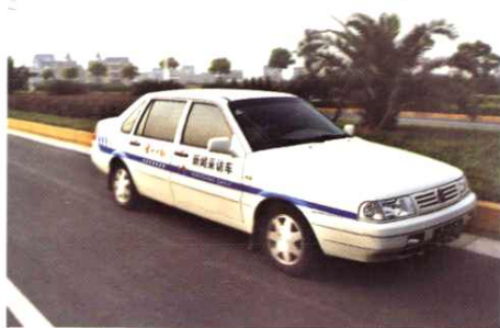
采访车行驶在农村