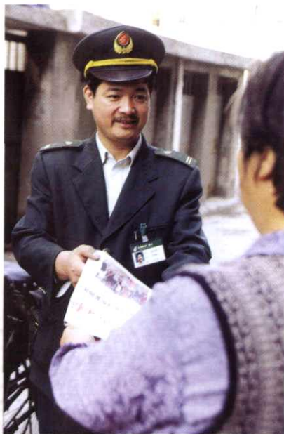
将报纸及时送到读者手中