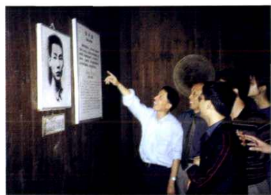
参观新四军战斗过的地方