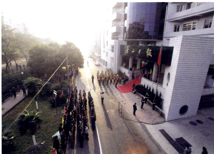
在城河街 88 号报社办公大楼举行升旗仪式