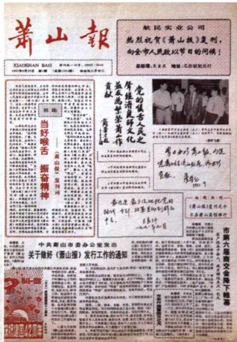
1991年9月29日《萧山报》复刊号