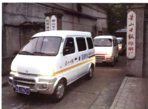
直递专车确保镇、街道机关开门见报