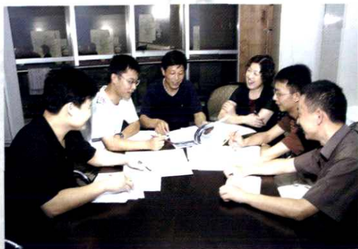
编辑谈版会上安排版面