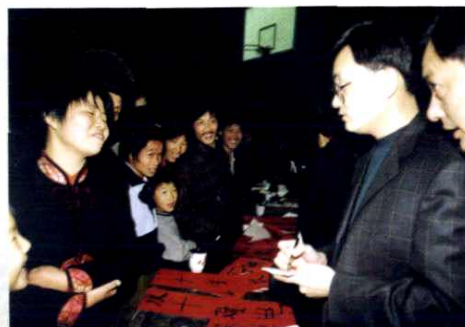
赶赴农村采访对联比赛