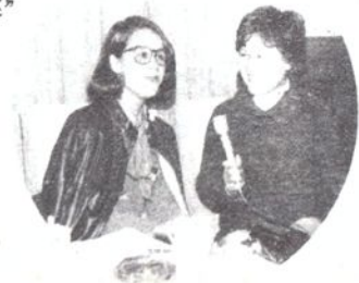
1985年4月6日，苏州电视记者采访巴西演员《女奴》“伊佐拉”