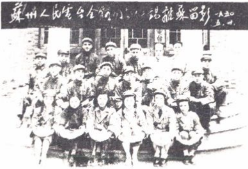
苏州人民广播电台工作人员