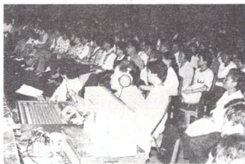
1988年10月3日，《振兴越剧》演出时的现场录音