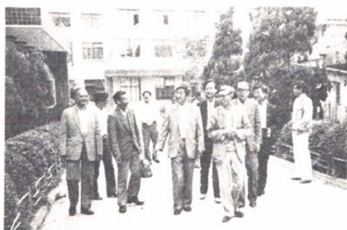
1988年5月30日，广播电影电视部副部长徐崇华来局（台）检查指导工作