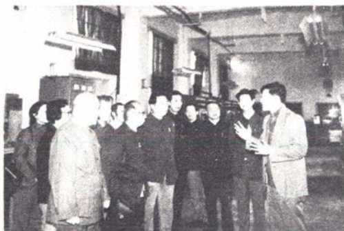
苏州市政协委员到苏州电视台考察工作。