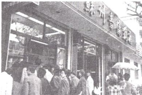
1989年，苏州音像总汇和苏州市广播电视服务公司新营业厅对外开张