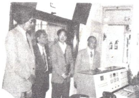
1987年5月3日，全印广播电视代表团来电台参观访问