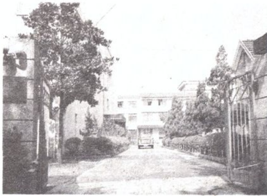
苏州市广播电视局 苏州人民广播电台 门景