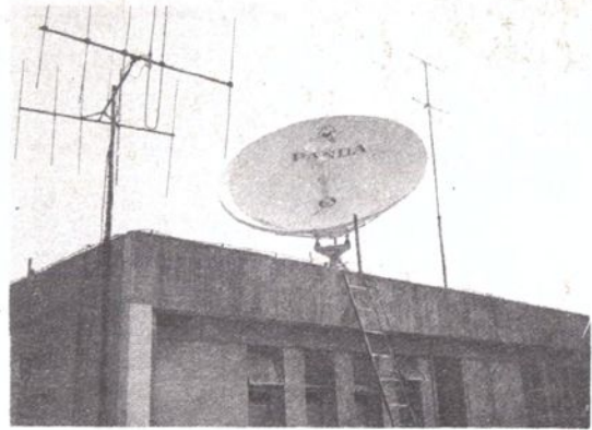
苏州人民广播电台的广播卫星地面接受站