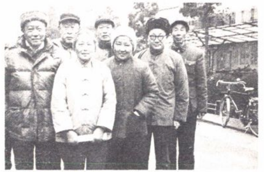
苏州广播电视局的离休干部