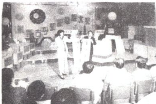
举办“苏州古今知识电视大奖赛”