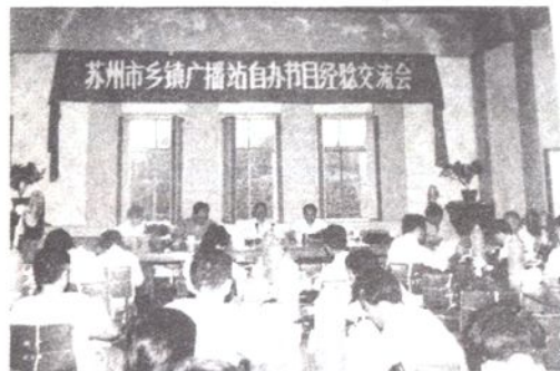
1986年6月在我市太仓县召开乡镇广播站自办节目经验交流会