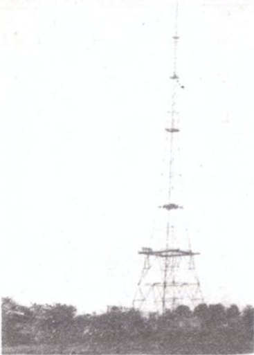
苏州电视台发射塔