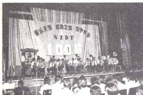
1987年9月5日，苏州电台举办的《音乐天地》、《戏曲之友》、《空中书会》节目播出100期文艺晚会