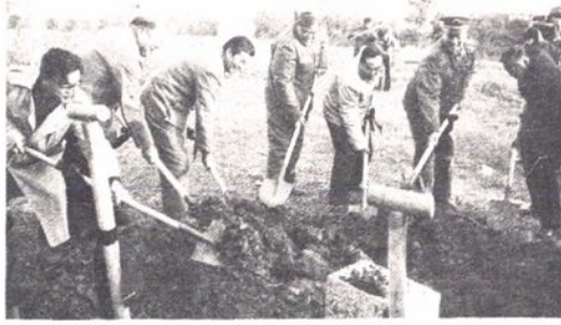
1987年12月18日，苏州市委、市人大、市政府领导 同志为苏州电视台第二期工程奠基铲土