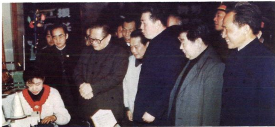
1991年3月12日，江泽民视察江南机器厂。

1991年4月29日，江泽民、杨尚昆、万里等党和国家领导人接见全国“五一”劳动奖章获得者、衡阳中药厂厂长申甲球。