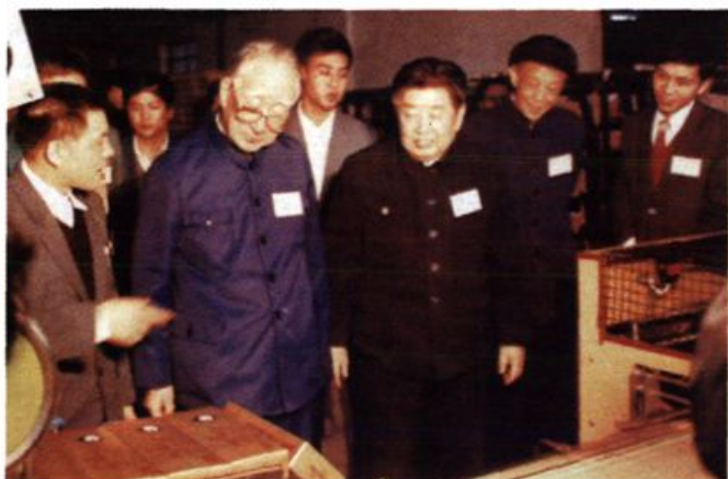
1985年6月，薄一波 视察长沙卷烟厂。