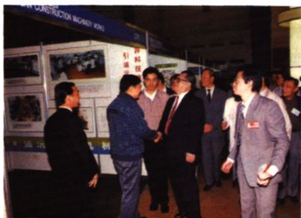
1989年9月21日，江泽民在“中国工业40年大型企业成就展览会”上，参观浦沅工程机械总厂的展位。