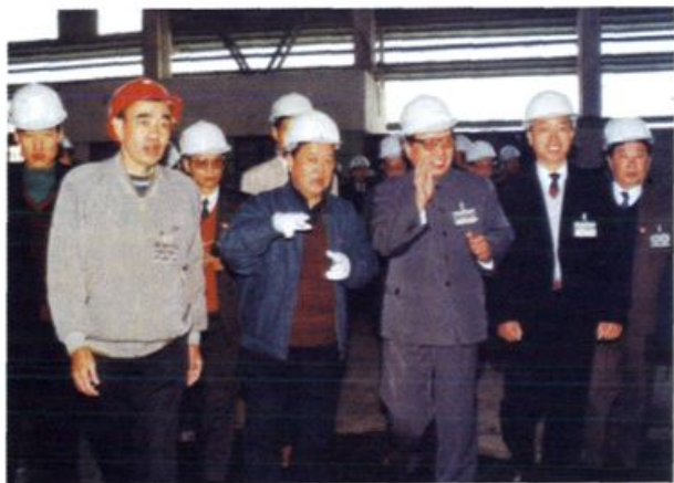
1992年11月15日，乔石视察衡阳钢管厂。