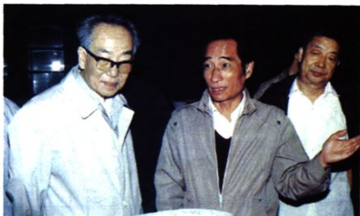
1990年5月11日，王任重视察湖南建湘瓷厂。