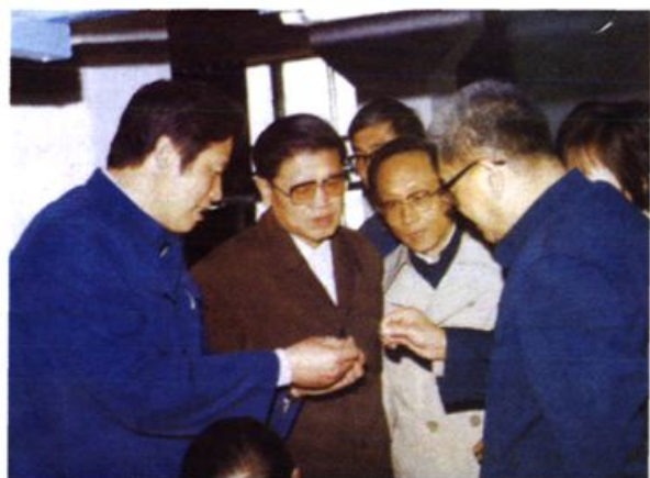
1985年11月25日， 李铁映视察湖南电位器 总厂。