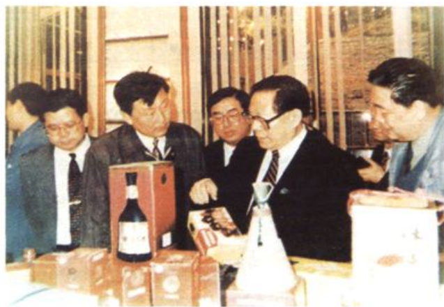
1994年5月，江泽民 参观湖南食品工业展览。