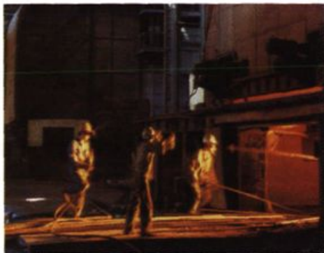
1969年，省内第一座5吨氧气顶吹转炉在涟源钢铁厂诞生。图为“涟钢”炼钢车间一角。