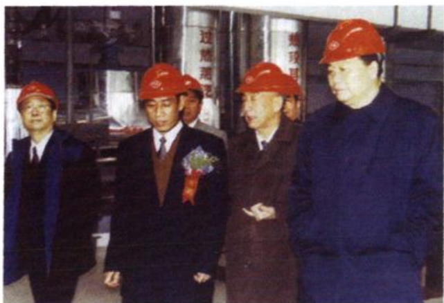
1997年12月23日， 邹家华视察湘潭电厂首 台30万千瓦机组。