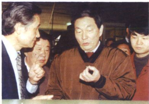
1993年4月16日，朱镕基 视察株洲火炬火花塞公司。