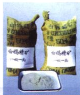
1995年被评为中国冶炼生产金属铋最大企业的湖南柿竹园有色金属矿的部分产品样品。