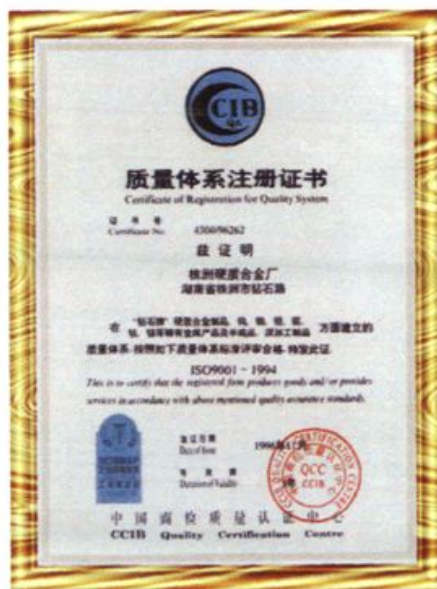
株洲硬质合金厂 1996年获得的《质量 体系注册证书》。