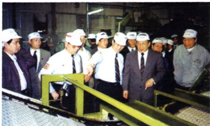
1996年5月10日，李岚清视察台资企业湖南旺旺食品有限公司。