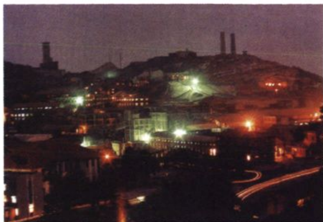
世界锡都、百年老矿 ——新化锡矿山矿务局。