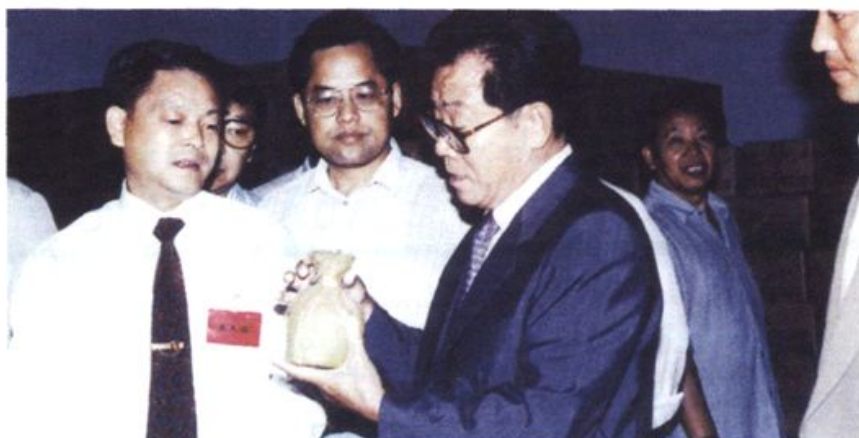
1994年7月10日，李瑞环视察湘泉集团公司。