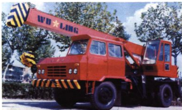
20世纪80年代后期，浦沅工程机械总厂开发生产的大吨位汽车起重机。