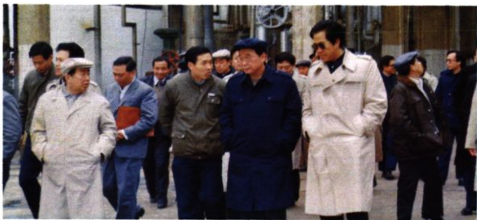
1987年3月9日，李鹏视察洞庭氮肥厂。