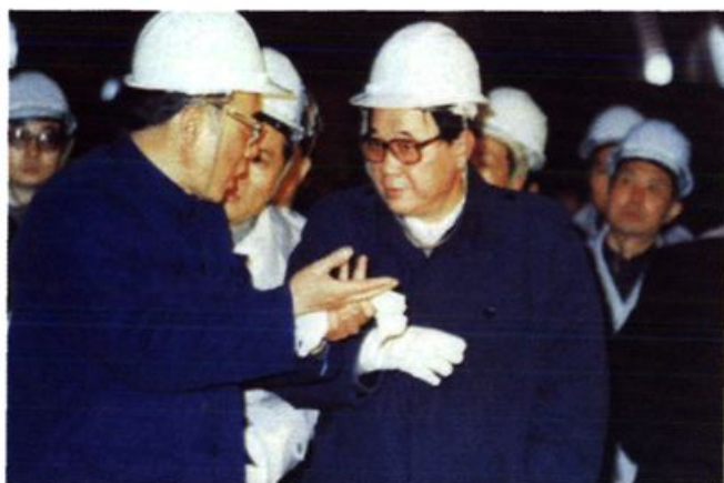
1987年3月8日， 李鹏视察湘潭钢铁 公司。