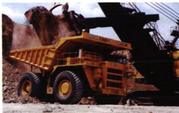
1987年，湘潭电机厂引进技术开发生产的154吨电动轮自卸车。