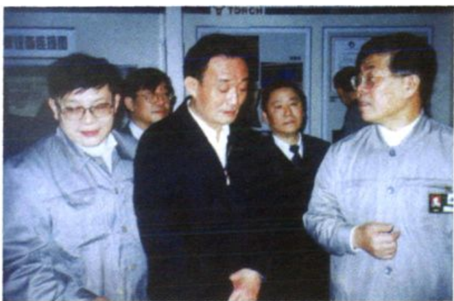
2000年4月15日， 吴邦国视察株洲冶炼厂。