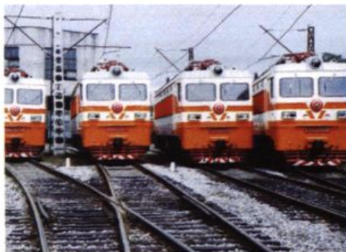
1991年6月，株洲电力机车厂生产的韶山6型电力机车在国际招标中中标。