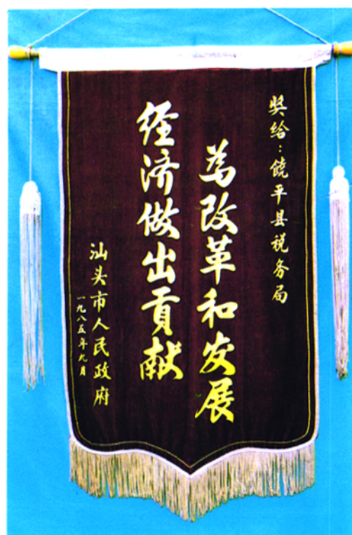
▲ 一九八五年汕头市人民政府授予饶平县税务局为市税务系统先进集体的奖旗。