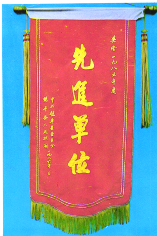
▲ 中共饶平县委、县人民政府授予饶平县税务局为一九八五年先进单位的锦旗。