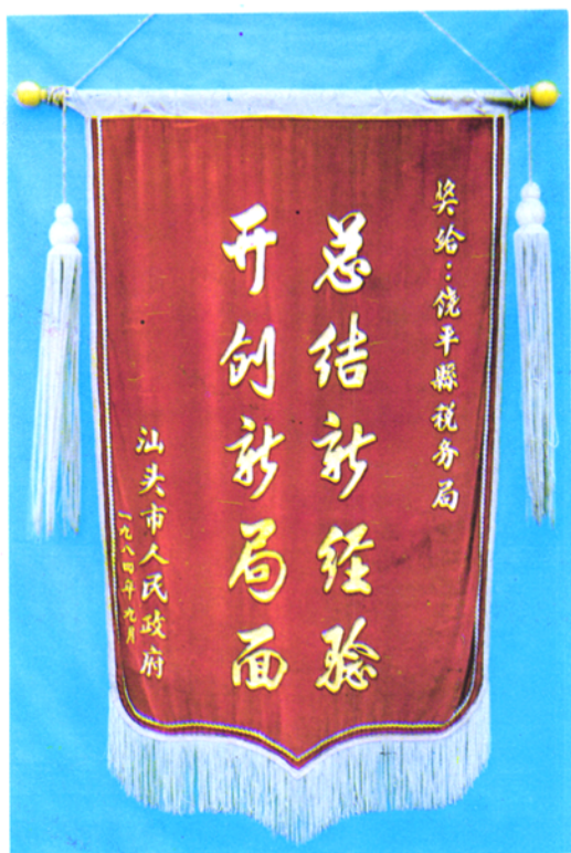
▲ 一九八四年九月汕头市人民政府授予饶平县税务局为市税务系统先进单位单位的锦旗。