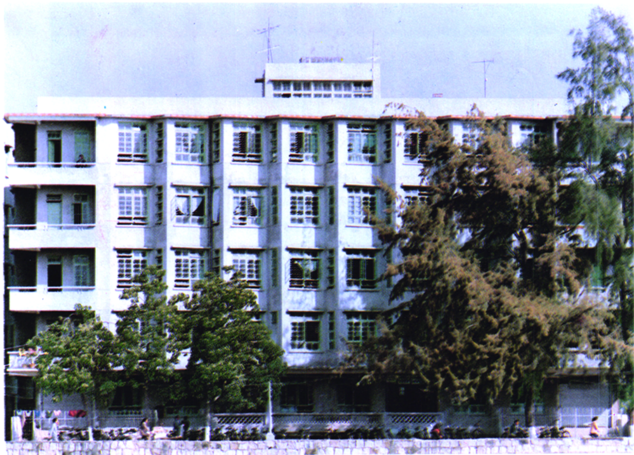
▲ 饒平縣稅務局辦公大樓