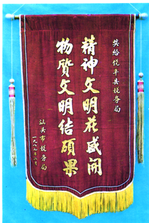
▲ 一九八七年汕头市税务局授予饶平县税务局为先进集体的奖旗。