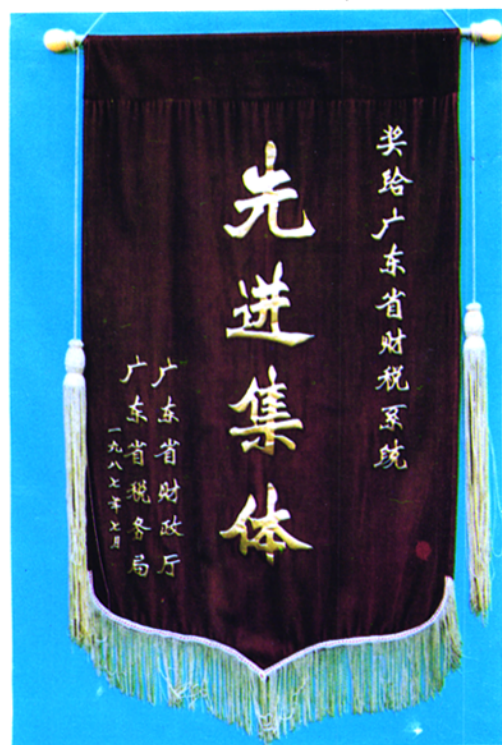
▲ 一九八七年广东省财政厅、广东省税务局授予饶平县税务局为先进集体的奖旗。