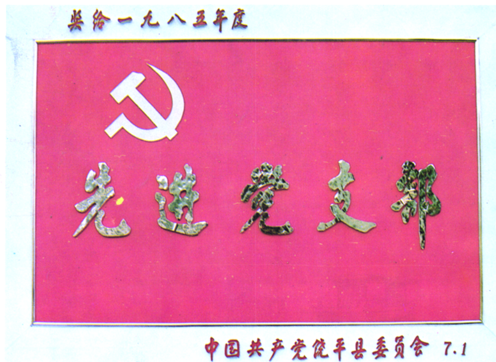
▲ 一九八五年中共饶平县委授予饶平县税务局为先进党支部的锦旗。