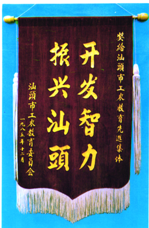
▲ 一九八五年汕头市工农教育委员会授予饶平县税务局为工农教育先进集体的奖旗。